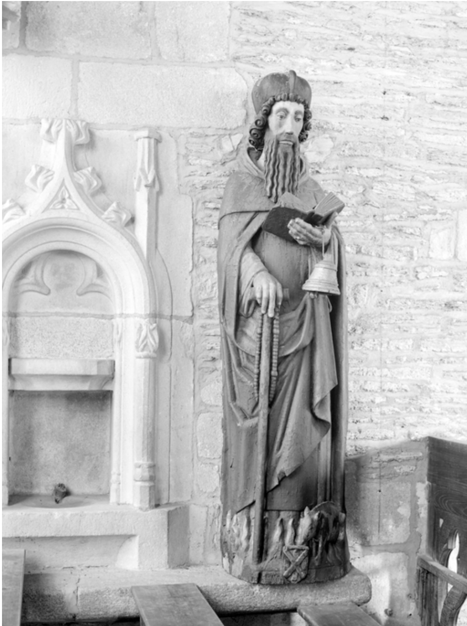
Statue : Saint Antoine (état en 1984)