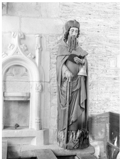
Statue : Saint Antoine (état en 1984)