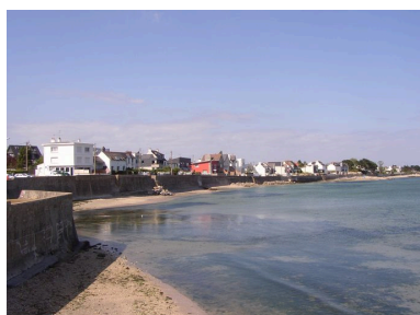
Vue générale du front balnéaire de la Nourriguel IVR53_20065606541NUCA