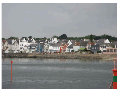
Partie centre-ouest du front balnéaire de la Nourriguel