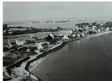
Vue du front balnéaire de la Nourriguel à la fin des années 1950