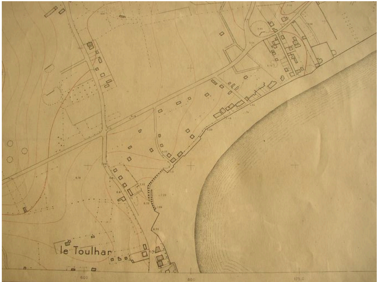
Plan du Ministère de la Reconstruction et de l'Urbanisme de la plage de la Nourriguel en 1946