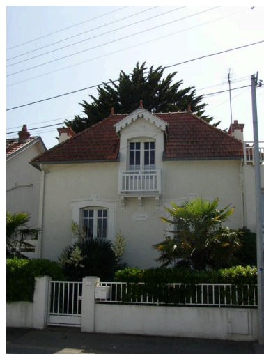
Maison de villégiature Les Algues IVR53_20065606547NUCA