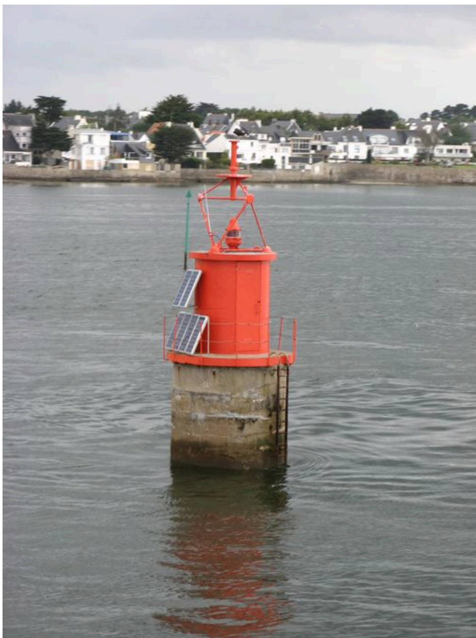
Feu de la Jument dans le chenal d'accès à la rade de Lorient face à La Nourriguel