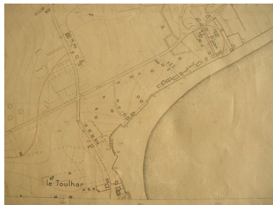
Plan du Ministère de la Reconstruction et de l'Urbanisme de la plage de la Nourriguel en 1946 IVR53_20075605632NUC