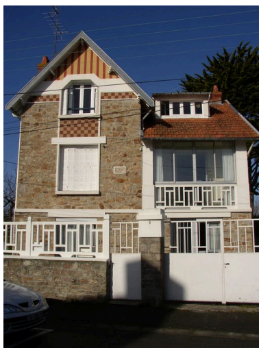
Maison de villégiature Les Glycines