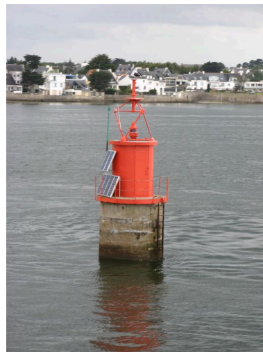
Feu de la Jument dans le chenal d'accès à la rade de Lorient face à La Nourriguel