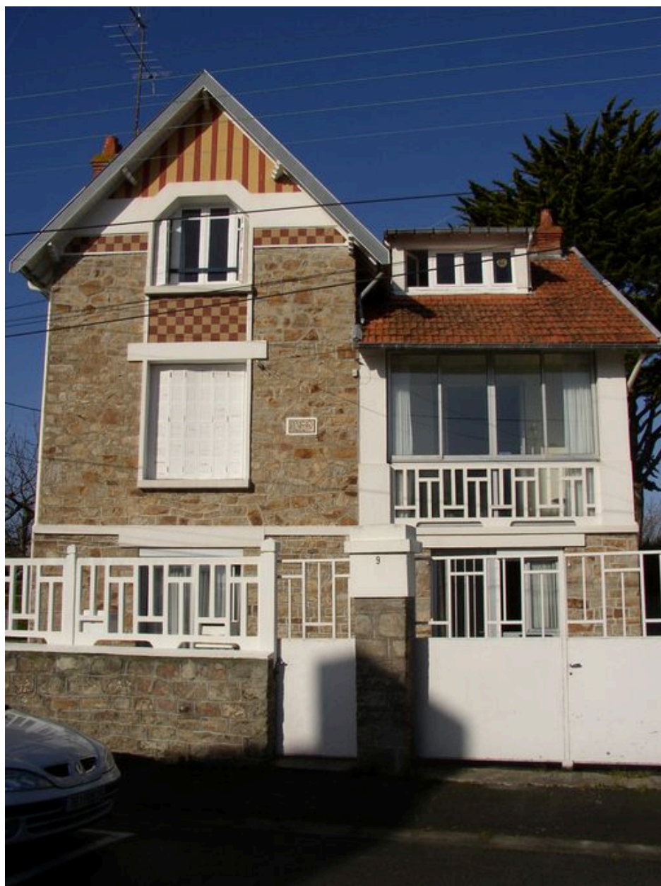
Maison de villégiature Les Glycines