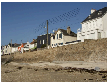
Digue du front balnéaire tardif de la Nourriguel IVR53_20065606543NUCA