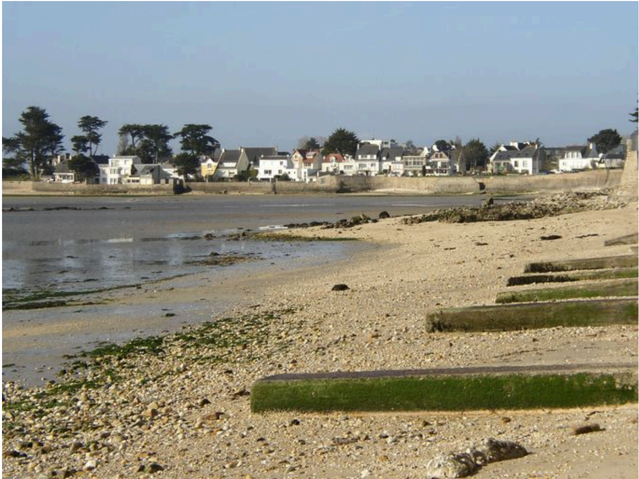
Partie orientale du front balnéaire de la Nourriguel