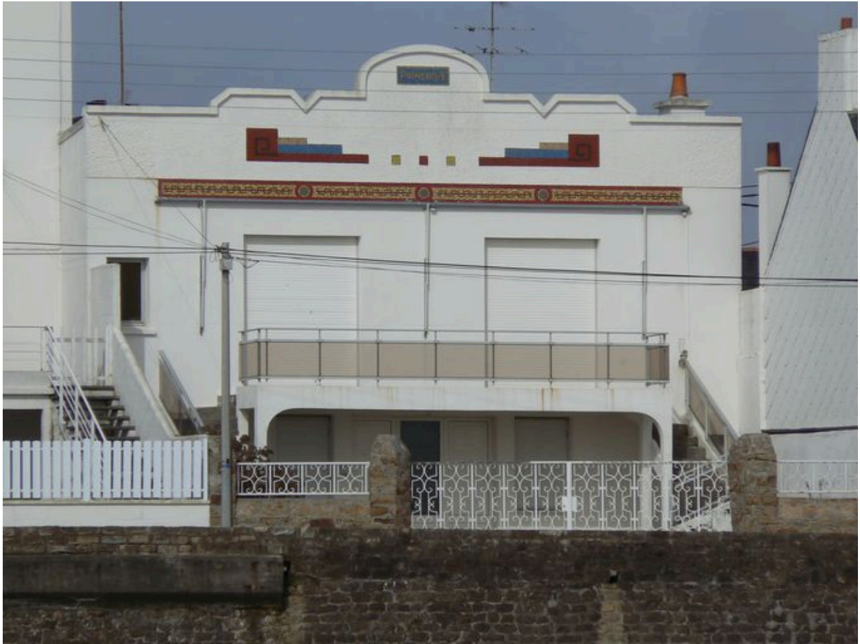
Maison de villégiature Primerose