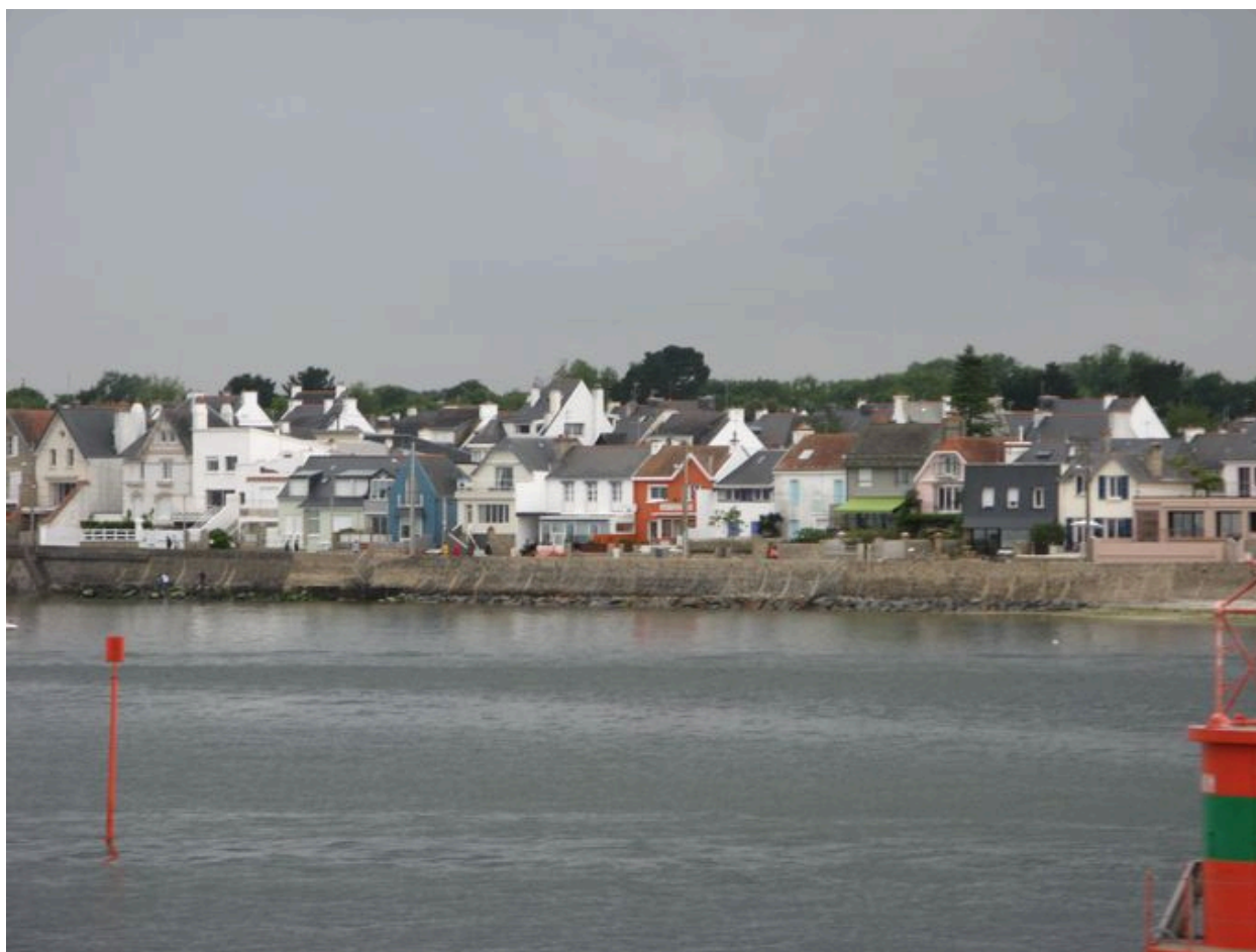
Partie centre-ouest du front balnéaire de la Nourriguel