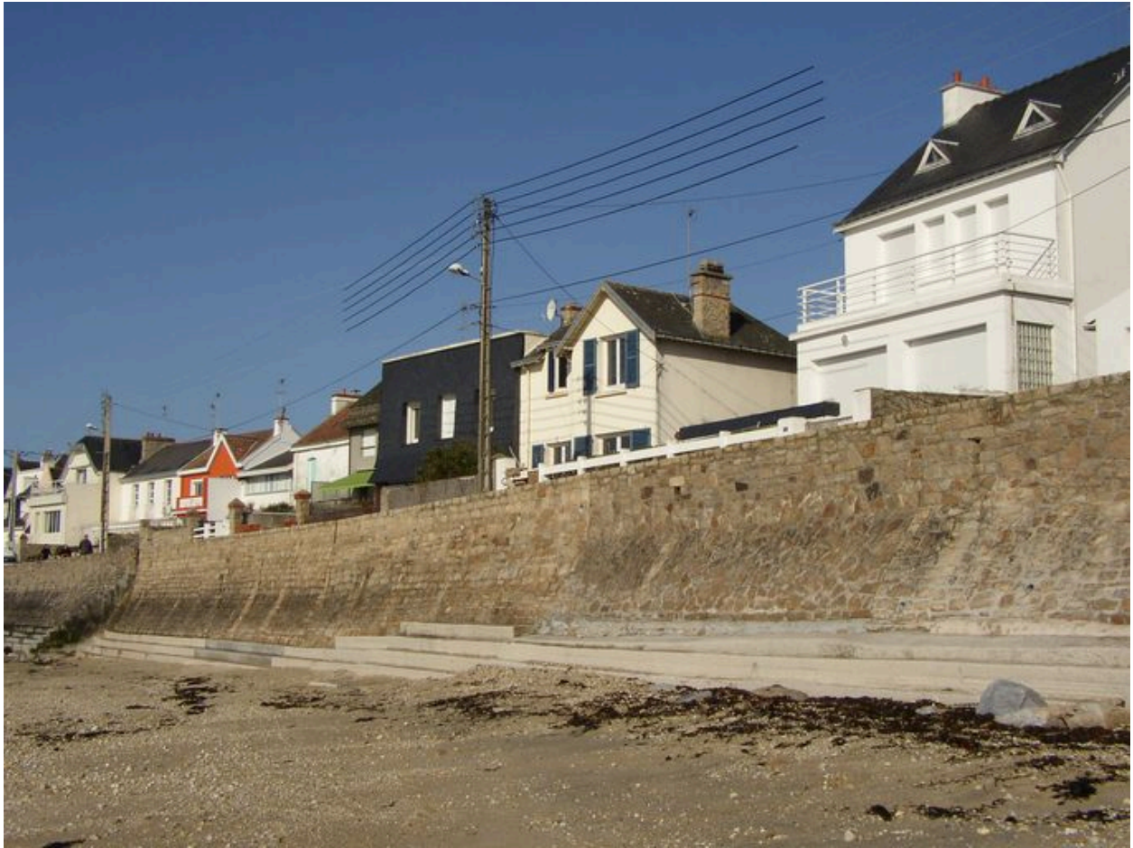
Digue du front balnéaire tardif de la Nourriguel