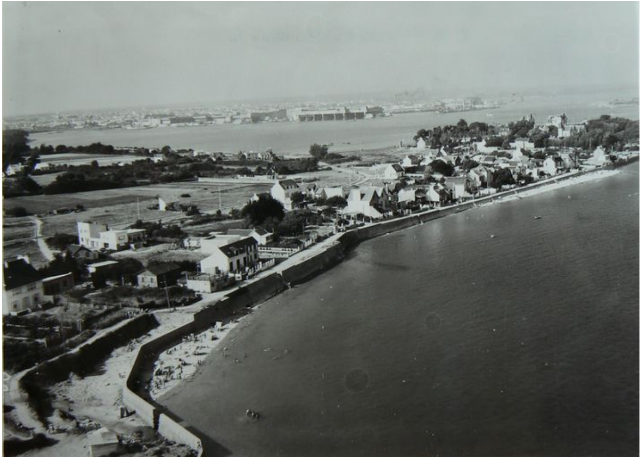
Vue du front balnéaire de la Nourriguel à la fin des années 1950