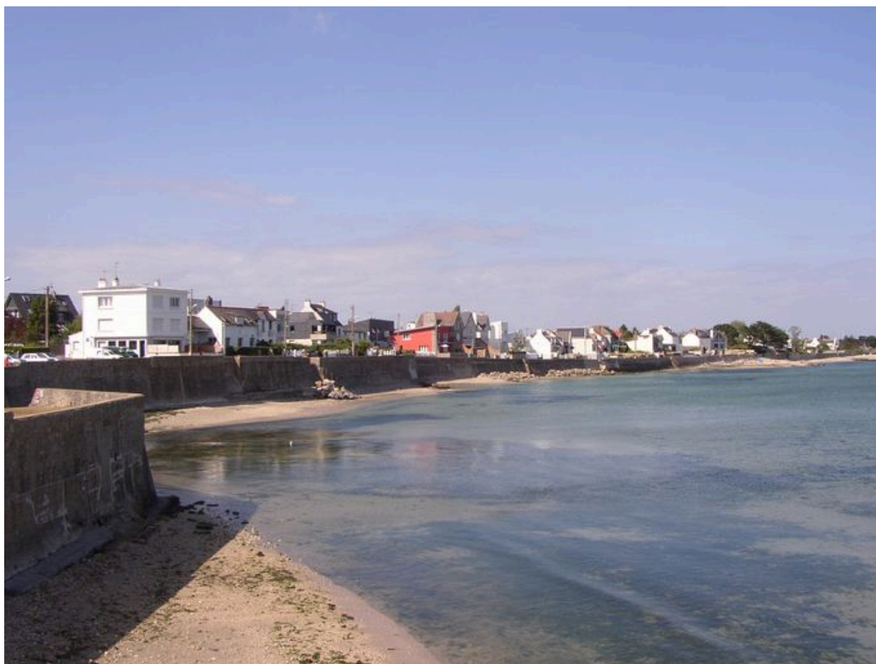
Vue générale du front balnéaire de la Nourriguel