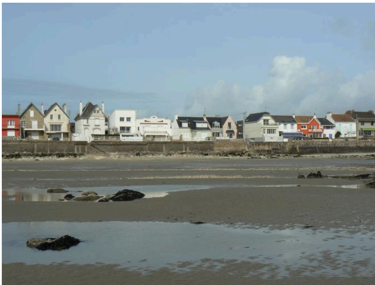
Partie centrale du front balnéaire de la Nourriguel