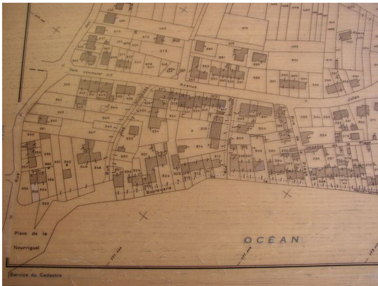
Plan cadastral de la plage de la Nourriguel en 1968