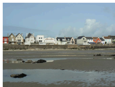
Partie centrale du front balnéaire de la Nourriguel