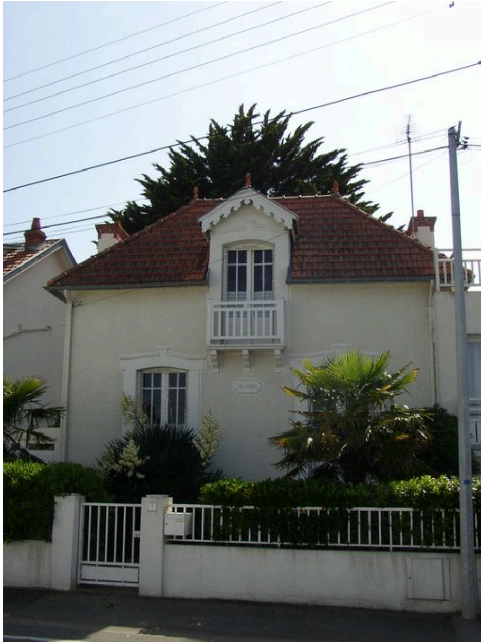
Maison de villégiature Les Algues