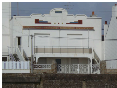
Maison de villégiature Primerose IVR53_20075605639NUCA