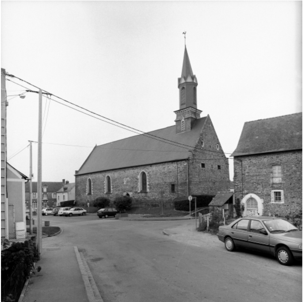
Elévation Sud-Est : vue générale