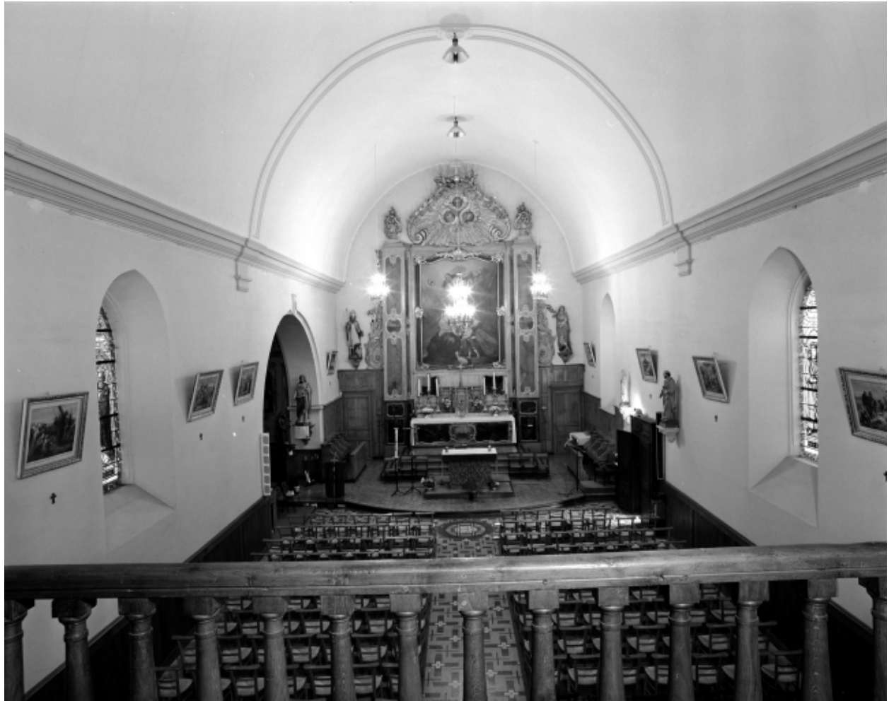
Intérieur : vue générale vers le chœur.