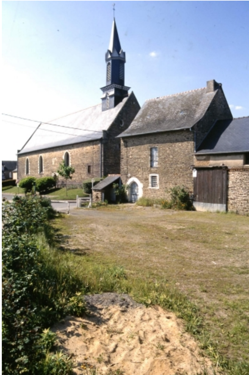
Vue générale prise du sud-ouest.