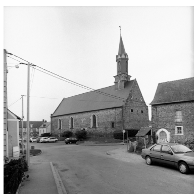
Elévation Sud-Est : vue générale IVR53_19933500467X