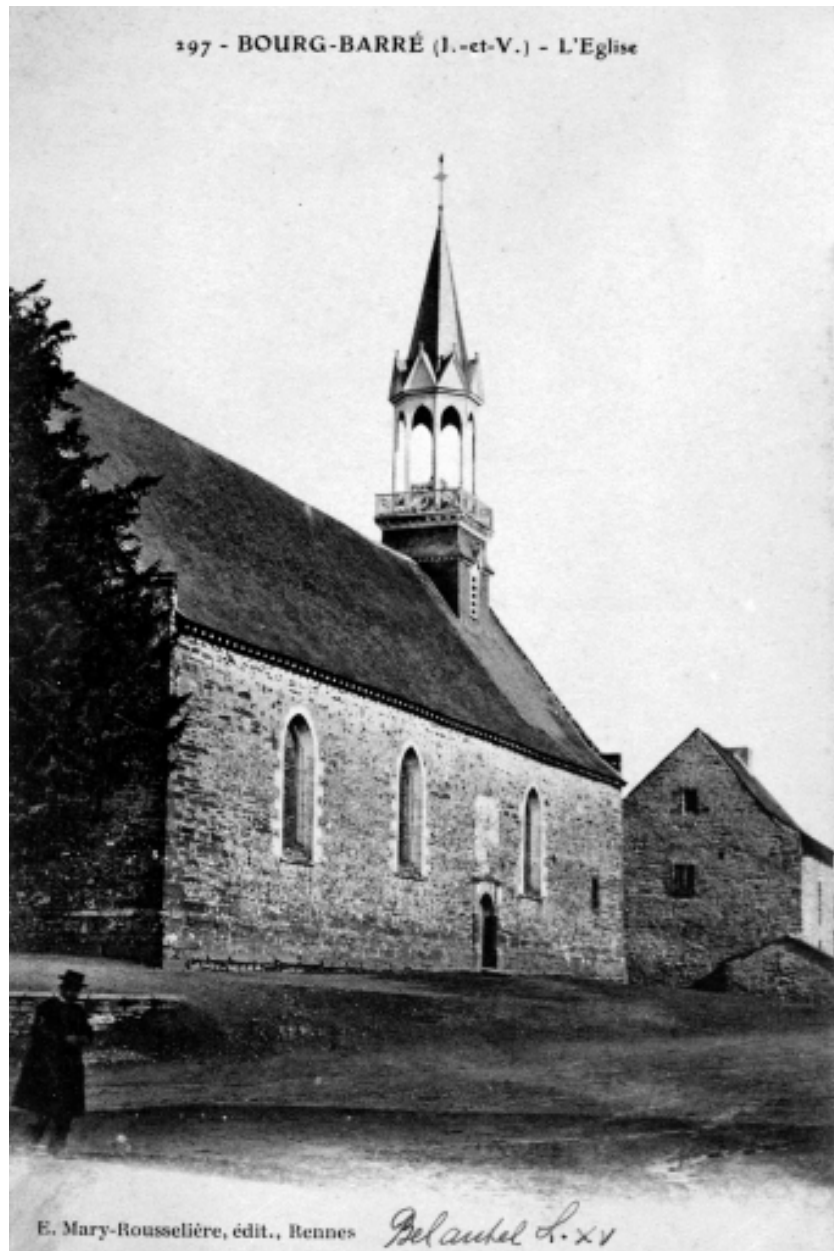
Elévation Sud : vue générale (Carte postale ancienne, AD35 : 6Fi)