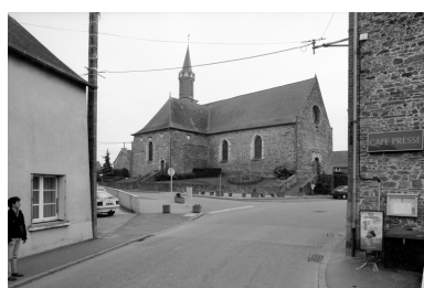
Elévation Nord-Ouest : vue générale IVR53_19933500469X