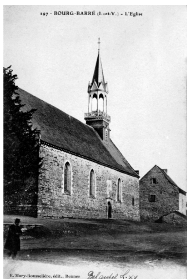
Elévation Sud : vue générale (Carte postale ancienne, AD35 : 6Fi) IVR53_19933500525X