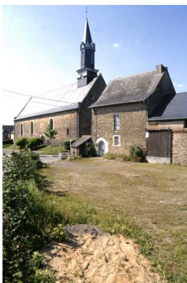
Vue générale prise du sud-ouest. IVR53_19943502492ZA