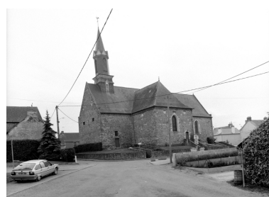
Elévation Nord-Est : vue générale