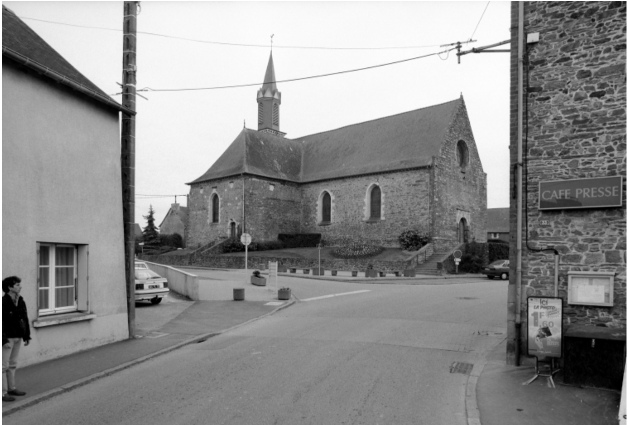
Elévation Nord-Ouest : vue générale