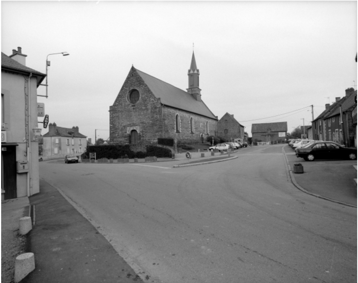
Elévation Sud-Ouest : vue générale