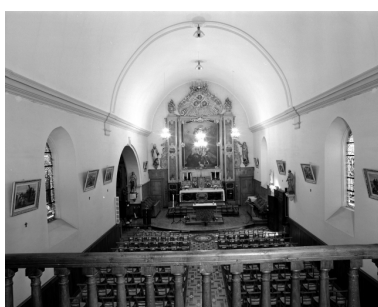
Intérieur : vue générale vers le chœur. IVR53_19933500466X