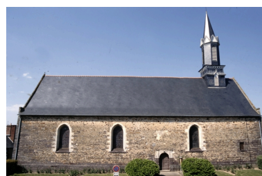
Elévation sud : vue générale. IVR53_19943502493ZA