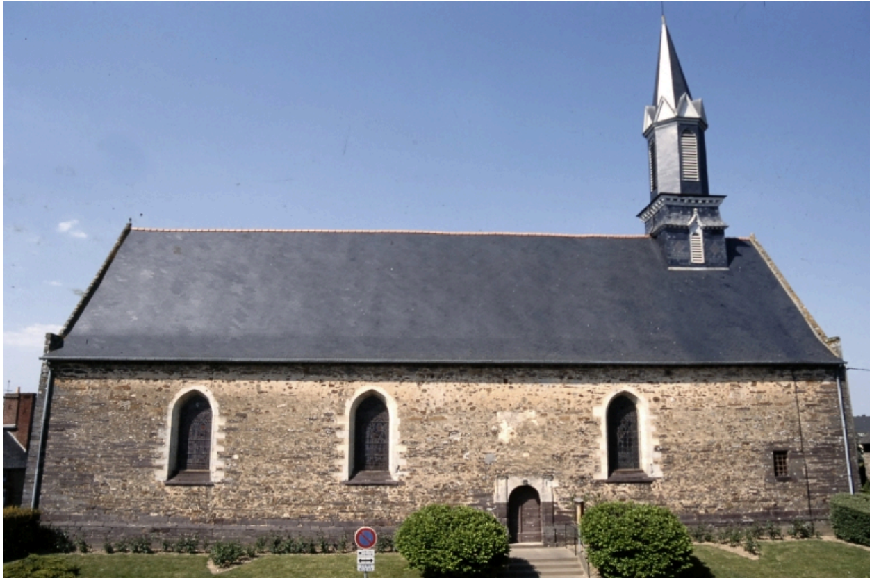
Elévation sud : vue générale.