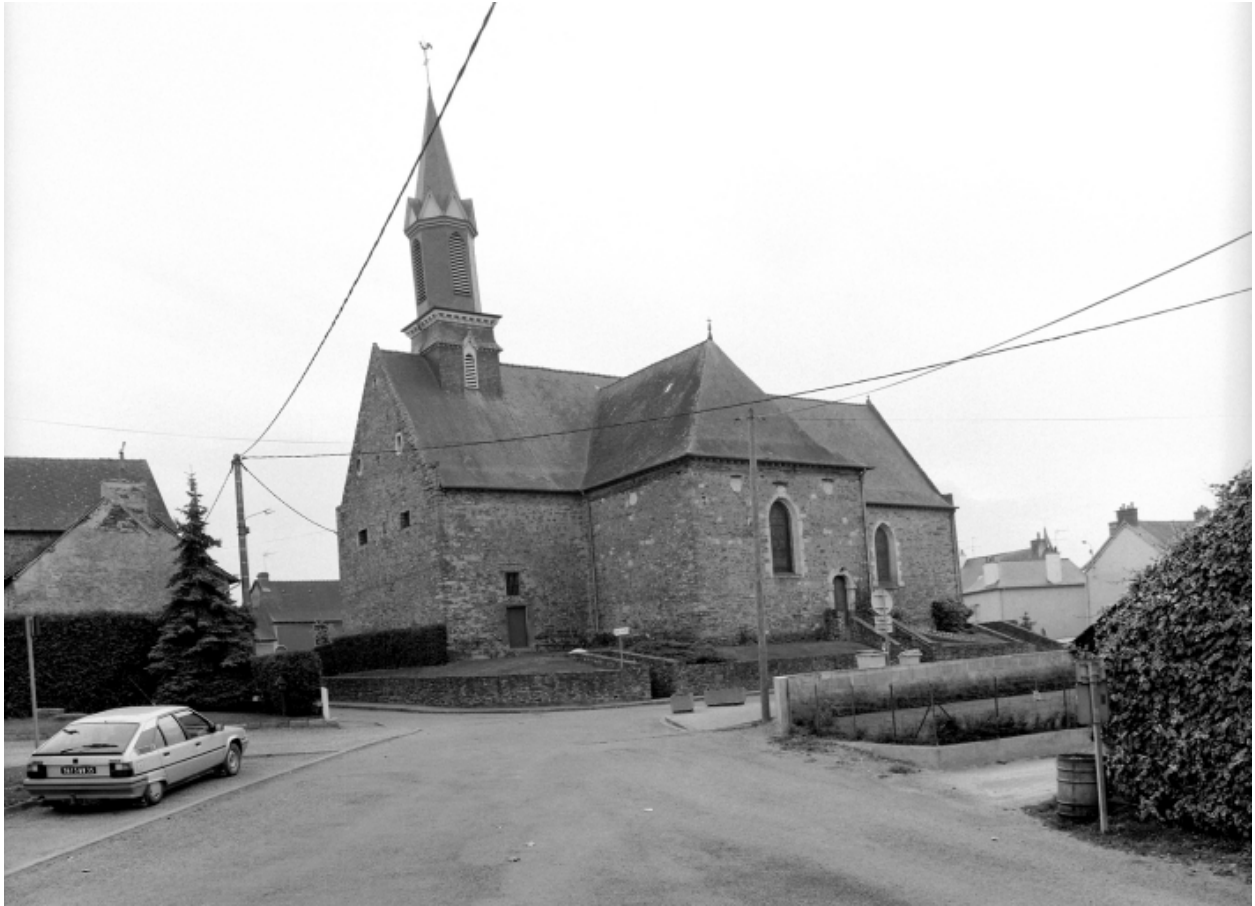
Elévation Nord-Est : vue générale