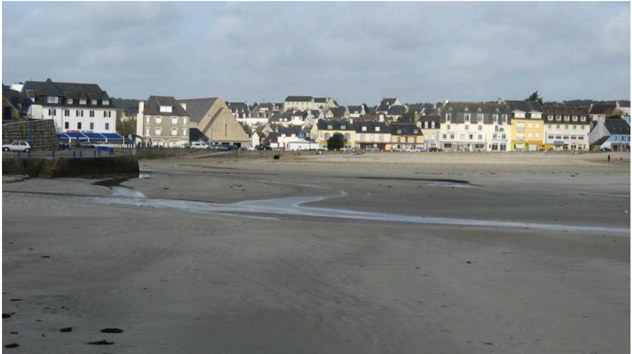
Vue générale du front portuaire de Morgat