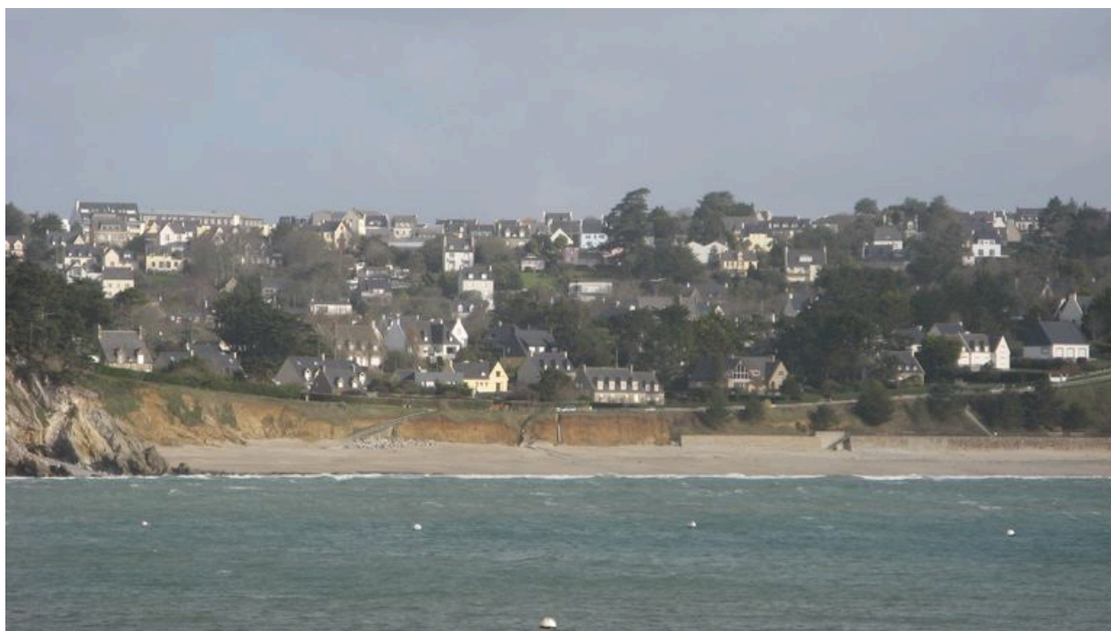
Vue générale du quartier balnéaire du Portzic