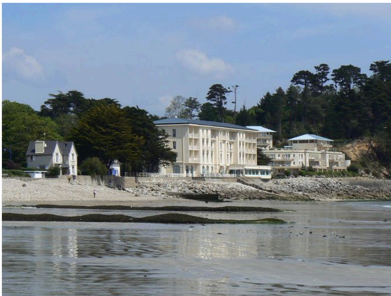
Vue générale du quartier des hôtels à Morgat