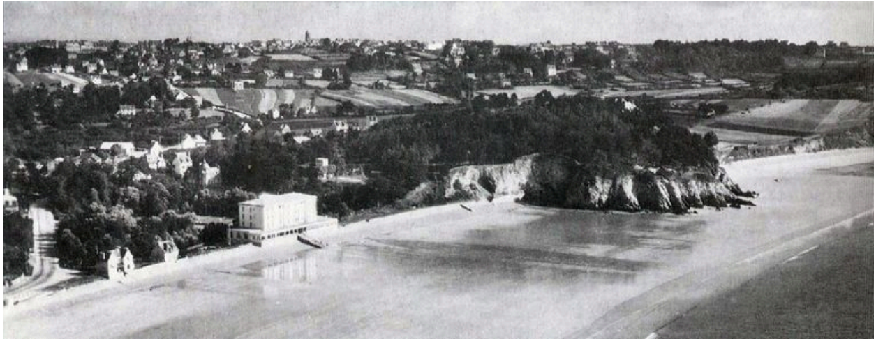
Vue aérienne ancienne du quartier des hôtels à Morgat