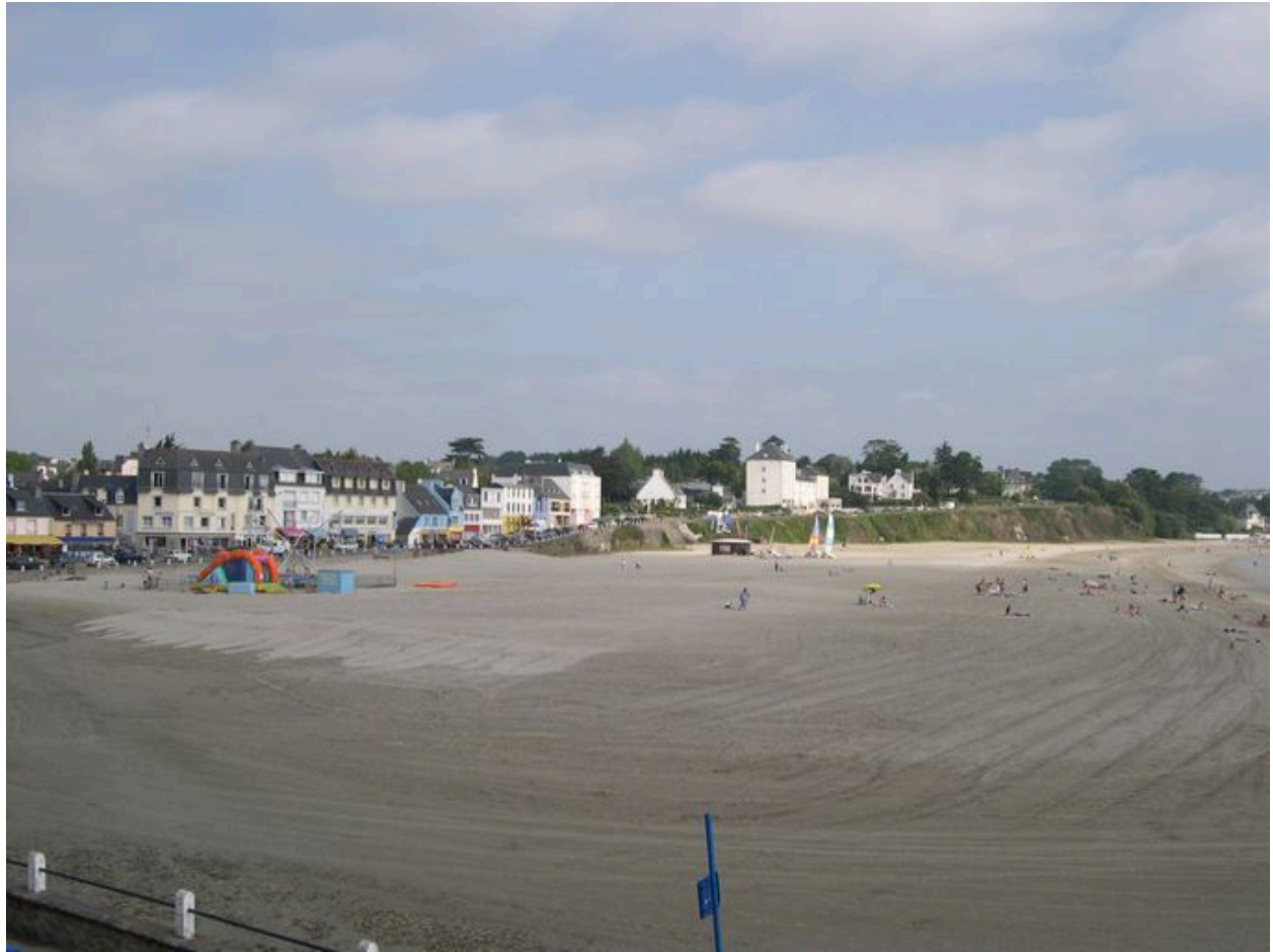
Plage de Morgat