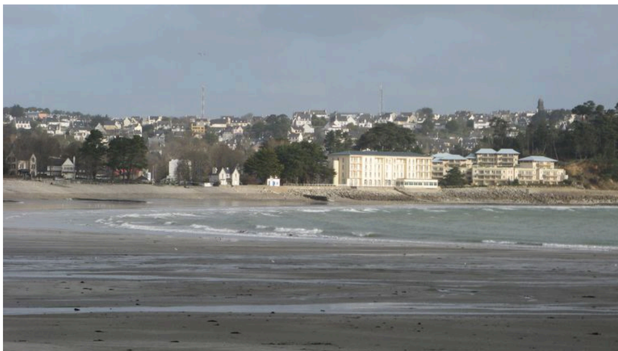
Vue générale de Morgat