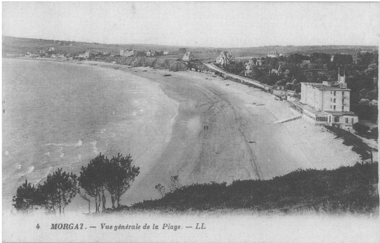
Carte postale : Vue générale de la plage de Morgat