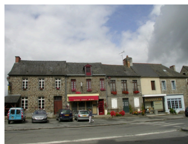
Maisons du côté ouest de la Place IVR53_20053518296NUCA