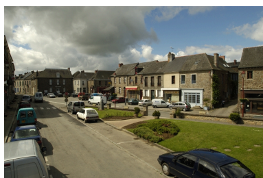
Vue nord-est de la Place IVR53_20053501473NUCA