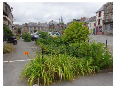
Vue est, nord et ouest de la place