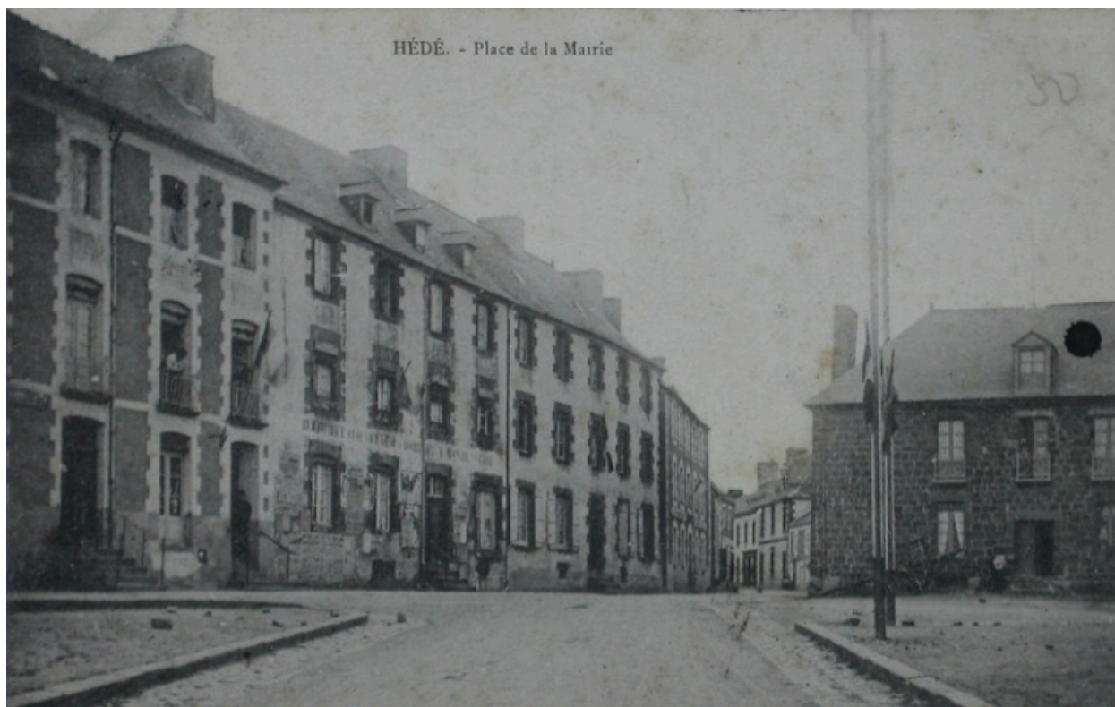
Place de la Mairie sur une carte postale ancienne