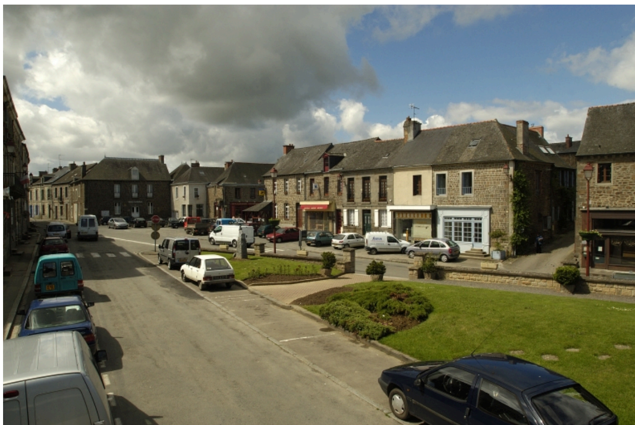
Vue nord-est de la Place