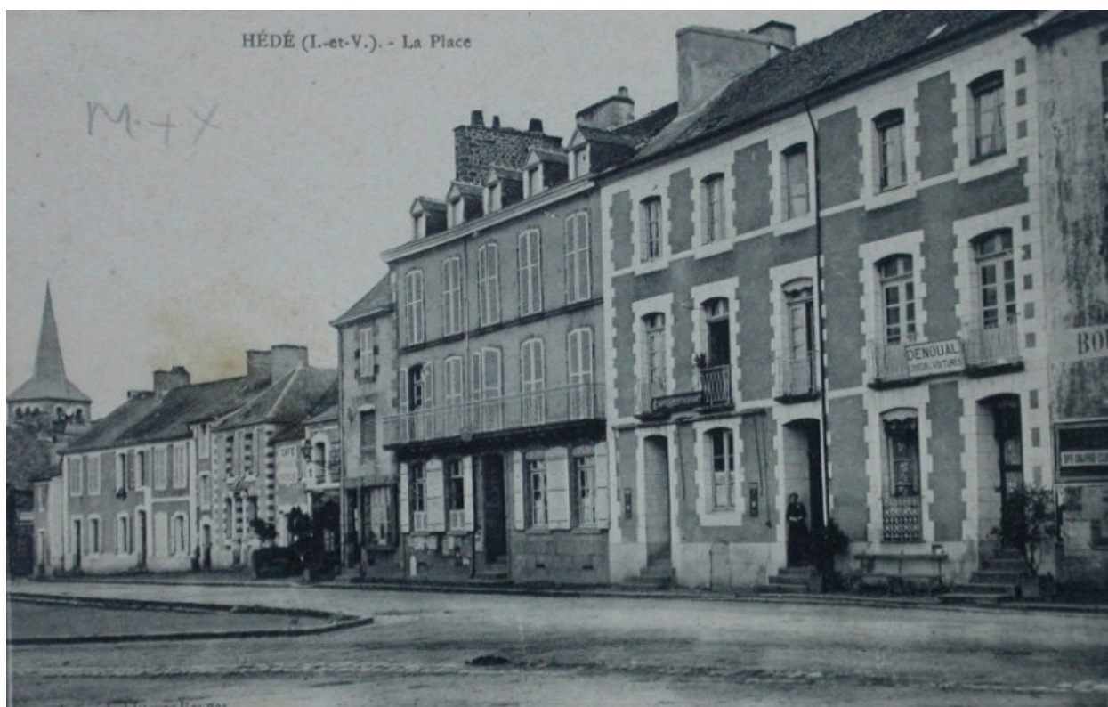
Face Est de la place