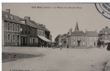
La place sur une carte postale ancienne