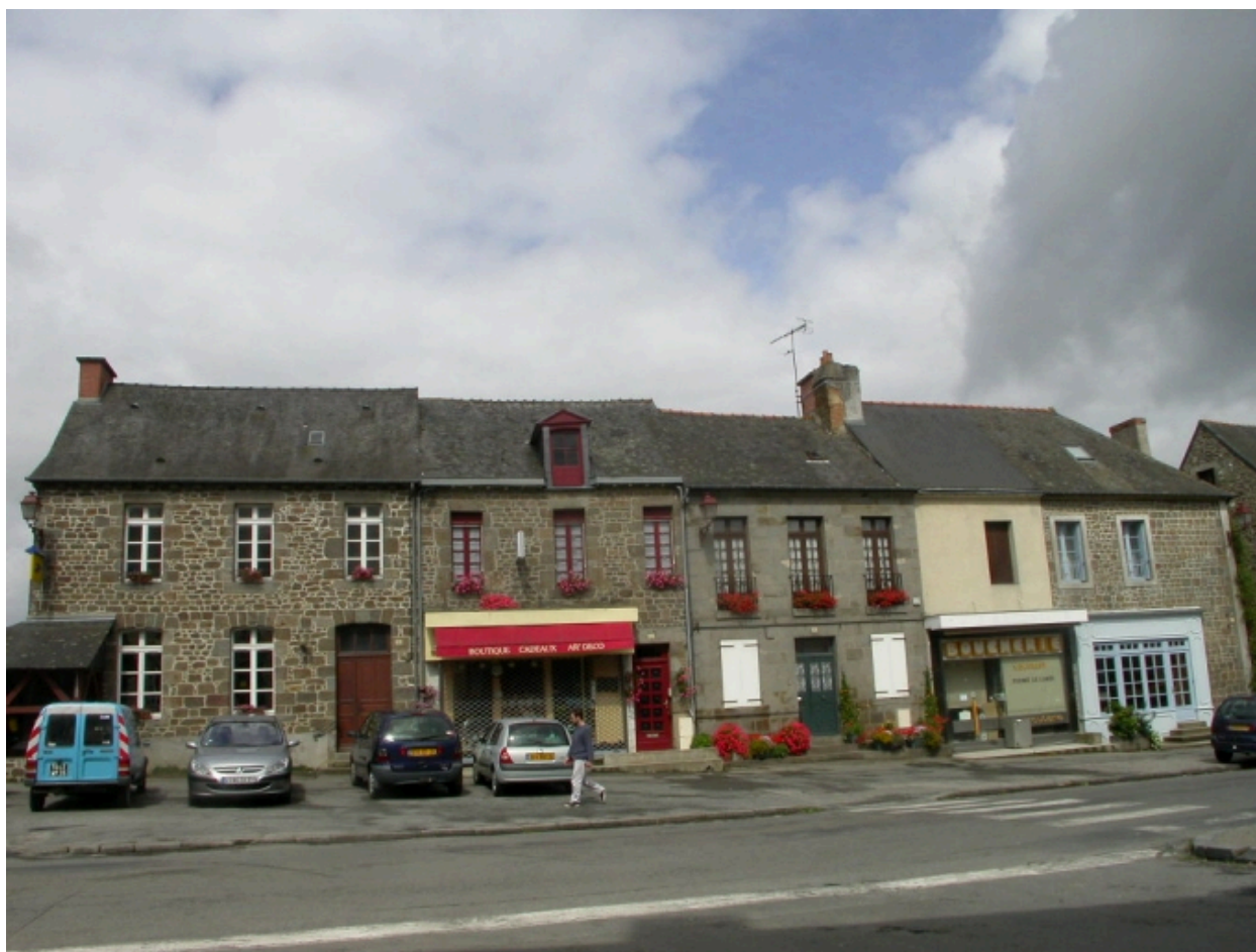
Maisons du côté ouest de la Place