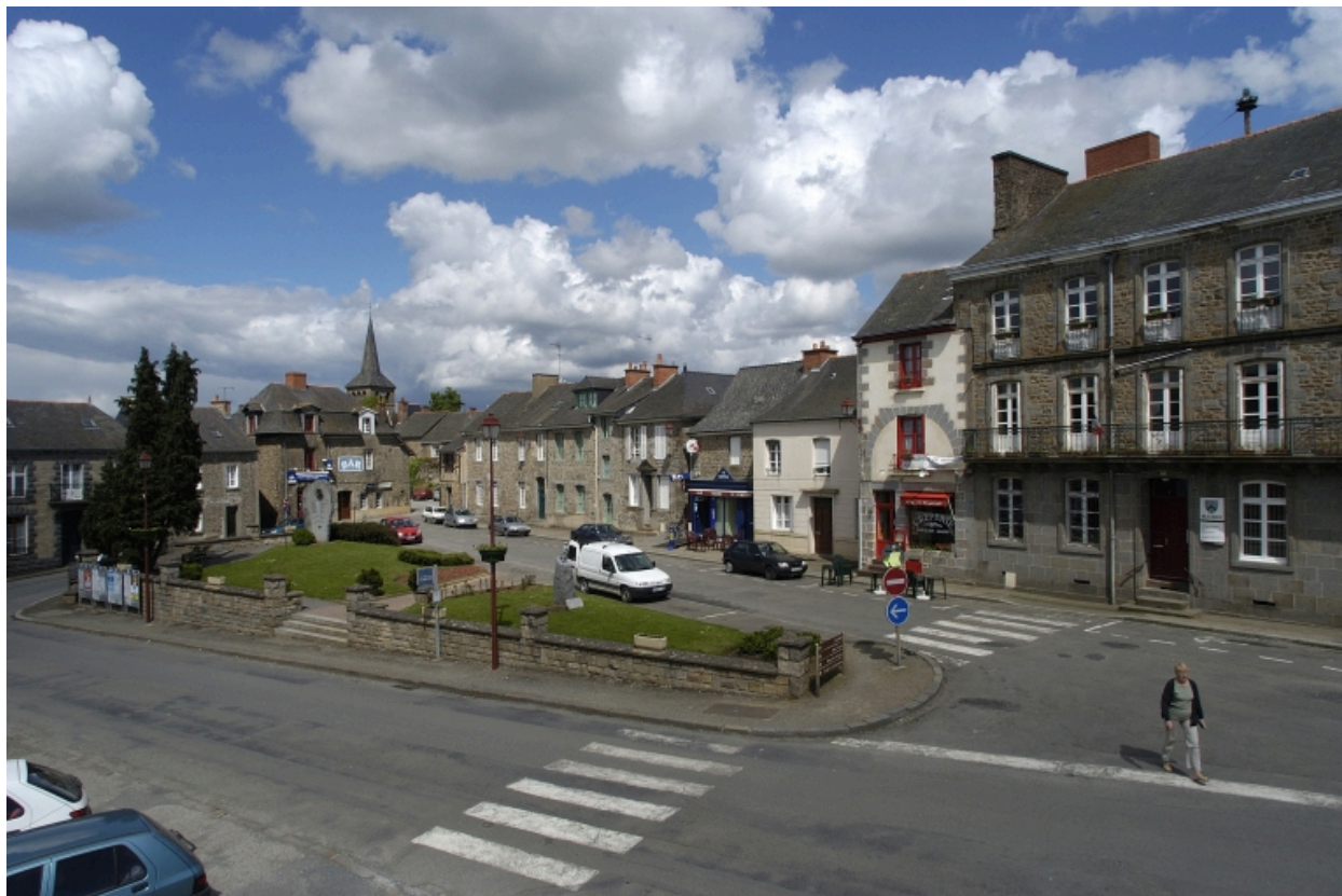
Vue générale sud-ouest