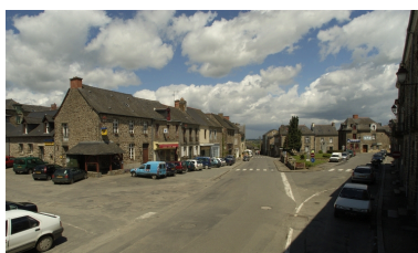
Vue sud-est IVR53_20053501487NUCA