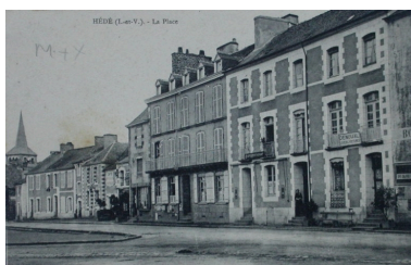
Face Est de la place IVR53_20053519242NUCA