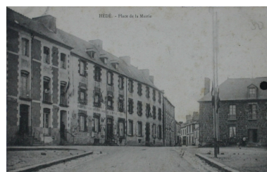
Place de la Mairie sur une carte postale ancienne IVR53_20053519243NUCA