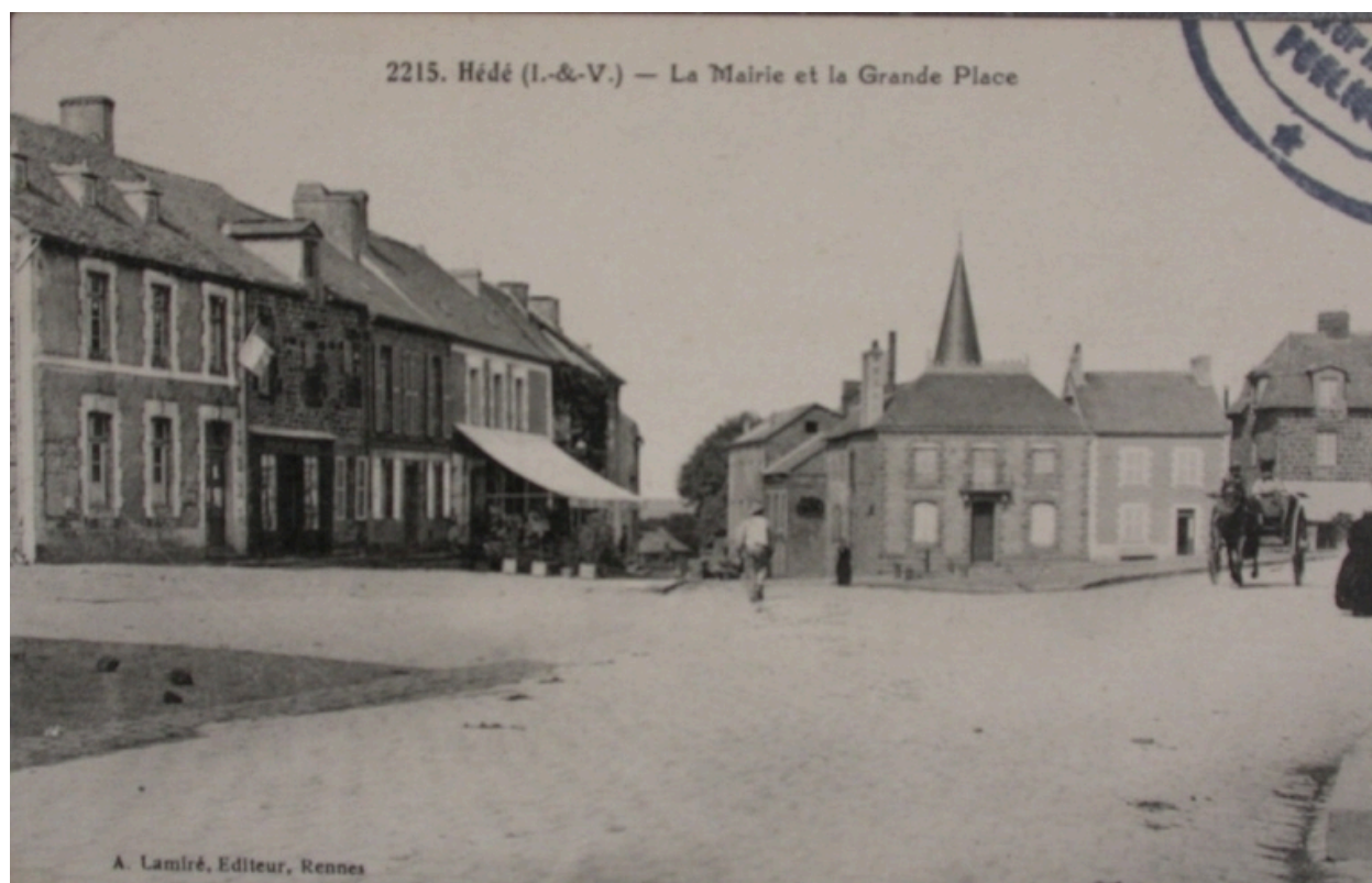
La place sur une carte postale ancienne