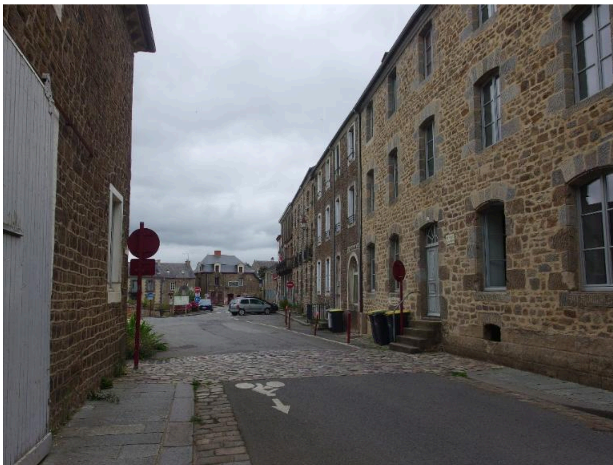
Entrée sud de la place