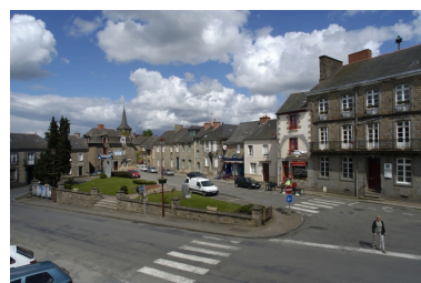
Vue générale sud-ouest IVR53_20053501703NUCA