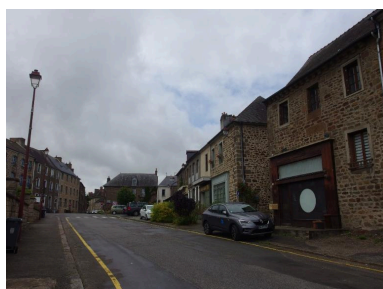
Vues ouest et sud de la place IVR53_20253510161NUCA