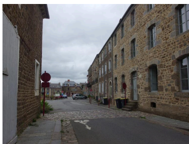
Entrée sud de la place IVR53_20253510123NUCA