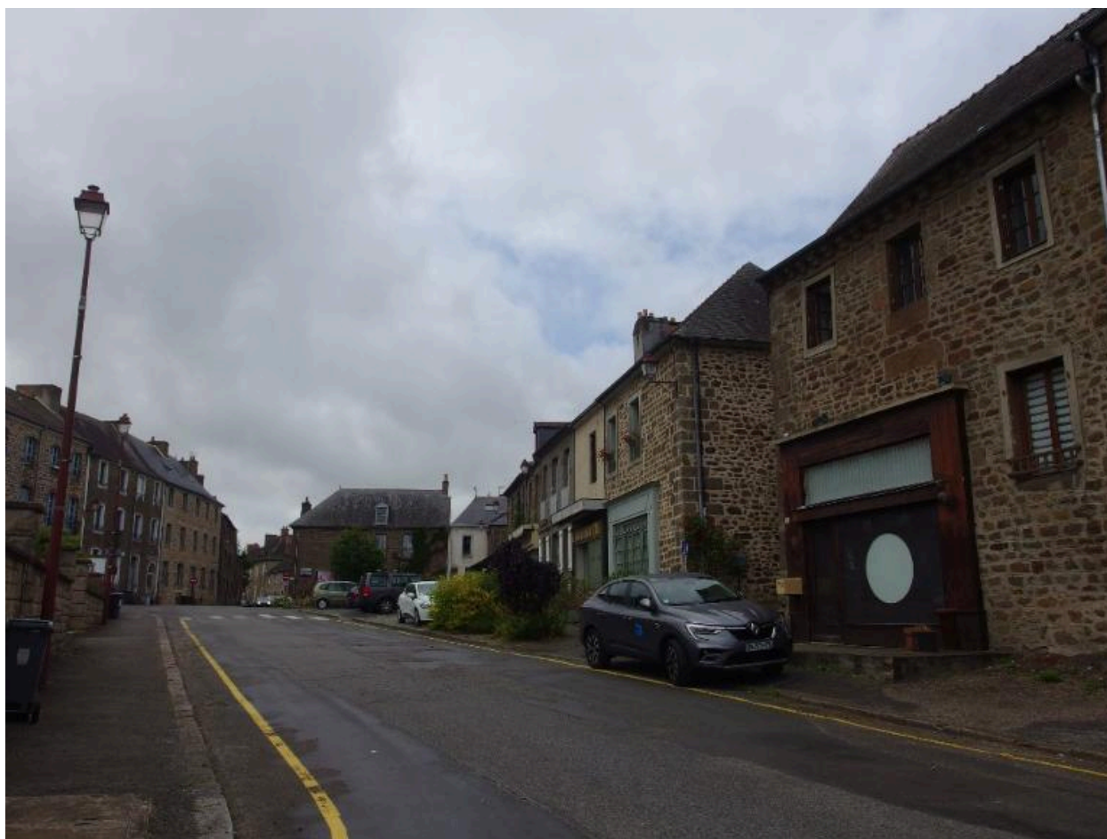
Vues ouest et sud de la place