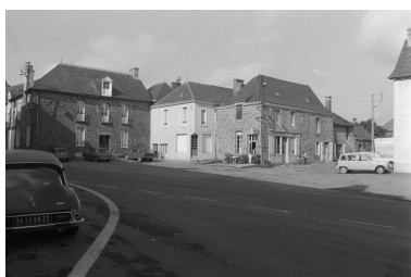
Le sud de la place en 1975