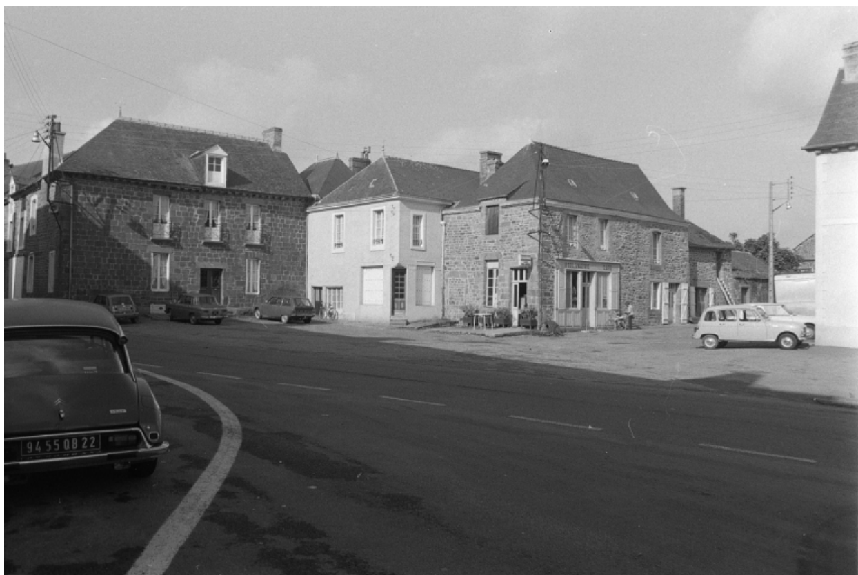
Le sud de la place en 1975