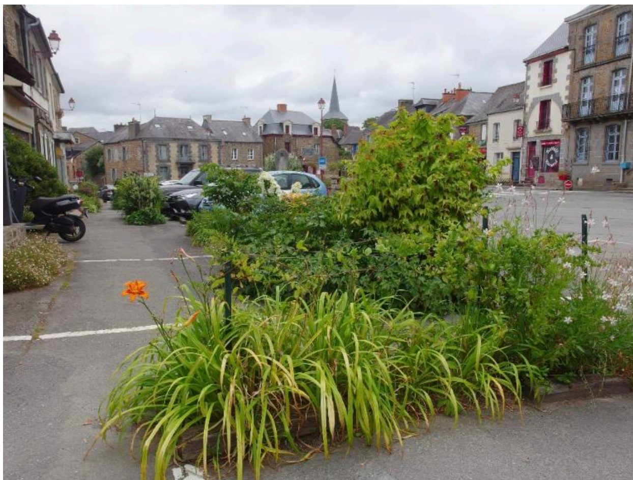
Vue est, nord et ouest de la place