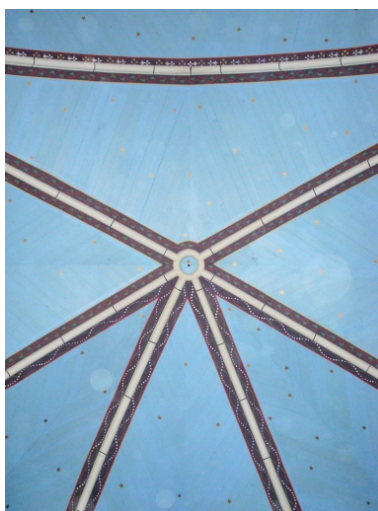
Landivisiau, chapelle Notre-Dame-de-Lourdes : lambris de couvrement dans le choeur, détail IVR53_20082906516NUCA