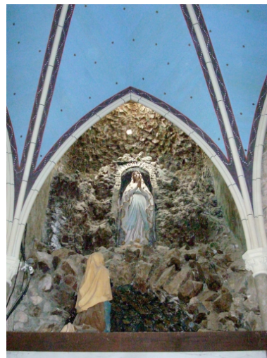
Landivisiau, chapelle Notre-Dame-de-Lourdes : représentation de la grotte dans le chœur, détail IVR53_20082906514NUCA