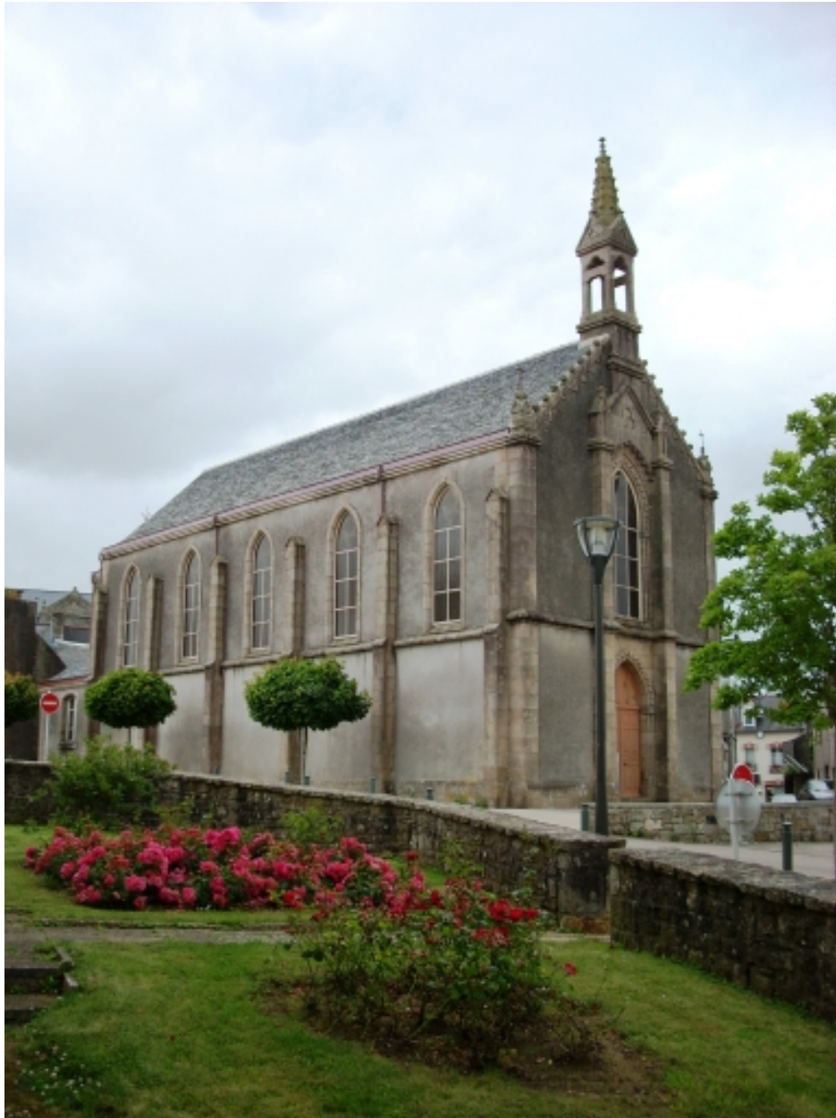
Landivisiau, chapelle Notre-Dame-de-Lourdes : vue générale nord-ouest