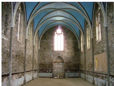
Landivisiau, chapelle Notre-Dame-de-Lourdes : vue axiale ouest IVR53_20082906513NUCA