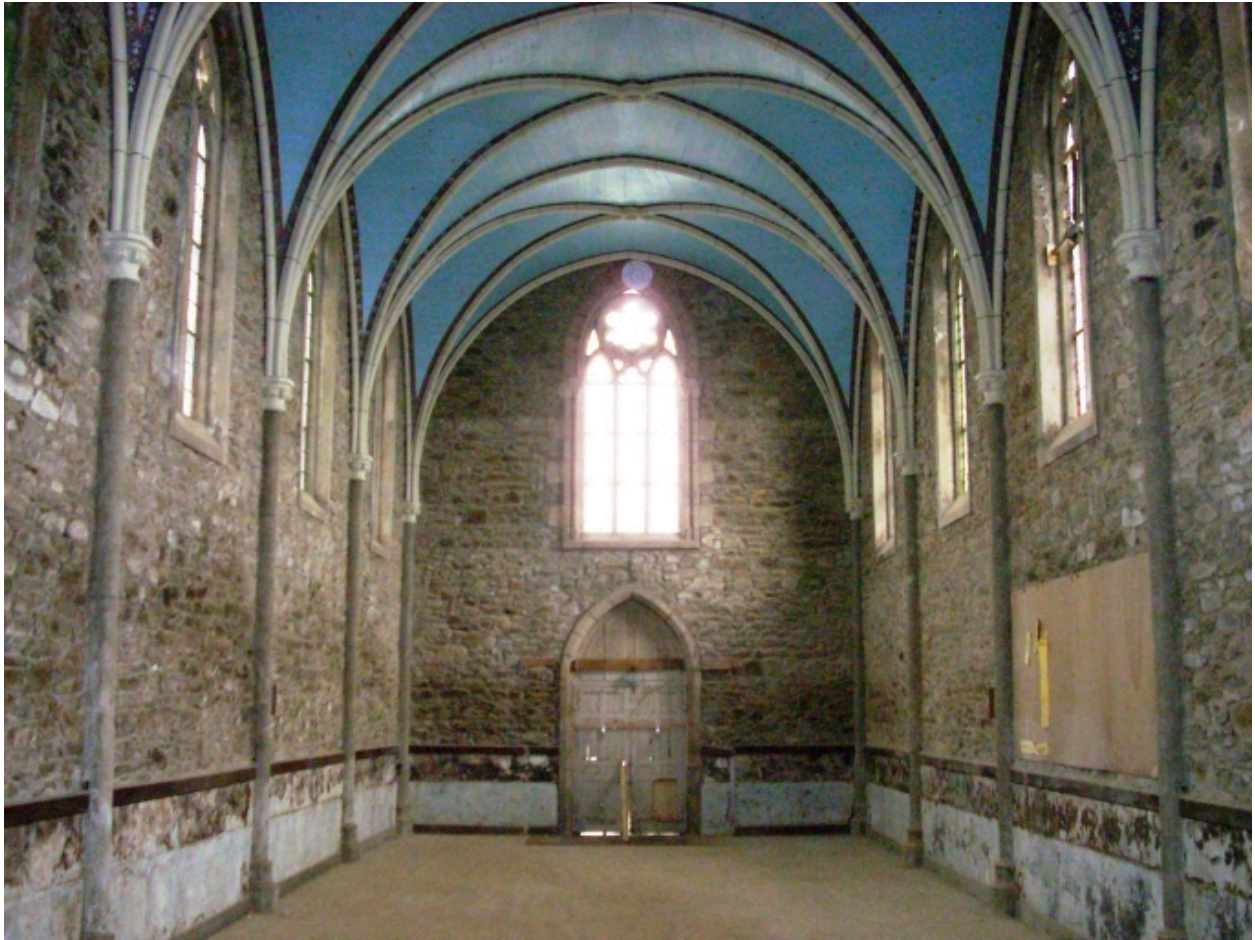
Landivisiau, chapelle Notre-Dame-de-Lourdes : vue axiale ouest