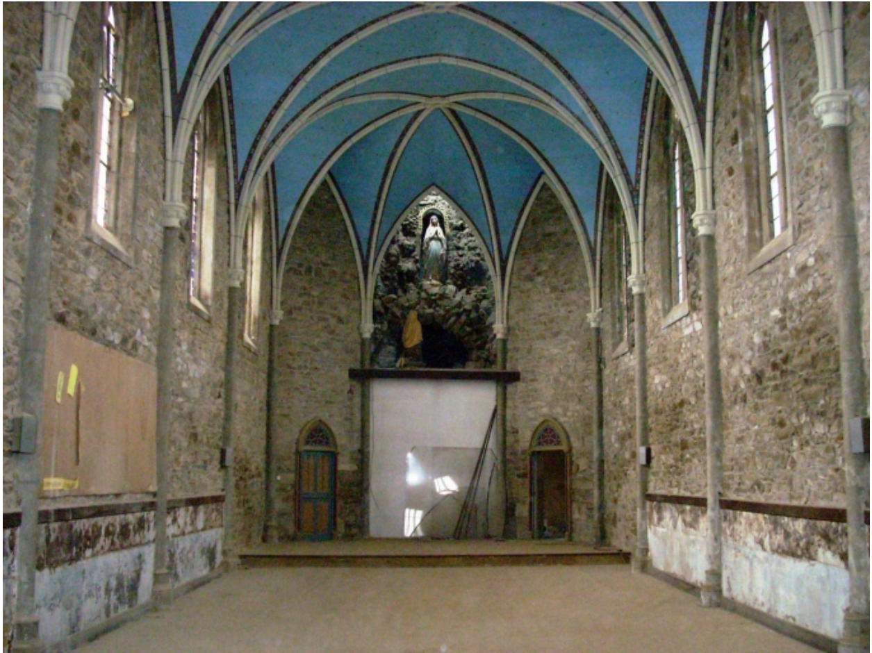
Landivisiau, chapelle Notre-Dame-de-Lourdes : vue axiale est