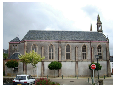
Landivisiau, chapelle Notre-Dame-de-Lourdes : élévation nord IVR53_20082906511NUCA