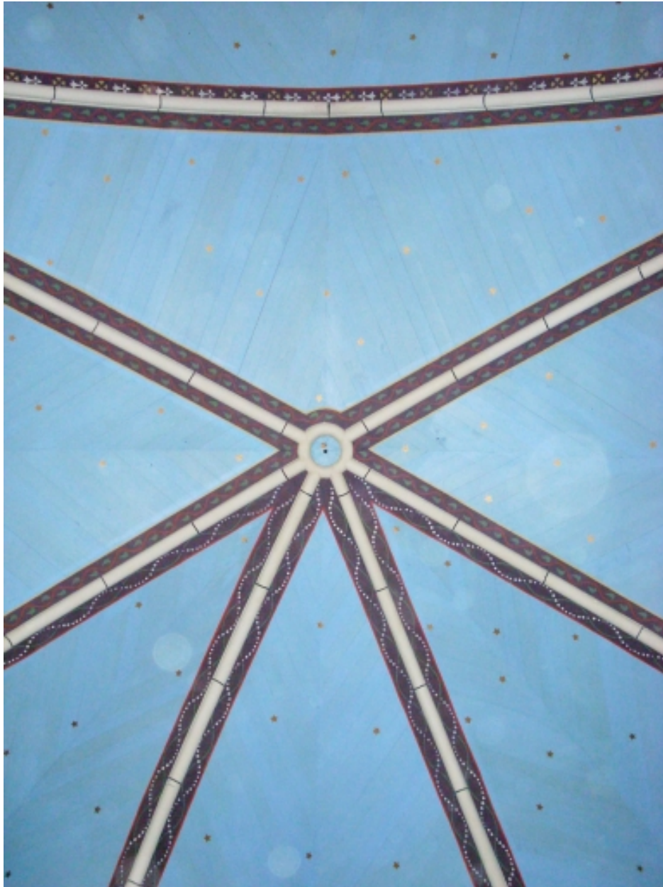
Landivisiau, chapelle Notre-Dame-de-Lourdes : lambris de couverture dans le chœur, détail