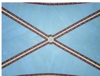
Landivisiau, chapelle Notre-Dame-de-Lourdes : lambris de couvrement dans la nef, détail