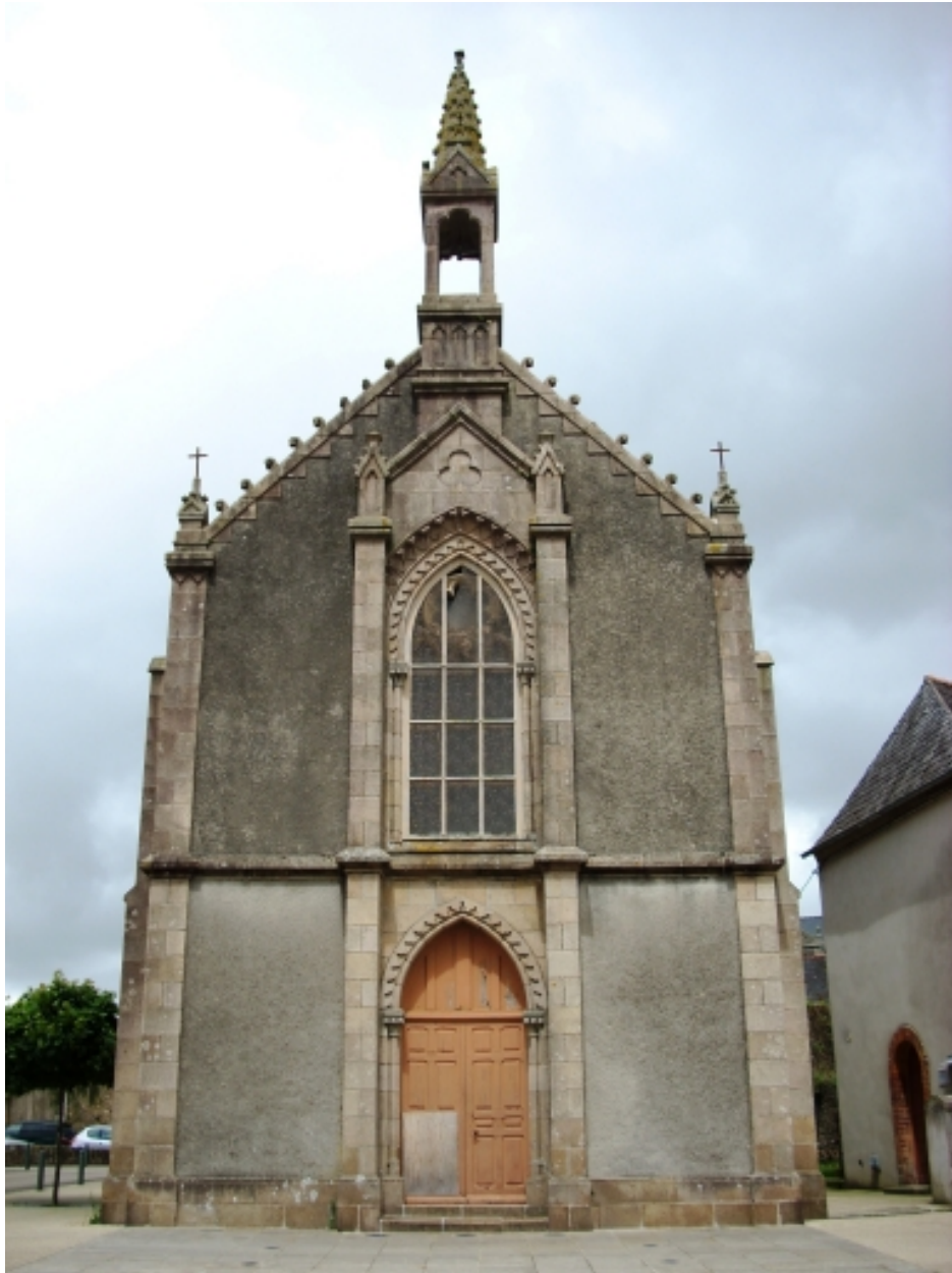
Landivisiau, chapelle Notre-Dame-de-Lourdes : élévation ouest