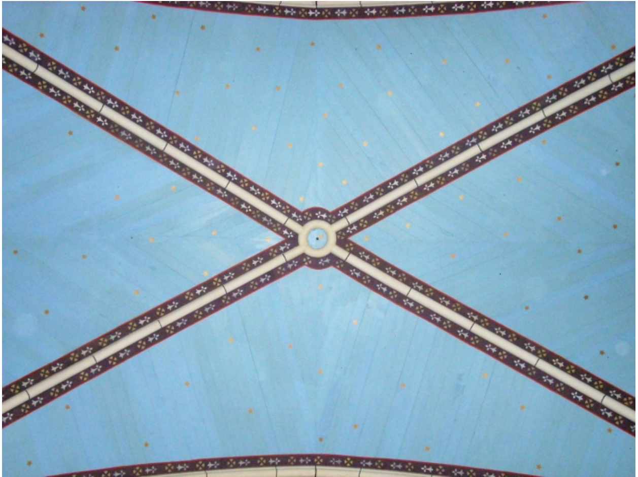
Landivisiau, chapelle Notre-Dame-de-Lourdes : lambris de couverture dans la nef, détail