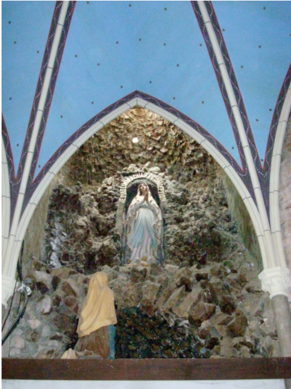
Landivisiau, chapelle Notre-Dame-de-Lourdes : représentation de la grotte dans le chœur, détail