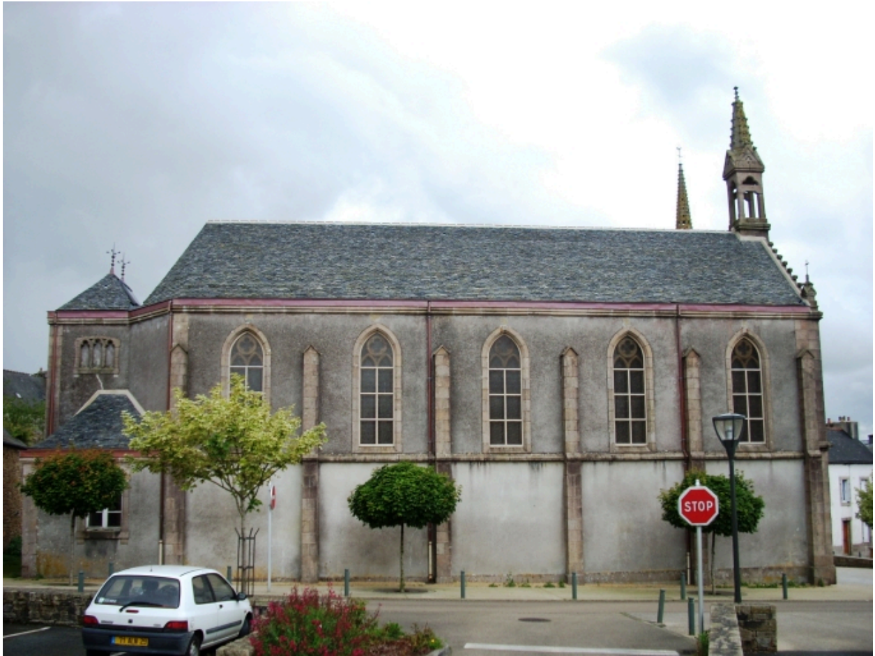
Landivisiau, chapelle Notre-Dame-de-Lourdes : élévation nord