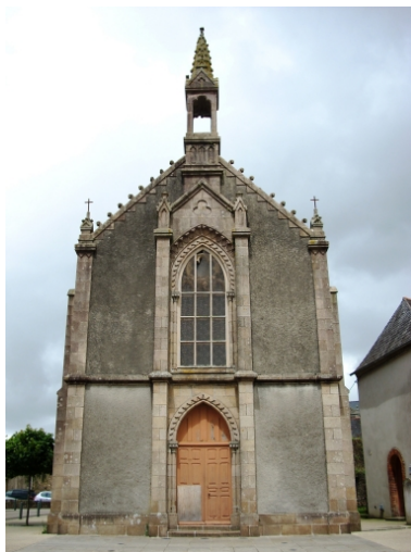
Landivisiau, chapelle Notre-Dame-de-Lourdes : élévation ouest