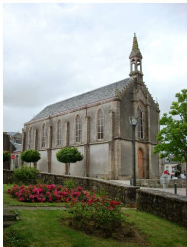
Landivisiau, chapelle Notre-Dame-de-Lourdes : vue générale nord-ouest IVR53_20082906509NUCA