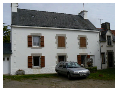
Ancienne maison de pêcheur de l'écart de la Grange