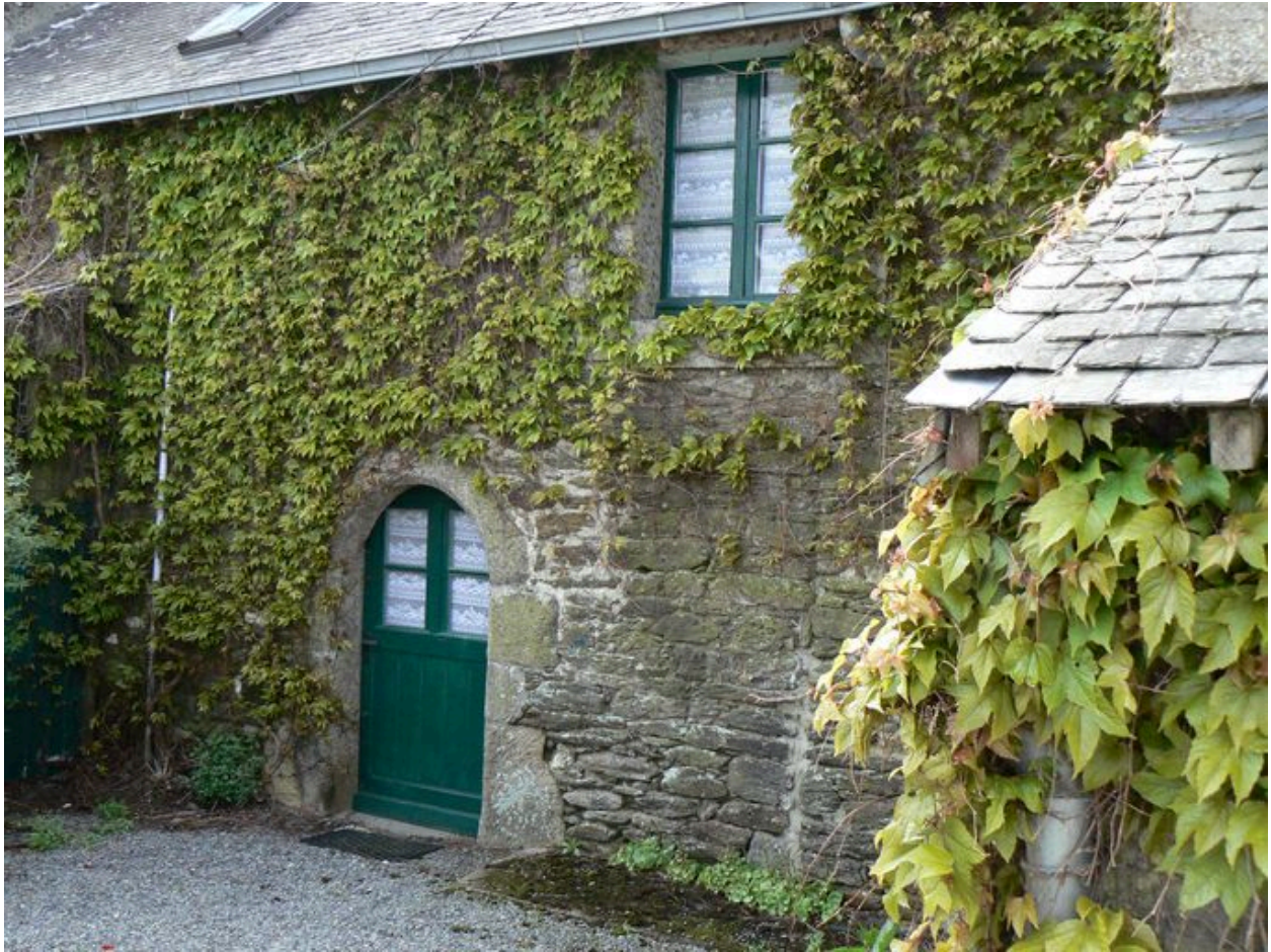
Façade d'une ancienne maison de paysan de l'écart de la Grange