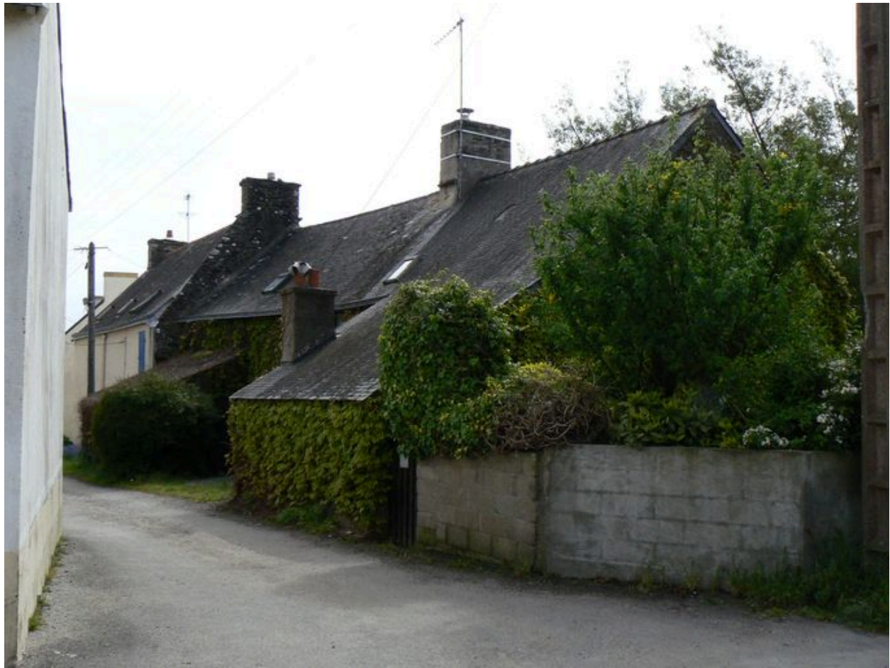
Rue de l'écart de la Grange