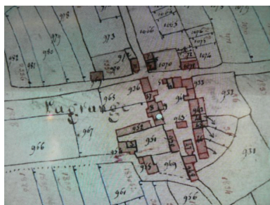
Plan cadastral napoléonien de l'écart de la Grange de 1823 IVR53_20082908619NUC