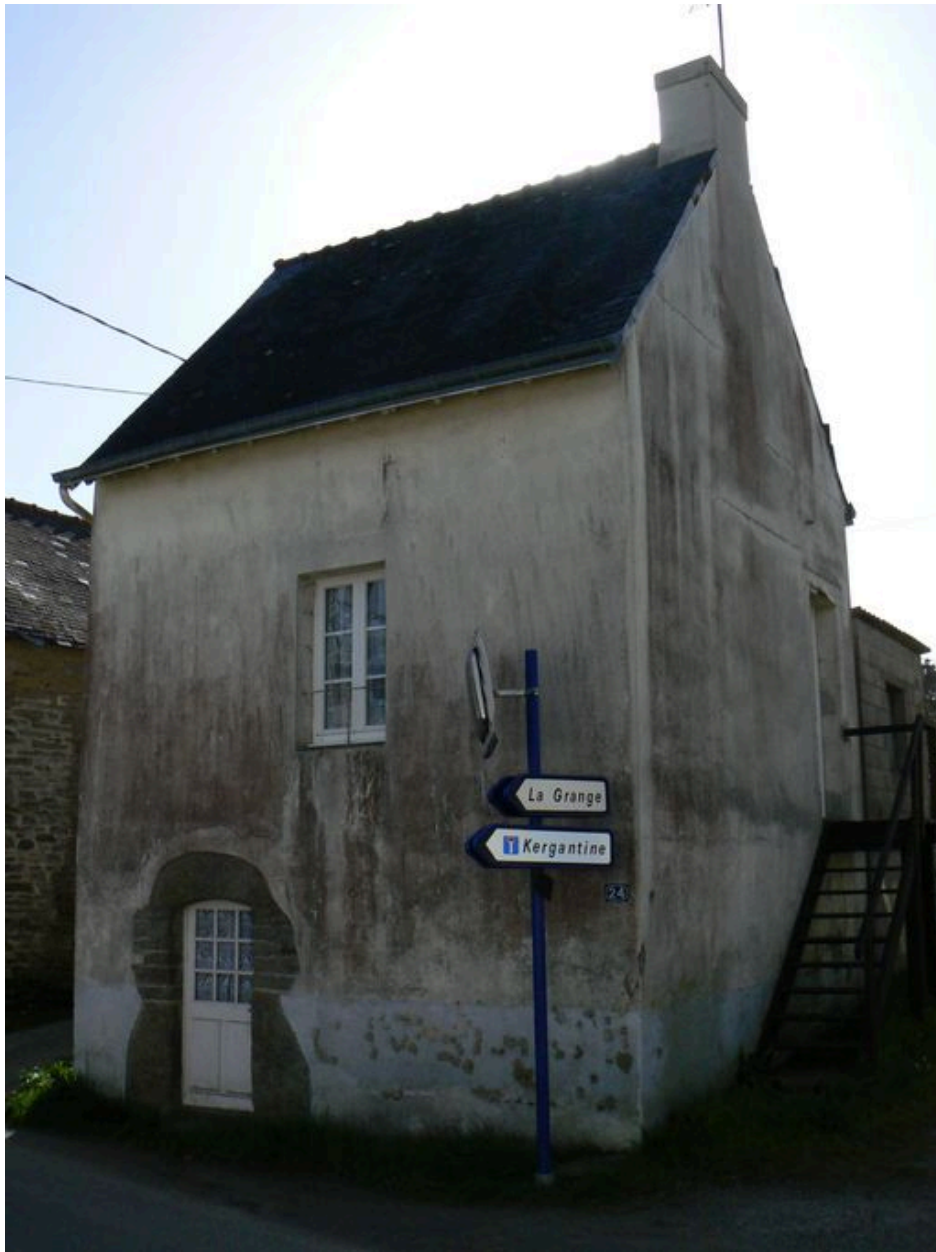
Maison de l'écart de la Grange