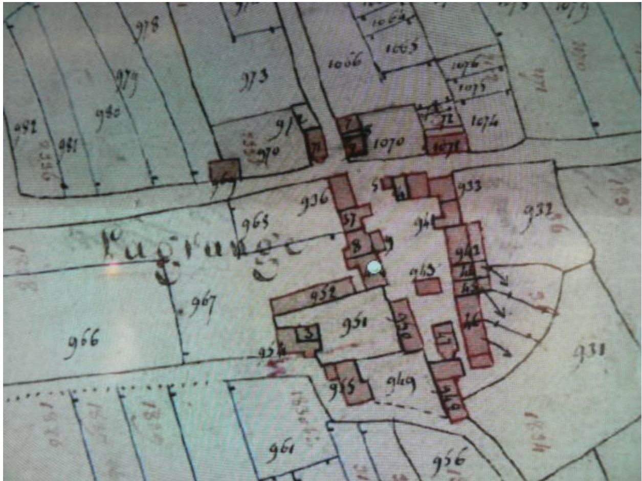
Plan cadastral napoléonien de l'écart de la Grange de 1823