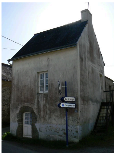
Maison de l'écart de la Grange IVR53_20082908614NUCA