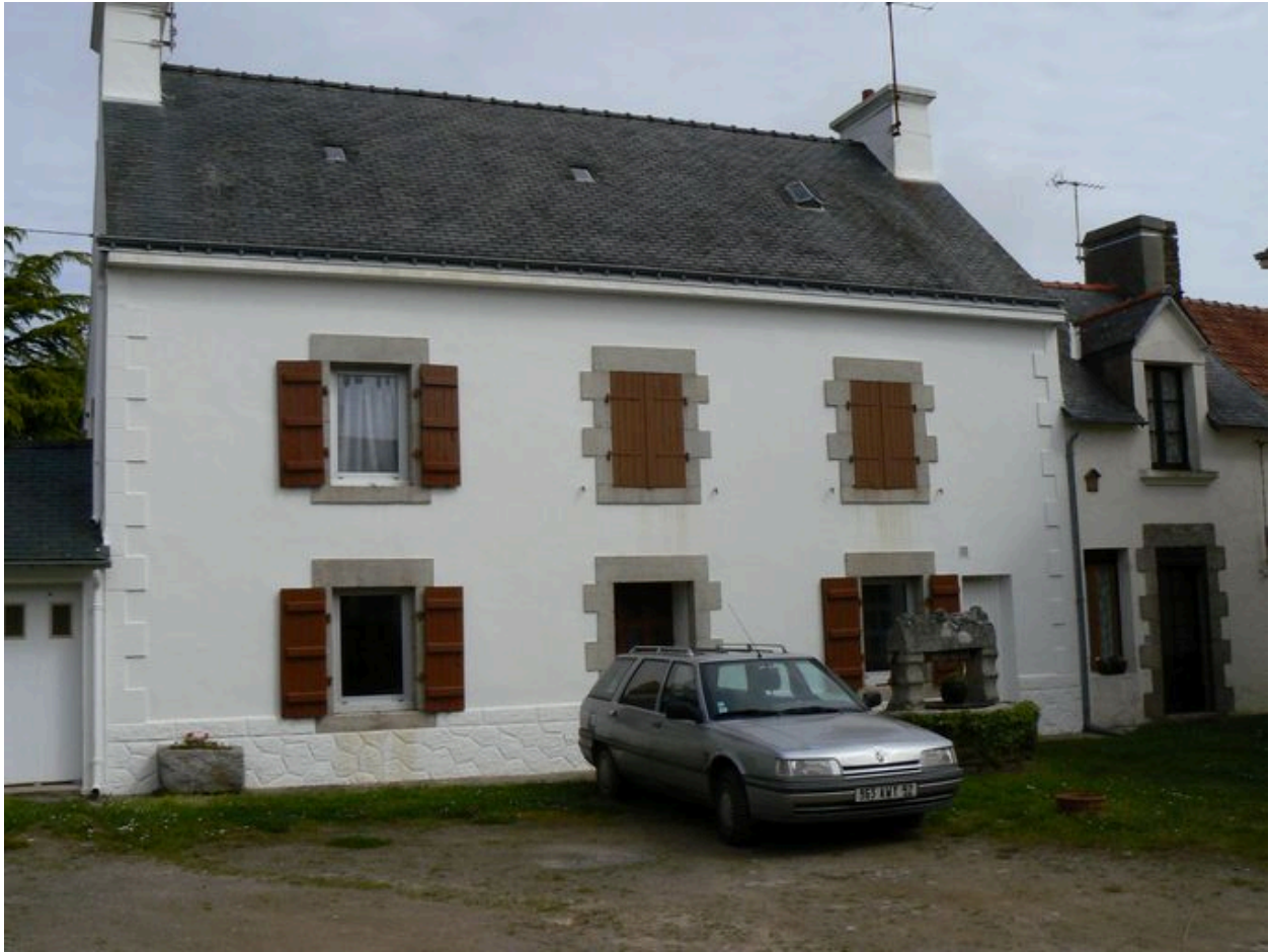
Ancienne maison de pêcheur de l'écart de la Grange