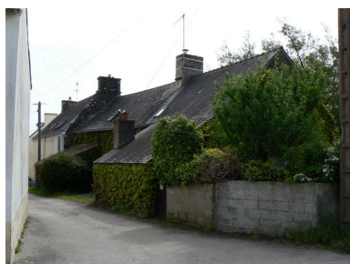
Rue de l'écart de la Grange IVR53_20082908616NUCA