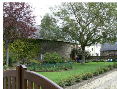
Jardin de l'écart de la Grange IVR53_20082908615NUCA