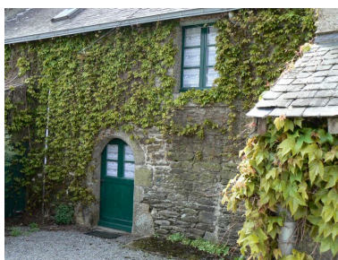
Façade d'une ancienne maison de paysan de l'écart de la Grange