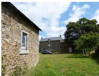
Vue générale sud IVR53_20243531265NUCA