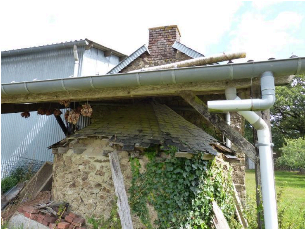
Vue sud est du fournil