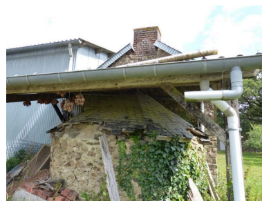
Vue sud est du fournil IVR53_20243531269NUCA