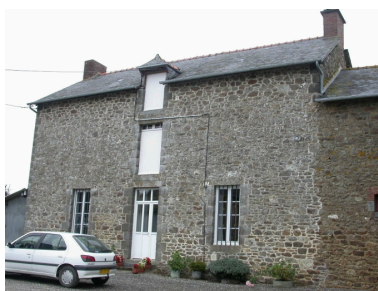
Le logis IVR53_20053518894NUCA