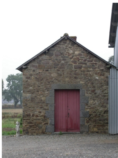
Le fournil