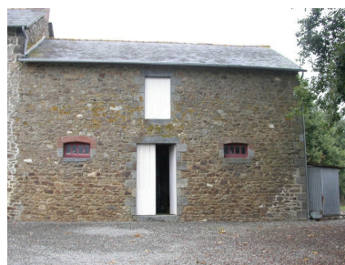
L'étable IVR53_20053518895NUCA