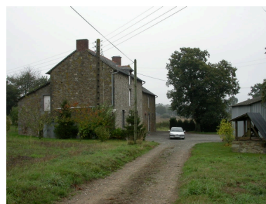
Vue générale nord IVR53_20053518902NUCA