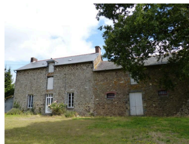
Vue générale sud IVR53_20243531266NUCA