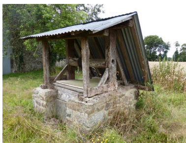
Vue générale nord ouest IVR53_20243531268NUCA