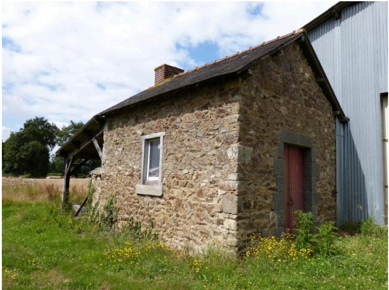
Vue nord est du fournil