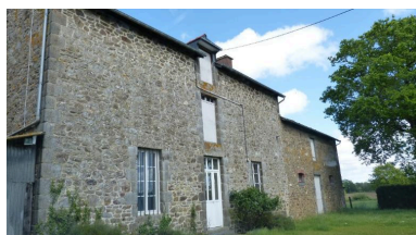
Vue générale sud IVR53_20243531267NUCA