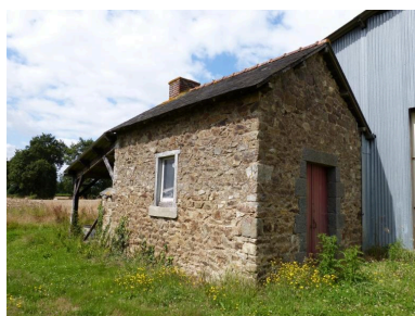
Vue nord est du fournil IVR53_20243531270NUCA