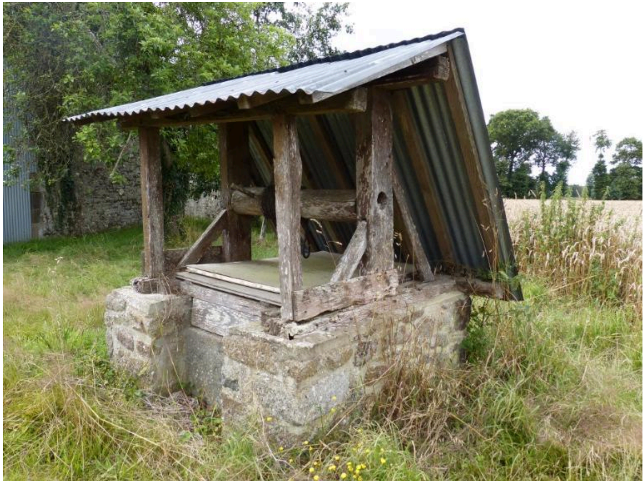
Vue générale nord ouest