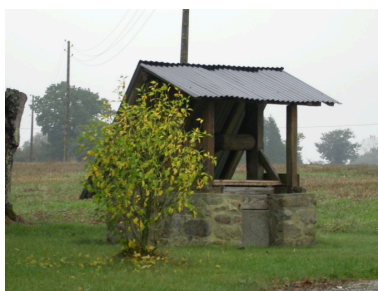
Le puits IVR53_20053518897NUCA