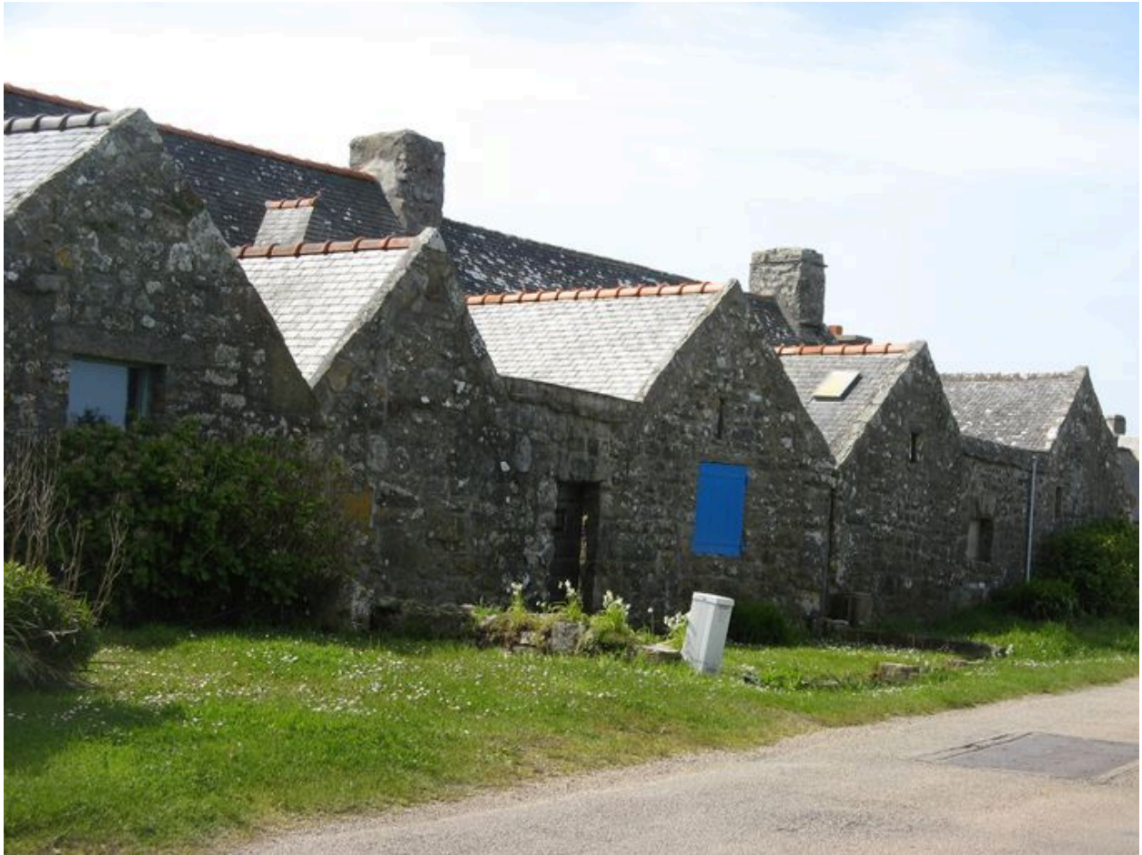
Village de Rostudel