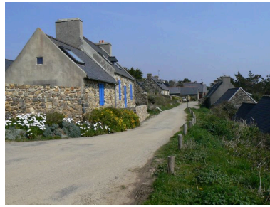
Village de Lostmarc'h