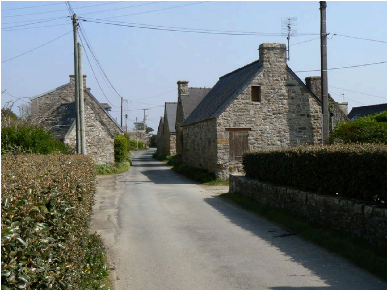
Village de La Palue