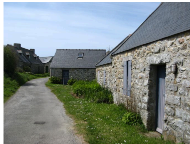
Village de Kerroux IVR53_20082908307NUCA