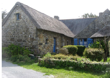
Village de Montourgard IVR53_20082908306NUCA