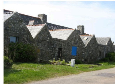
Village de Rostudel IVR53_20082908295NUCA