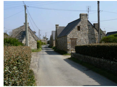
Village de La Palue IVR53_20072908869NUCA