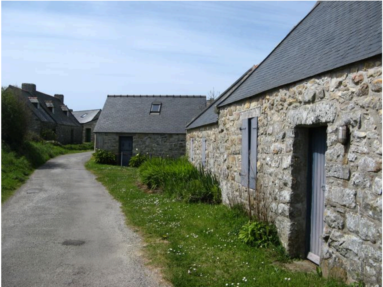
Village de Kerroux