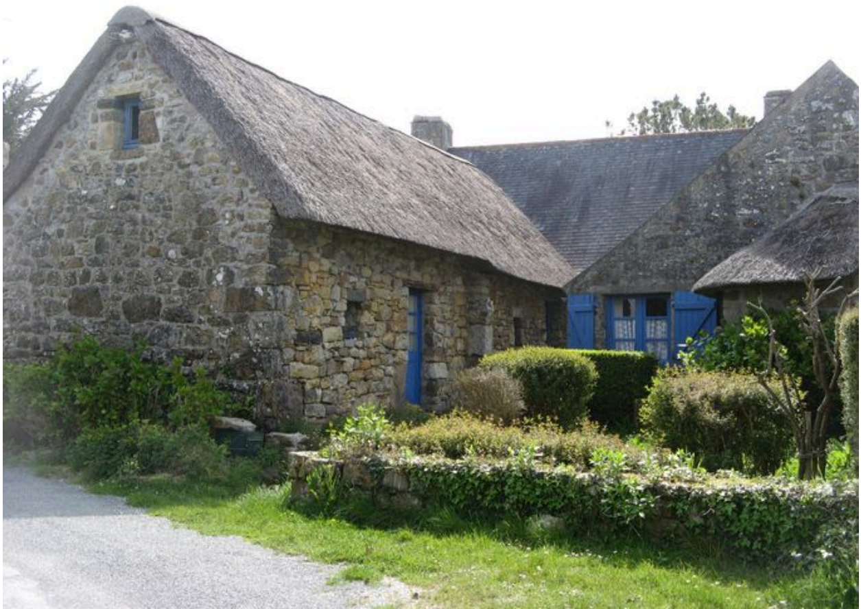
Village de Montourgard