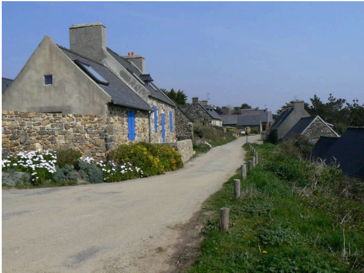
Village de Lostmarc'h