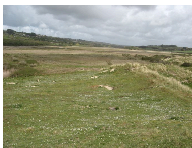
Marais maritime de l'Aber IVR53_20082908305NUCA