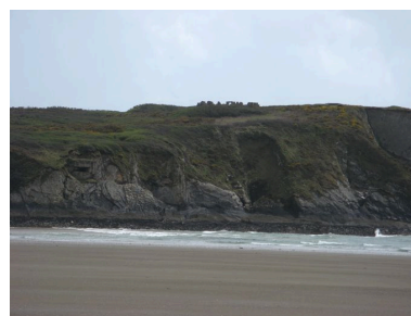
Ensemble fortifié de l'île de l'Aber