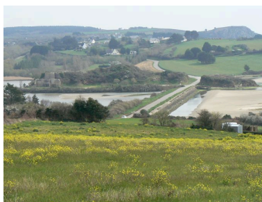
Vue générale de l'Aber et de sa digue IVR53_20072908773NUCA