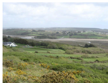
Vue générale du site de l'Aber et de son marais maritime depuis l'ouest