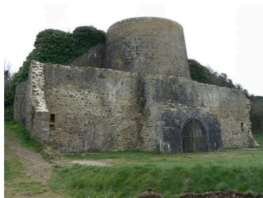
Motte féodale de Rozan transformée en four à chaux IVR53_20072908900NUCA