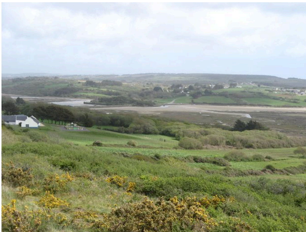
Vue générale du site de l'Aber et de son marais maritime depuis l'ouest