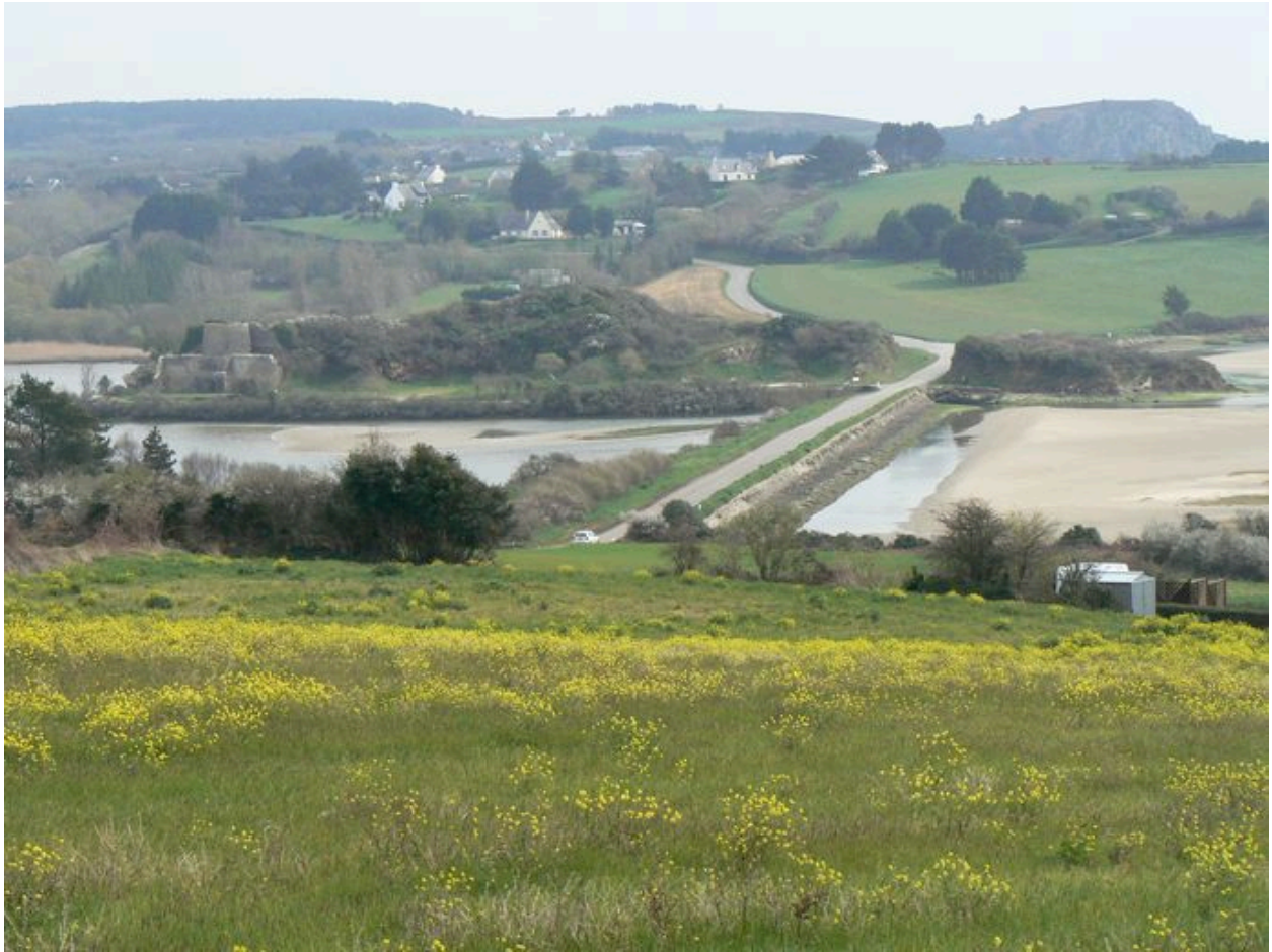
Vue générale de l'Aber et de sa digue