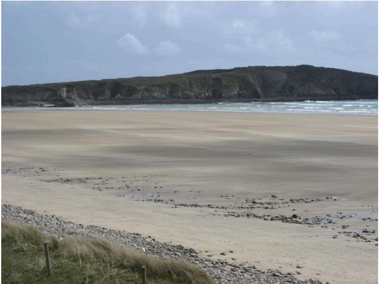
Plage et de l'île de l'Aber