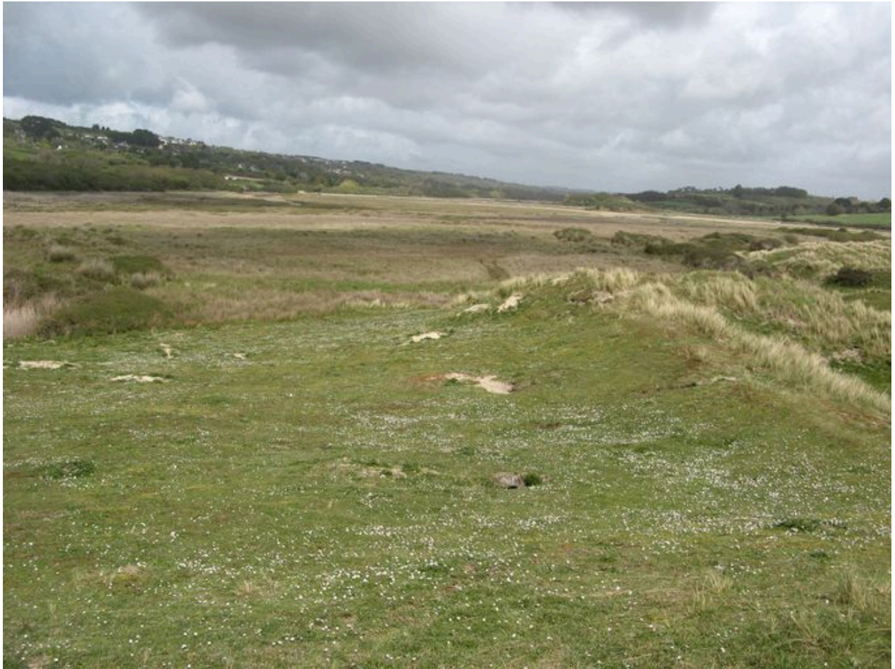
Marais maritime de l'Aber