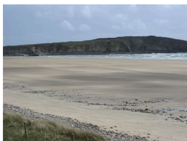
Plage et de l'île de l'Aber IVR53_20082908304NUCA