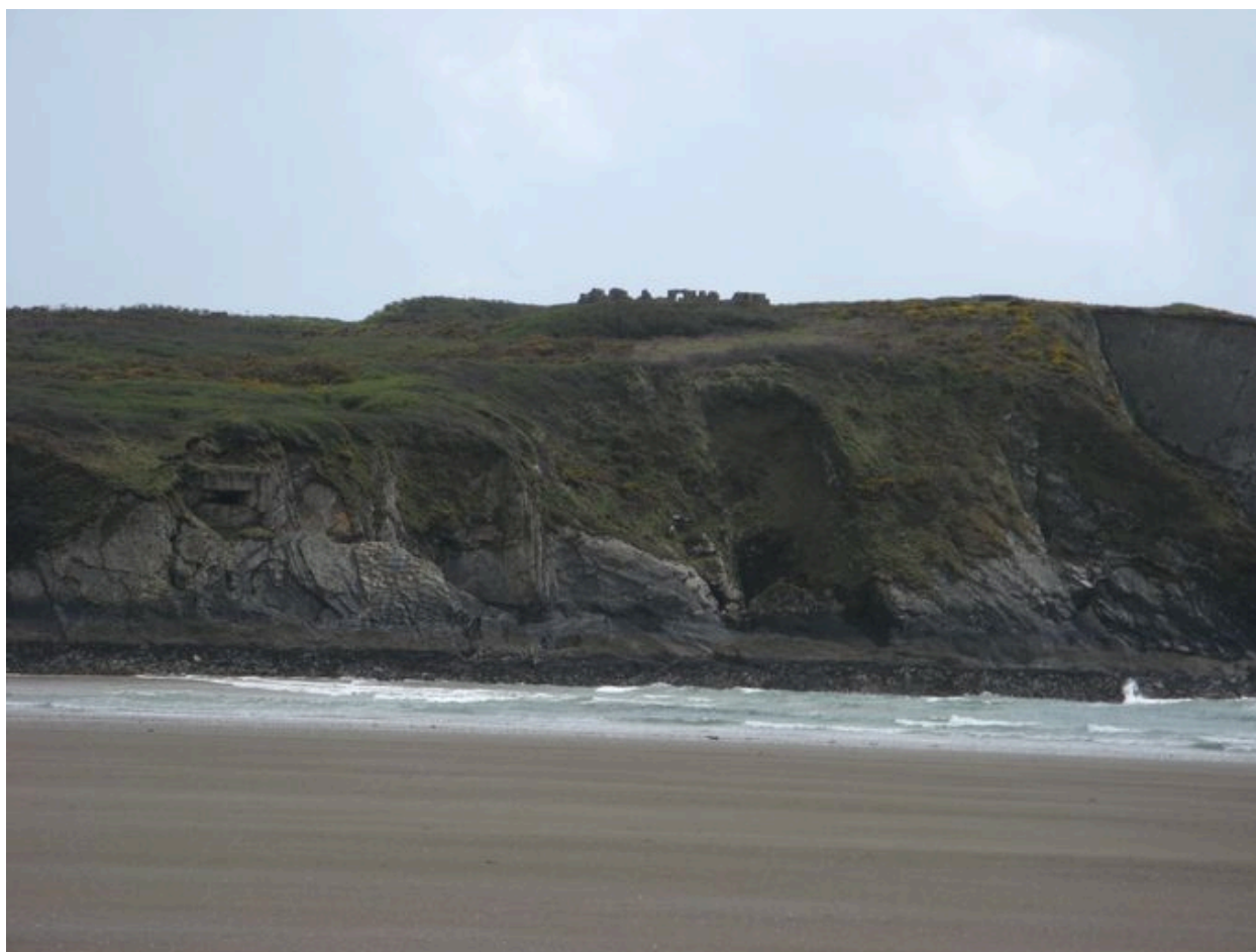
Ensemble fortifié de l'île de l'Aber