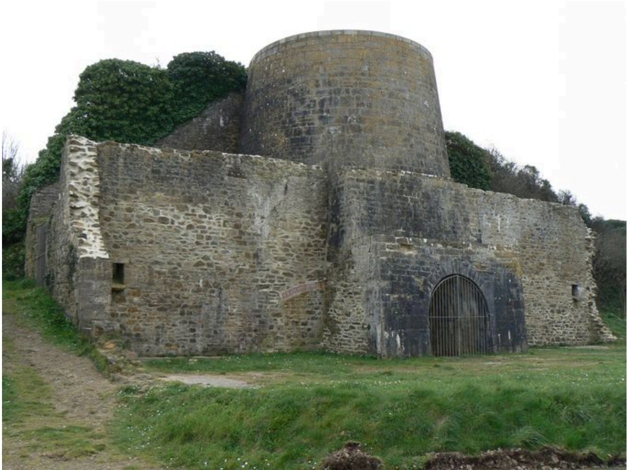
Motte féodale de Rozan transformée en four à chaux