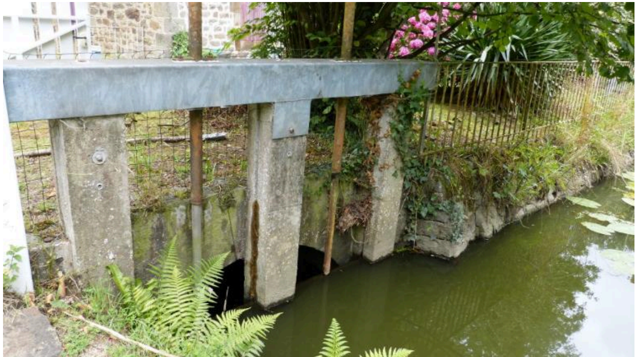
Détails d'une vanne