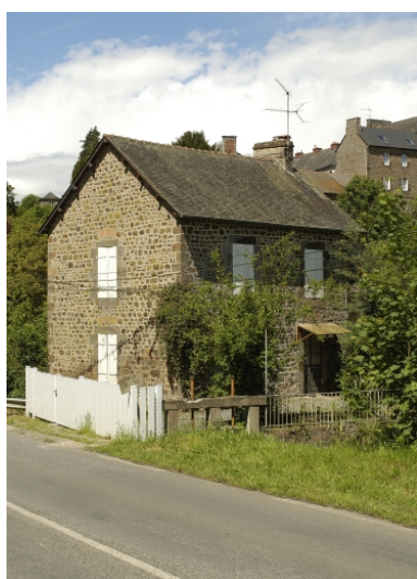
Vue générale IVR53_20053501500NUCA