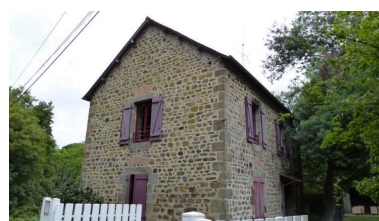
vue sud ouest IVR53_20253510465NUC