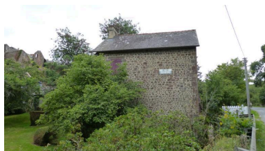
vue nord IVR53_20253510467NUC