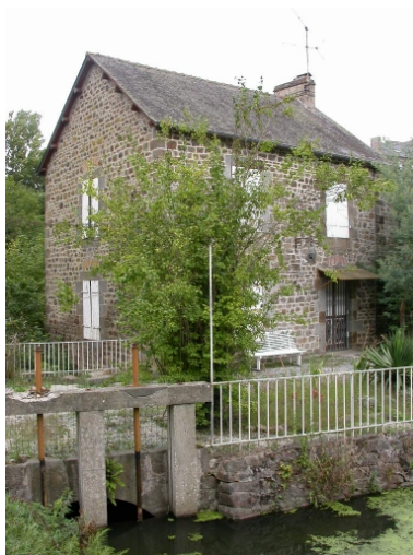
Vue sud IVR53_20053518506NUCA