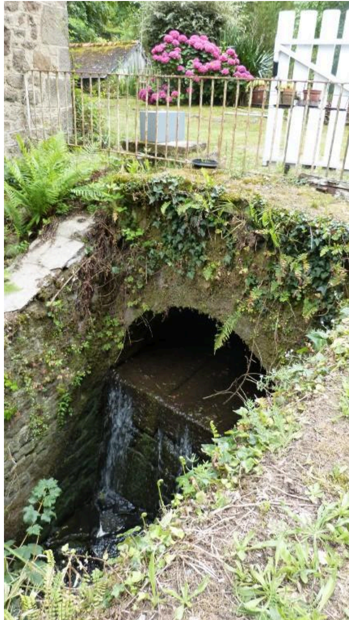
Détails du pont d'accès à la maison