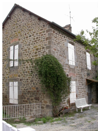
Vue sud IVR53_20053518507NUCA