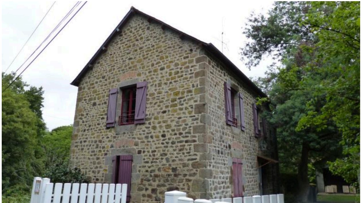
vue sud ouest