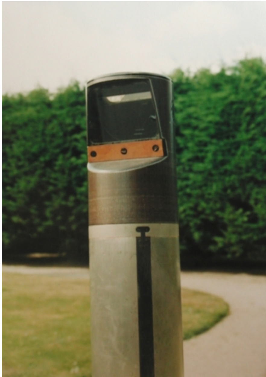
Vue de détail du périscope, fabriqué par l'usine Zeiss, équipé de filtres, pour l'observation dans la brume, face au soleil couchant (collection particulière)