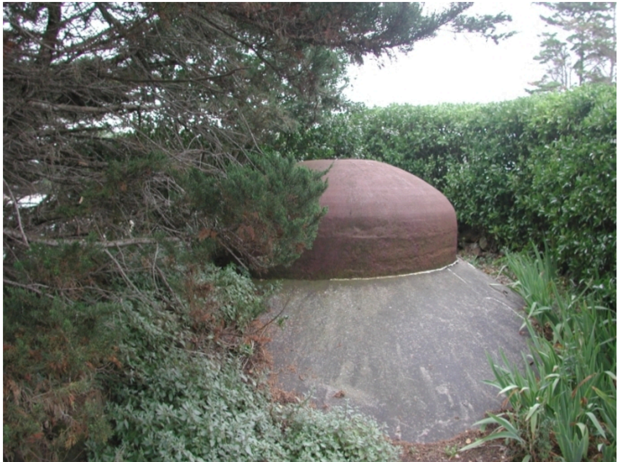
Tourelle blindée de 20 cm d'épaisseur pour protéger le périscope de Château-Tanguy