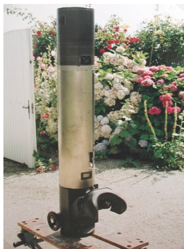
Périscopes de Château-Tanguy, protégé par la tourelle blindée, pour