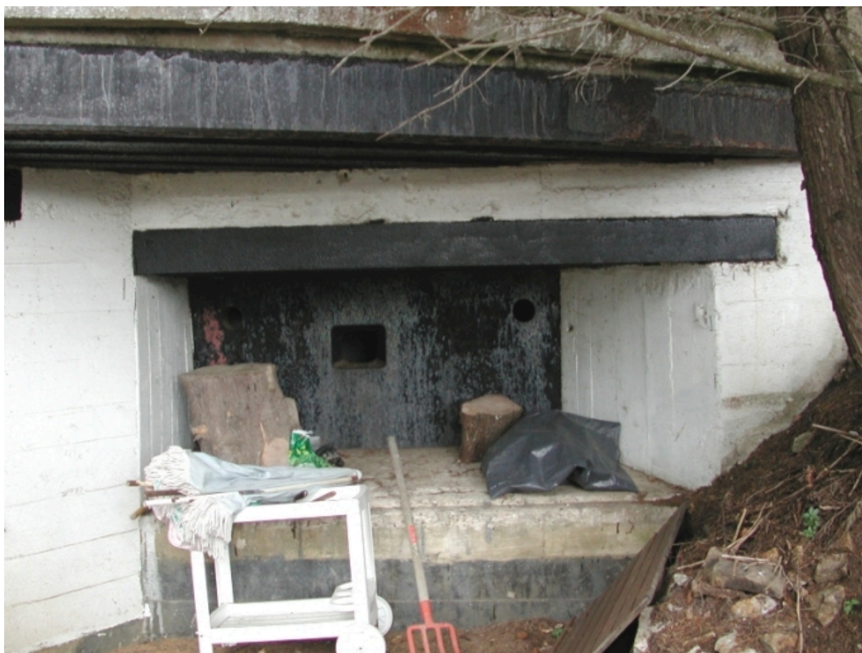
Vue générale du blockhaus de Château-Tanguy (Villa Leclair)