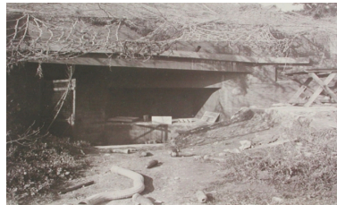
Vue de l'entrée du bunker le 5 août 1944 IVR53_20032205093NUCB