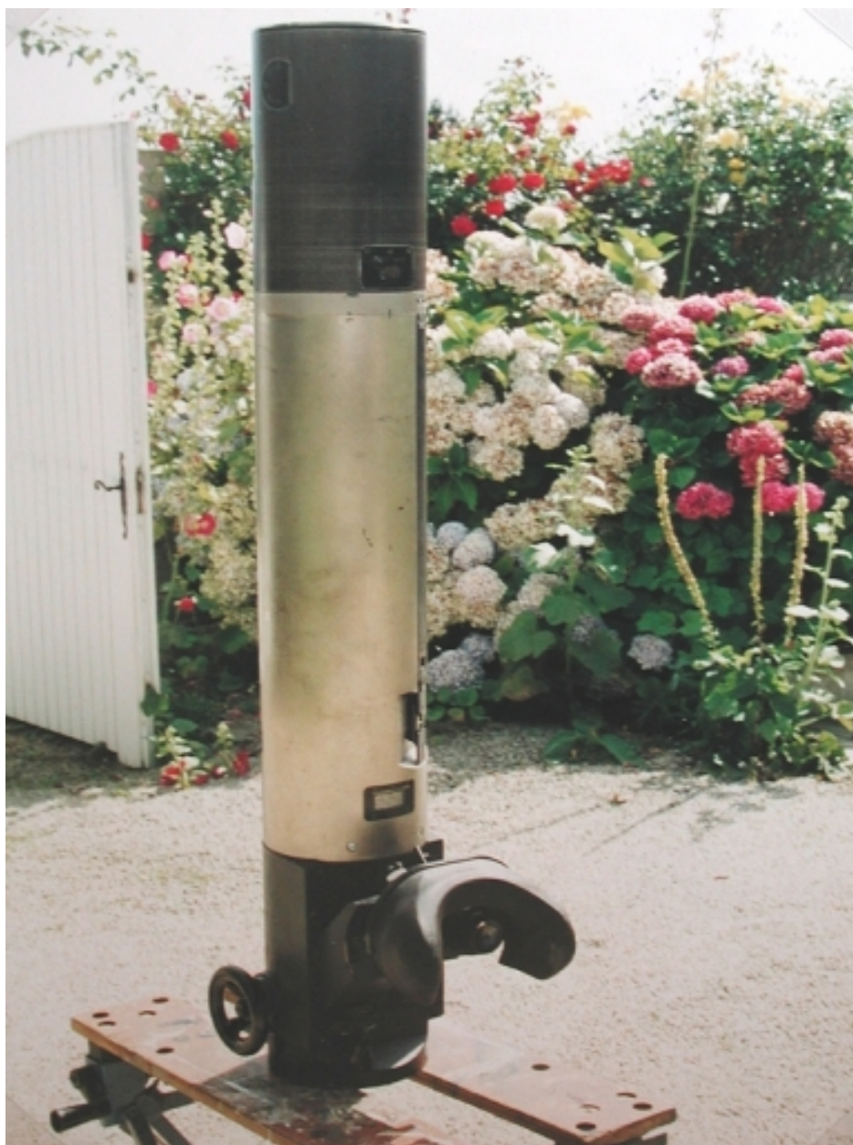
Périscopes de Château-Tanguy, protégé par la tourelle blindée, pour la surveillance de la baie de Saint-Brieuc