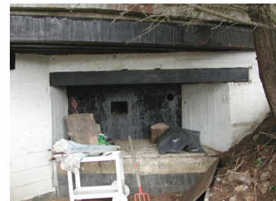
Vue générale du blockhaus de Château-Tanguy (Villa Leclair)