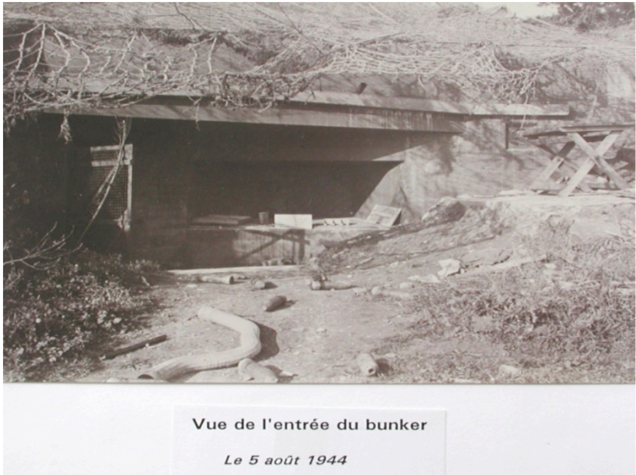
Vue de l'entrée du bunker le 5 août 1944