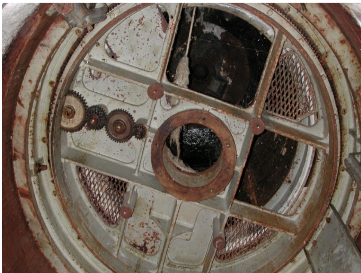
Dispositif associé à la tourelle sous le dôme : une couronne gravée indique la direction de tir