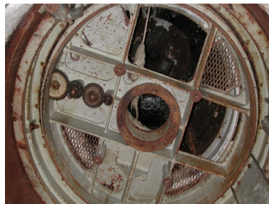
Dispositif associé à la tourelle sous le dôme : une couronne gravée indique la direction de tir