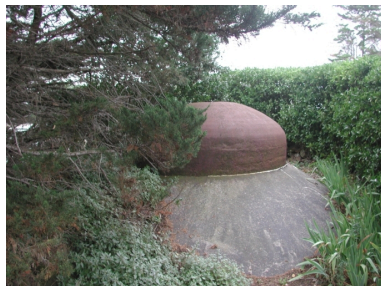
Tourelle blindée de 20 cm d'épaisseur pour protéger le périscopes de Château-Tanguy IVR53_20032205087NUCA