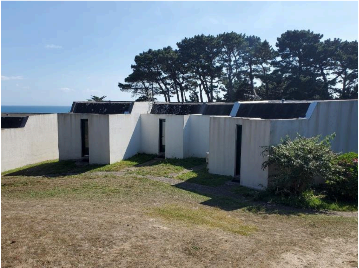
Le VVF de Groix, avant restauration