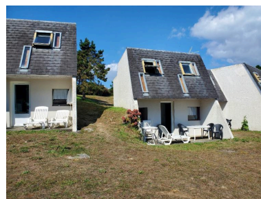
Dans le prolongement des toitures, les pignons blancs