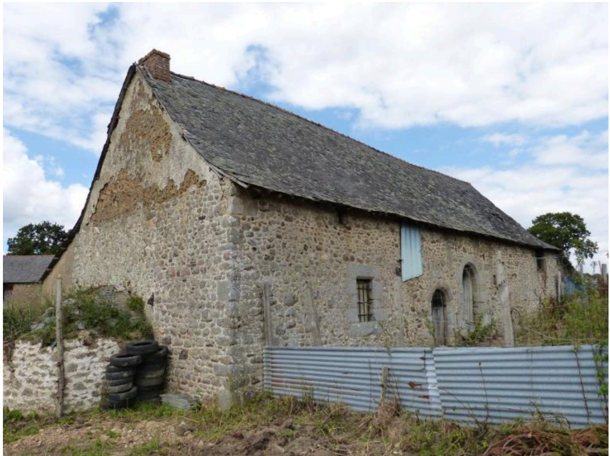
Vue générale sud ouest, Ferme, Bêlême (Hédé-Bazouges)