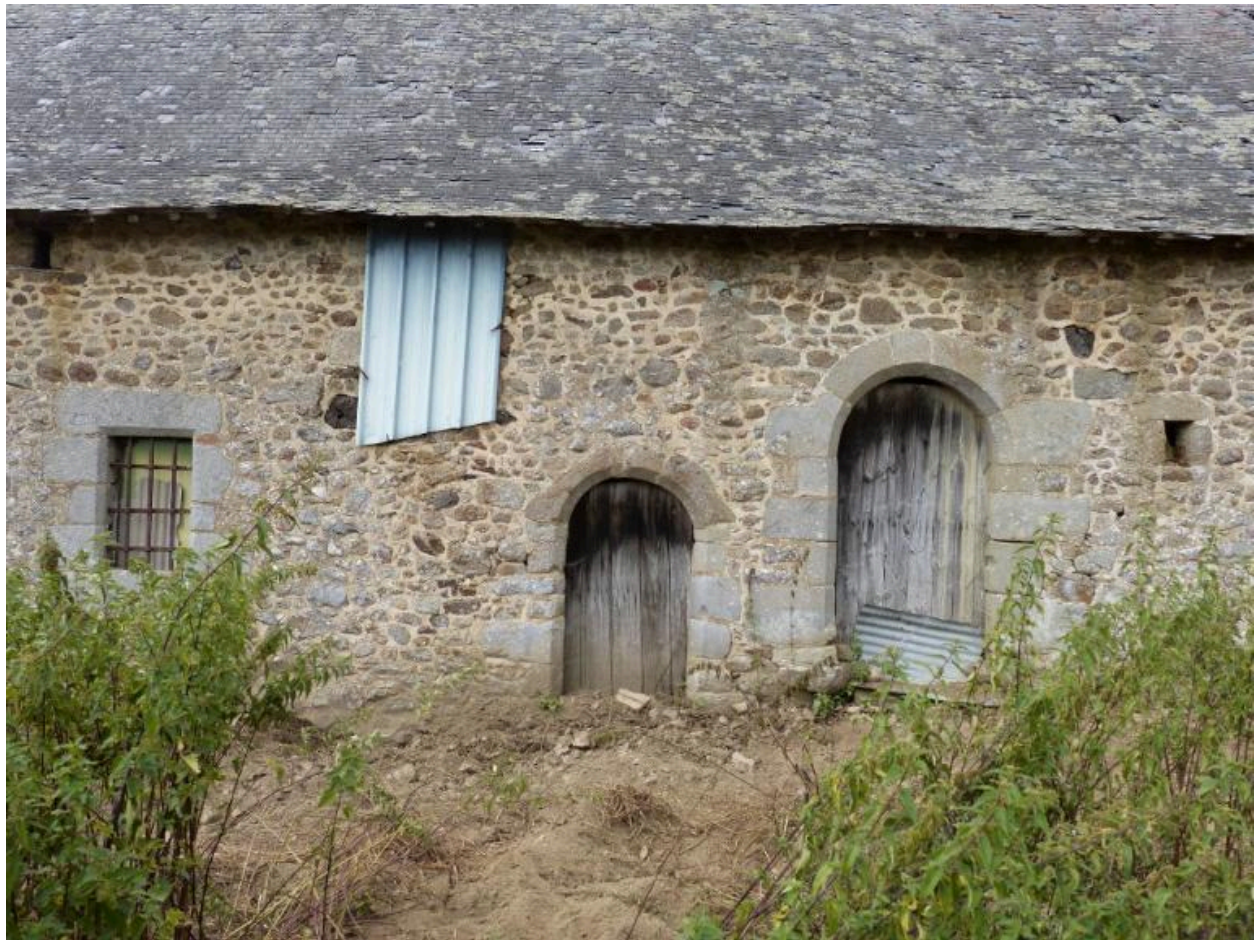
Détails de la façade sud, Ferme, Bêlême (Hédé-Bazouges)