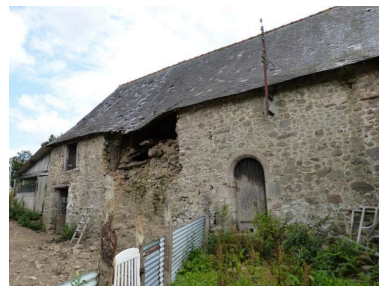
Vue générale nord, Ferme, Bêlême (Hédé-Bazouges) IVR53_20243531366NUCA