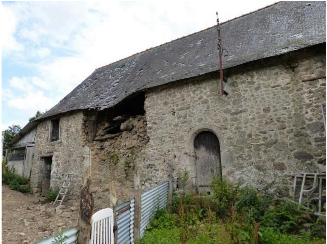
Vue générale nord, Ferme, Bêlême (Hédé-Bazouges)