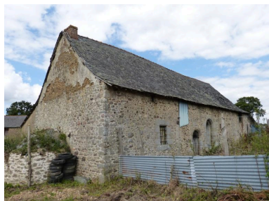
Vue générale sud ouest, Ferme, Bêlême (Hédé-Bazouges) IVR53_20243531365NUCA