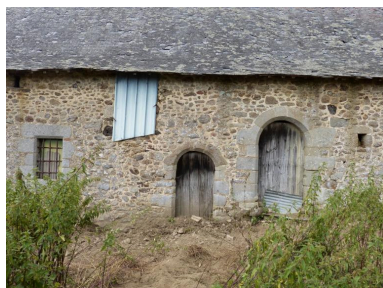
Détails de la façade sud, Ferme, Bêlême (Hédé-Bazouges) IVR53_20243531367NUCA