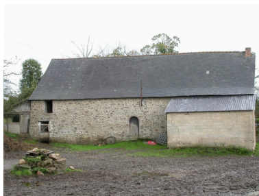
Vue générale nord IVR53_20053518953NUCA