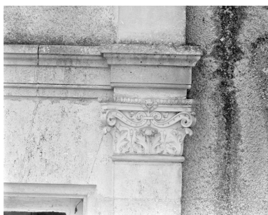
Elévation est : détail d'un chapiteau en terre cuite.