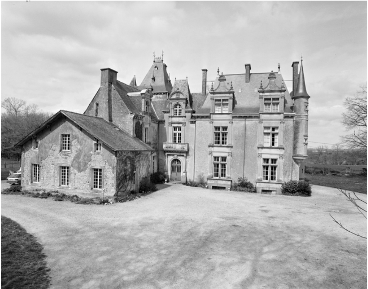
Vue générale 3/4 sud.