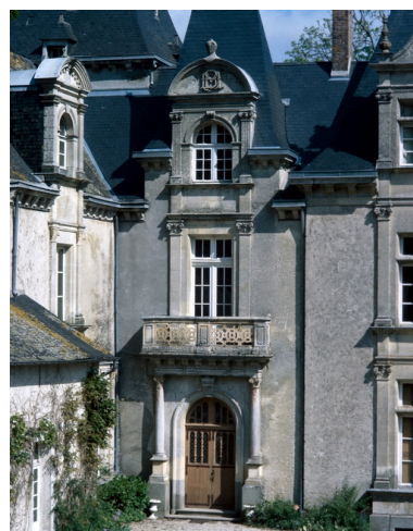
Vue générale de la façade d'angle avec entrée.