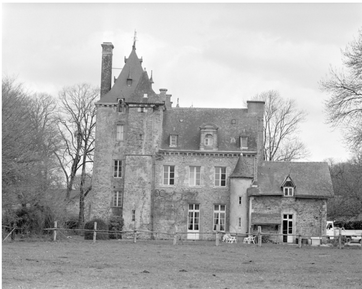
Elévation ouest, vue générale.