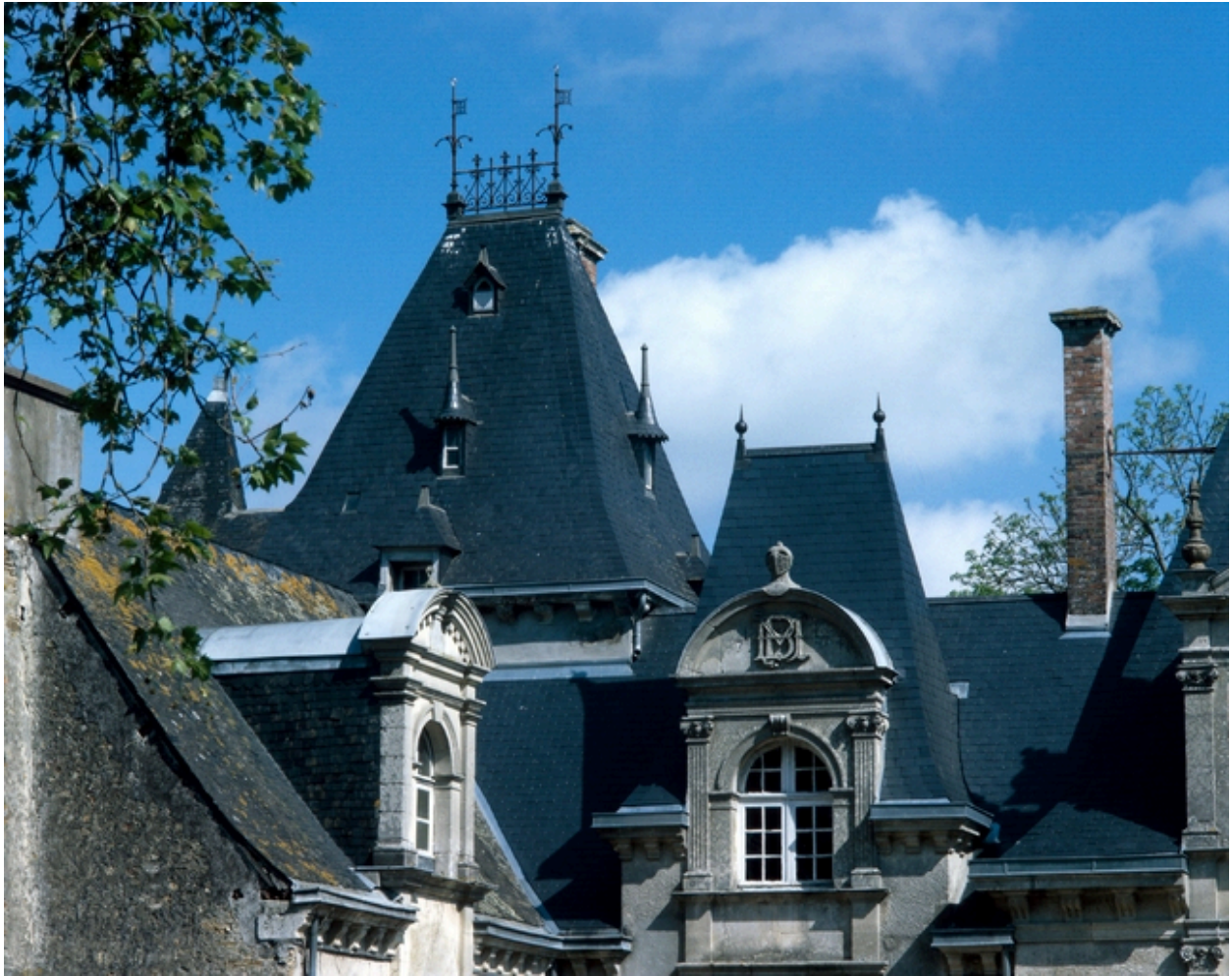
Vue générale des fenêtres sous toiture.