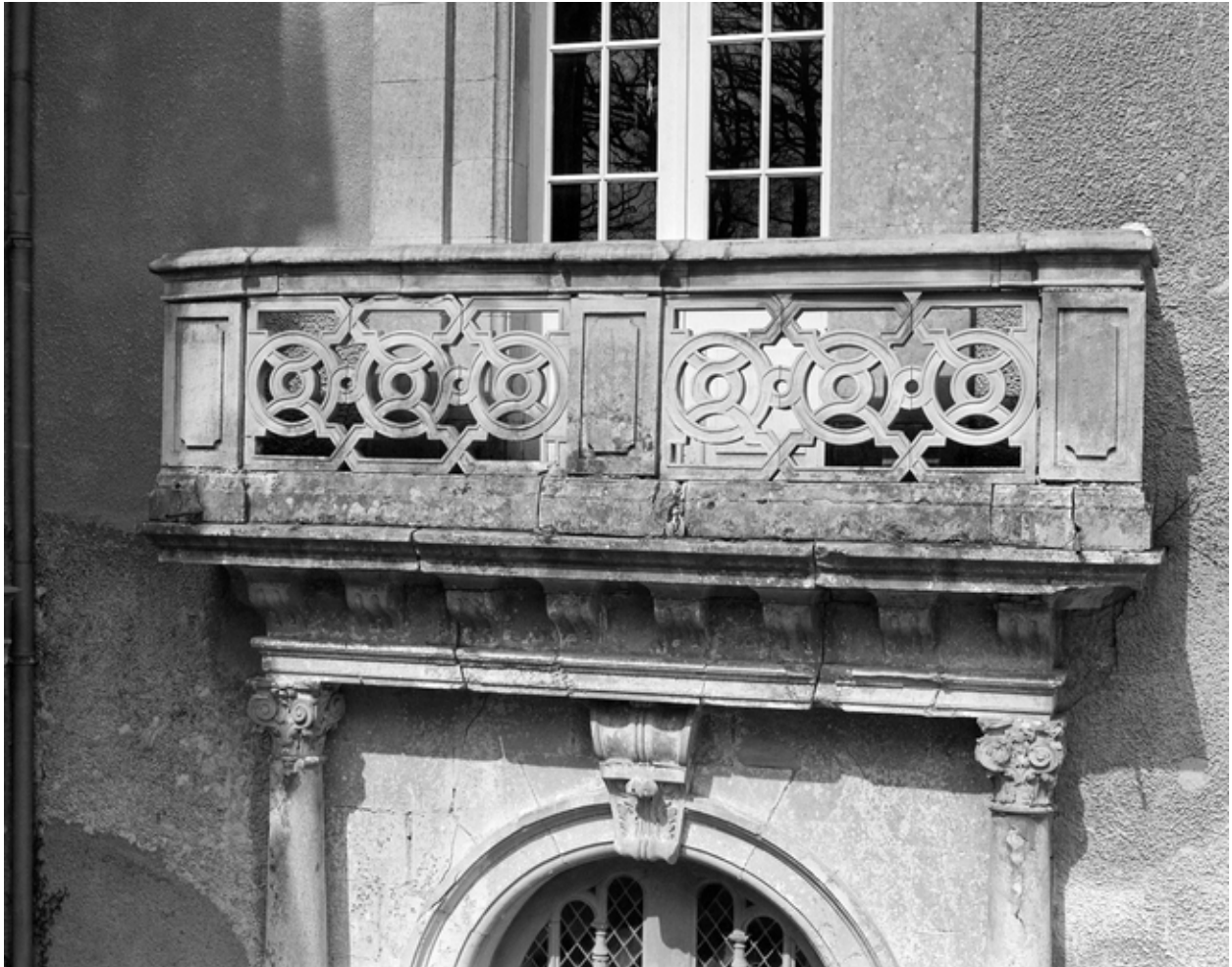
Elévation principale : détail du balcon.