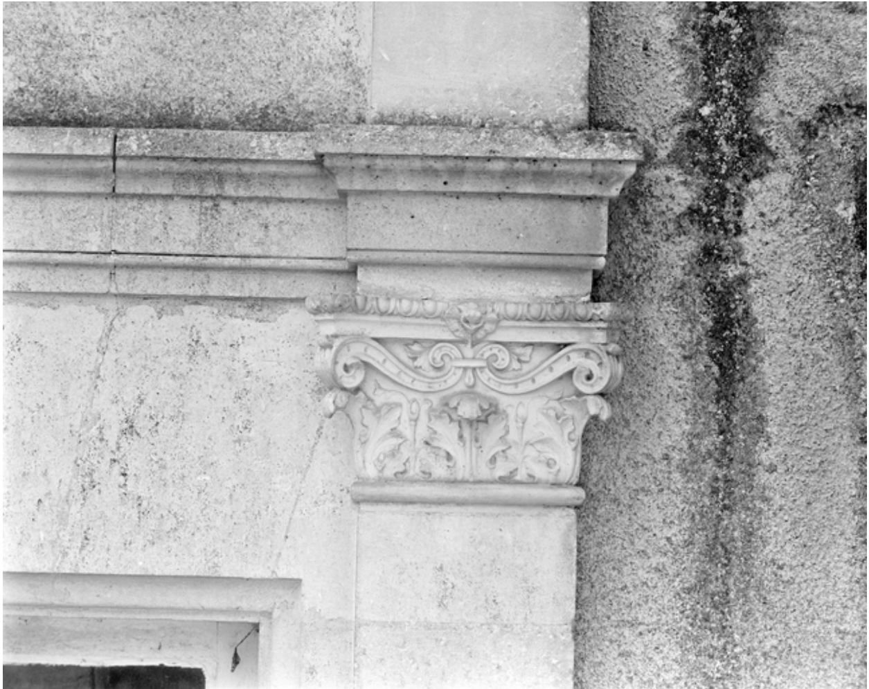
Elévation est : détail d'un chapiteau en terre cuite.