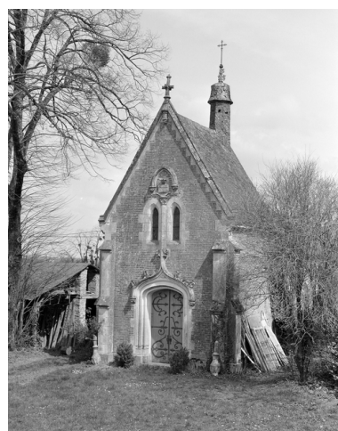
Chapelle, vue générale. IVR53_19963500764X