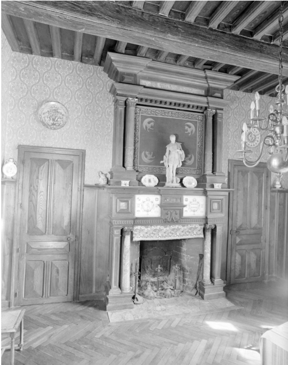
Salle-à-manger : vue générale de la cheminée.