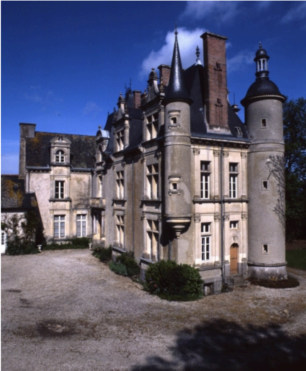
Vue générale du pignon est.