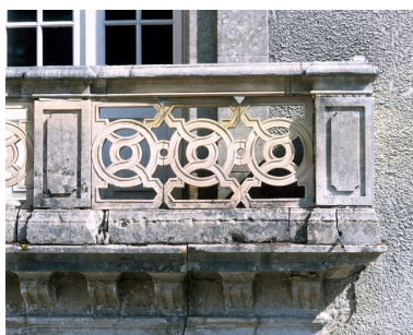
Elévation principale : détail du balcon. IVR53_19973500707XA