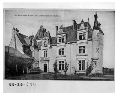
Les Bretonnières par Erbrée (Ille-et-Vilaine) - Elévation principale. Carte postale ancienne. IVR53_19883500214X