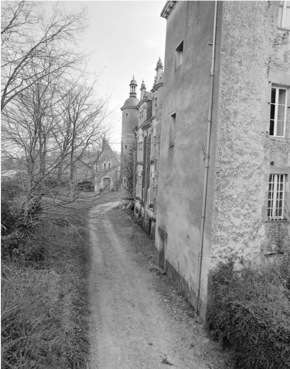
Vue générale de 3/4 nord-est.