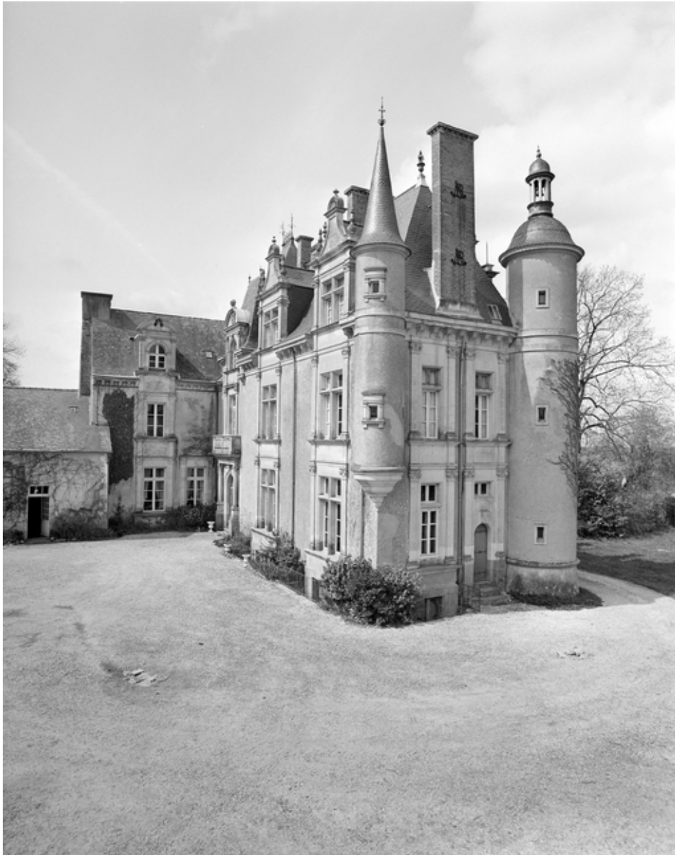
Vue générale du pignon est.