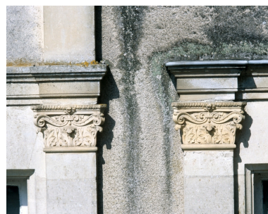
Elévation est : détail d'un chapiteau en terre cuite. IVR53_19973500708XA