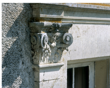
Elévation est : détail d'un chapiteau en terre cuite. IVR53_19973500709XA