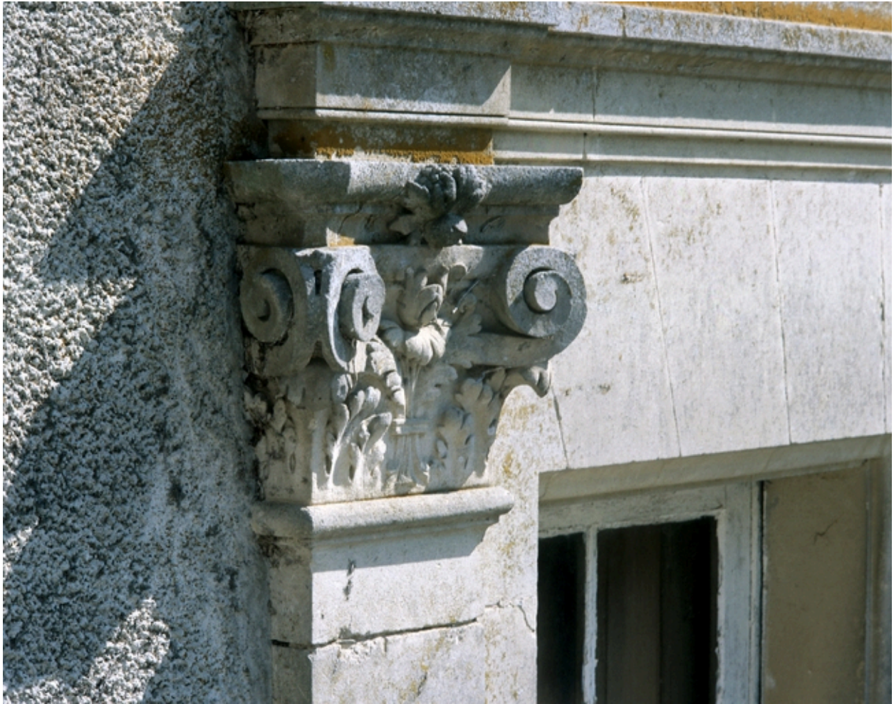
Elévation est : détail d'un chapiteau en terre cuite.