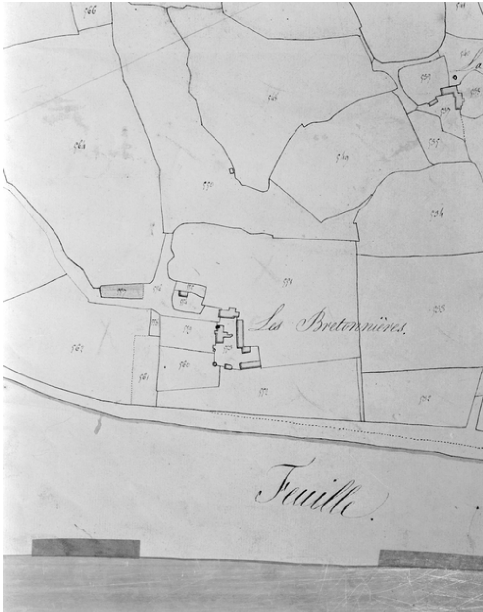
Plan de situation. Extrait cadastral 1824, feuille D2.