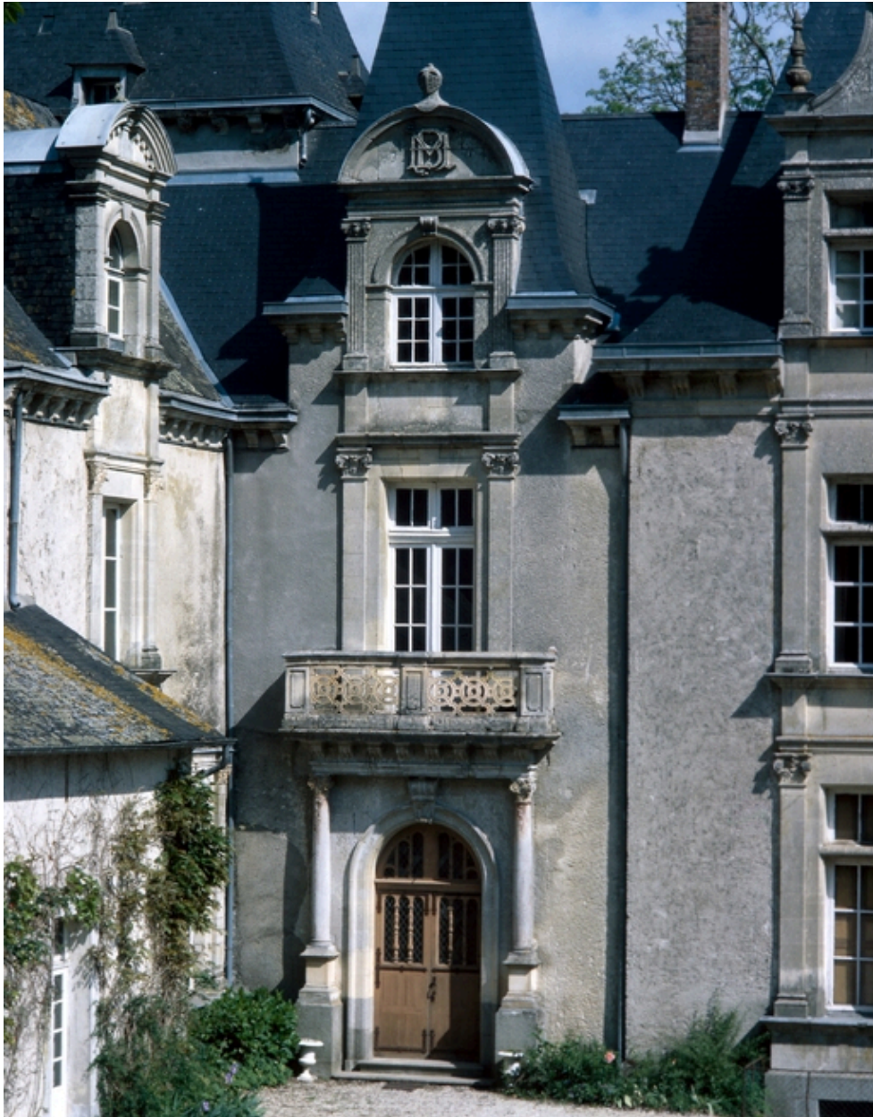
Vue générale de la façade d'angle avec entrée.