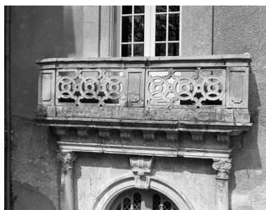
Elévation principale : détail du balcon. IVR53_19963500803X