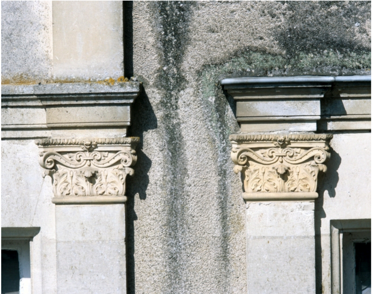
Elévation est : détail d'un chapiteau en terre cuite.