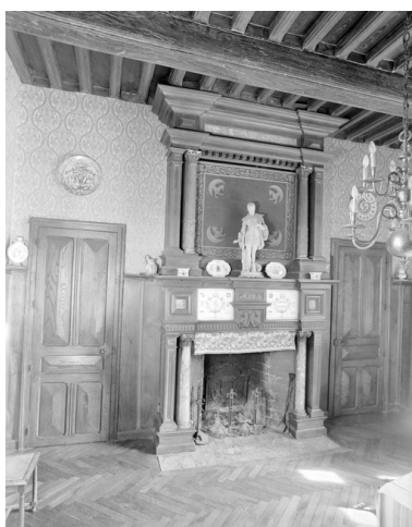
Salle-à-manger : vue générale de la cheminée. IVR53_19963500767X