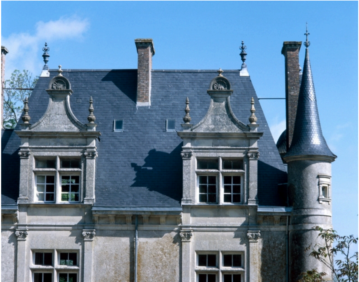
Elévation sud, partie supérieure.