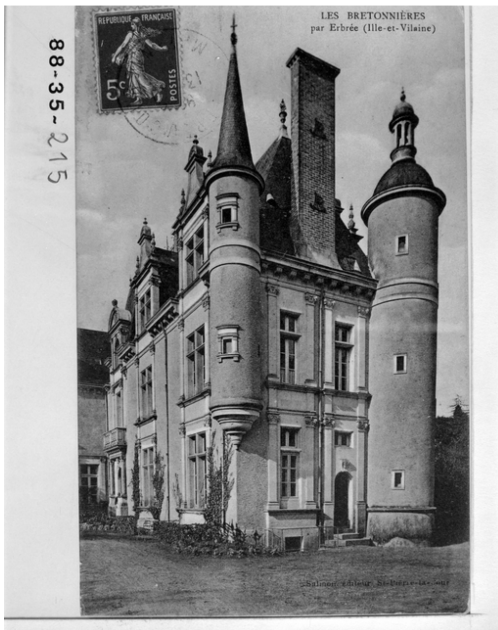
Les Bretonnières par Erbrée (Ile-et-Vilaine) - Tourelles. Carte postale ancienne. Fonds Lagrée.