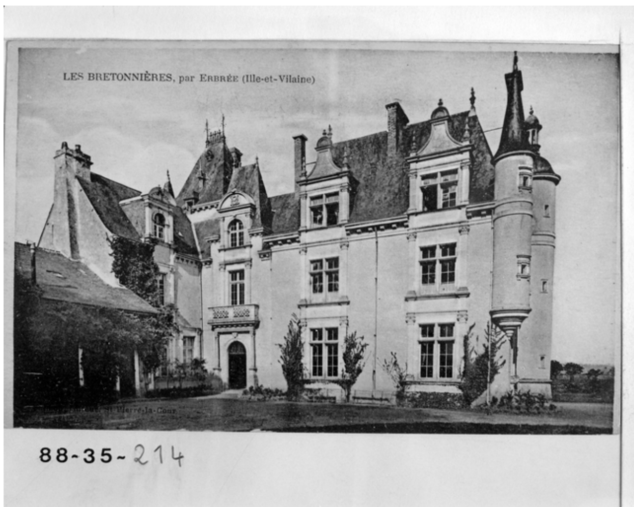
Les Bretonnières par Erbrée (Ile-et-Vilaine) - Elévation principale. Carte postale ancienne.