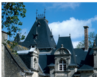
Vue générale des fenêtres sous toiture. IVR53_19973500710XA