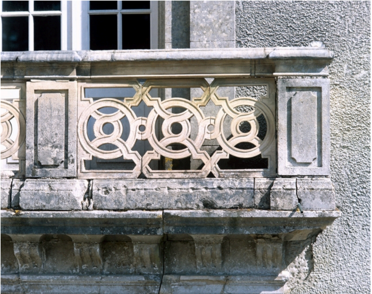
Elévation principale : détail du balcon.