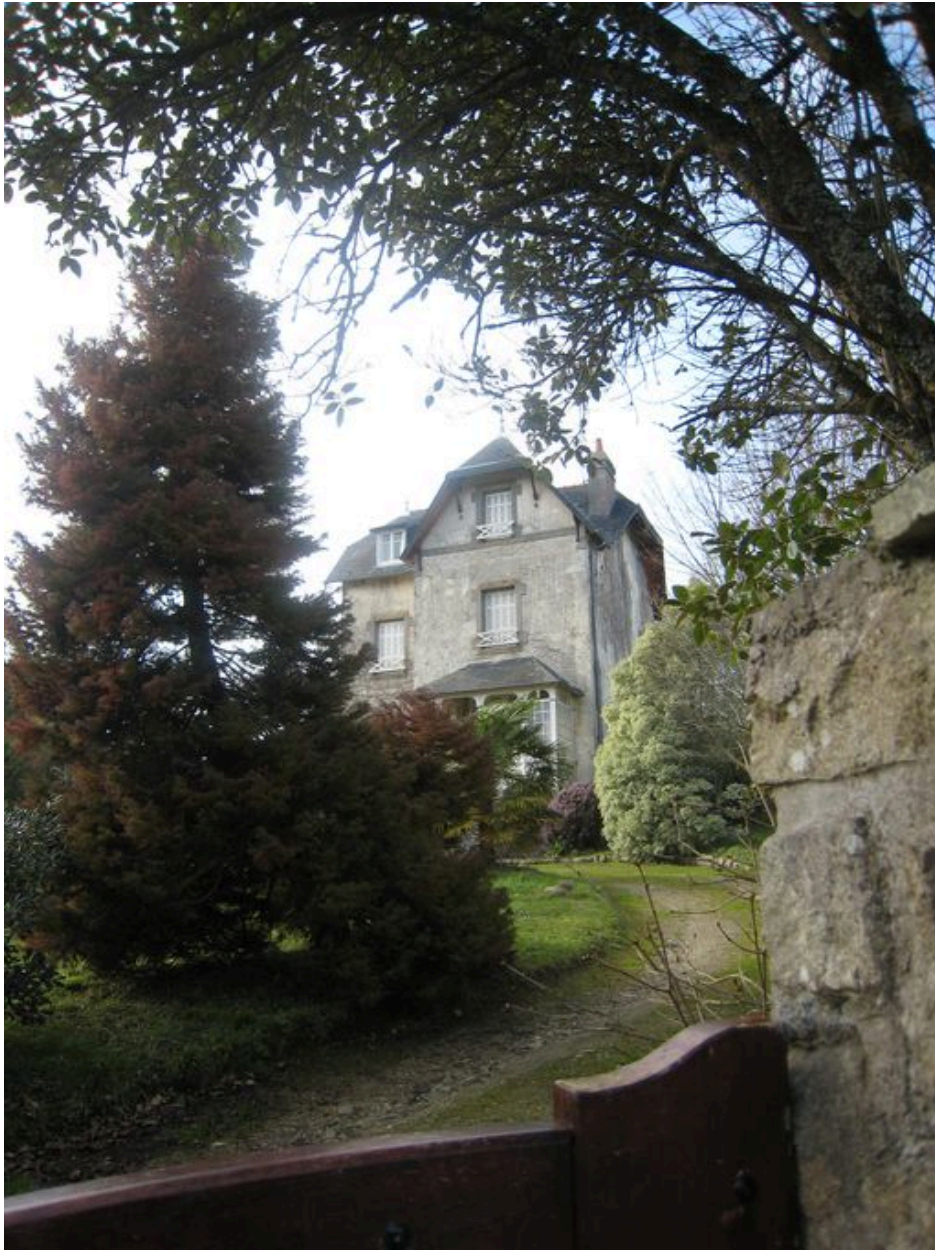
Vue générale du parc de la villa Les Glycines