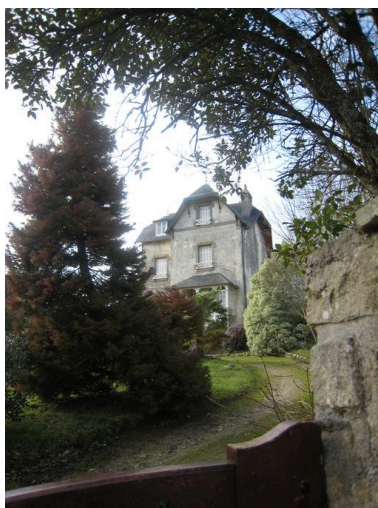
Vue générale du parc de la villa Les Glycines