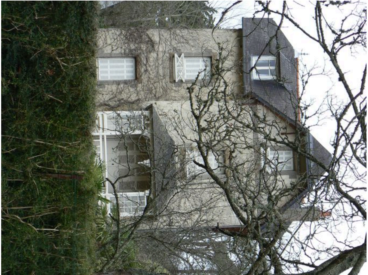
Villa Les Glycines