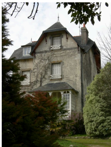
Vue générale de la villa Les Glycines IVR53_20062908628NUCA