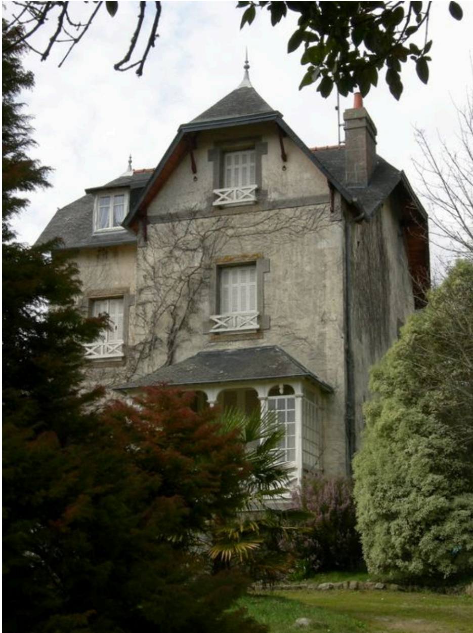
Vue générale de la villa Les Glycines