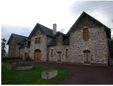
Les communs