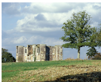
Vue rapprochée