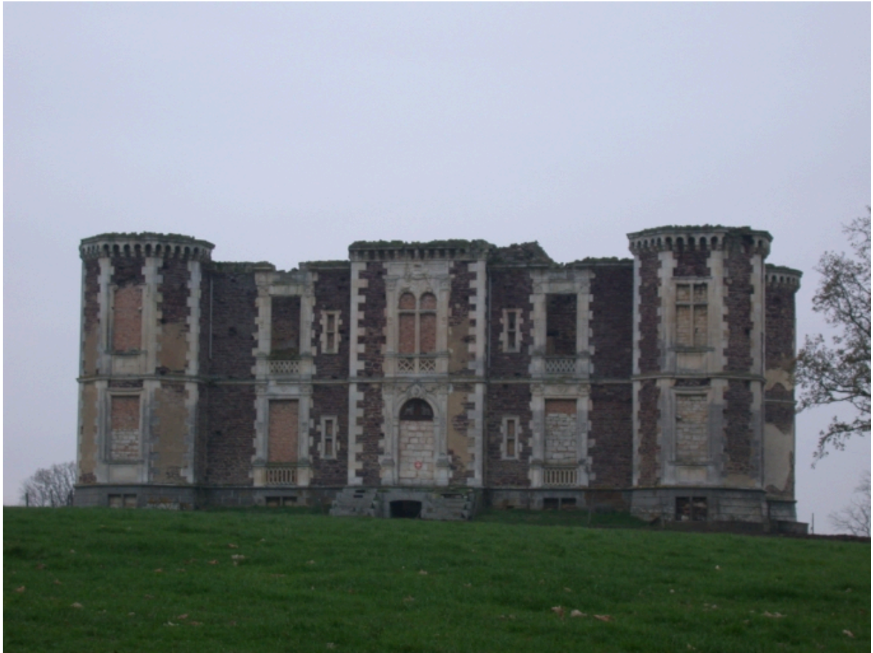
Façade principale et son décor sculpté