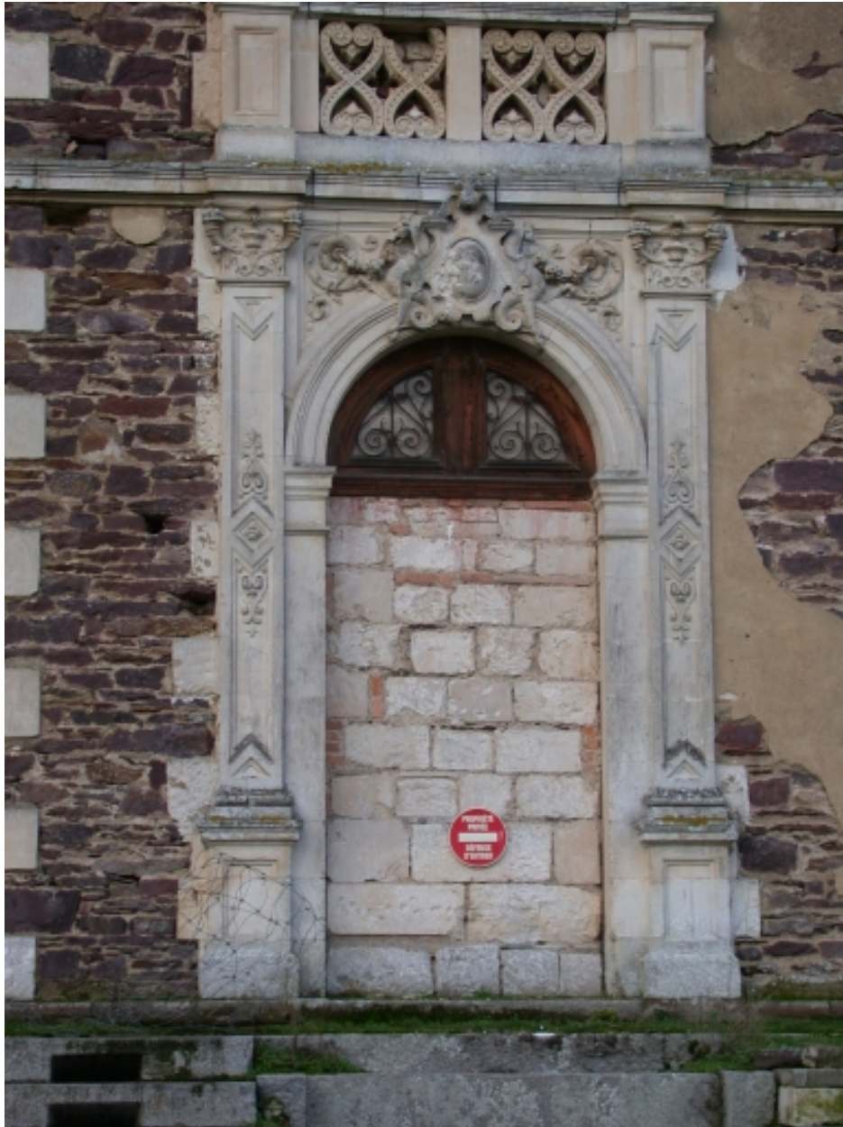
Porte, détail du décor