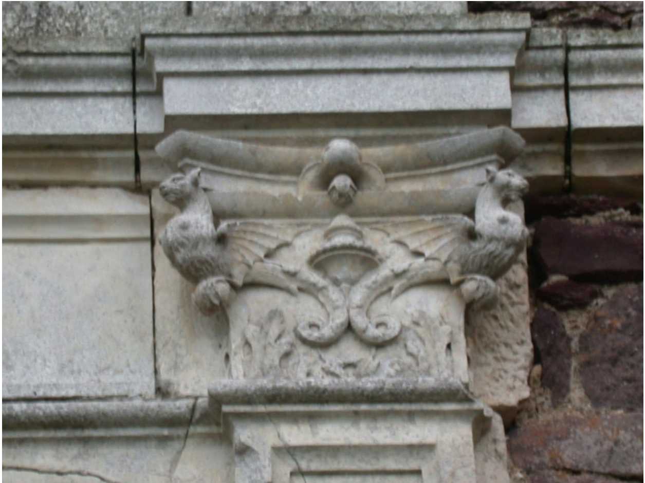
Détail d'un pilastre avec chapiteau sculpté