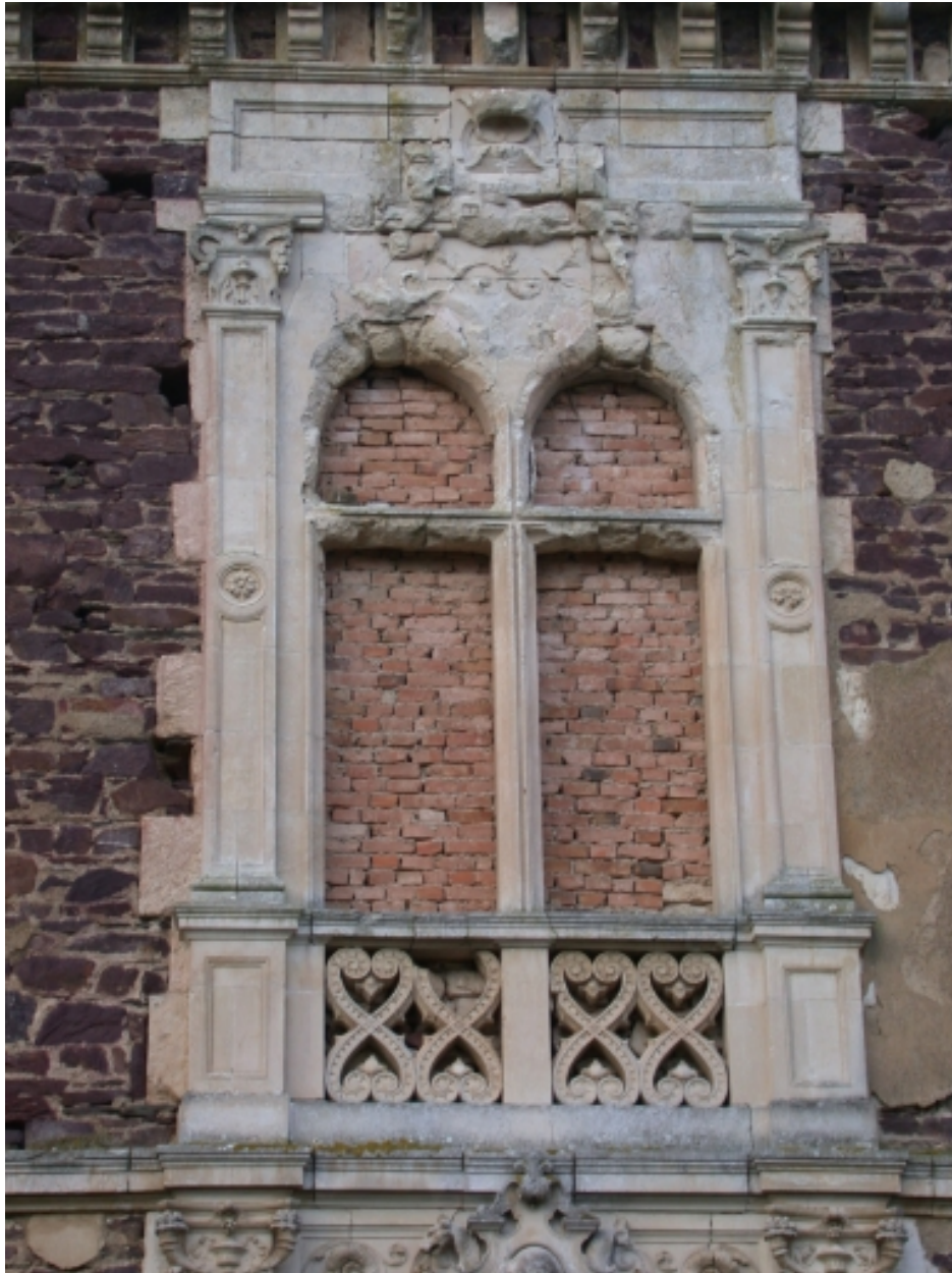
Fenêtre, détail du décor