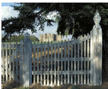
Vue éloignée IVR53_20023500665XA