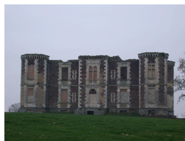
Façade principale et son décor sculpté