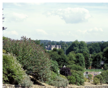
Vue rapprochée IVR53_20023500650XA