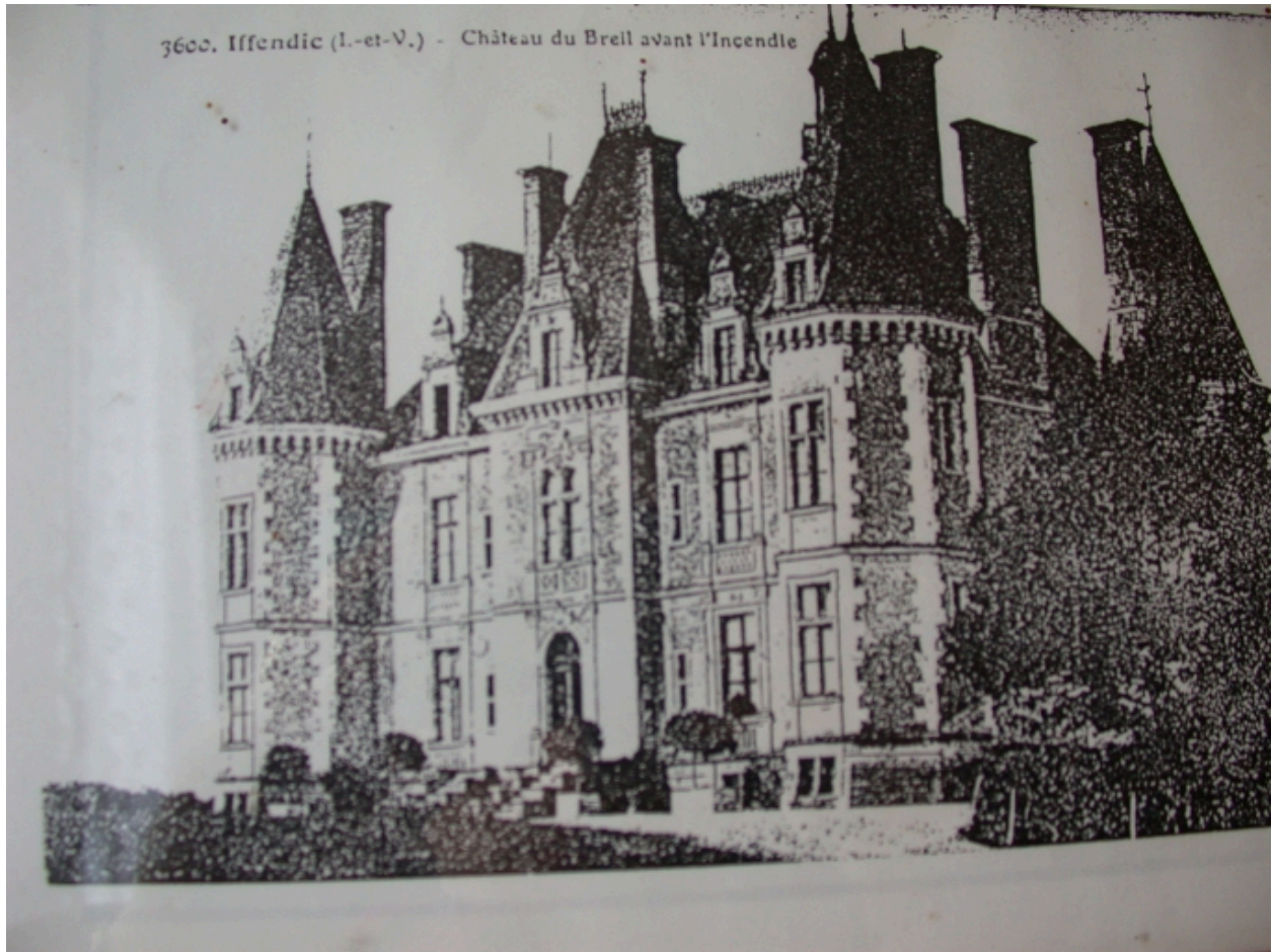
Le château du Breuil avant l'incendie, reprographie d'une photocopie de carte postale