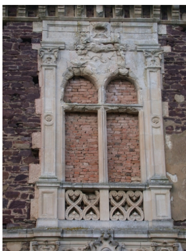
Fenêtre, détail du décor