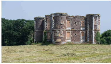
IVR53_20193500958NUCA