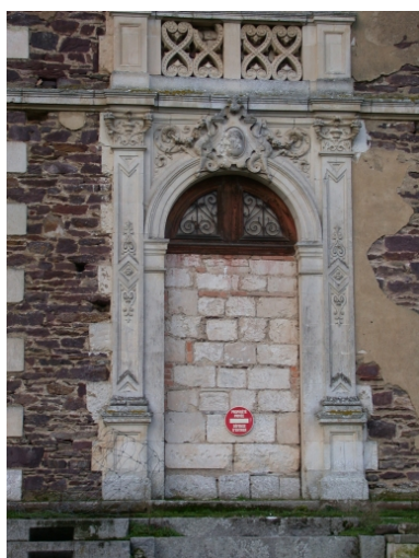
Porte, détail du décor IVR53_20033515988NUCA