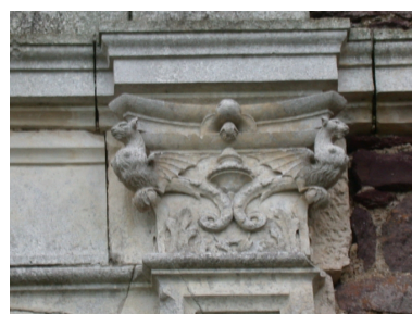
Détail d'un pilastre avec chapiteau sculpté IVR53_20033515990NUCA