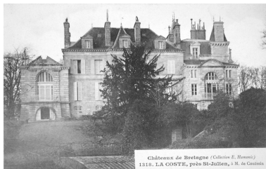
Vue générale côté jardin