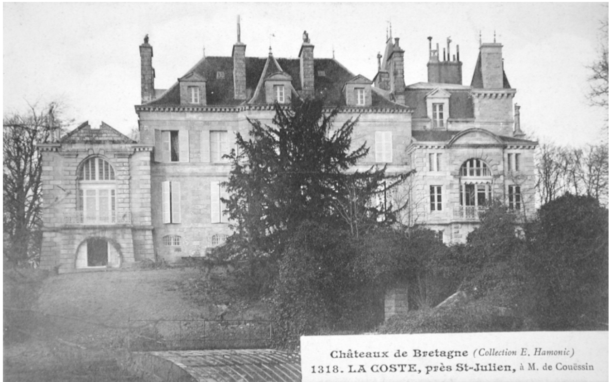
Vue générale côté jardin