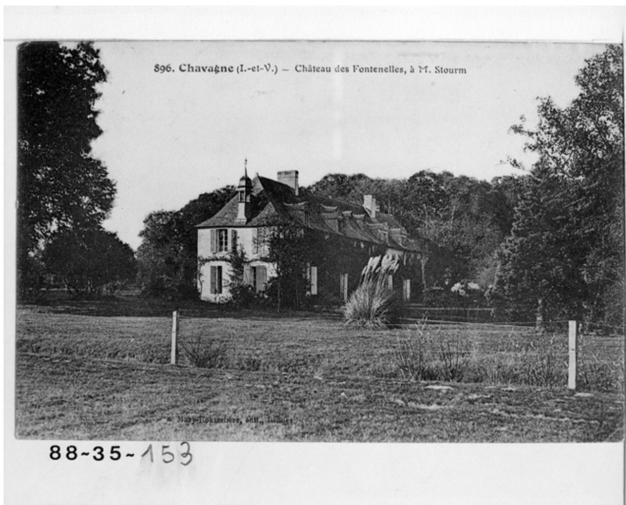
Fonds Lagrée - Carte postale ancienne - 896 - Chavagne (I.-&V.) - Château des Fontenelles.