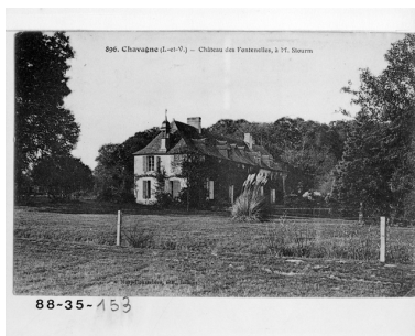
Carte postale ancienne - 896 - Chavagne (I.- &-V.) - Château des Fontenelles.