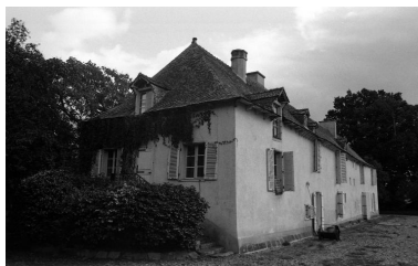
Façade nord : vue générale en 1974 IVR53_19743505317Z