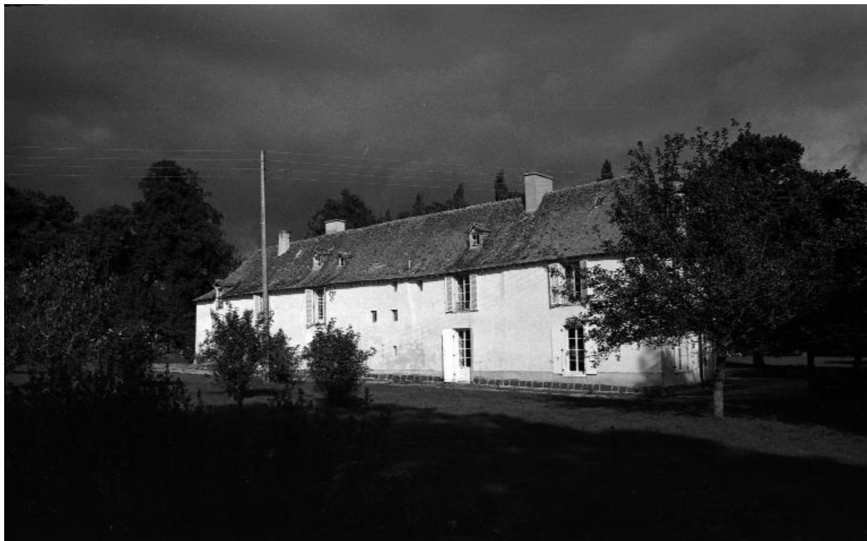
Façade ouest : vue générale en 1974