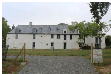
Façade est : vue générale IVR53_20163505768NUCA