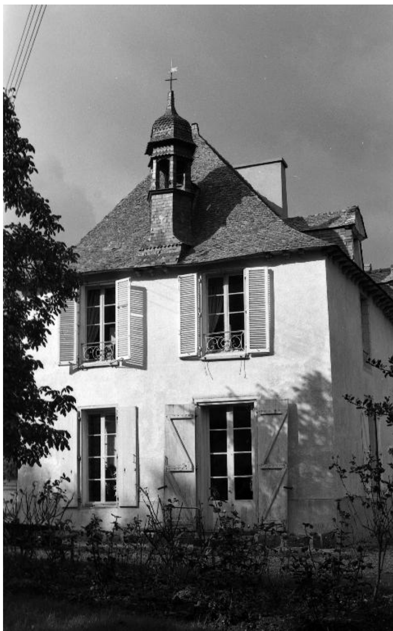
Façade sud : vue générale en 1974