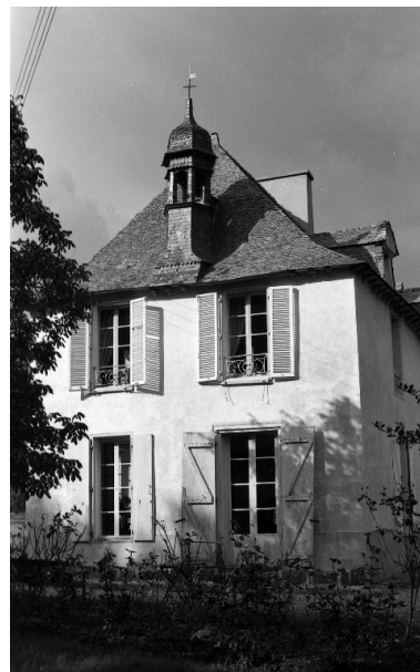
Façade sud : vue générale en 1974