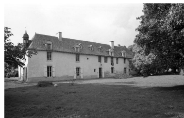
Façade est : vue générale en 1974 IVR53_19743505315Z