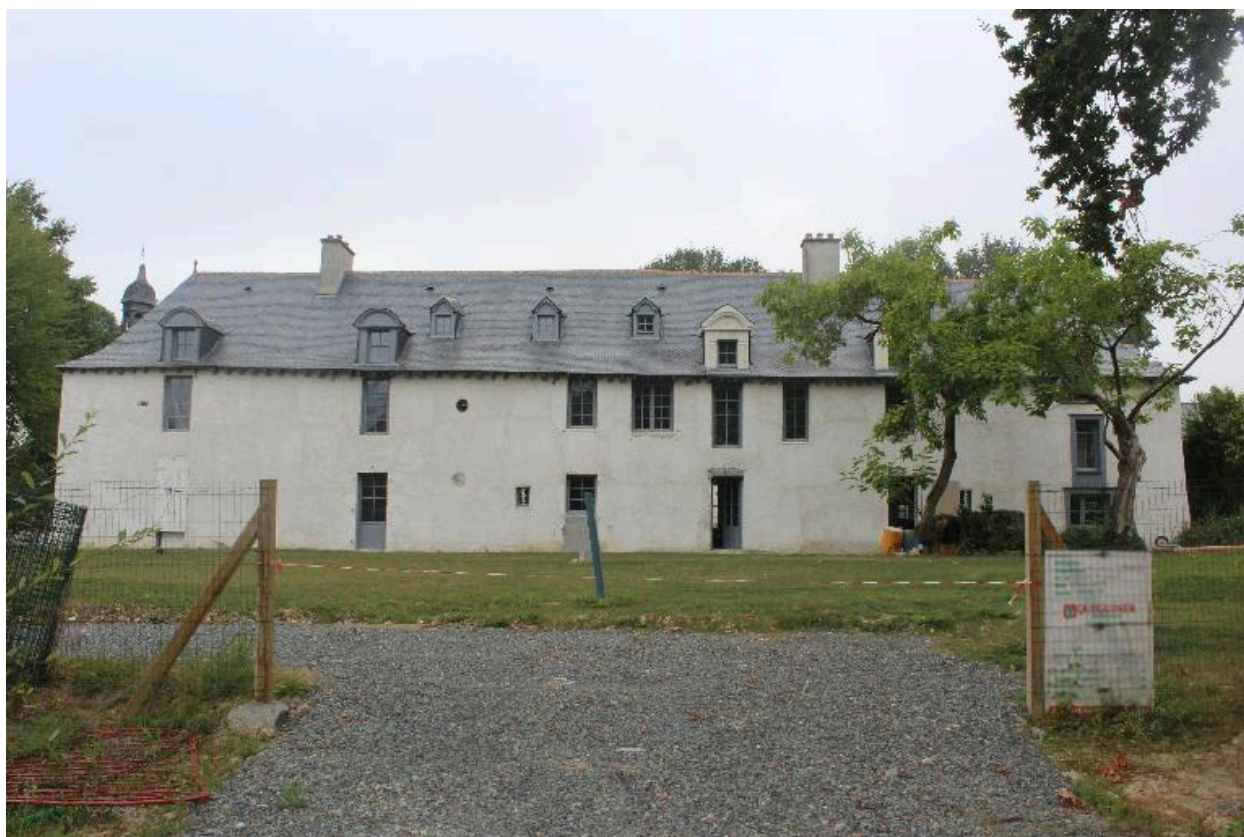
Façade est : vue générale