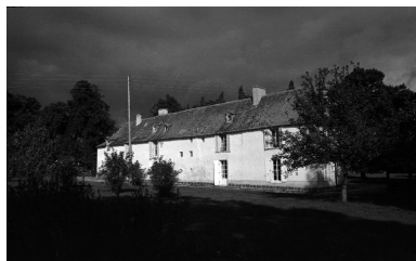
Façade ouest : vue générale en 1974