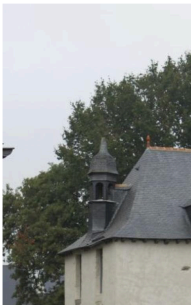
Façade sud : détail du clocheton IVR53_20163505769NUCA