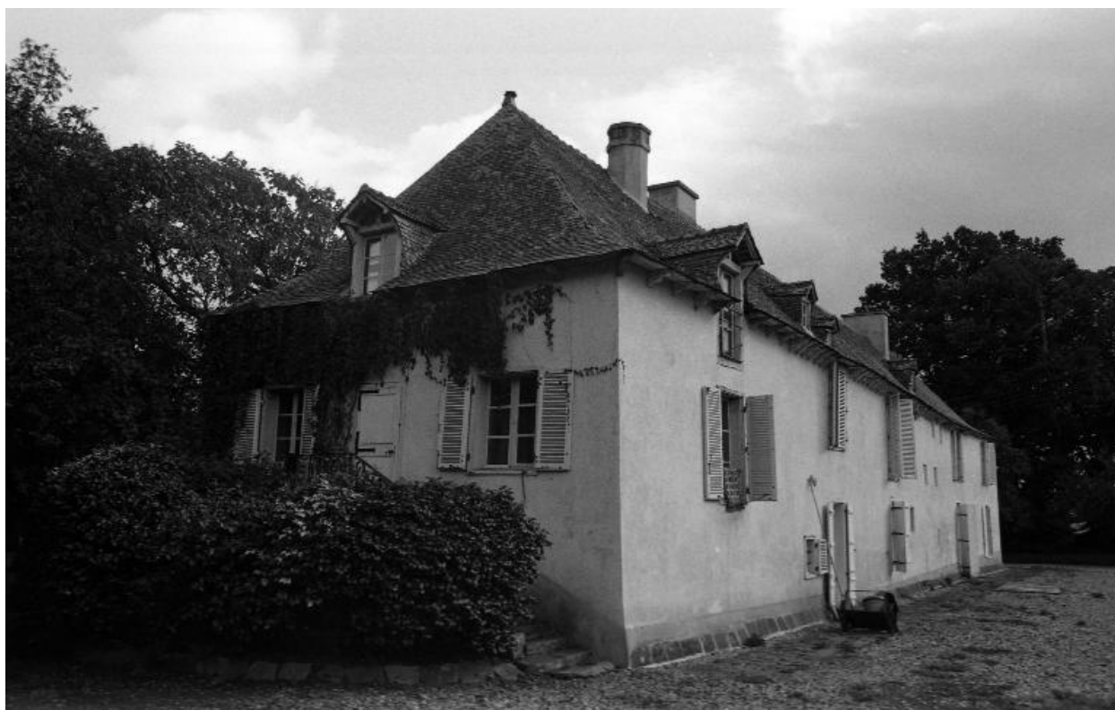
Façade nord : vue générale en 1974