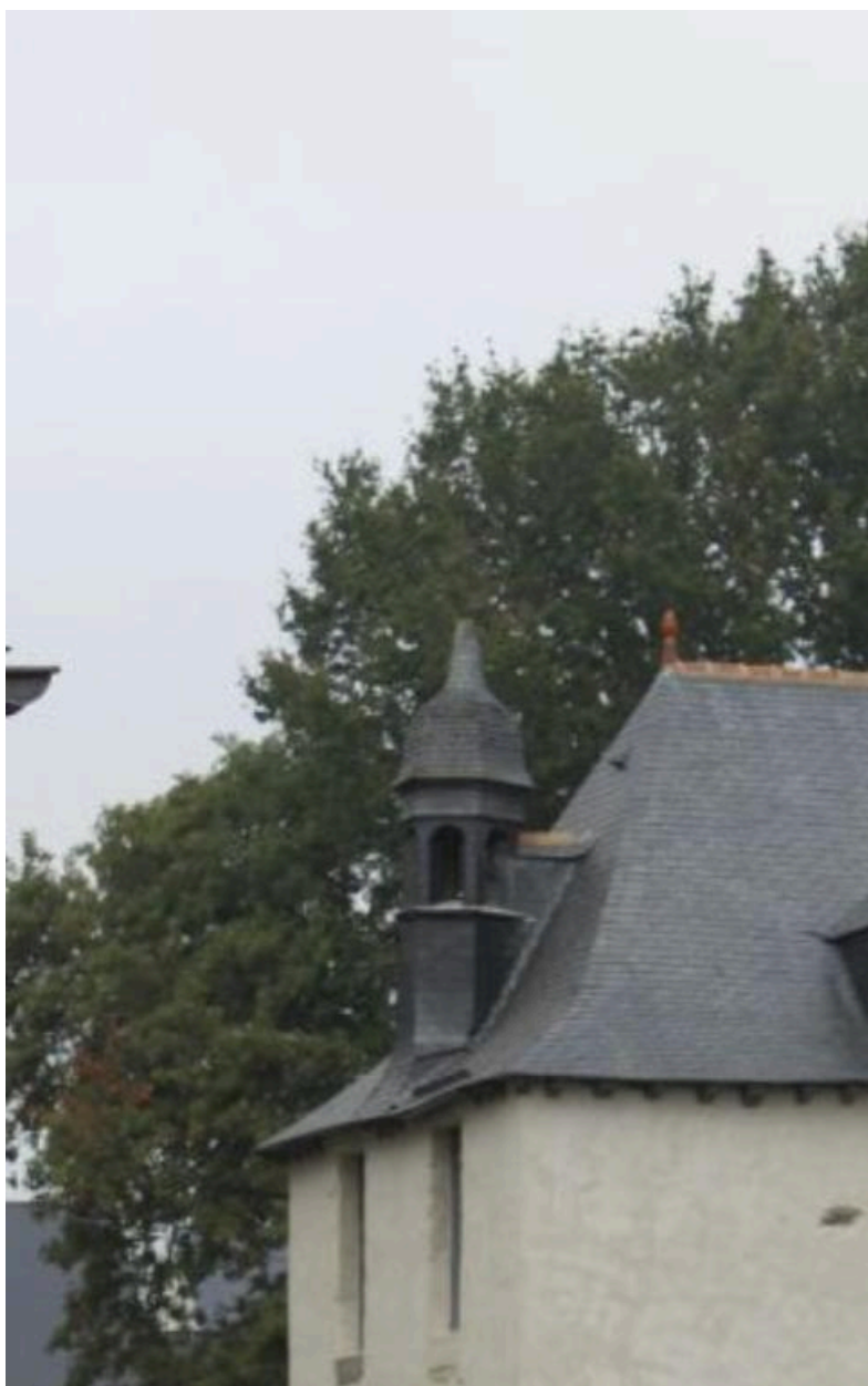
Façade sud : détail du clocheton