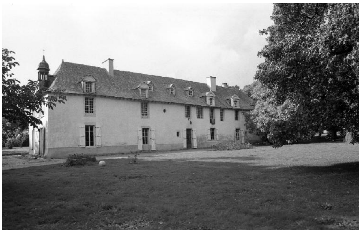
Façade est : vue générale en 1974