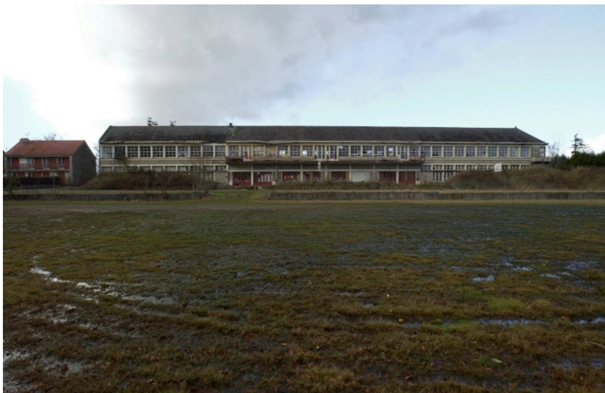
L'aérium : vue générale sud