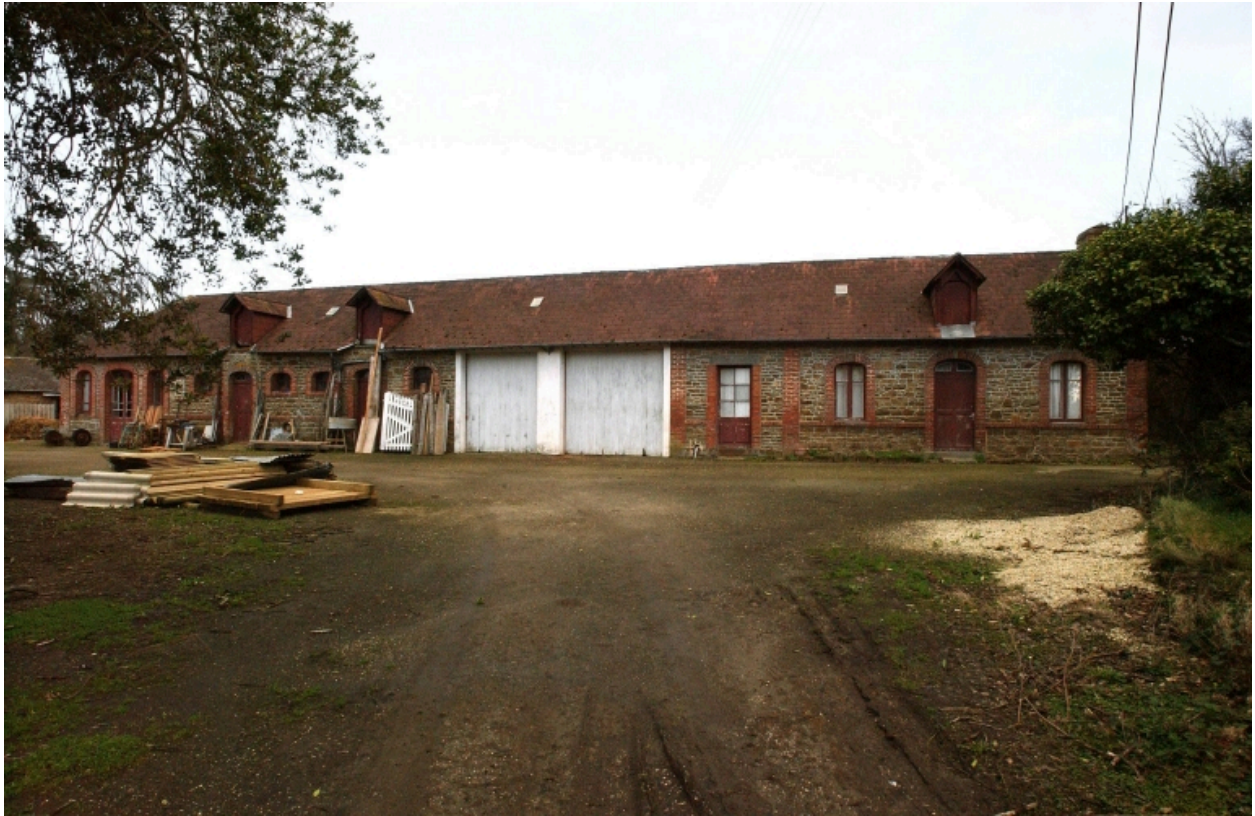
Les communs : vue générale ouest