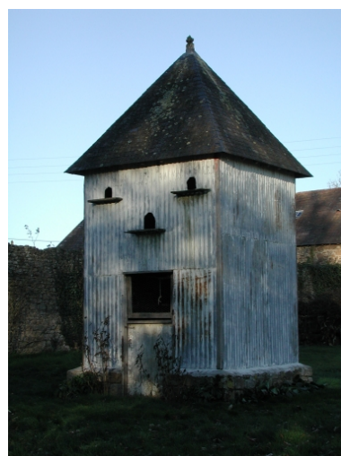
Le pigeonnier en tôle IVR53_20013517737NUCA