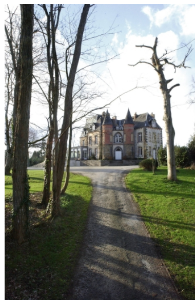
Le château : vue générale sud-est IVR53_20023502549NUCA