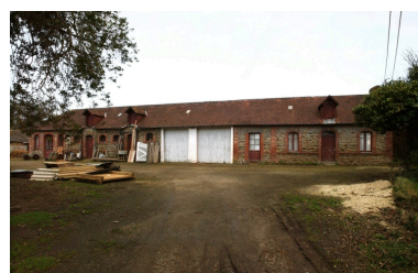
Les communs : vue générale ouest