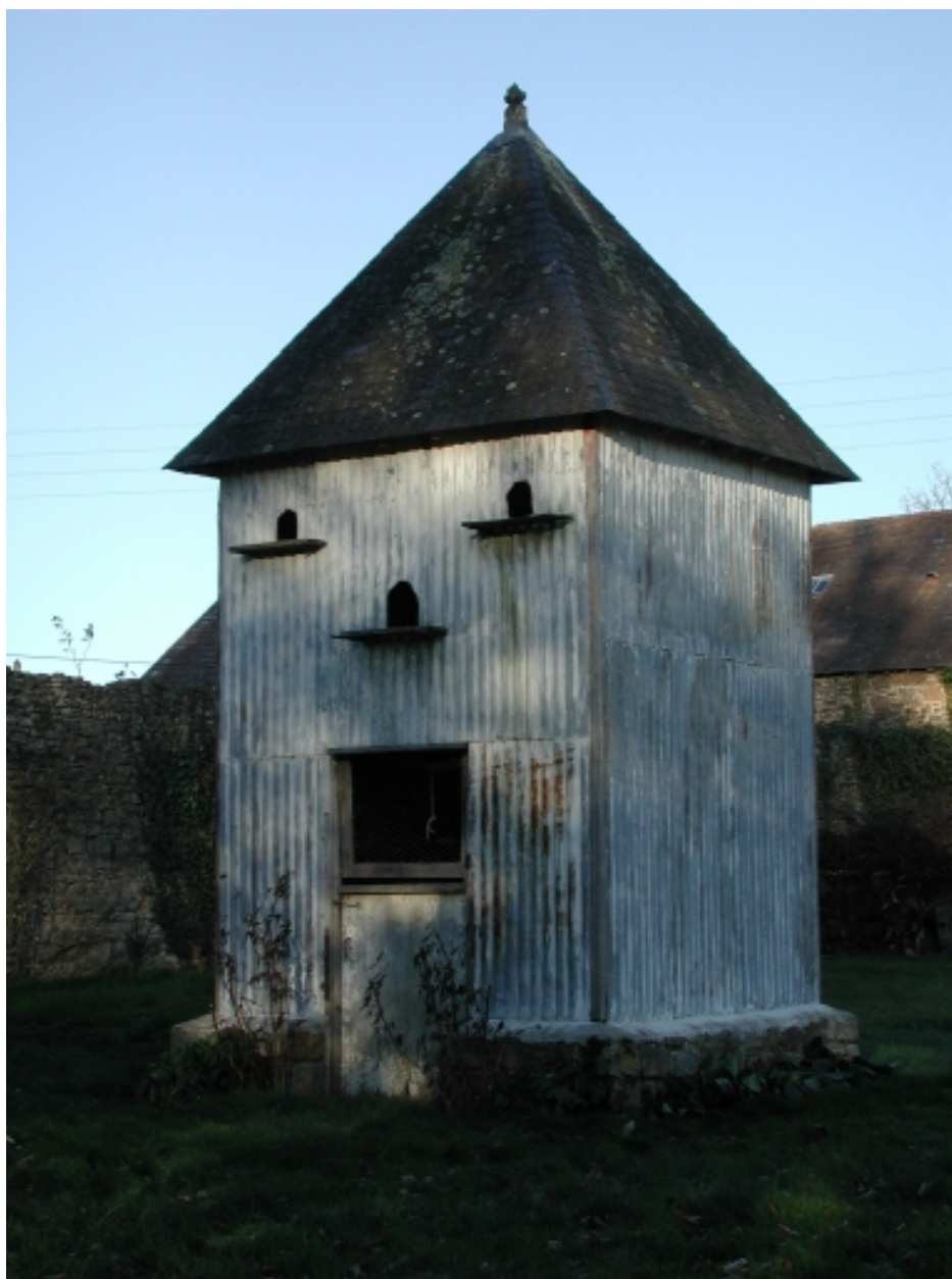
Le pigeonnier en tôle