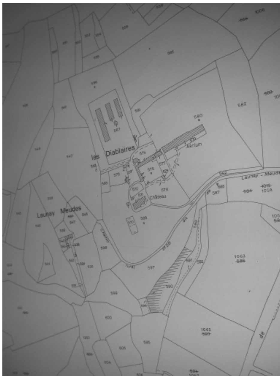
Extrait du cadastre de 1982