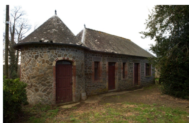
L'ancienne buanderie