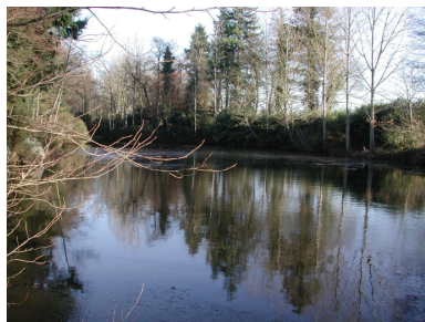
L'étang des Diablares