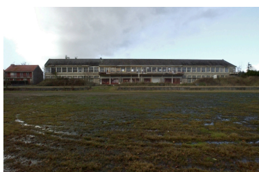
L'aérium : vue générale sud IVR53_20023502548NUCA