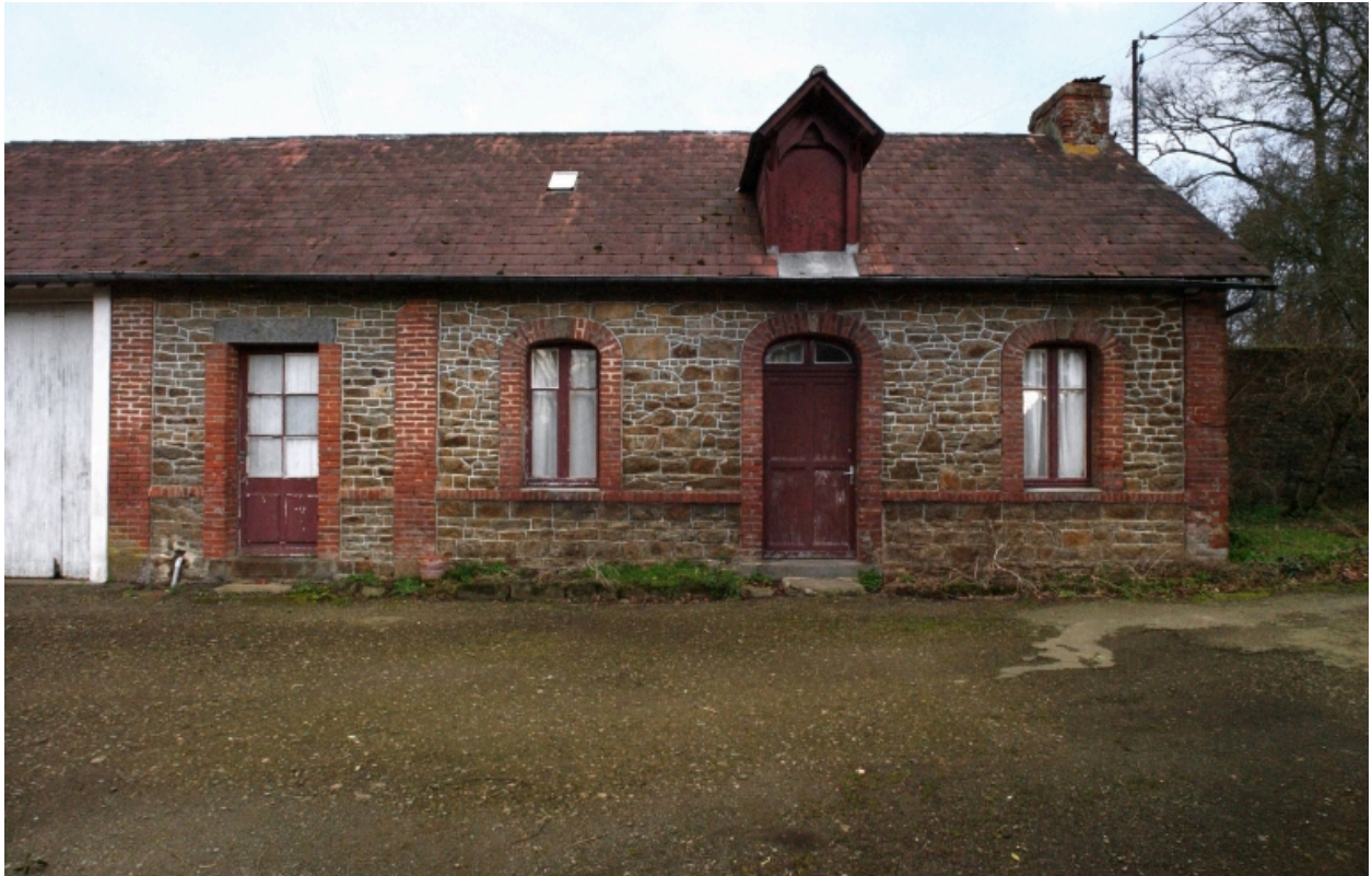
Le logement secondaire : vue générale ouest