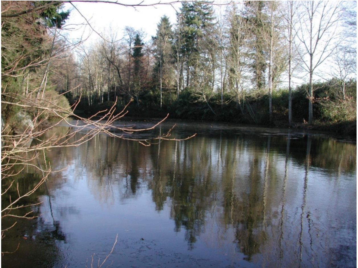
L'étang des Diablares