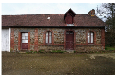
Le logement secondaire : vue générale ouest IVR53_20023502545NUCA