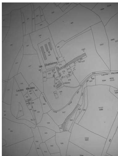
Extrait du cadastre de 1982