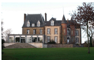
Le château : vue générale sud