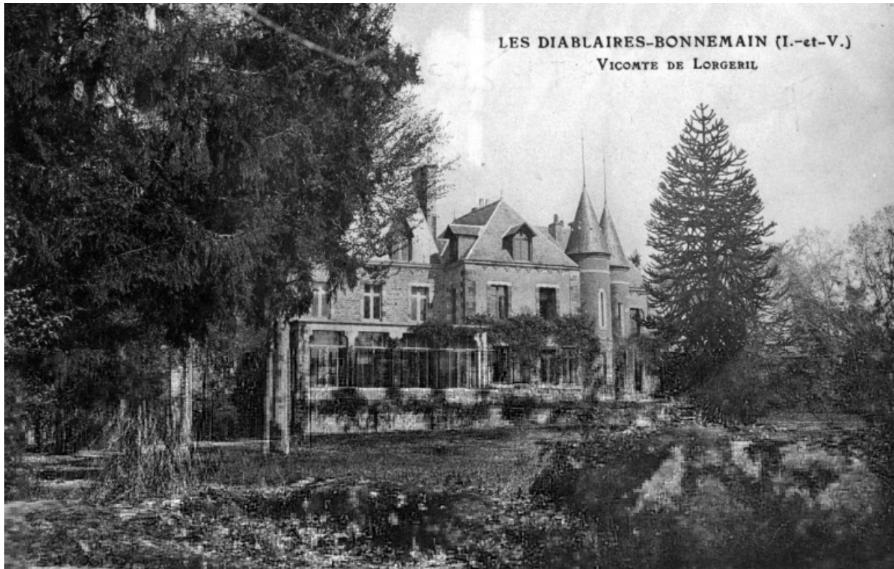
Le château au début du siècle