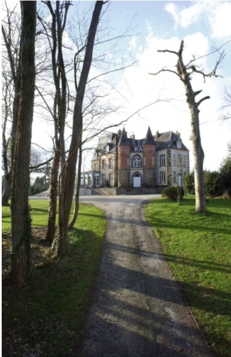
Le château : vue générale sud-est