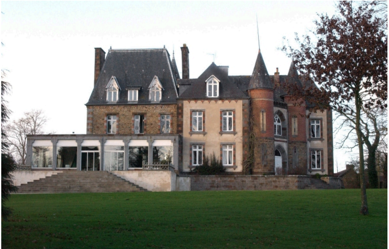
Le château : vue générale sud