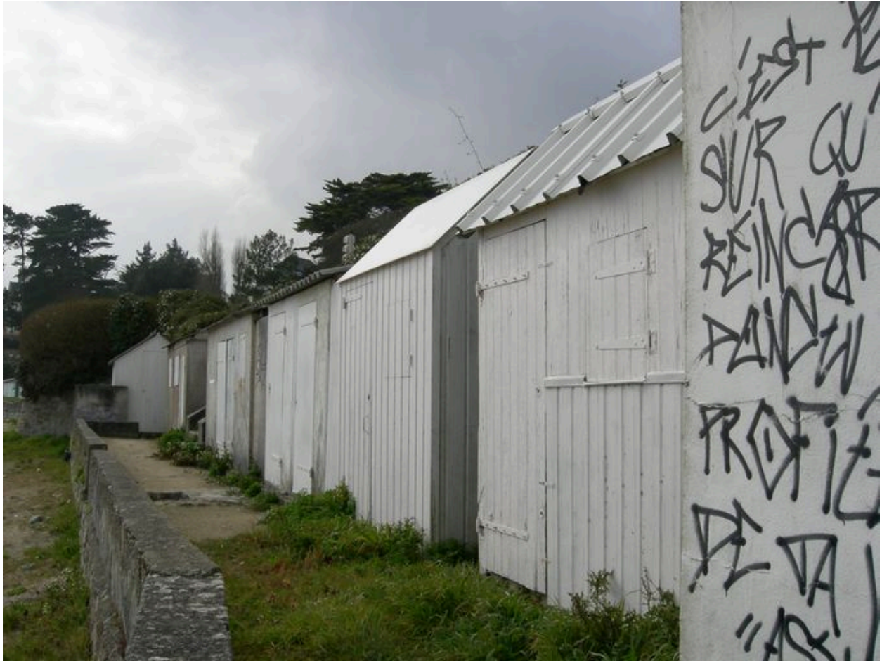
Cabines de bain