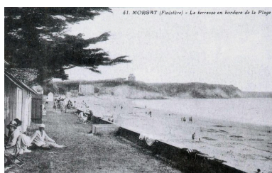
Carte postale 1920 : la terrasse en bordure de plage IVR53_20072908786NUC