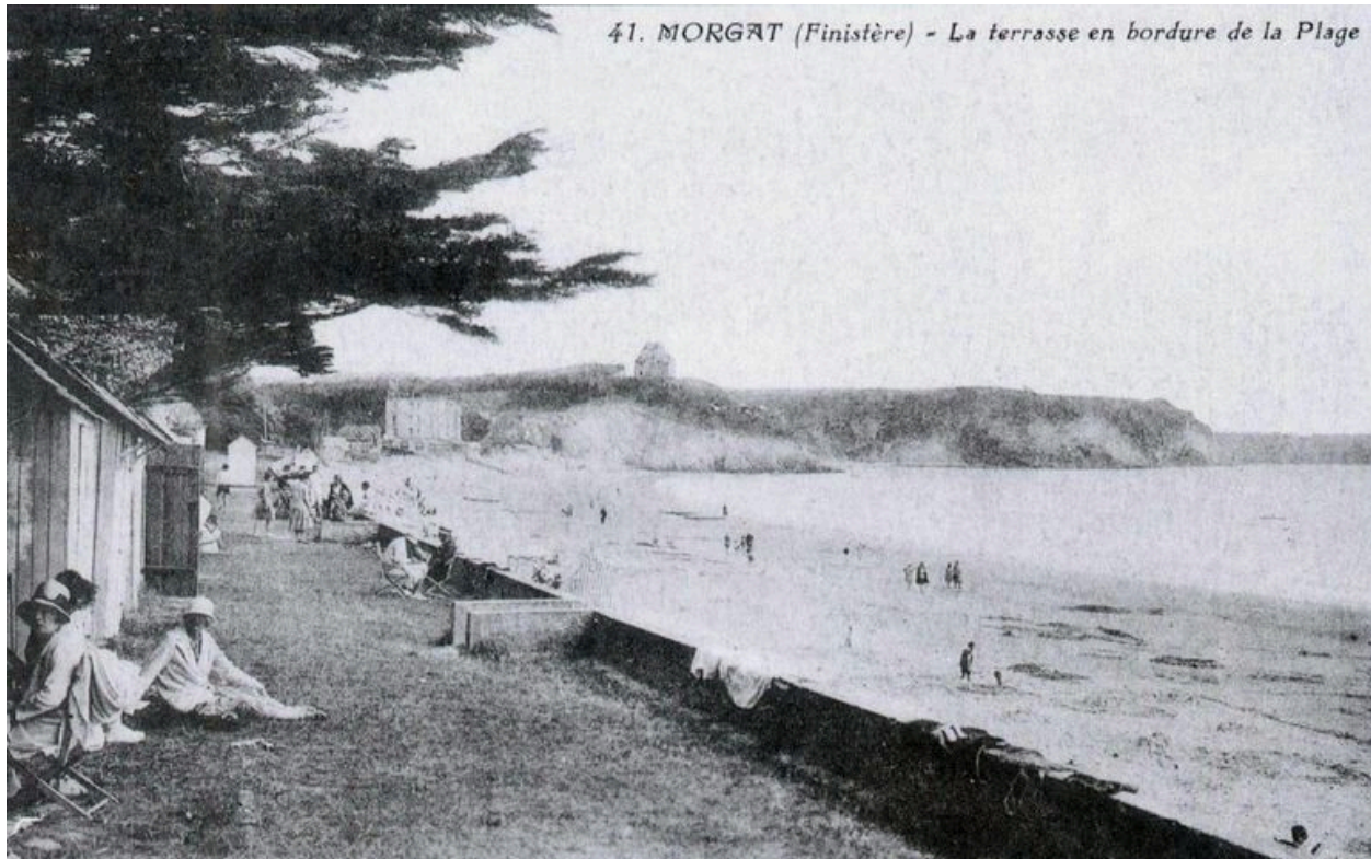
Carte postale 1920 : la terrasse en bordure de plage