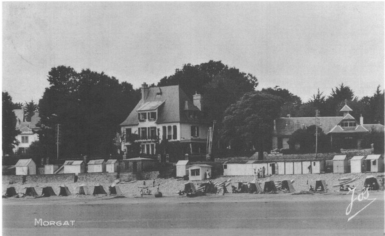
Carte postale ancienne