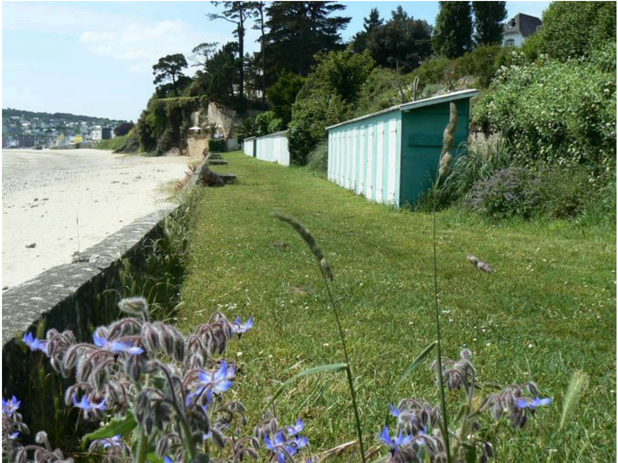
Vue générale des cabines