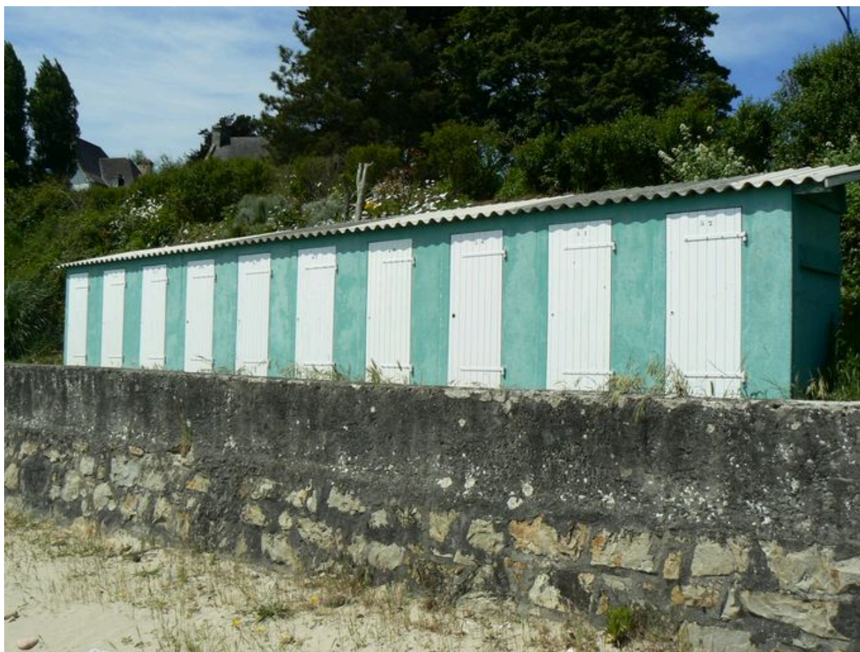
Cabines de bain