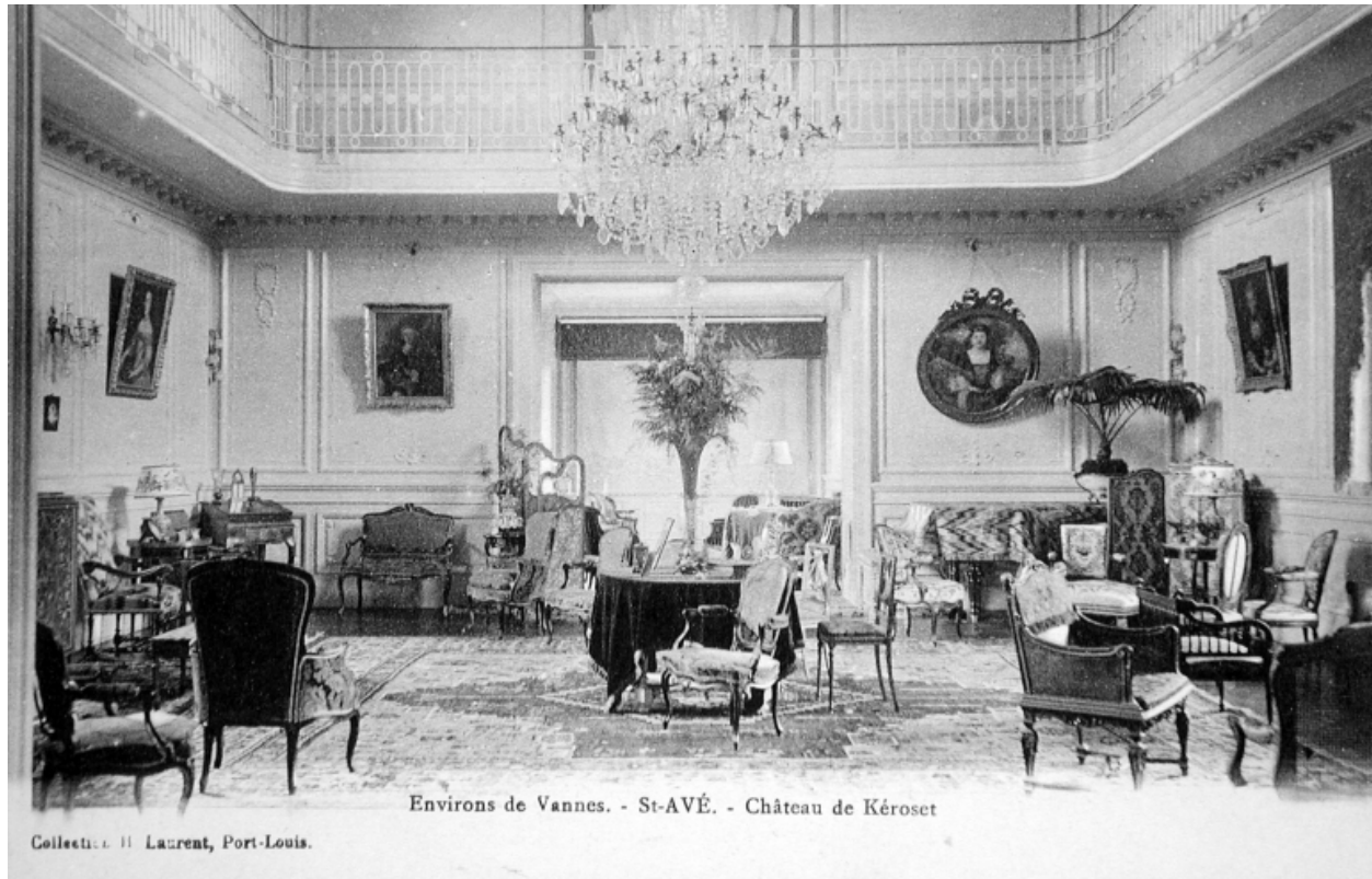
Environs de Vannes. - St-AVÉ. - Château de Kérozet