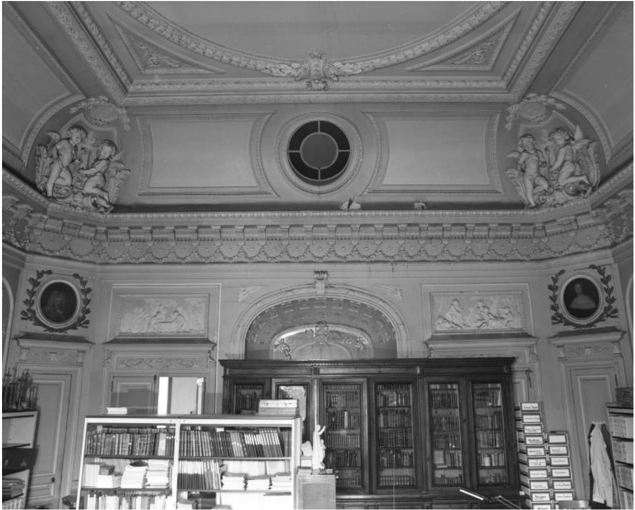
Vue de l'étage supérieur du grand salon