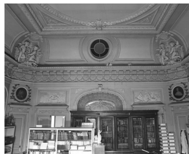
Vue de l'étage supérieur du grand salon IVR53_19885600856X