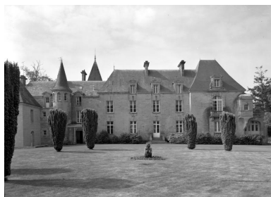
Façade antérieure IVR53_19885601471V