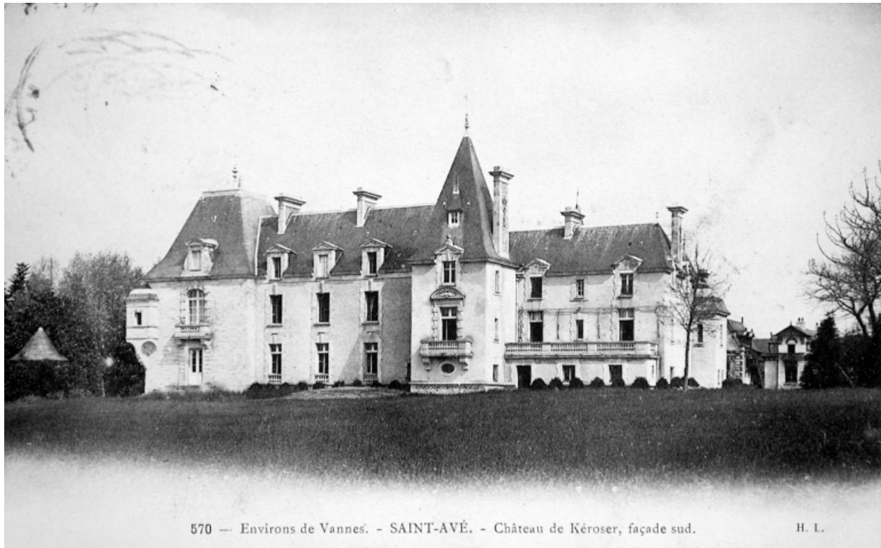
570 -- Environs de Vannes. - SAINT-AVÉ. - Château de Kérozer, façade sud.