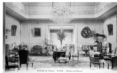
Vue intérieure : le hall IVR53_20045606222NUCB