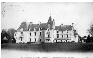
Vue générale de la façade sud IVR53_20045606223NUCB