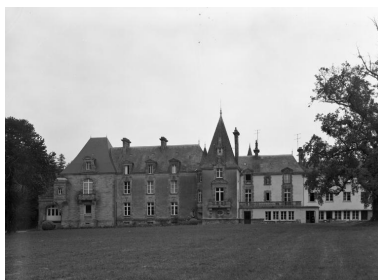
Façade postérieure