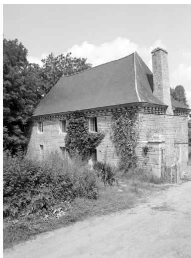
Ferme datée 1647, élévation sud. IVR53_19815600461X