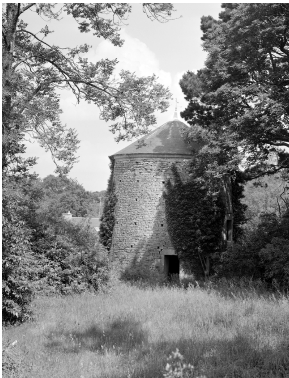
Colombier, vue sud.