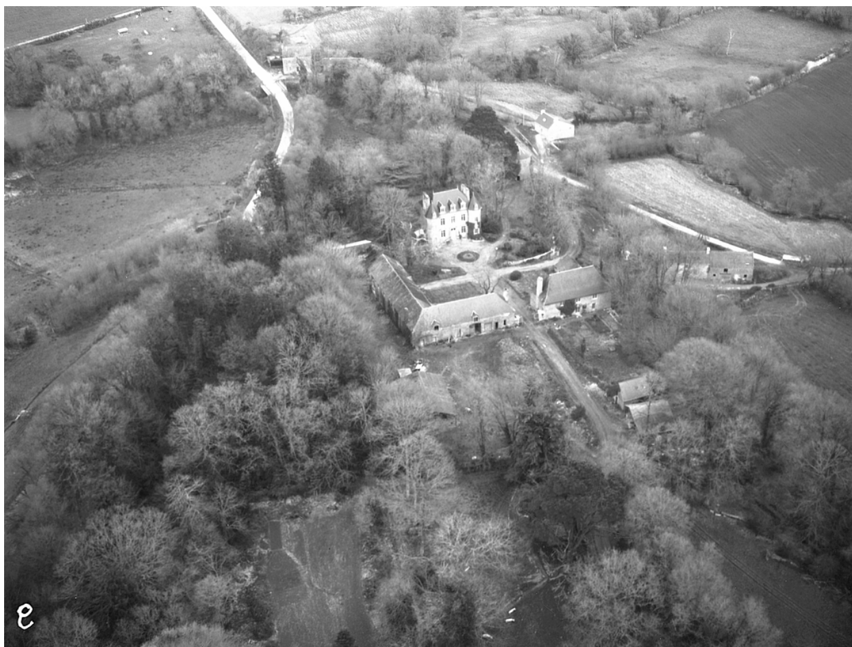
Vue aérienne sud