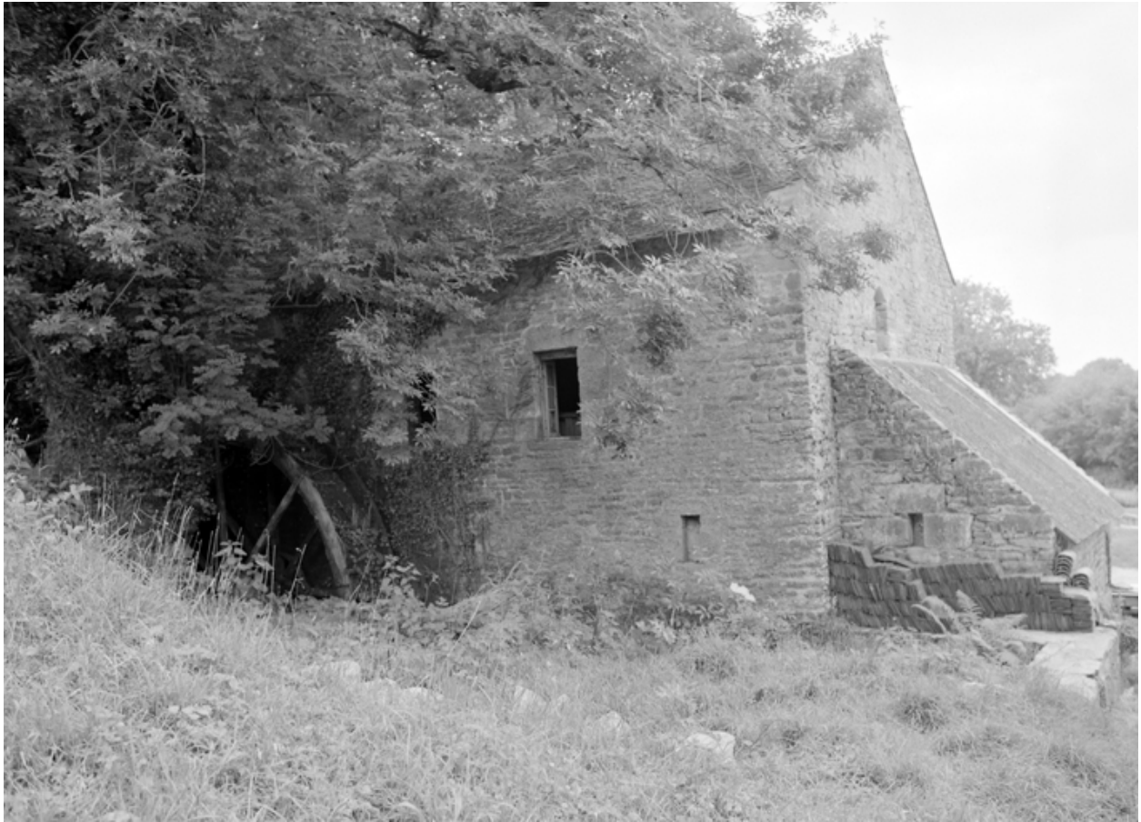
Moulin, vue prise du nord-ouest.