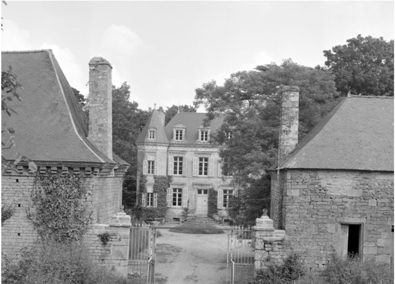
Portail d'entrée sud.