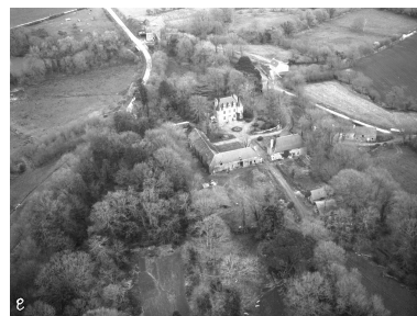
Vue aérienne sud