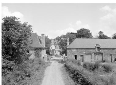
Vue de situation prise du sud. IVR53_19815600467X