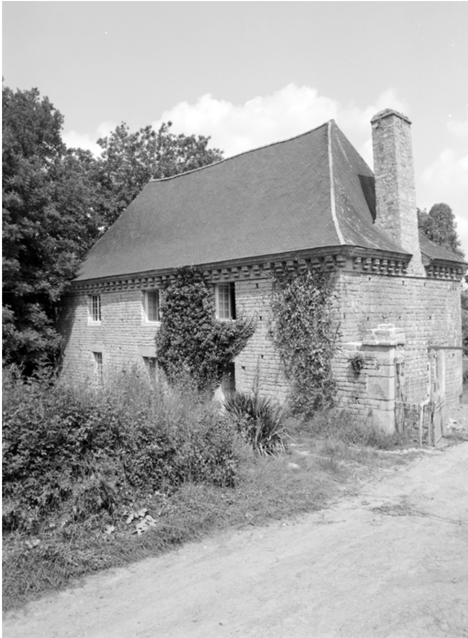
Ferme datée 1647, élévation sud.