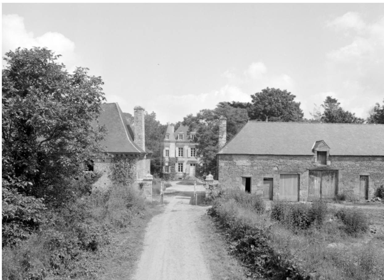
Vue de situation prise du sud.