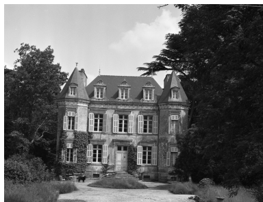
Elévation antérieure.