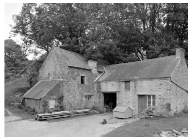
Moulin, vue est. IVR53_19815600470X