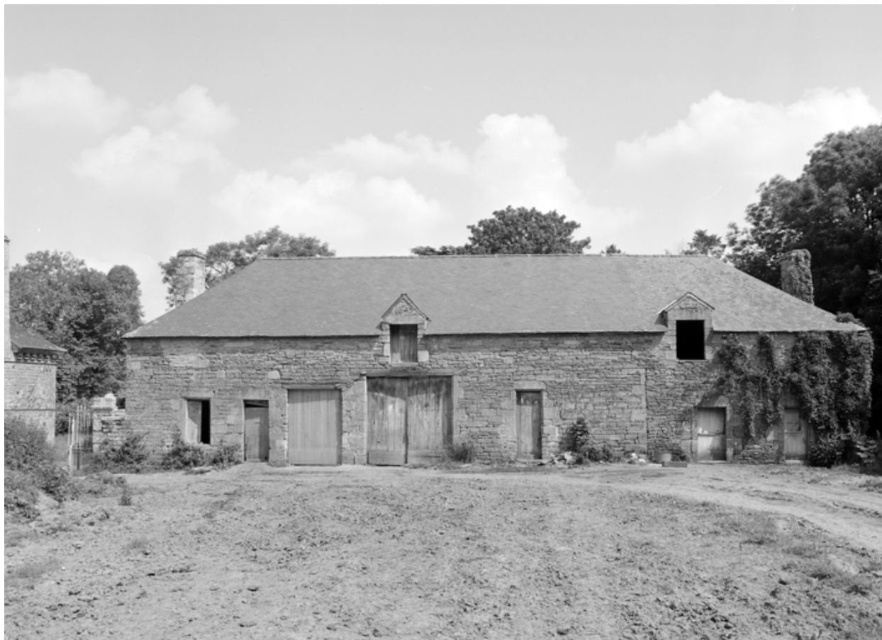
Communs, partie est, élévation sud.