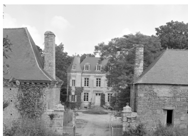
Portail d'entrée sud.