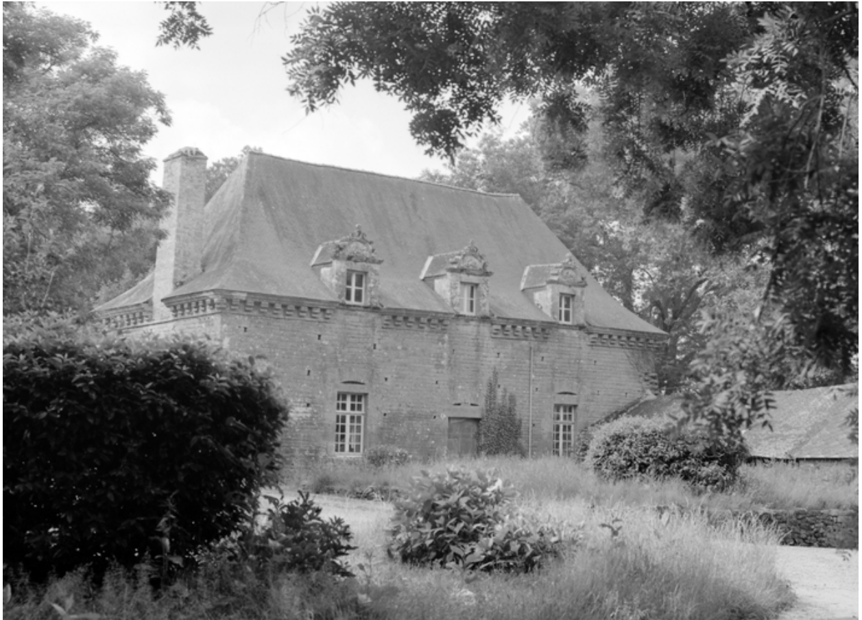
Ferme datée 1647, élévation sud.