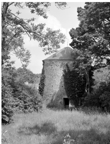
Colombier, vue sud. IVR53_19815600465X