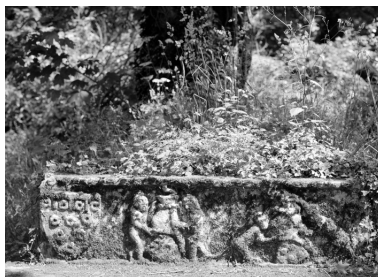
Pierre sculpté provenant de l'ancien manoir.