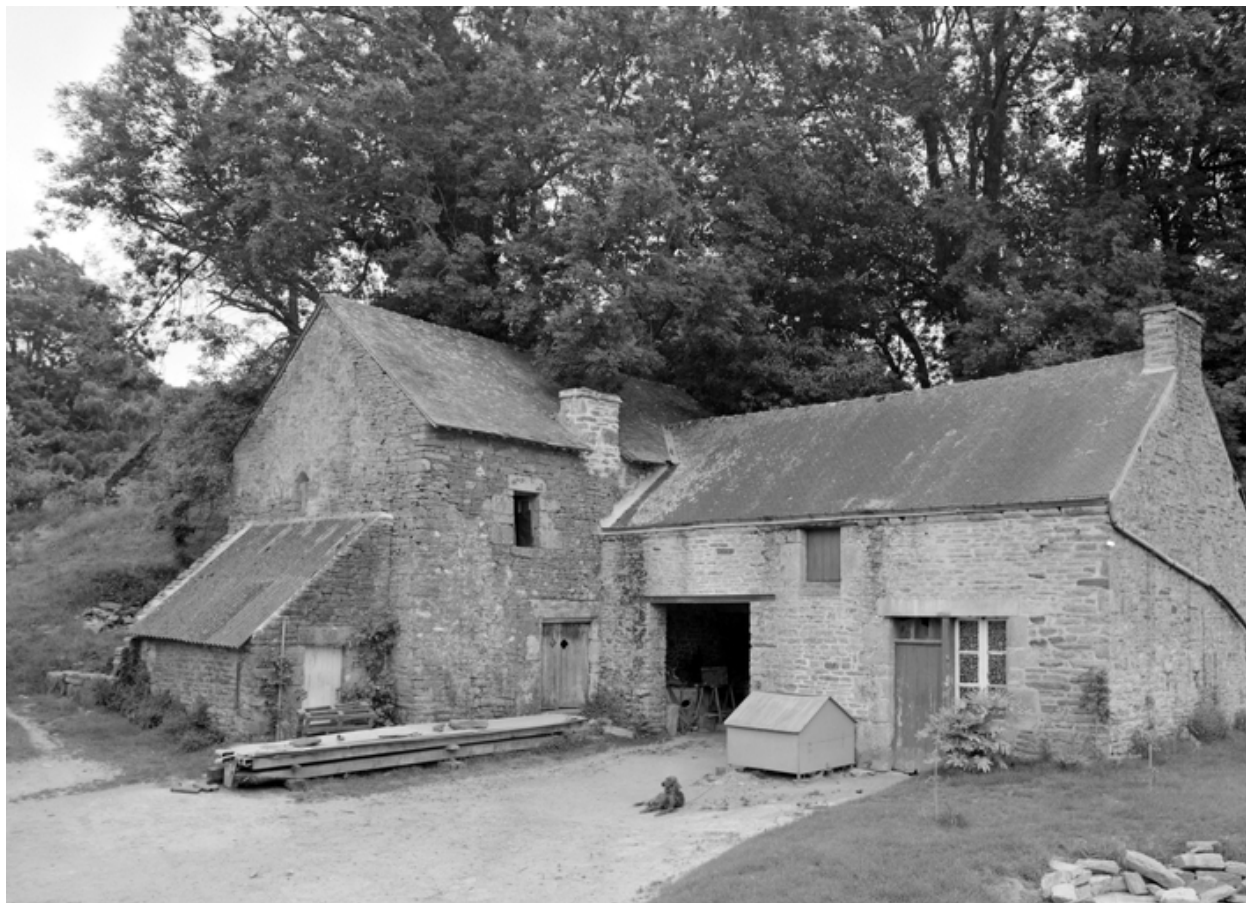
Moulin, vue est.