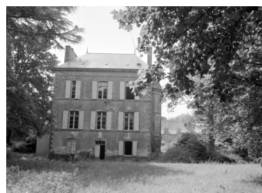
Elévation postérieure. IVR53_19815600466X