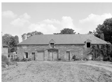
Communs, partie est, élévation sud.