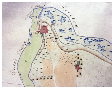
Extrait cadastral An XI.