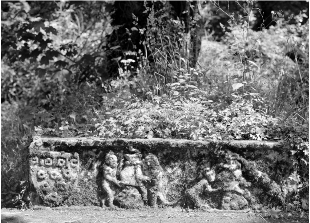
Pierre sculpté provenant de l'ancien manoir.