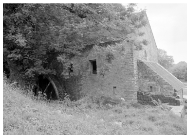
Moulin, vue prise du nord-ouest. IVR53_19815600469X