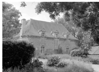
Ferme datée 1647, élévation sud.