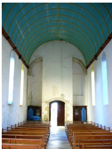
Leuhan, chapelle Notre-Dame-de-Lourdes : vue axiale ouest IVR53_20082905638NUCA