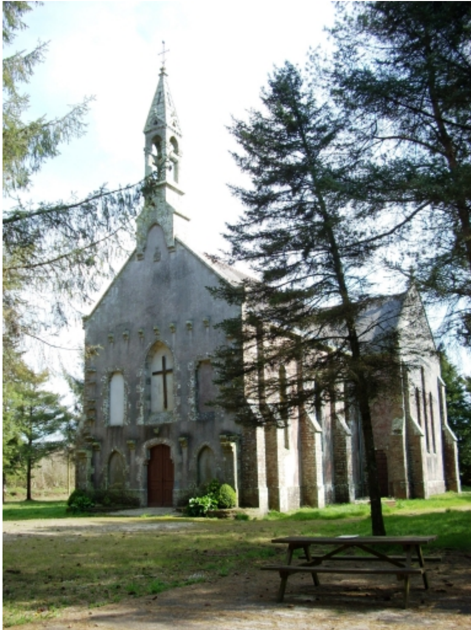
Leuhan, chapelle Notre-Dame-de-Lourdes : vue générale sud-ouest