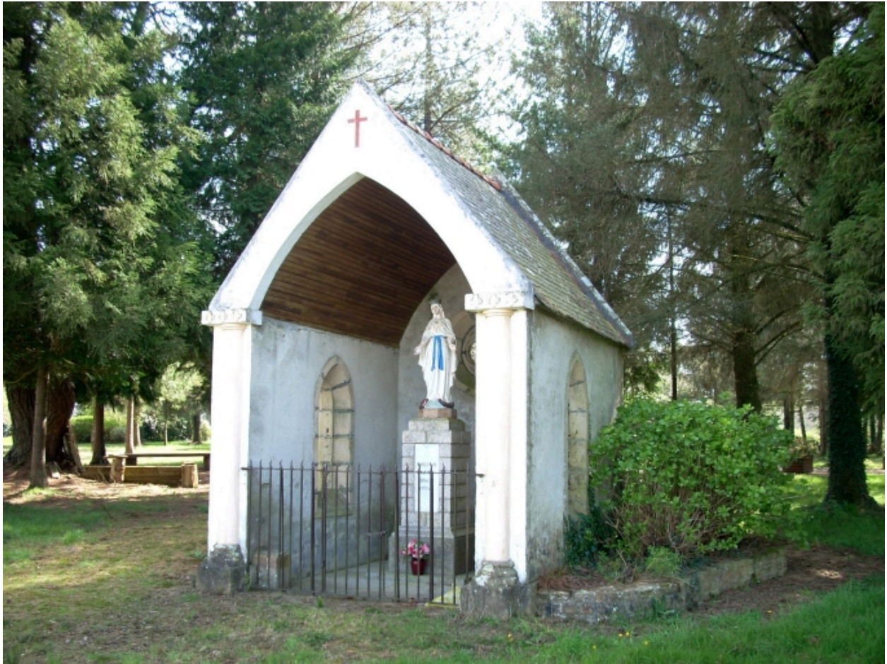
Leuhan, chapelle Notre-Dame-de-Lourdes : vue générale nord-ouest de l'oratoire