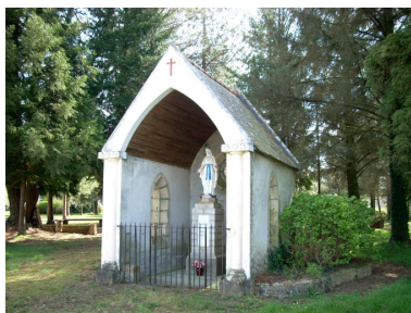
Leuhan, chapelle Notre-Dame-de-Lourdes : vue générale nord-ouest de l'oratoire