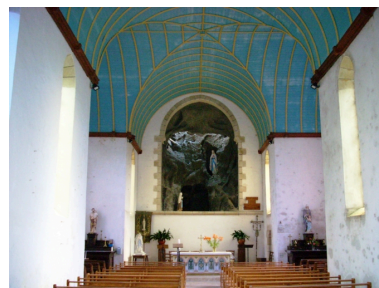
Leuhan, chapelle Notre-Dame-de-Lourdes : vue axiale est IVR53_20082905637NUCA