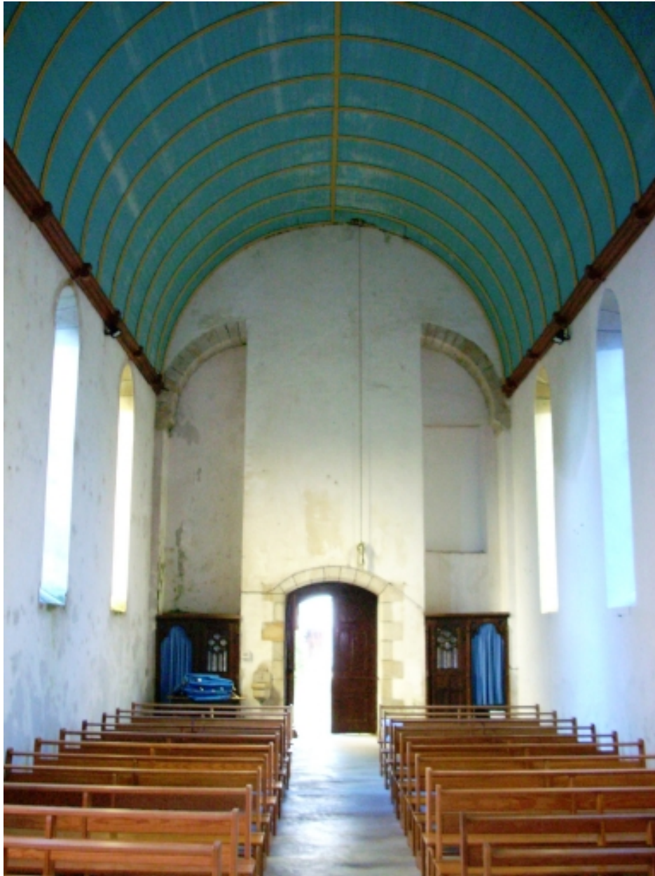
Leuhan, chapelle Notre-Dame-de-Lourdes : vue axiale ouest