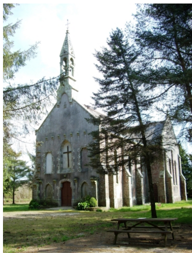
Leuhan, chapelle Notre-Dame-de-Lourdes : vue générale sud-ouest IVR53_20082905635NUCA