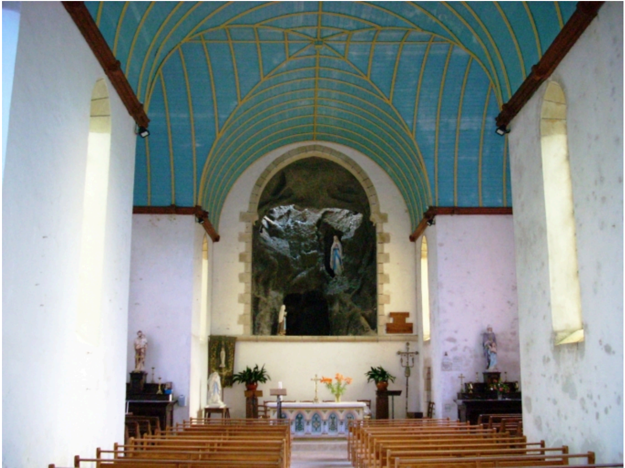
Leuhan, chapelle Notre-Dame-de-Lourdes : vue axiale est