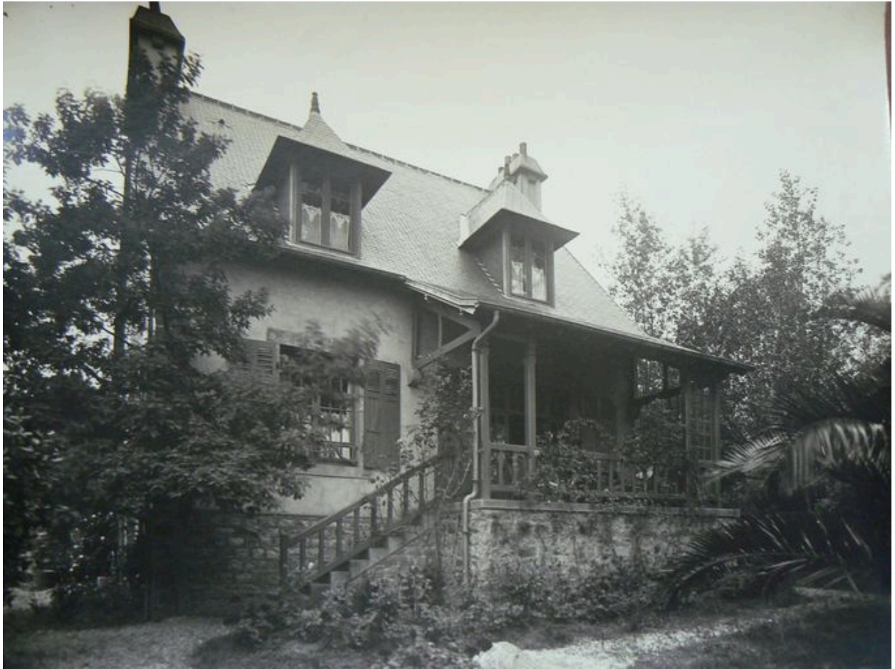
Vue ancienne de la villa Les Lilas