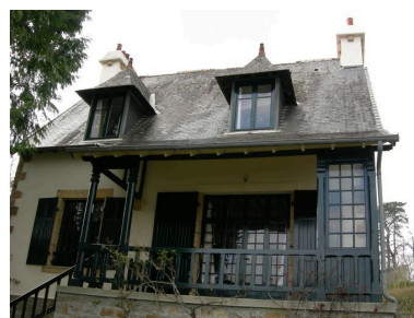
Villa Les Lilas