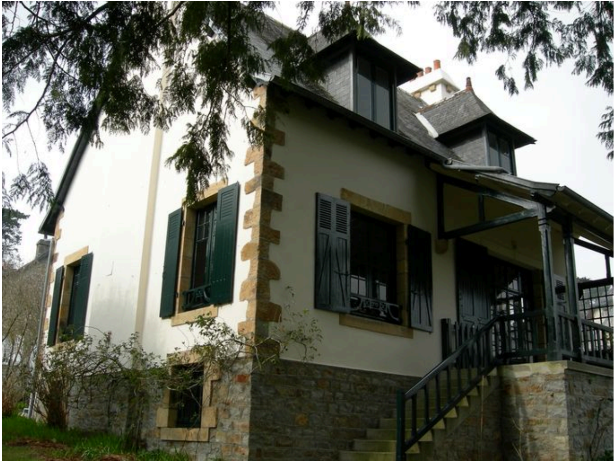
Vue générale de la villa Les Lilas