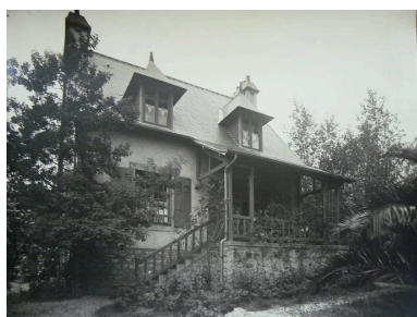
Vue ancienne de la villa Les Lilas