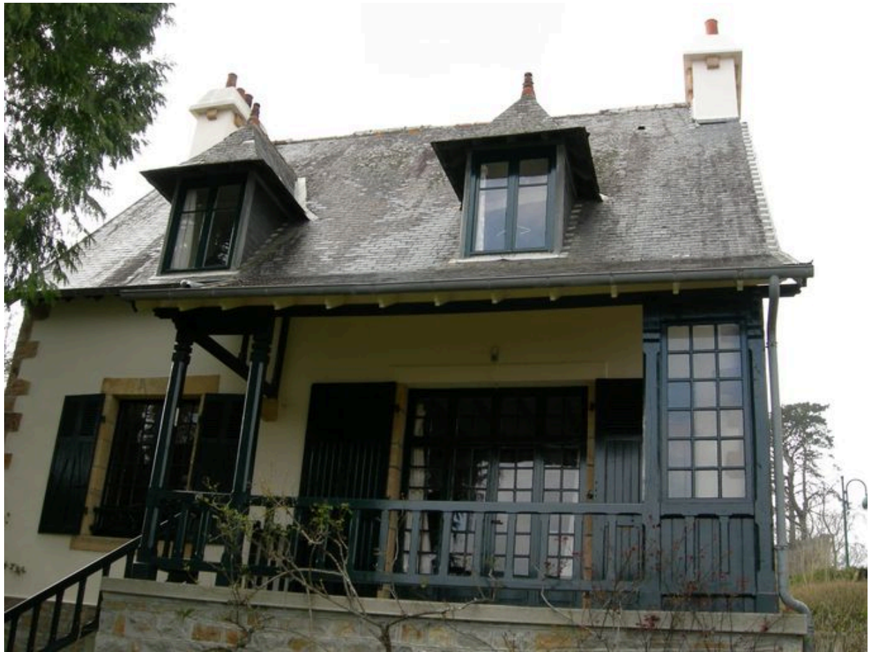
Villa Les Lilas