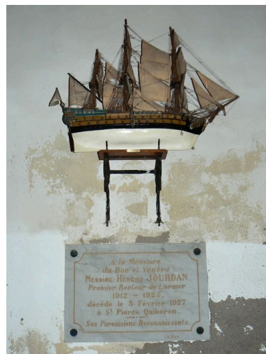
Ex-voto Notre-Dame-de-Larmor