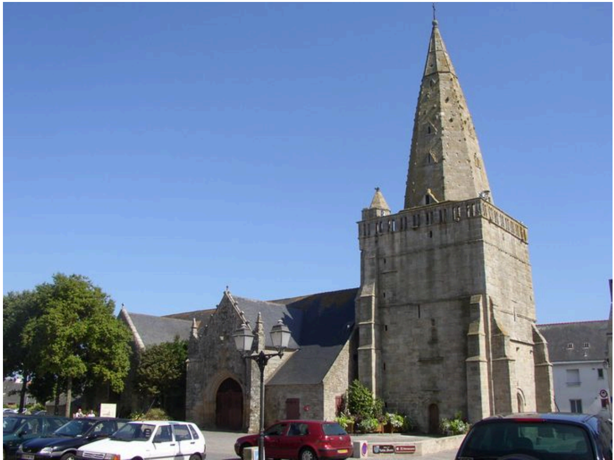
Vue générale de l'église Notre-Dame-de-Larmor