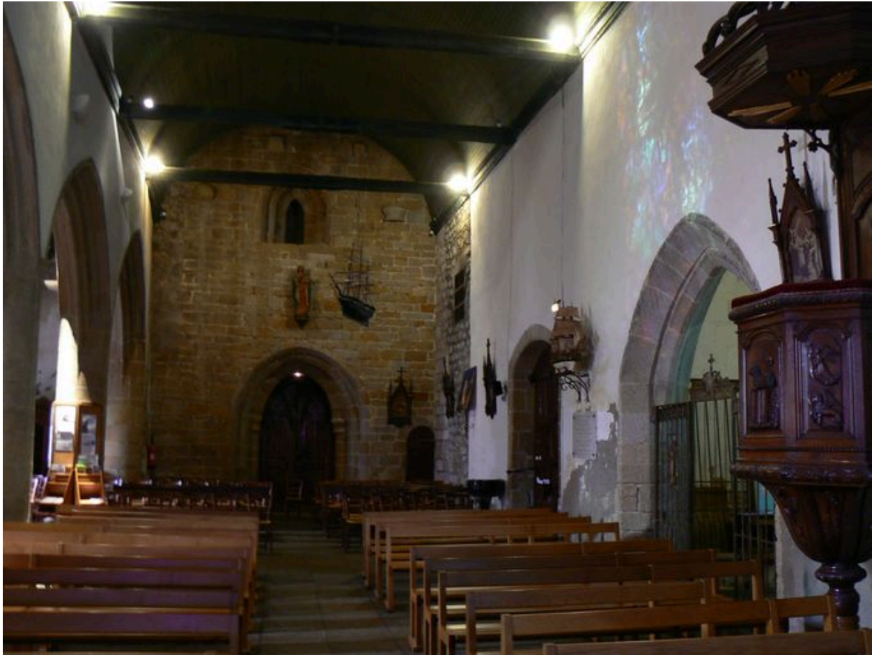
Intérieur de l'église Notre-Dame-de-Larmor