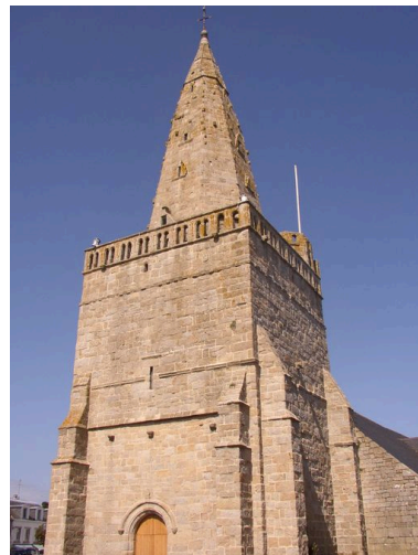
Tour de l'église Notre-Dame-de-Larmor