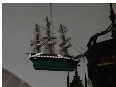
Ex-voto du Saint-Jean IVR53_20075605591NUCA