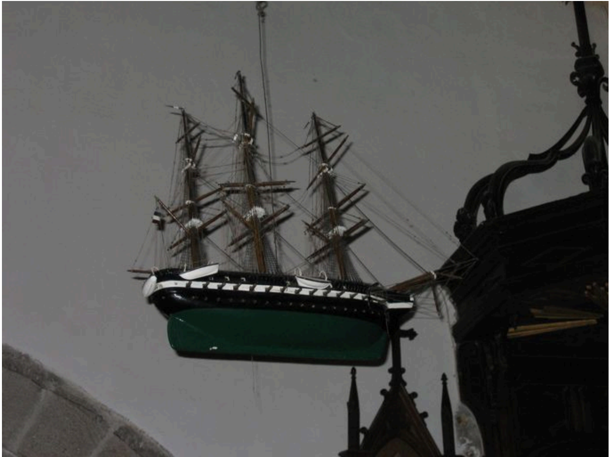
Ex-voto du Saint-Jean