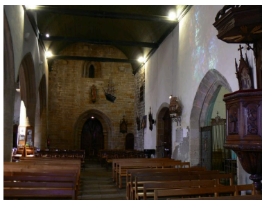
Intérieur de l'église Notre-Dame-de-Larmor IVR53_20075605589NUCA