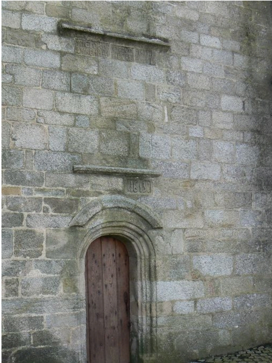
Détail du porche de l'église Notre-Dame-de-Larmor