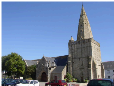
Vue générale de l'église Notre-Dame-de-Larmor