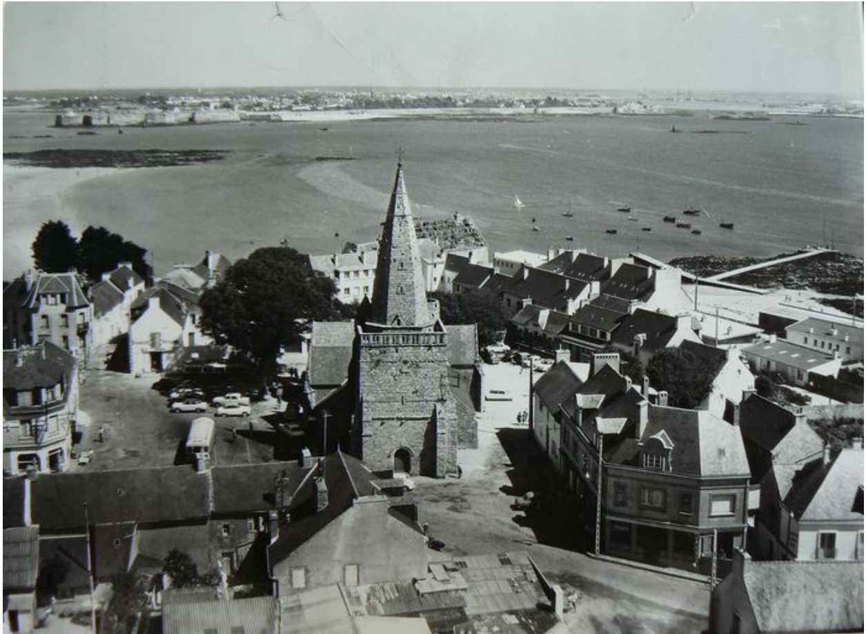
Vue de l'église Notre-Dame-de-Larmor à la fin des années 1950