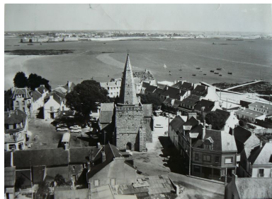
Vue de l'église Notre-Dame-de-Larmor à la fin des années 1950