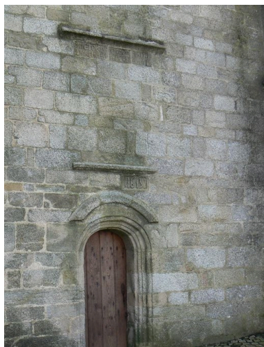
Détail du porche de l'église Notre-Dame-de-Larmor