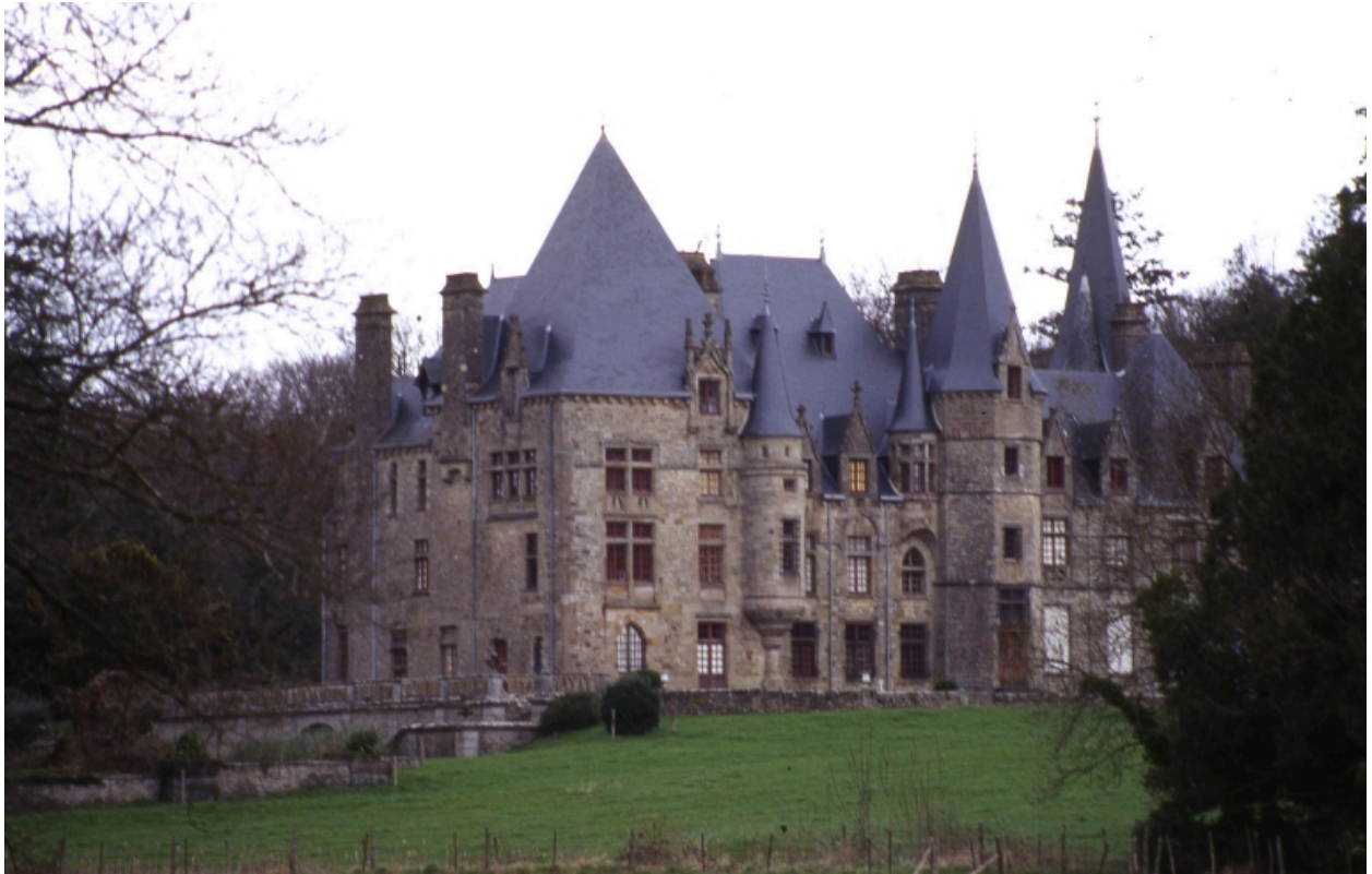
Vue générale de l'élévation sud du château