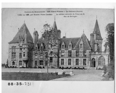
Façade sud : vue générale