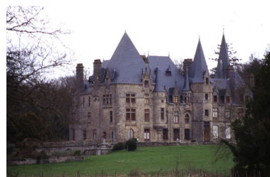
Vue générale de l'élévation sud du château IVR53_19943503116ZA