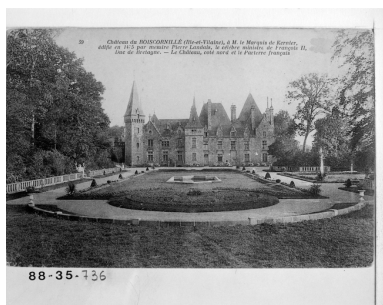
Façade nord et jardin : vue générale IVR53_19883500736X