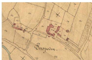
Extrait des plans cadastraux parcellaires de 1848 (AD 22) IVR53_20042206121NUCB

Vue générale IVR53_20042206111NUCA