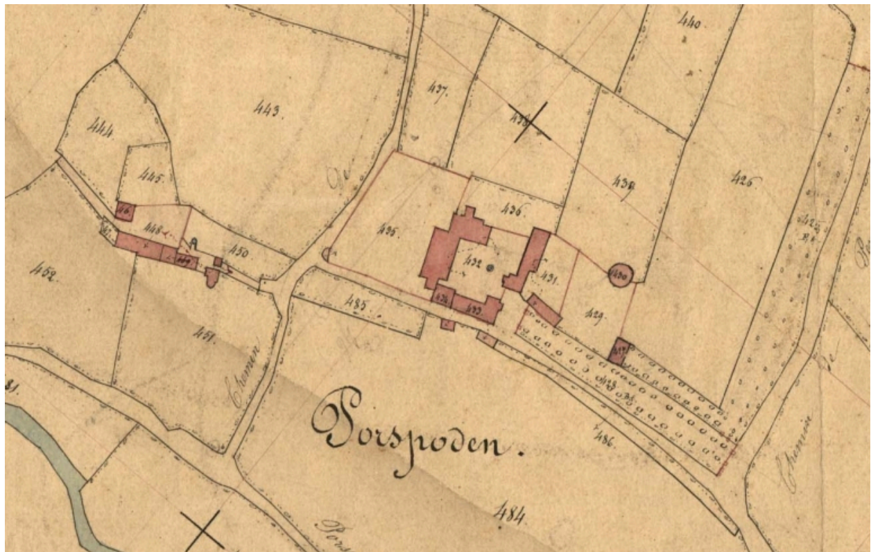
Extrait des plans cadastraux parcellaires de 1848 (AD 22)