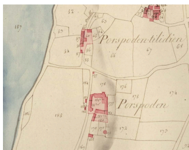
Extrait des plans cadastraux parcellaires de 1814 (AD 22)