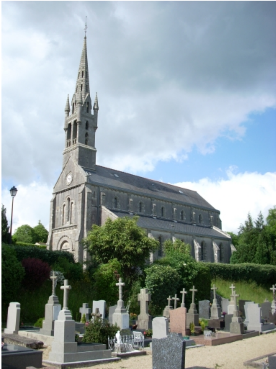
Eglise paroissiale Saint-Thénéan : vue générale sud-ouest