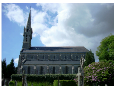
Eglise paroissiale Saint-Thénéan : vue générale sud IVR53_20082906055NUCA