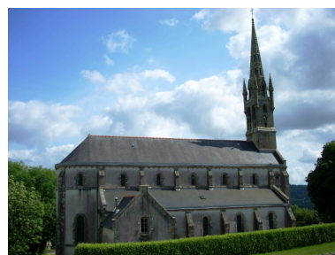
Eglise paroissiale Saint-Thénéan : vue générale nord-est IVR53_20082906056NUCA