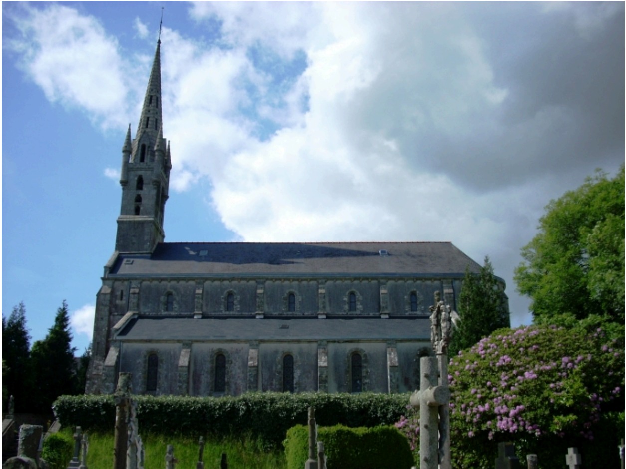
Eglise paroissiale Saint-Thénéan : vue générale sud