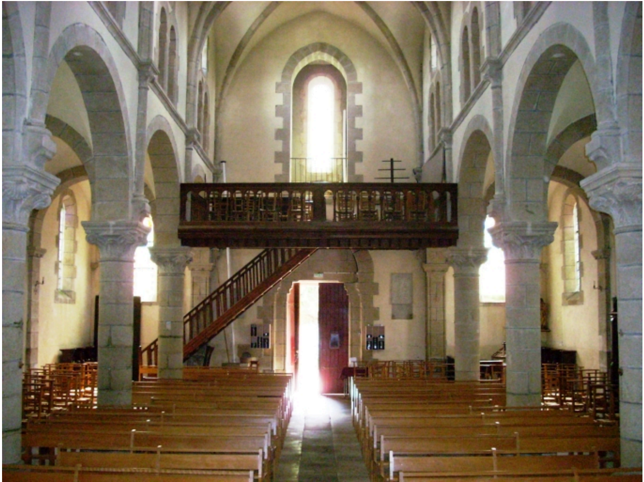
Eglise paroissiale Saint-Thénéan : vue axiale ouest