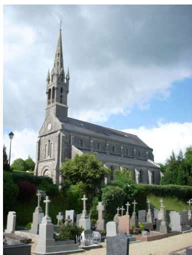
Eglise paroissiale Saint-Thénéan : vue générale sud-ouest IVR53_20082906054NUCA