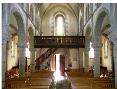
Eglise paroissiale Saint-Thénéan : vue axiale ouest IVR53_20082906058NUCA