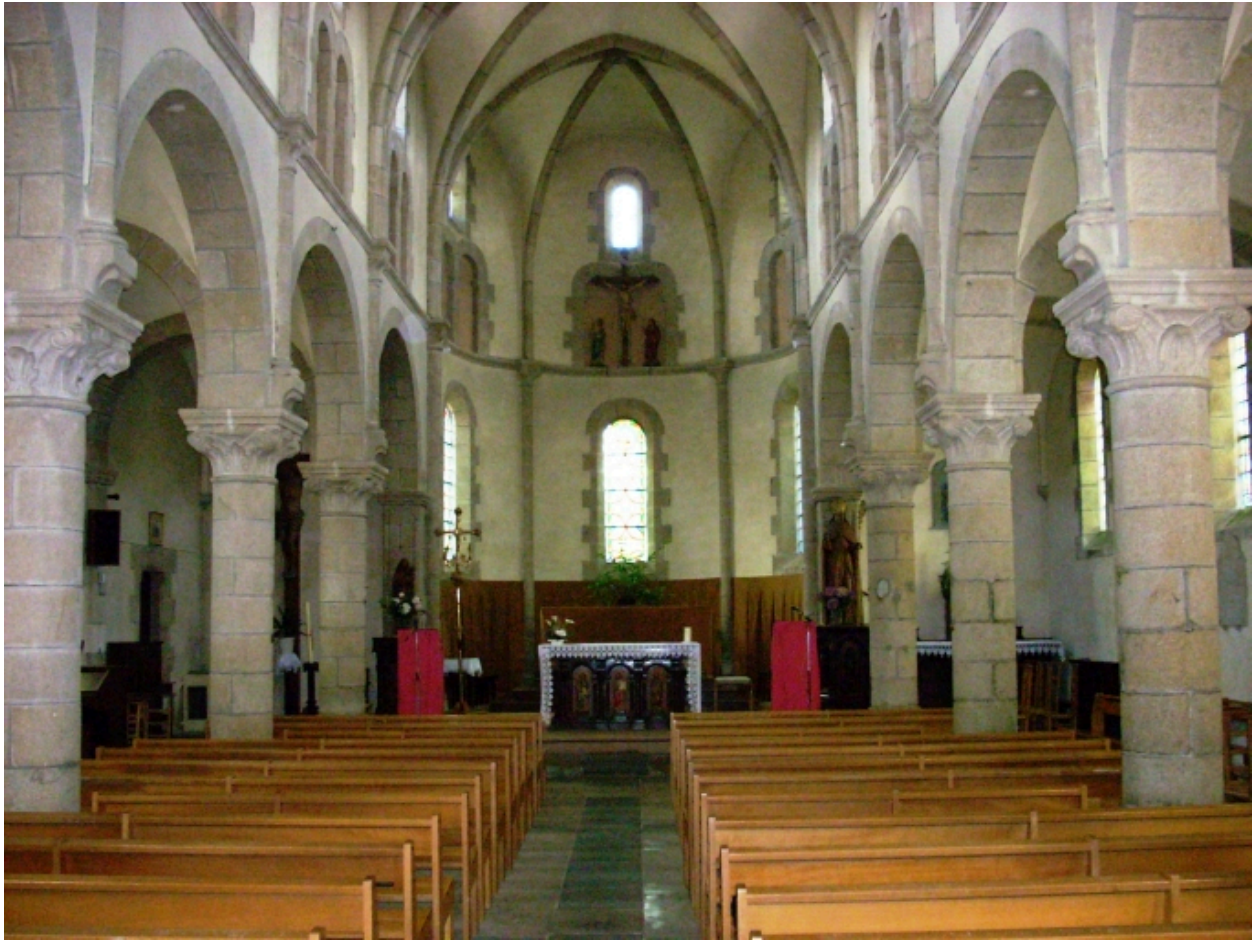
Eglise paroissiale Saint-Thénéan : vue axiale est