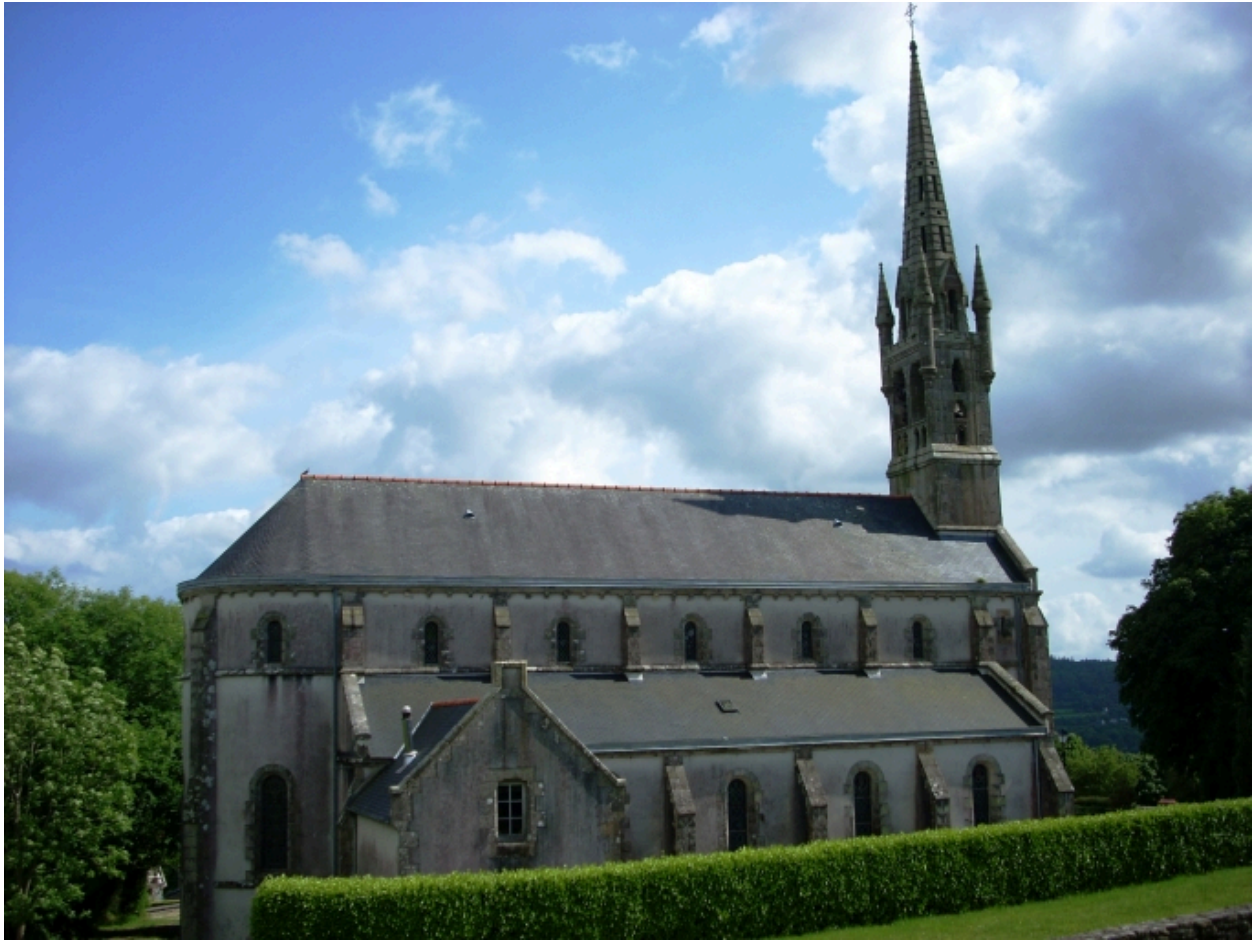
Eglise paroissiale Saint-Thénéan : vue générale nord-est