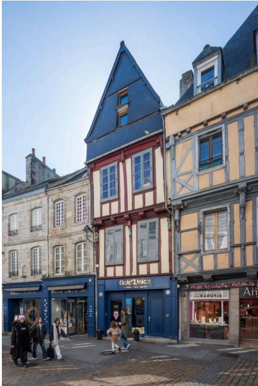
Maisons mitoyennes en pan de bois rue Kéréon. Le n°9 est celle de gauche.