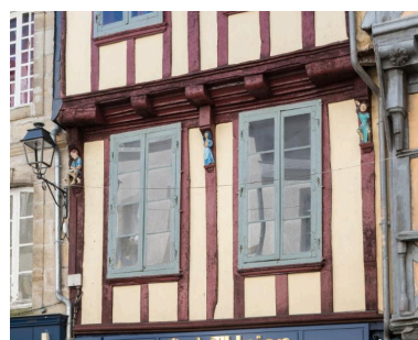
Des sculptures humaines en pied ornent les trois poteaux principaux du premier étage.