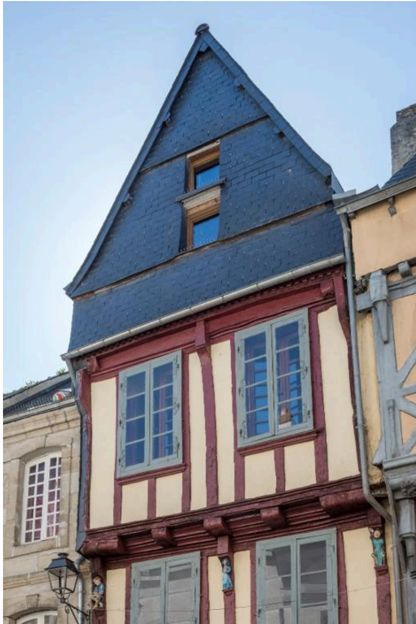
Deuxième étage contreventé en grille et pignon essenté d'ardoises.