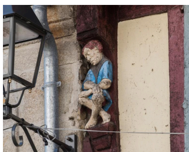
Personnage masculin assis, bras croisés. IVR53_20252900727NUCA