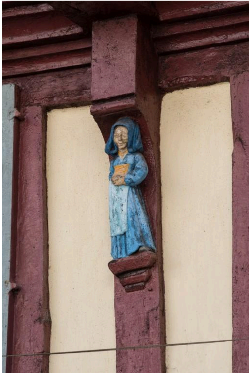
Femme en coiffe, robe et tablier, les mains jointes devant son ventre.