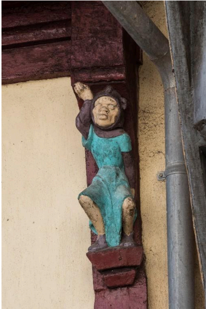
Personnage masculin faisant mine de soutenir la maison.