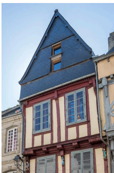
Deuxième étage contreventé en grille et pignon essenté d'ardoises. IVR53_20252900726NUCA