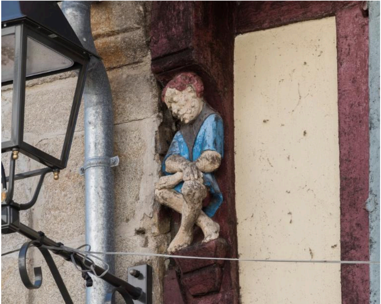
Personnage masculin assis, bras croisés.