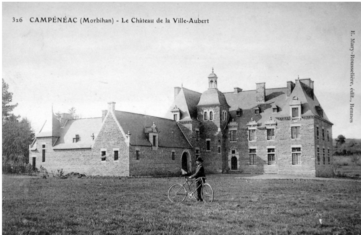
Campénéac (Morbihan) - Le Château de la Ville-Aubert. Carte postale, 1er quart 20e siècle