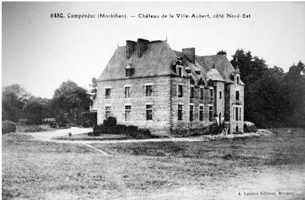
Campénéac (Morbihan) - Le Château de la Ville-Aubert, côté nord-est. Carte postale, 1er quart 20e siècle