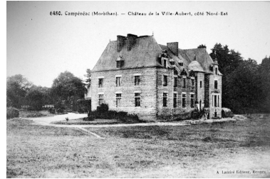
Campénéac (Morbihan) - Le Château de la Ville-Aubert, côté nord-est. Carte postale, 1er quart 20e siècle IVR53_20045606248NUCB