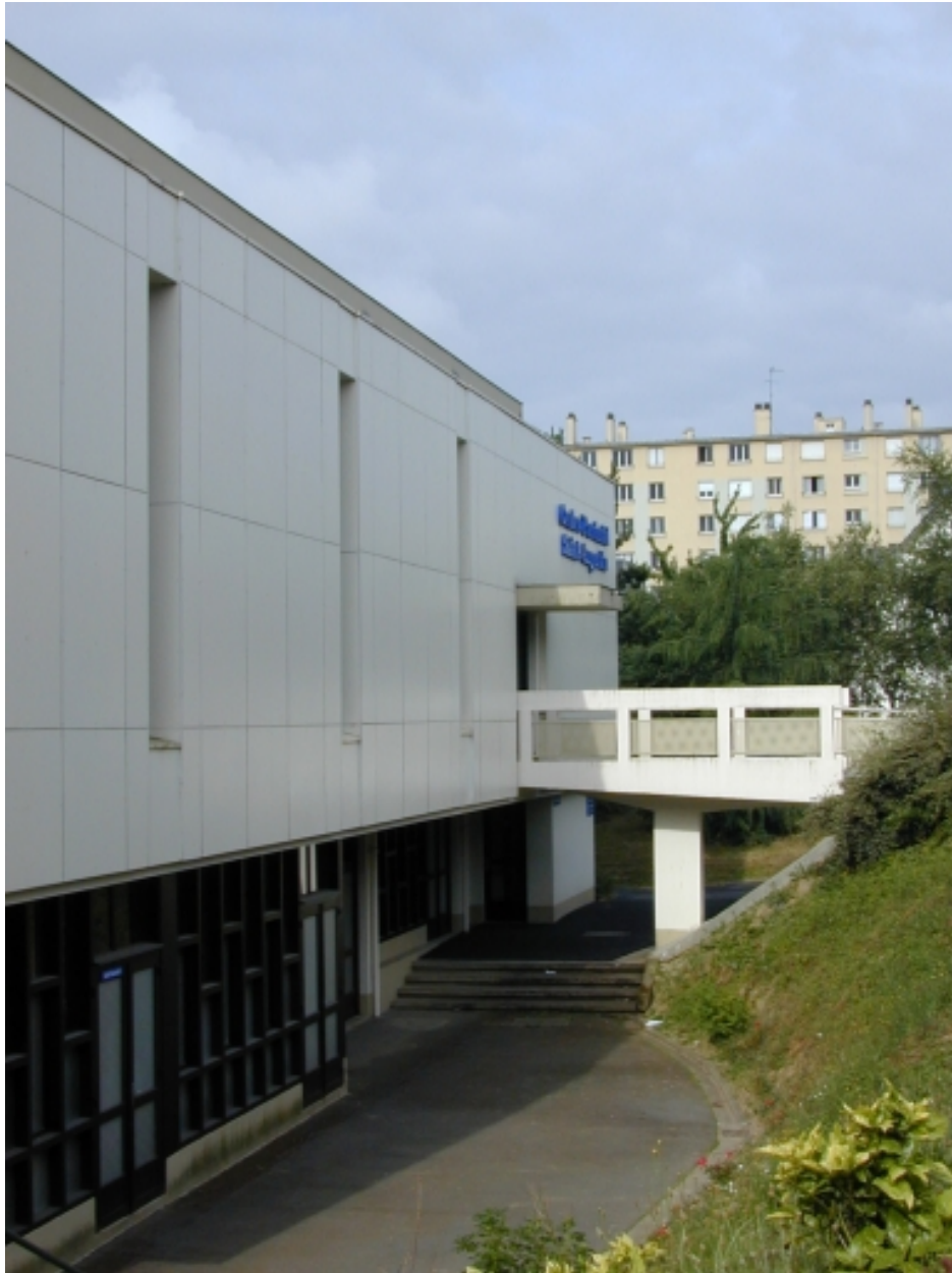
Vue de l'étage de soubassement