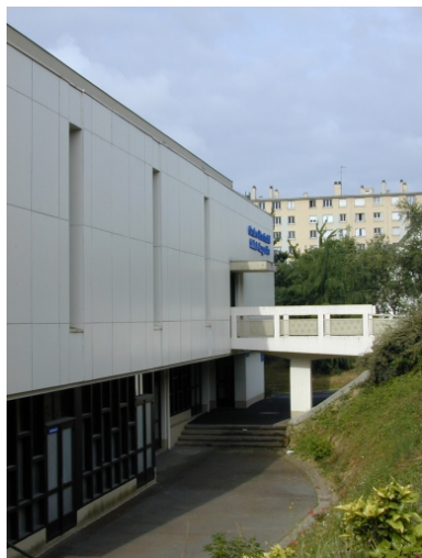
Vue de l'étage de soubassement