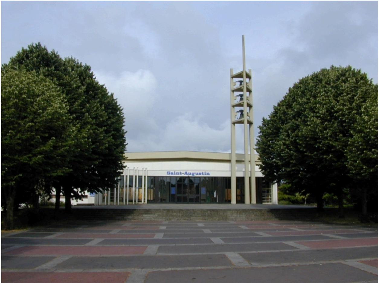
Vue de la façade est