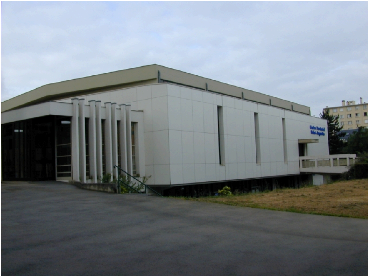
Vue depuis le nord-est