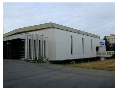
Vue depuis le nord-est