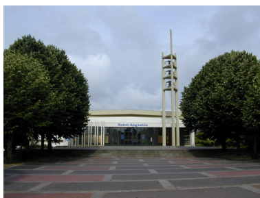
Vue de la façade est IVR53_20003517838NUCA