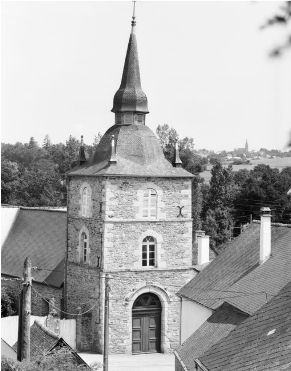
Église Saint-Samson : vue générale du clocher prise de l'ouest