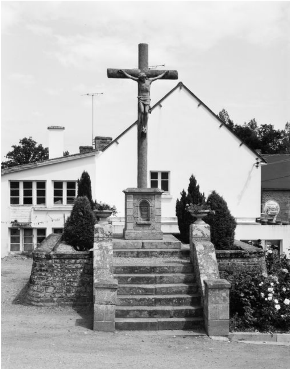
Croix monumentale : face portant le Christ en croix