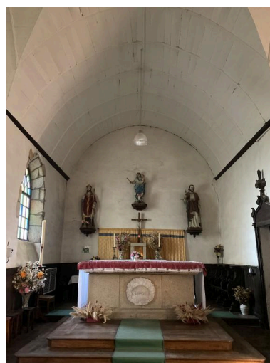
Vue de l'autel et du ch#ur