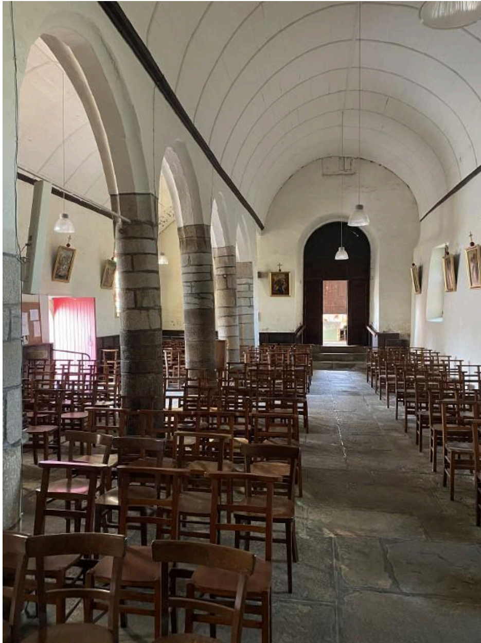
Vue générale de l'intérieur