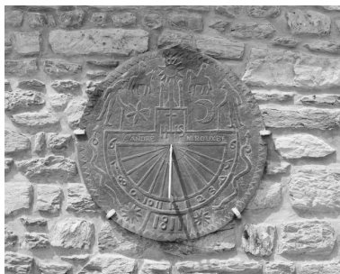
Église Saint-Samson : cadran solaire IVR53_19915600569X