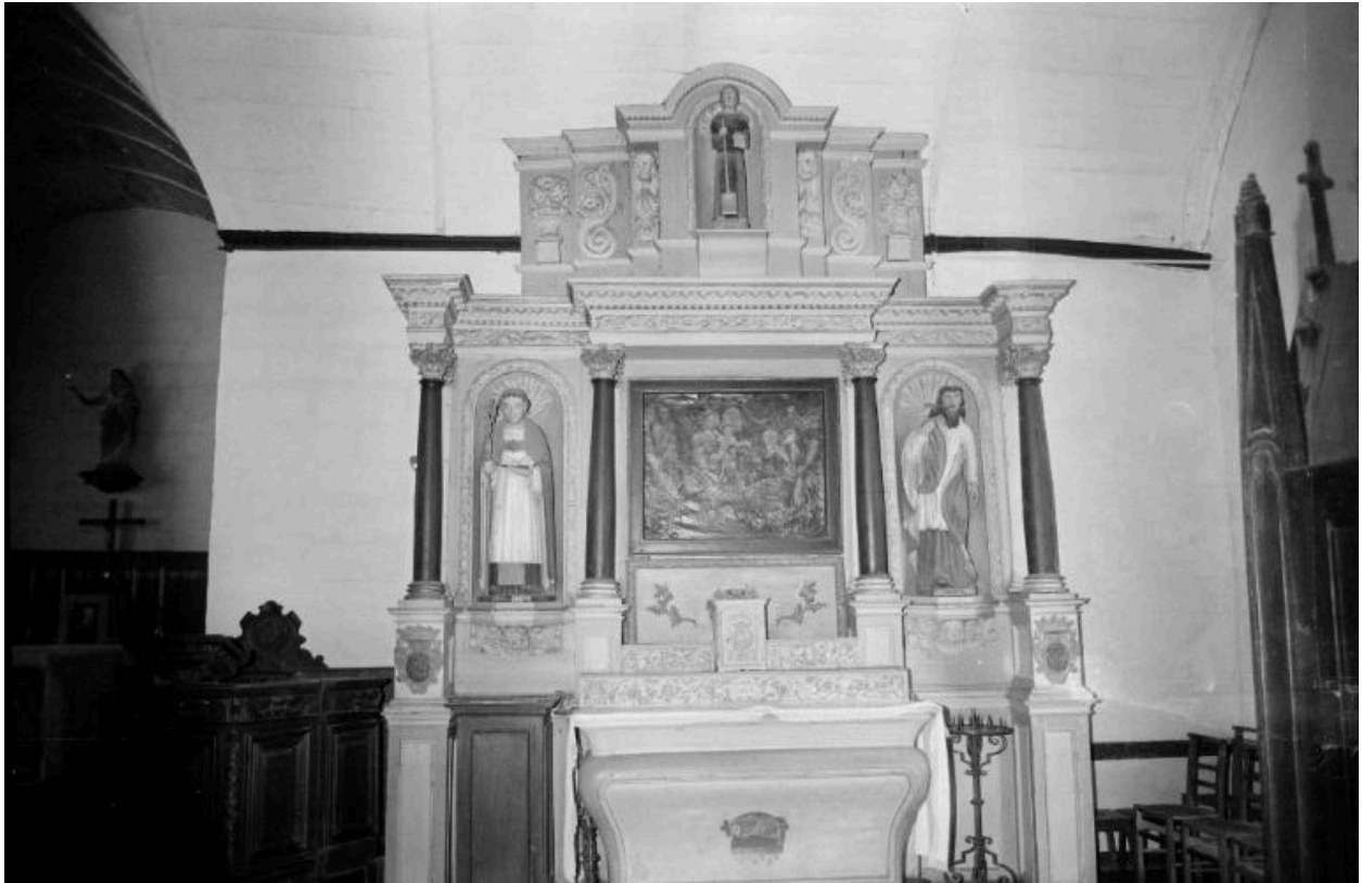
Retable et autel d'une chapelle latérale sud