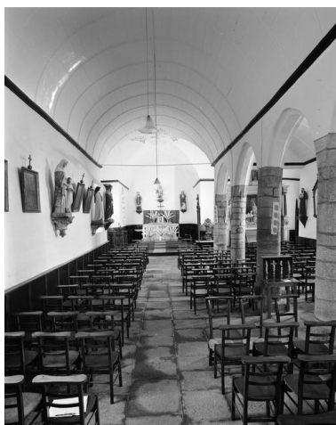
Église Saint-Samson : vue générale vers le chœur