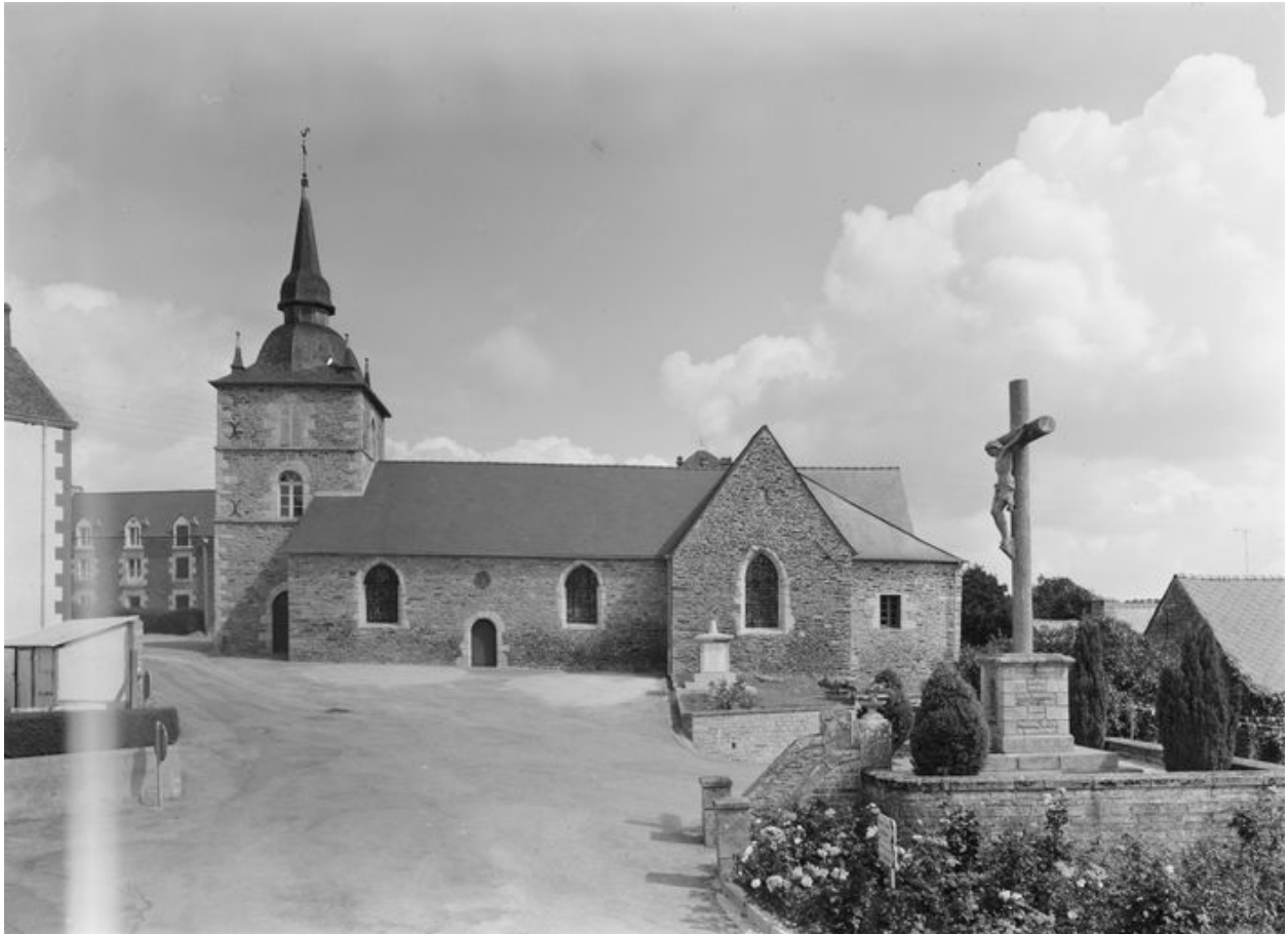
Église Saint-Samson, élévation sud : vue générale prise du sud