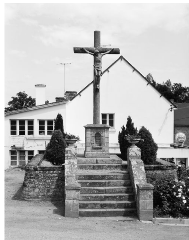
Croix monumentale : face portant le Christ en croix IVR53_19915600567X