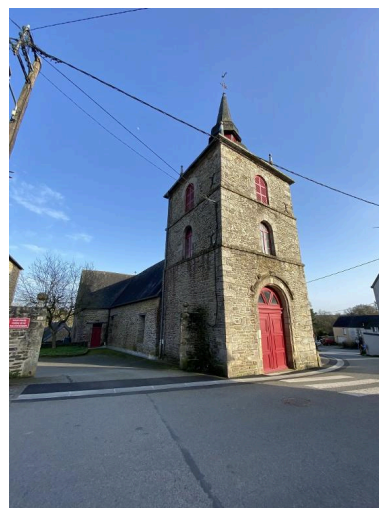
Vue nord-ouest IVR53_20265610524NUCA