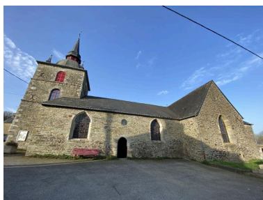
Vue sud IVR53_20265610522NUCA