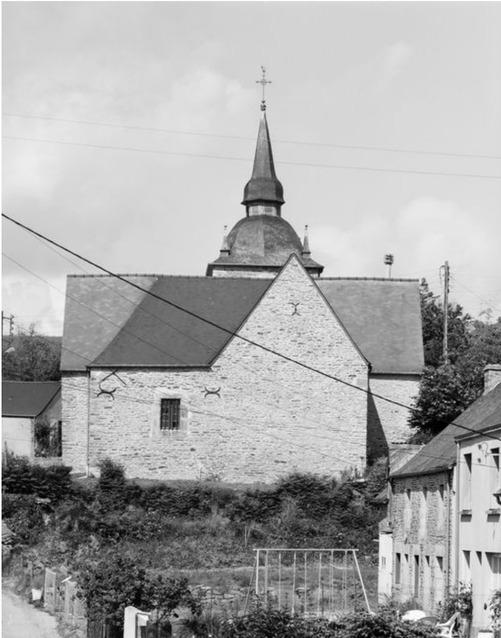
Église Saint-Samson, chevet : vue générale