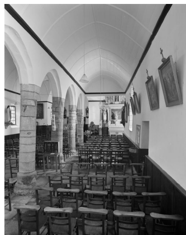
Église Saint-Samson, bas côté : vue générale vers l'est, IVR53_19935601569X