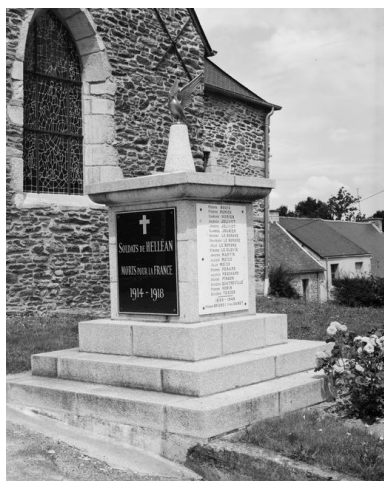
Monument aux morts IVR53_19915600568X