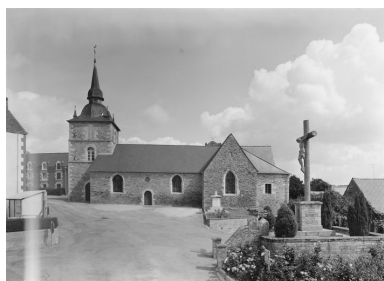
Église Saint-Samson, élévation sud : vue générale prise du sud