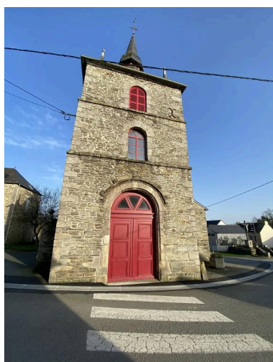
Vue ouest IVR53_20265610523NUCA