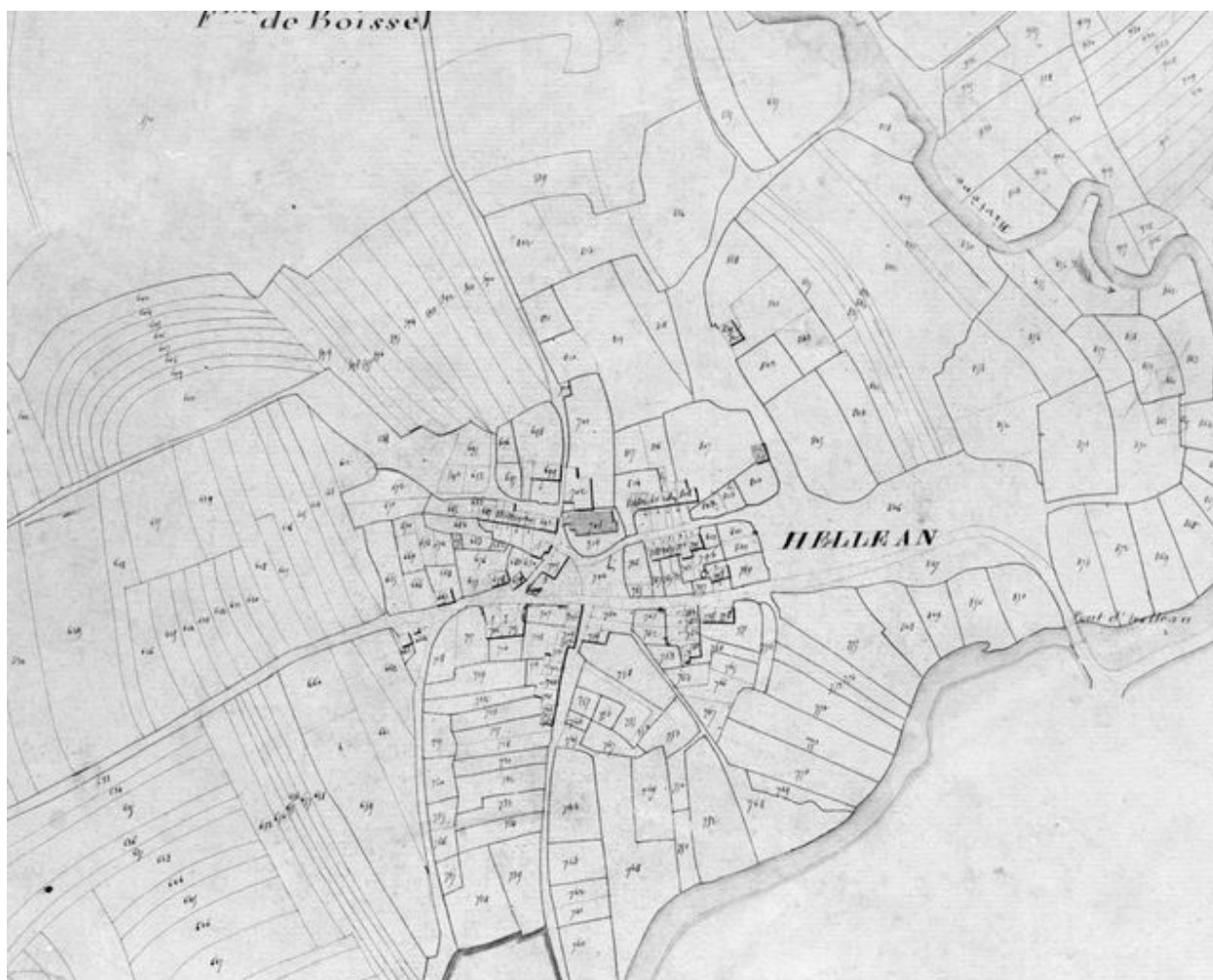
L'église Saint-Samson sur le cadastre de 1831