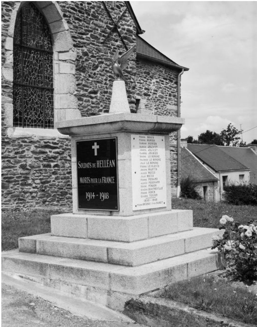
Monument aux morts