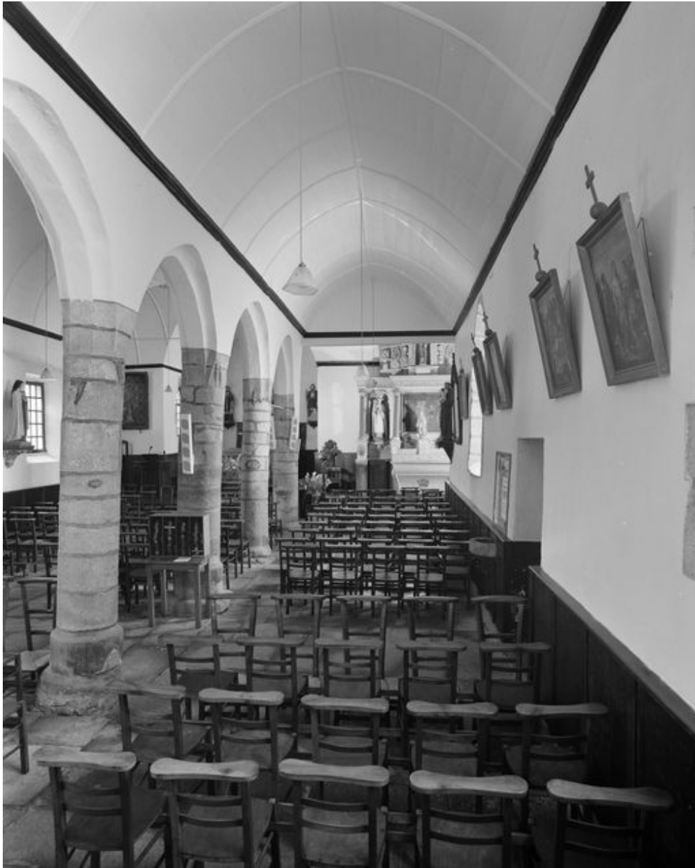
Église Saint-Samson, bas côté : vue générale vers l'est