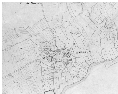
L'église Saint-Samson sur le cadastre de 1831 (Archives du morbihan, section B)