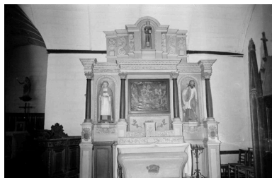
Retable et autel d'une chapelle latérale sud