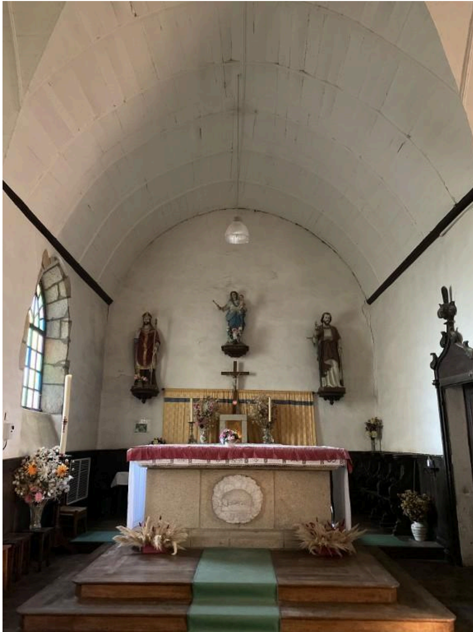
Vue de l'autel et du ch#ur