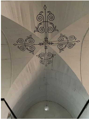
Plafond, détail