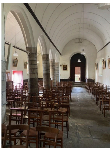
Vue générale de l'intérieur IVR53_20265610519NUCA