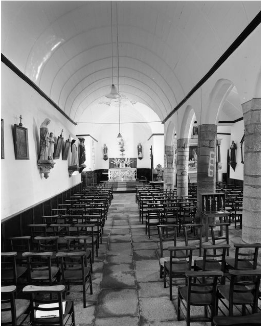
Église Saint-Samson : vue générale vers le chœur