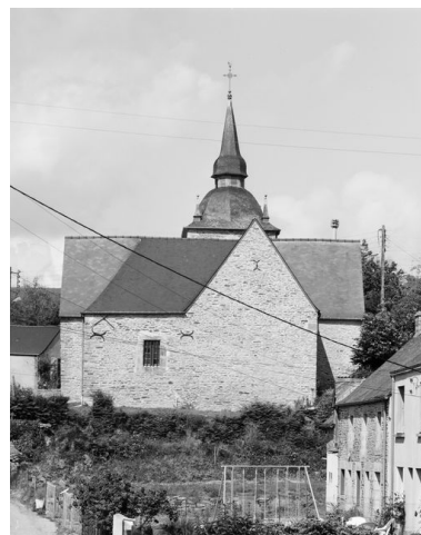
Église Saint-Samson, chevet : vue générale IVR53_19915600559X