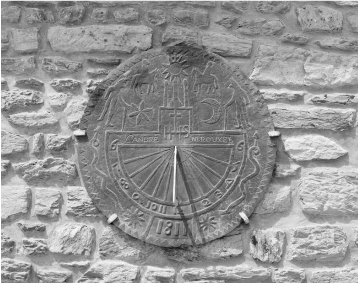
Église Saint-Samson : cadran solaire