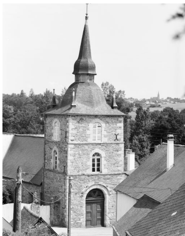
Église Saint-Samson : vue générale du clocher prise de l'ouest IVR53_19915600566X