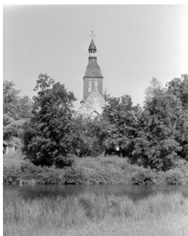
Elévation est, clocher : détail de la tour, IVR53_19943500957X

Elévation ouest : vue générale IVR53_20053502065NUCA