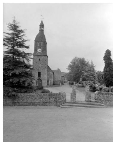
Elévation ouest : vue générale IVR53_19943500901X