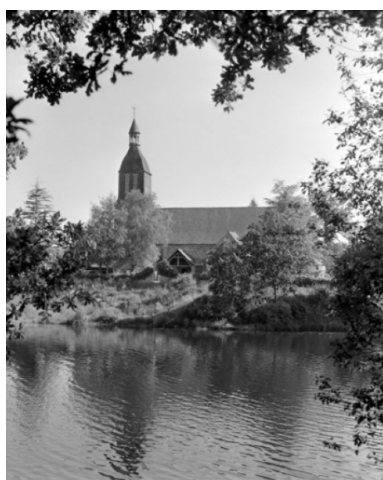
Elévation sud, partie ouest : vue générale