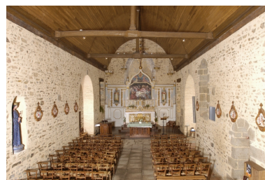
Vue intérieure prise de la nef vers le chœur IVR53_20053501338NUCA