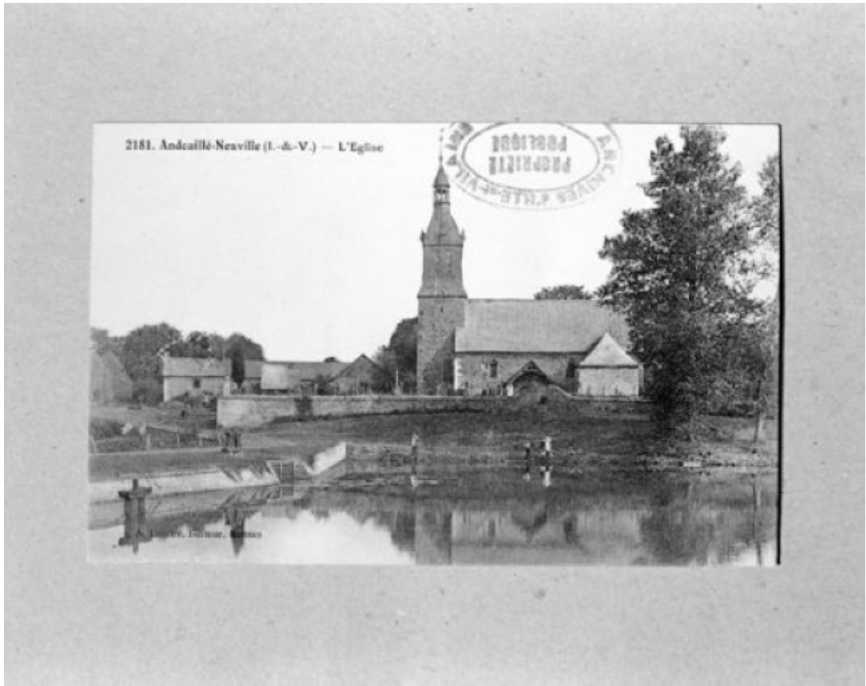
Elévation sud : vue de situation sur une carte postale ancienne