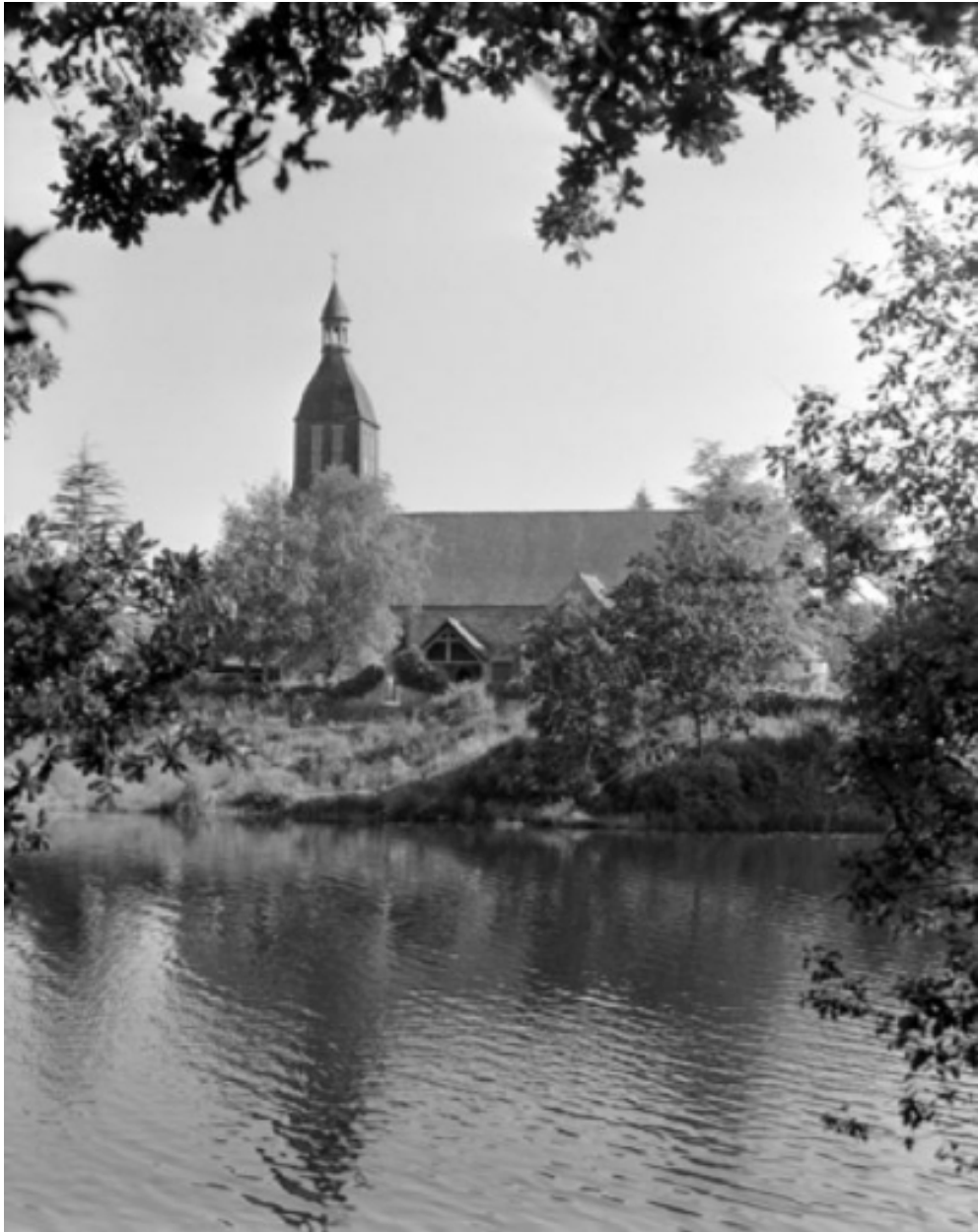
Elévation sud, partie ouest : vue générale