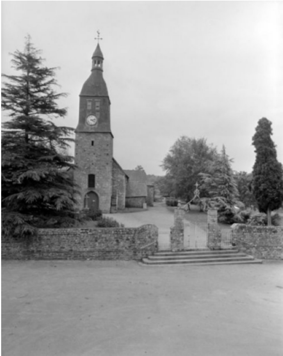
Elévation ouest : vue générale