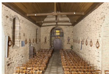
Vue intérieure prise du chœur vers la nef IVR53_20053501337NUCA