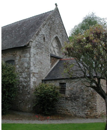
Vue sud-est du chevet IVR53_20053514507NUCA

Elévation ouest : vue générale IVR53_20053502065NUCA