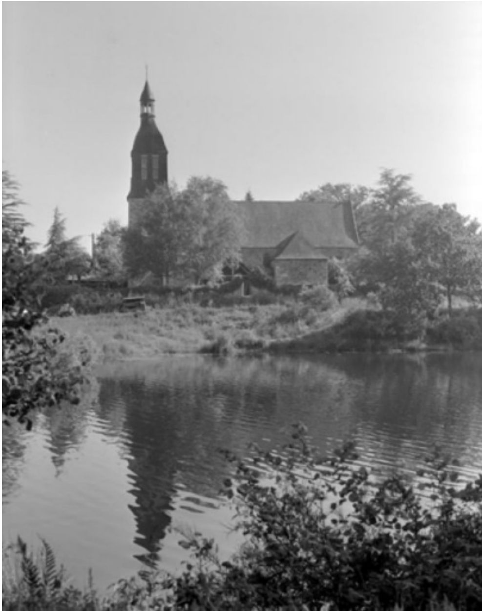
Elévation sud, partie ouest : vue générale