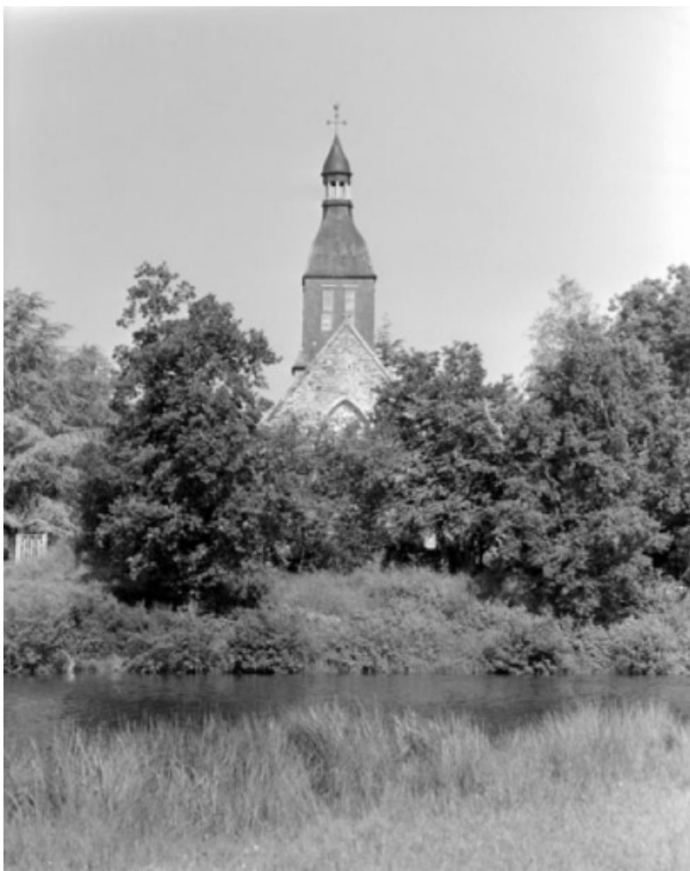
Elévation est, clocher : détail de la tour