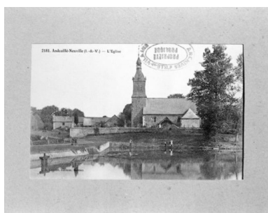
Elévation sud : vue de situation sur une carte postale ancienne