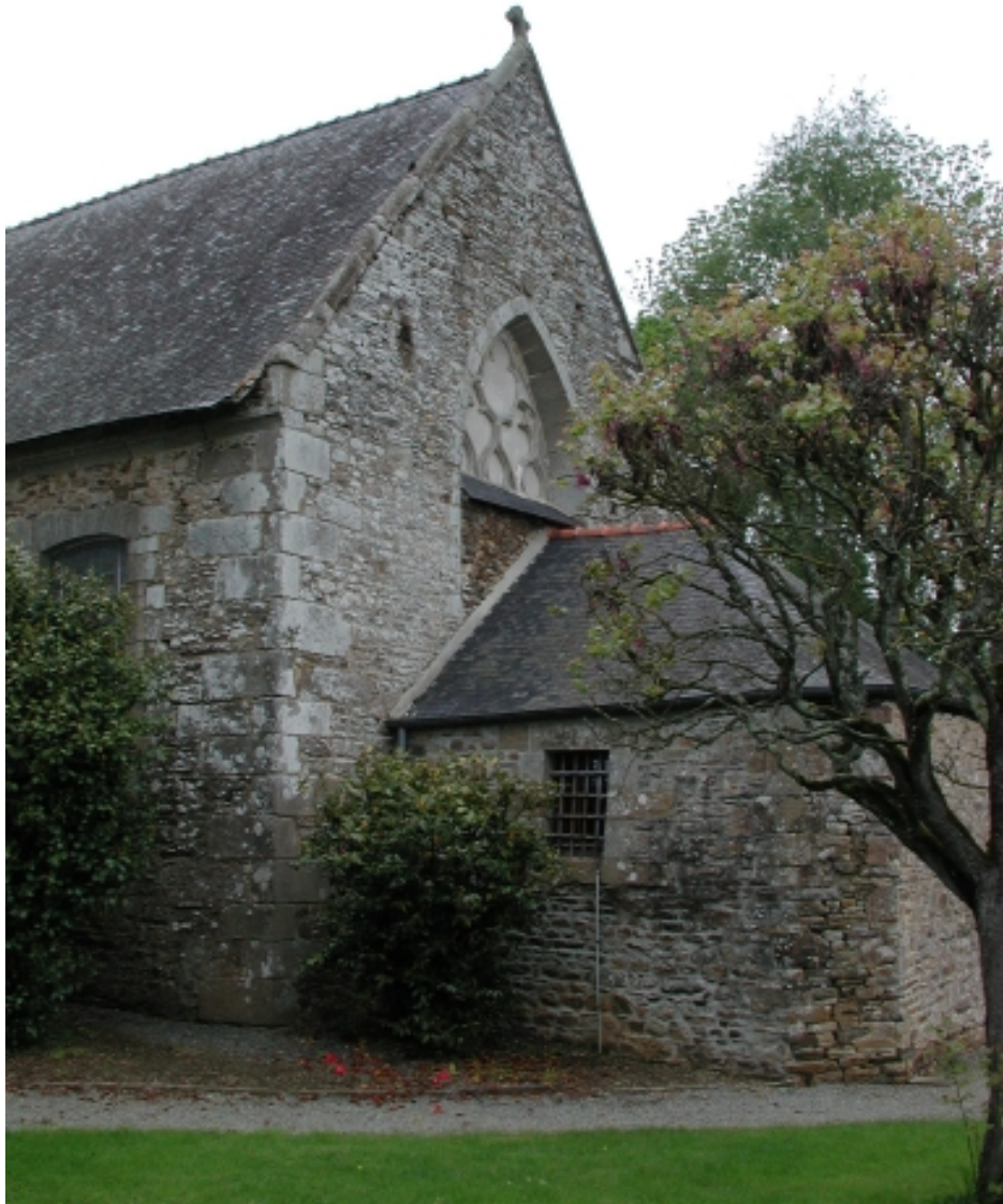
Vue sud-est du chevet