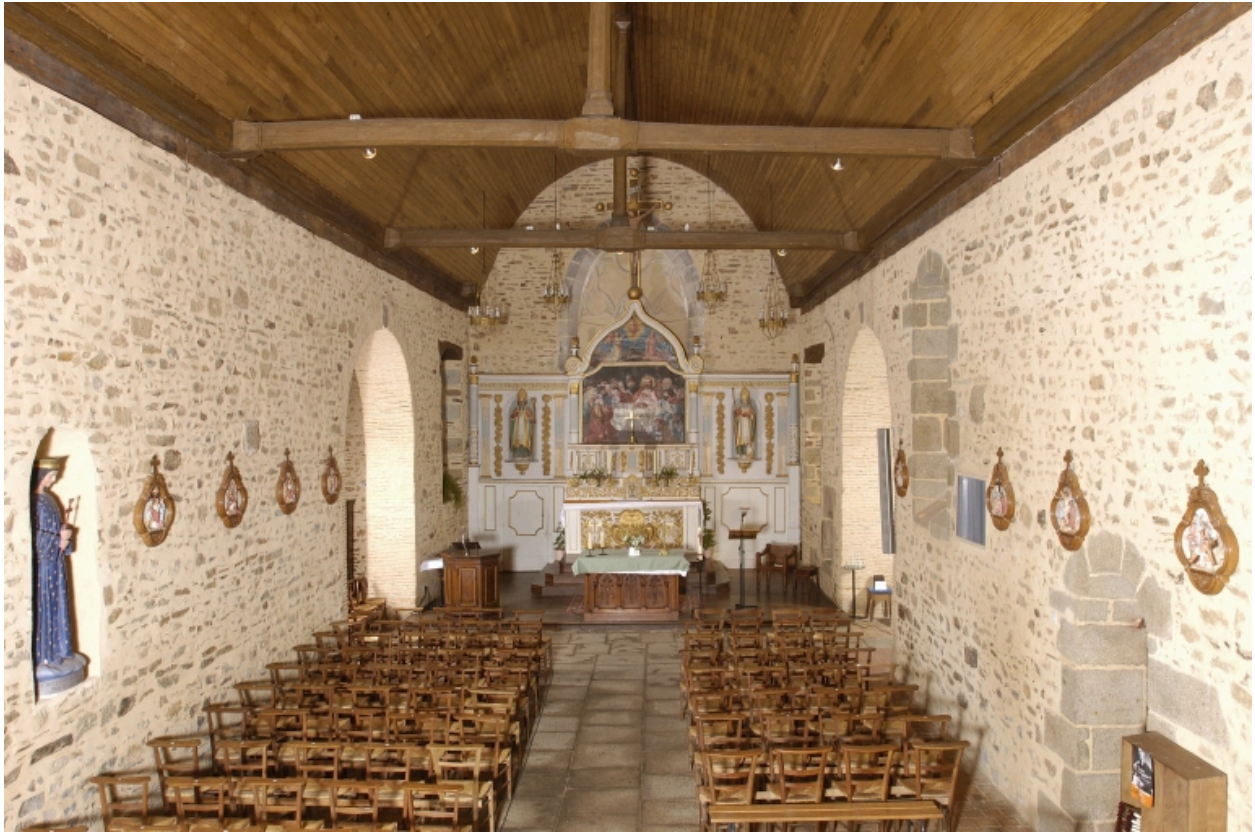
Vue intérieure prise de la nef vers le chœur