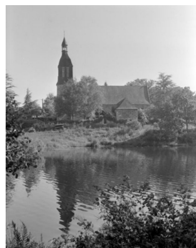
Elévation sud, partie ouest : vue générale IVR53_19943500955X