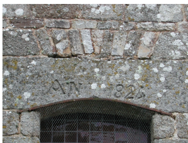
Clocher ouest : date portée IVR53_20053514510NUCA