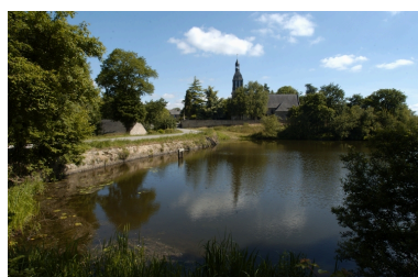
Vue de situation sud IVR53_20053501931NUCA