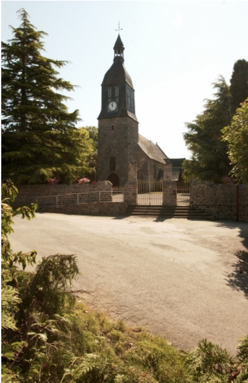
Elévation ouest : vue générale