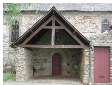
Façade sud : détail du porche IVR53_20053514508NUCA