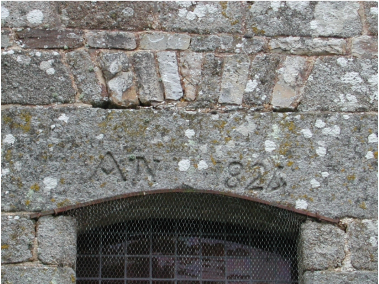
Clocher ouest : date portée