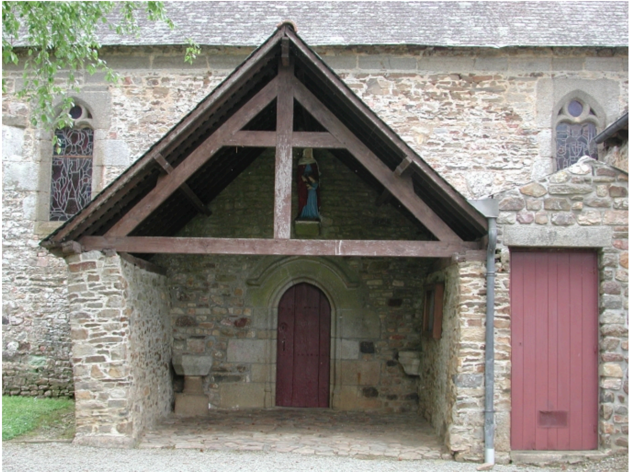
Façade sud : détail du porche