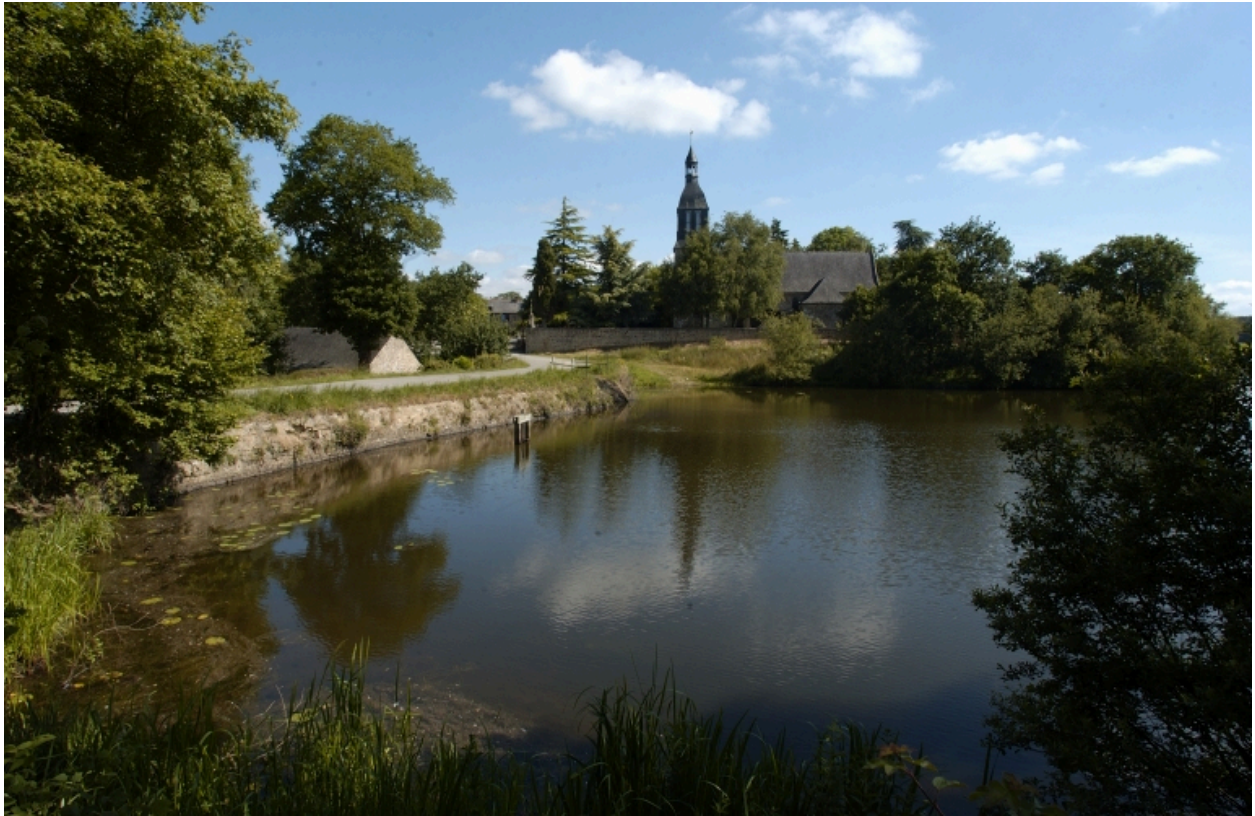
Vue de situation sud