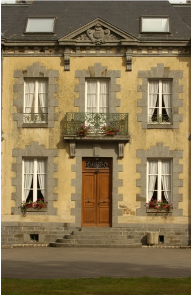
La travée centrale