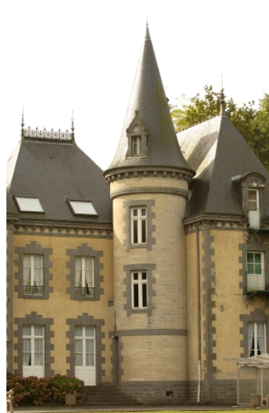
Détail de la tour d'escalier