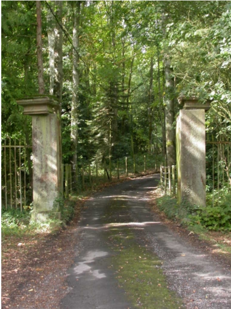
Le portail d'entrée dans le parc du château