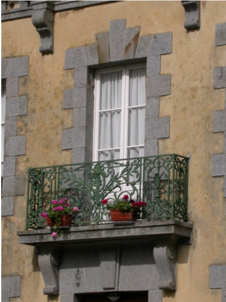
Détail de l'une des baies