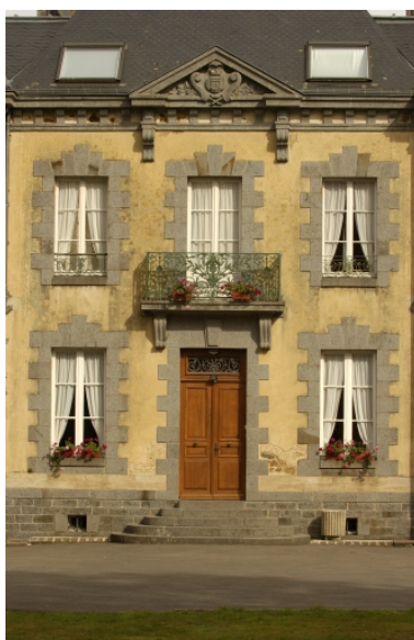
La travée centrale