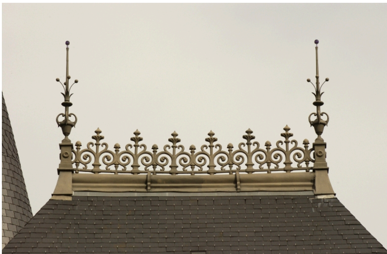
La crête de toit