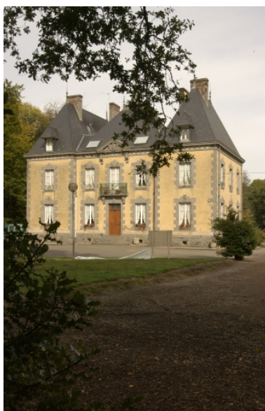
Vue d'ensemble sud-est IVR53_20053502662NUCA