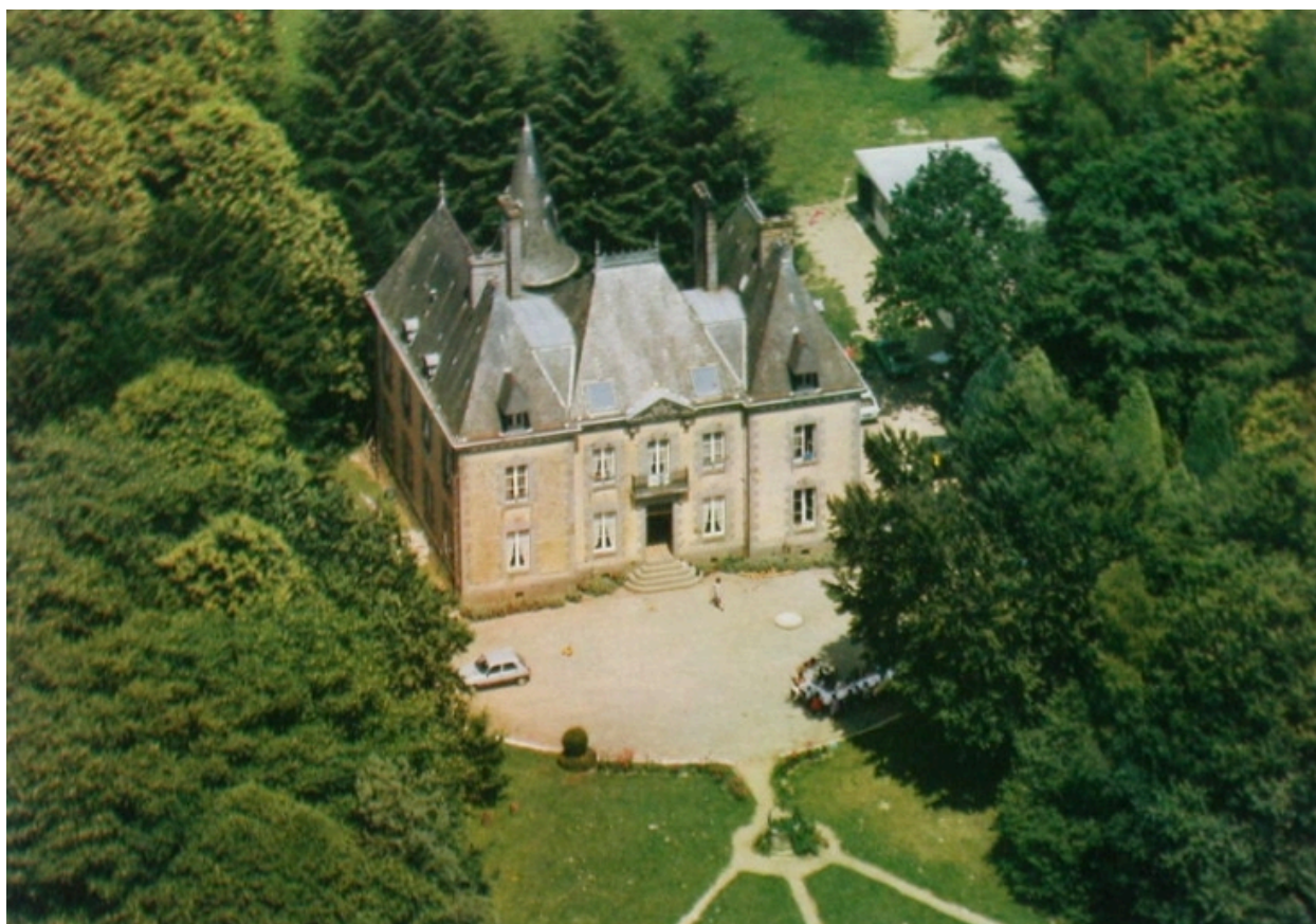
Vue aérienne du château