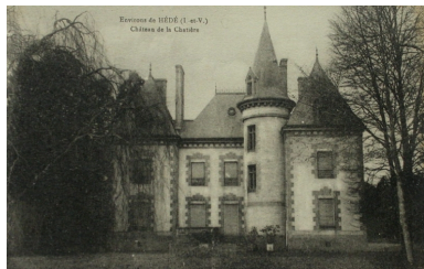
Le château sur une carte postale ancienne IVR53_20053519234NUCA