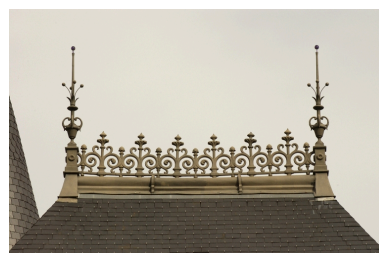
La crête de toit