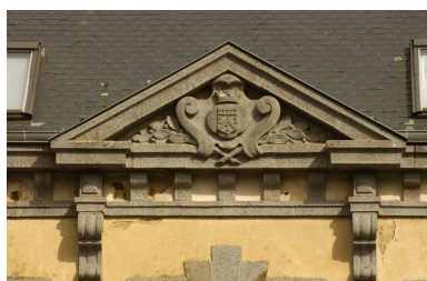
Détail du fronton triangulaire