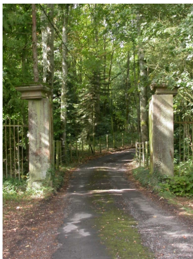
Le portail d'entrée dans le parc du château