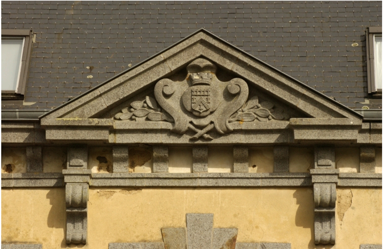
Détail du fronton triangulaire