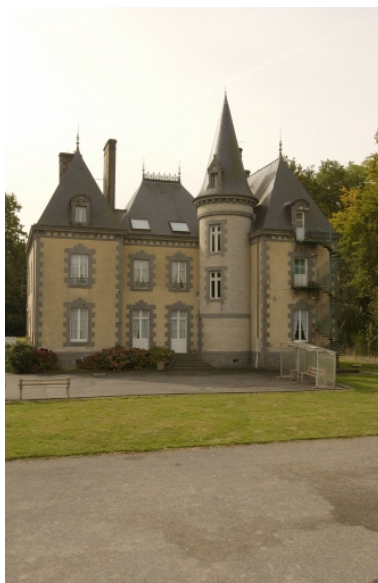
Vue nord IVR53_20053502666NUCA