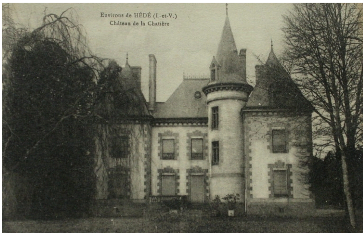
Le château sur une carte postale ancienne