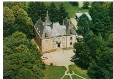
Vue aérienne du château