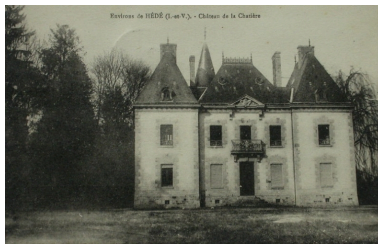
Carte postale ancienne de la Châtère IVR53_20053519235NUCA