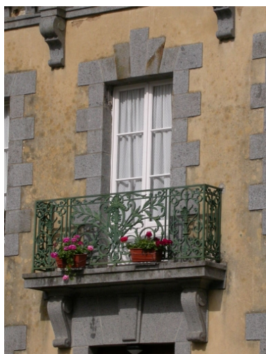
Détail de l'une des baies IVR53_20053518658NUCA