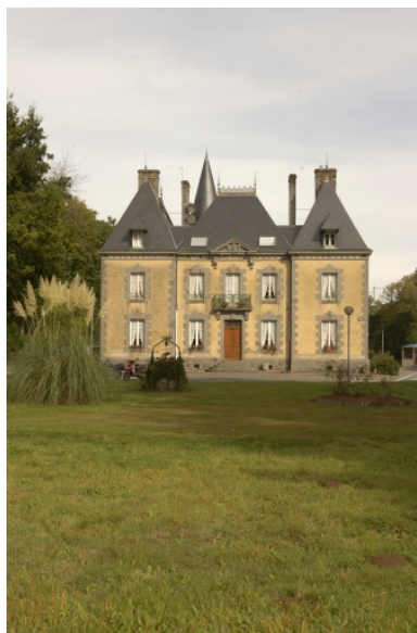
Vue générale sud IVR53_20053502661NUCA