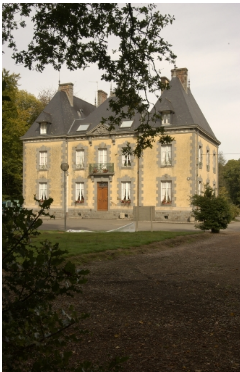
Vue d'ensemble sud-est