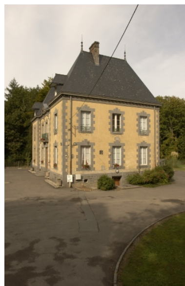
Vue sud-est IVR53_20053502660NUCA