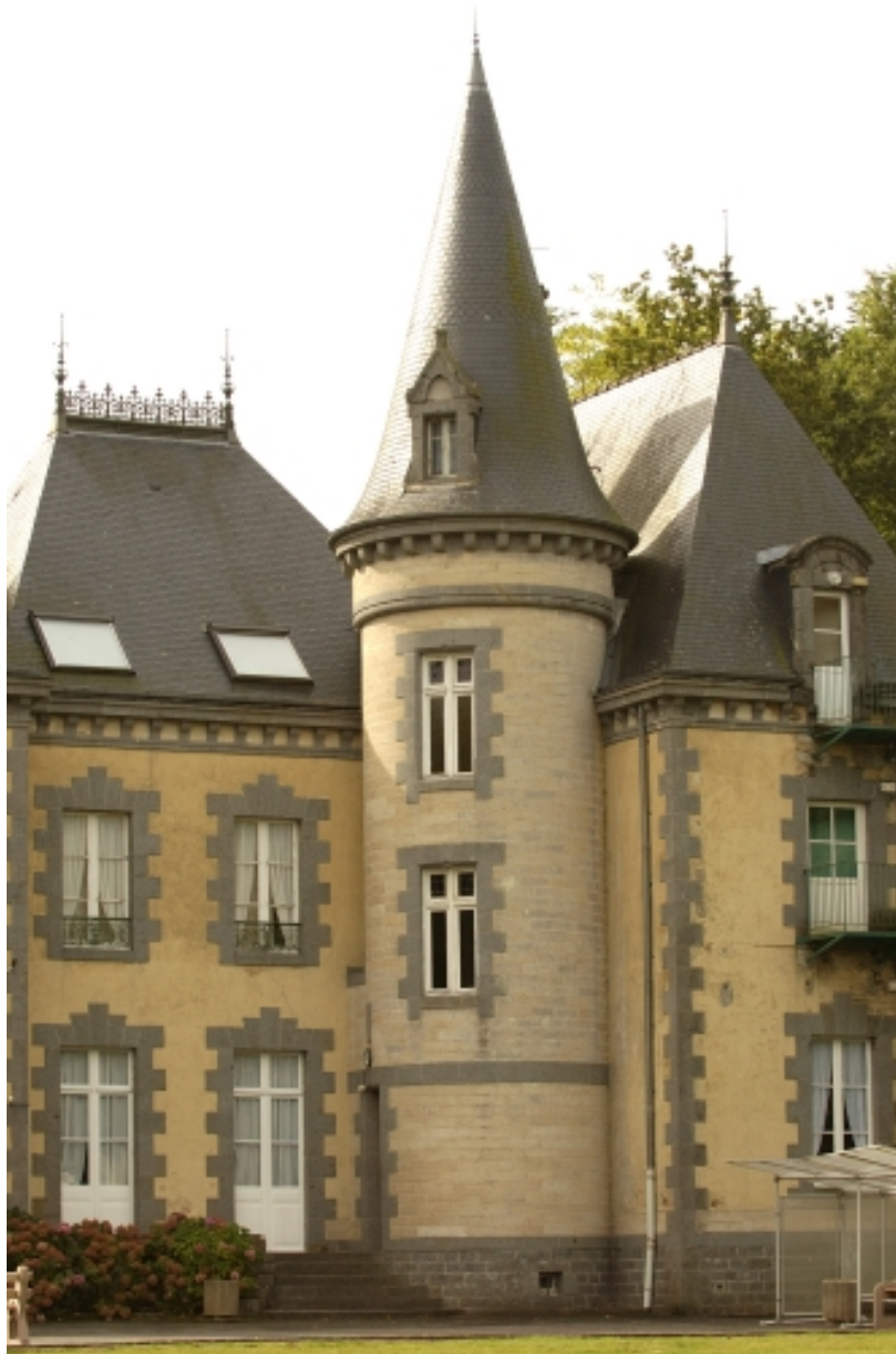
Détail de la tour d'escalier