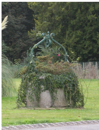
Le puits IVR53_20053518657NUCA