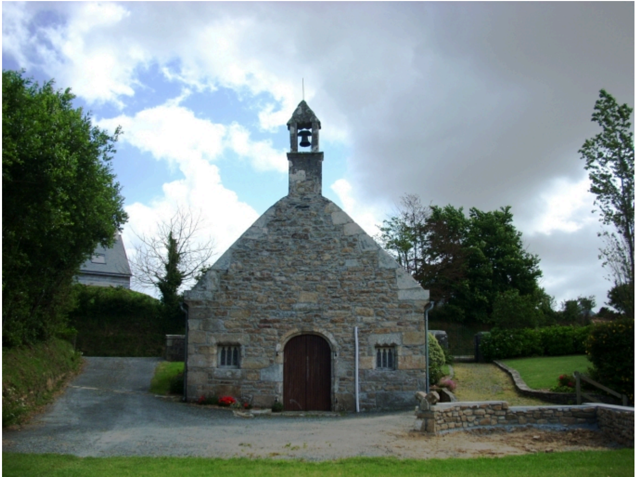
Kernouës, chapelle de la Clarté : élévation ouest