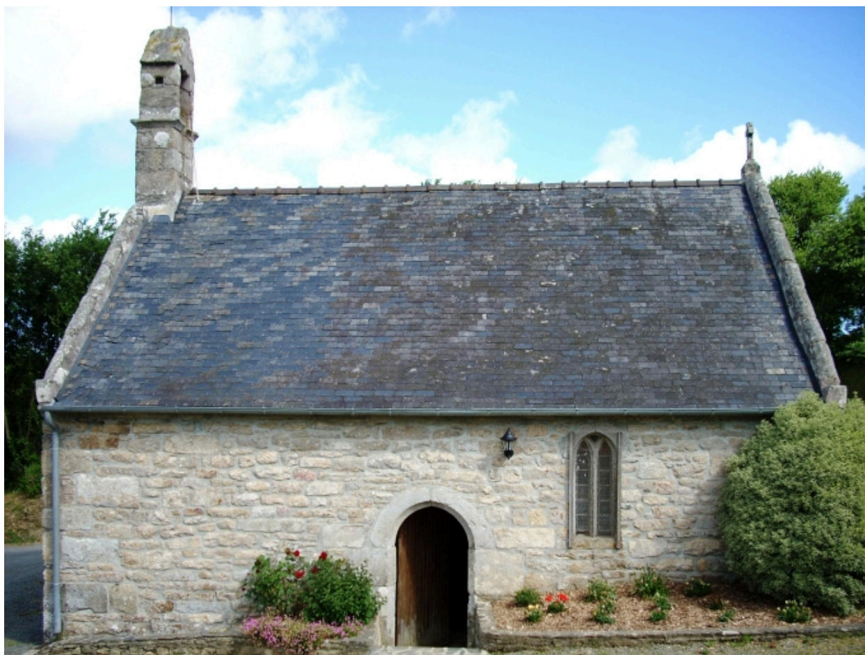
Kernouës, chapelle de la Clarté : élévation sud