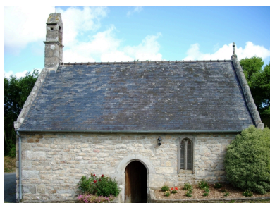
Kernouës, chapelle de la Clarté : élévation sud