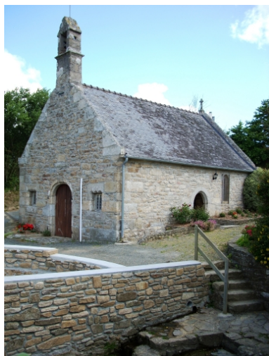
Kernouës, chapelle de la Clarté : vue générale sud-ouest IVR53_20082906334NUCA