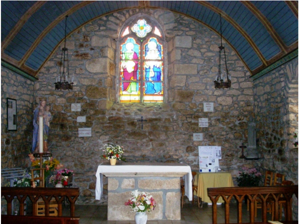
Kernouës, chapelle de la Clarté : vue axiale est