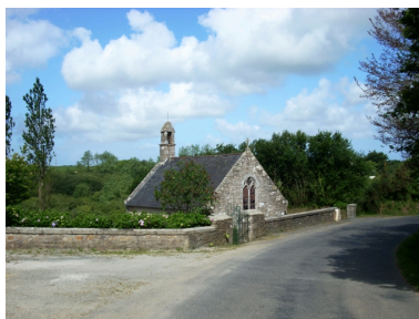
Kernouës, chapelle de la Clarté : vue générale sud-est