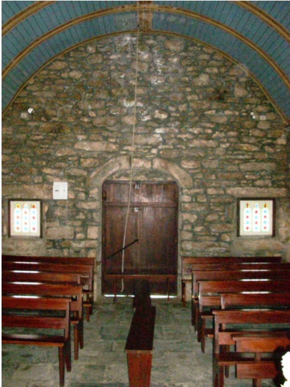
Kernouës, chapelle de la Clarté : vue axiale ouest