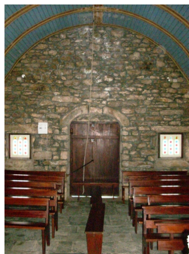
Kernouës, chapelle de la Clarté : vue axiale ouest IVR53_20082906339NUCA