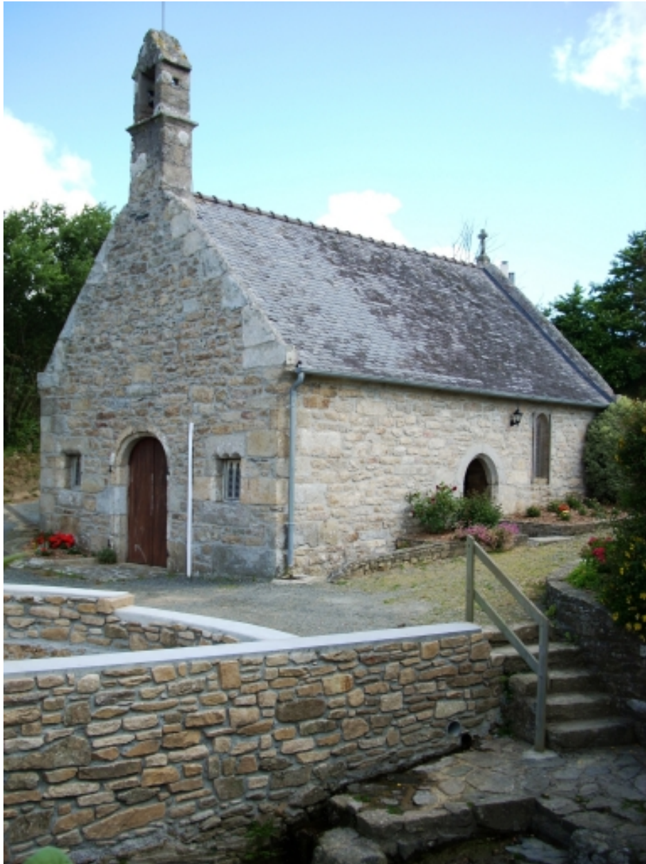
Kernouës, chapelle de la Clarté : vue générale sud-ouest