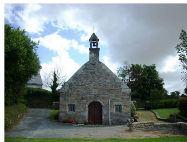
Kernouës, chapelle de la Clarté : élévation ouest IVR53_20082906336NUCA