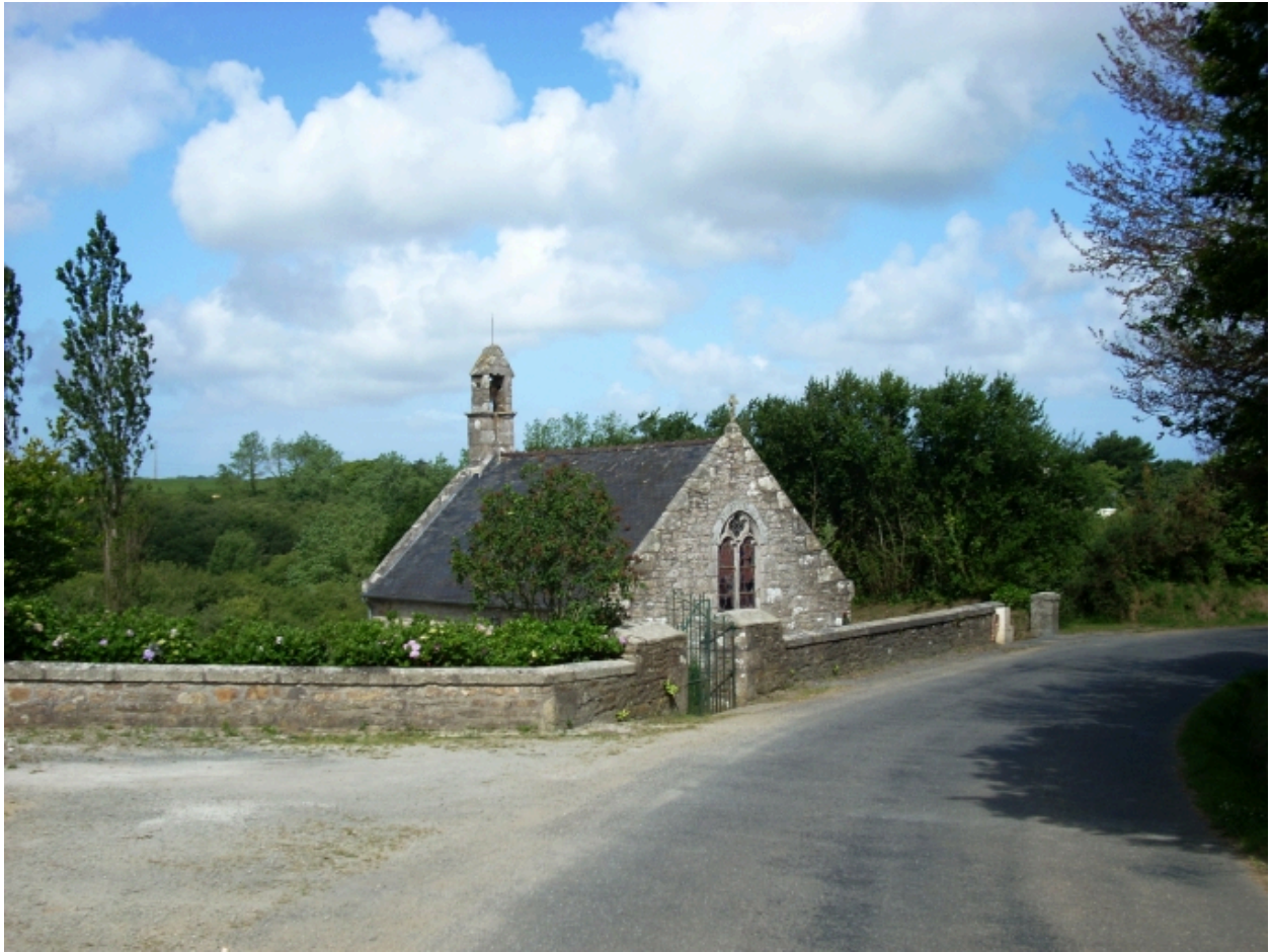
Kernouës, chapelle de la Clarté : vue générale sud-est