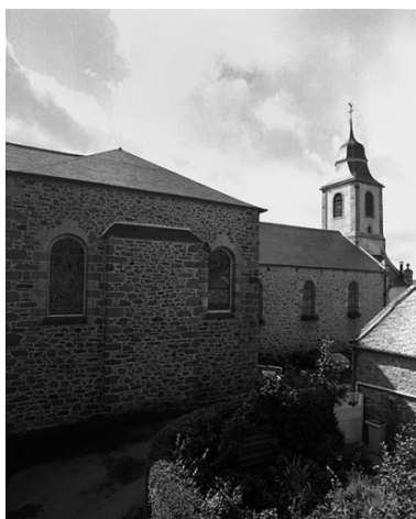
Elévation nord : vue générale, IVR53_19943501798X