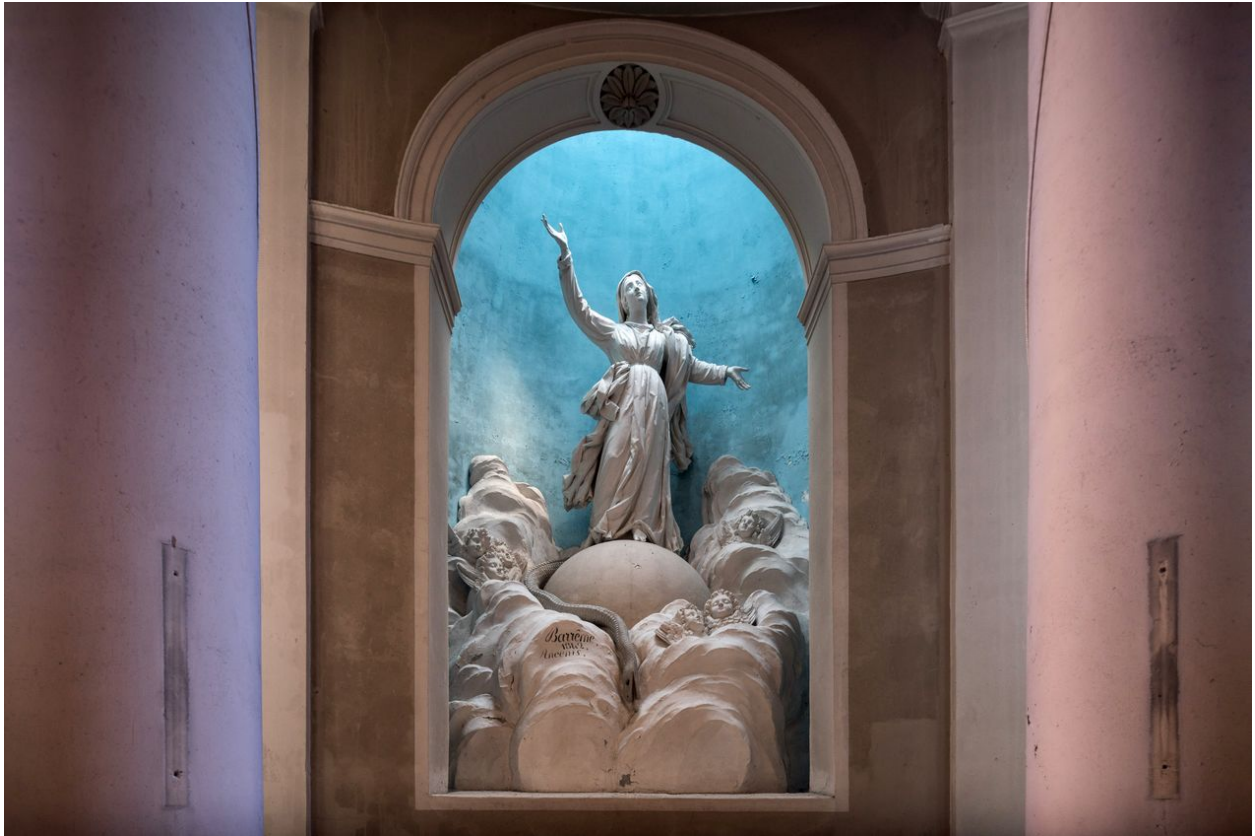
Vue de détail de la sculpture de l'Assomption dans le choeur