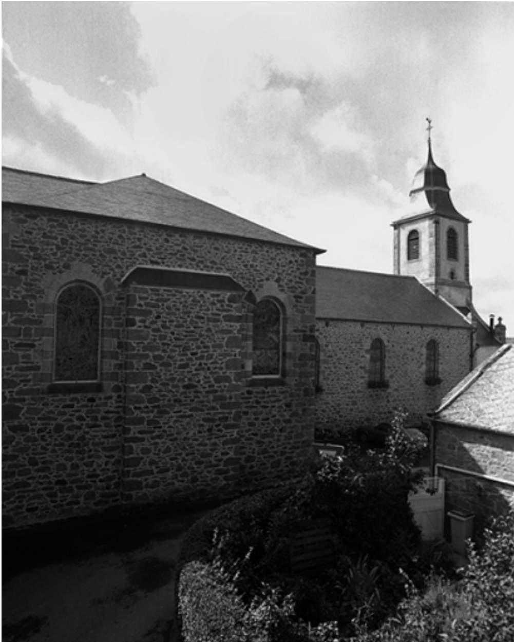
Elévation nord : vue générale