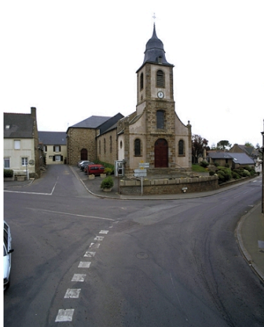
Vue générale ouest IVR53_20003501175X