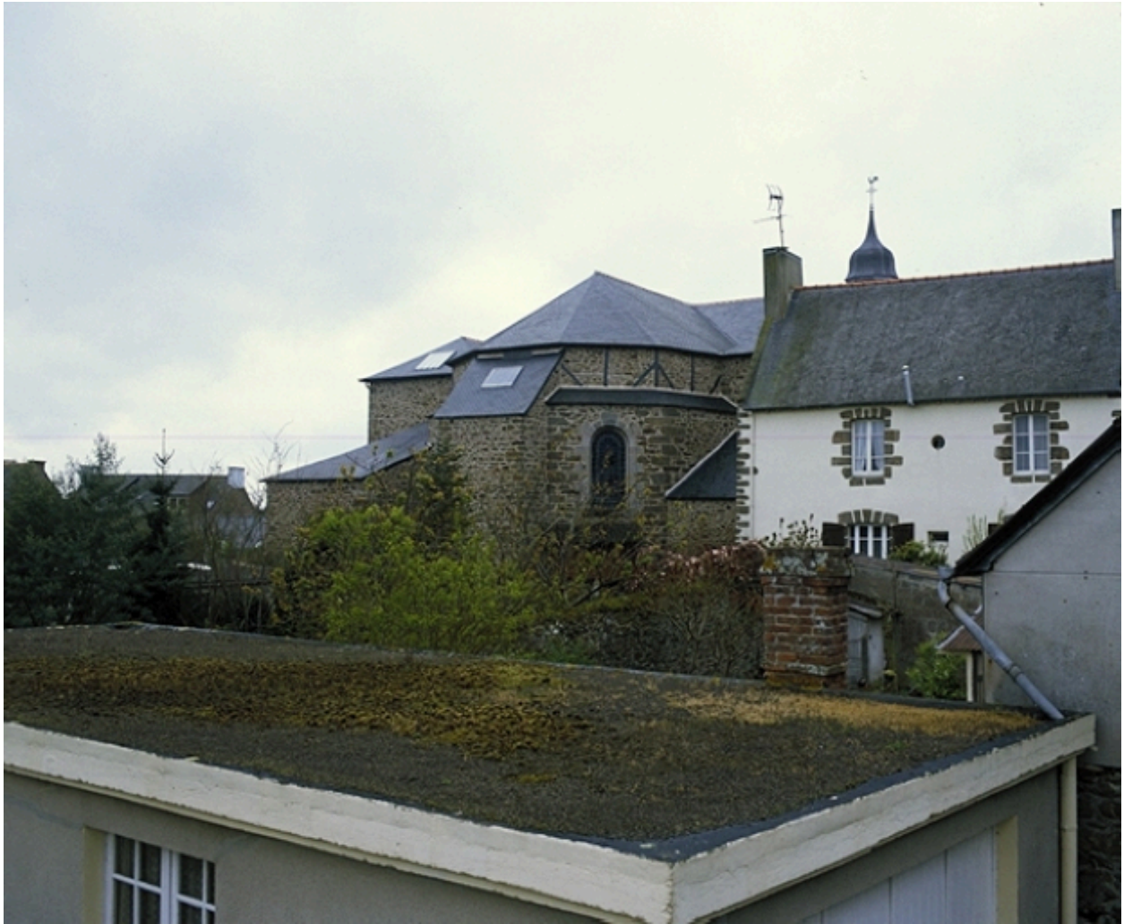
Détail : le chevet de l'église