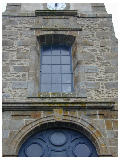
Verrière de la baie au deuxième niveau de la tour-porche