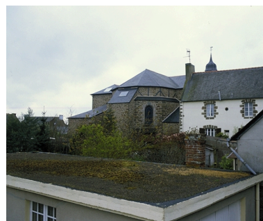
Détail : le chevet de l'église