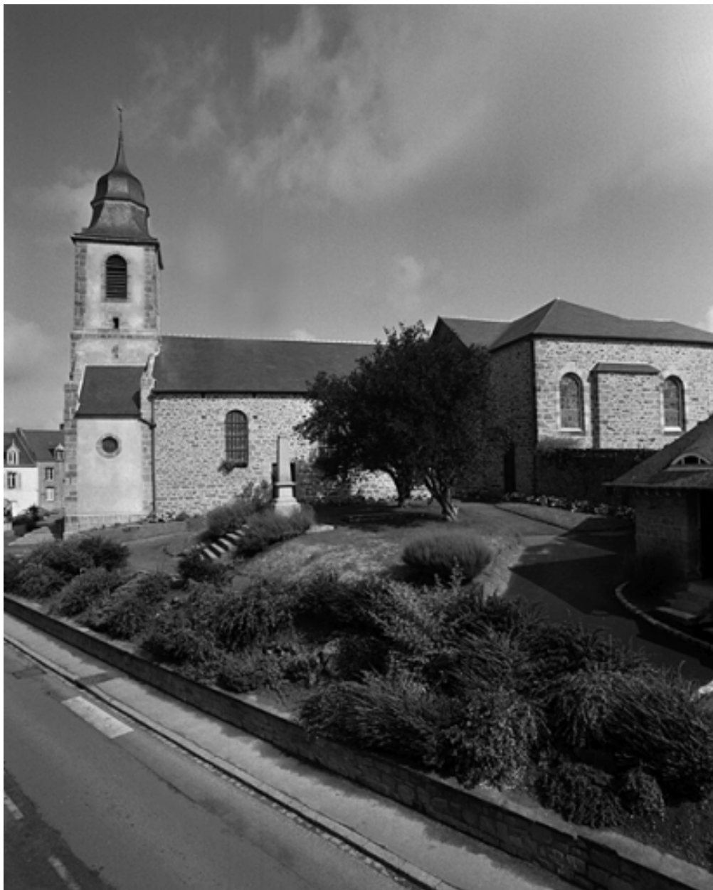
Elévation sud : vue générale