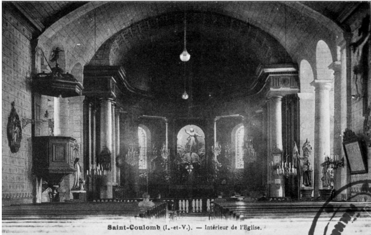
Vue générale vers le chœur