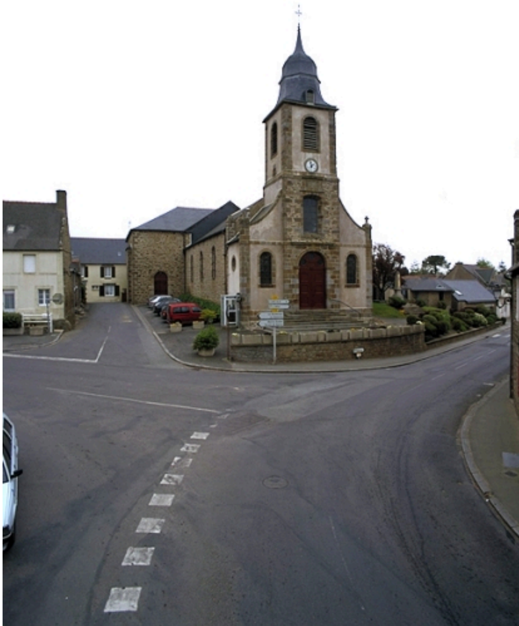
Vue générale ouest