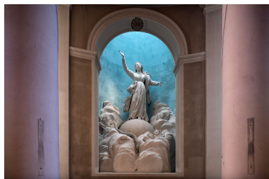
Vue de détail de la sculpture de l'Assomption dans le chœur IVR53_20223500927NUCA

Le chœur, vue d'ensemble de l'hémicycle valorisant le groupe sculpté à jour céleste IVR53_20223500928NUCA