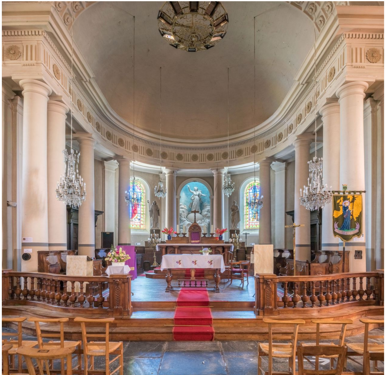
Choeur, vue générale depuis l'ouest