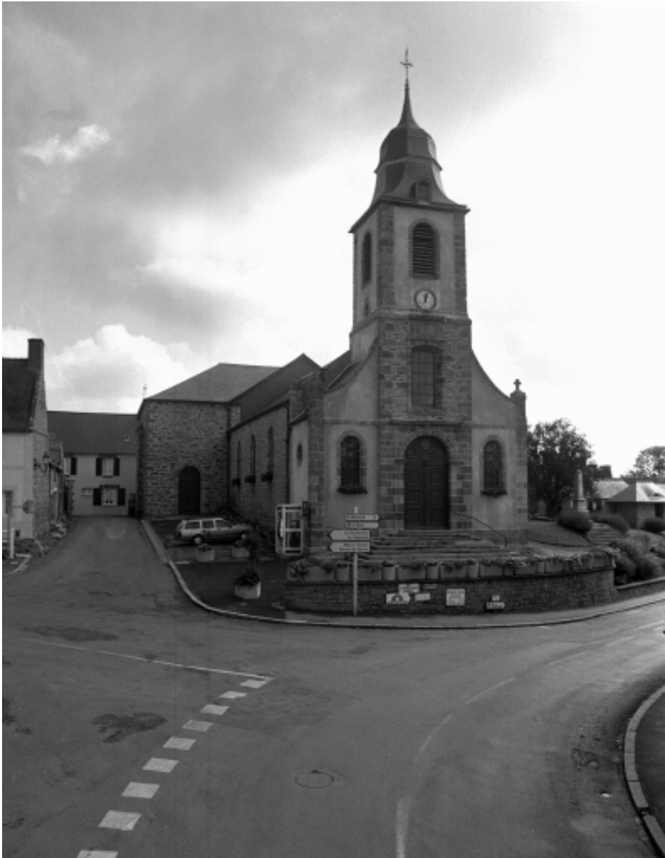
Vue générale ouest