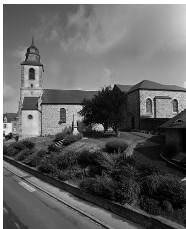
Elévation sud : vue générale IVR53_19943501797X