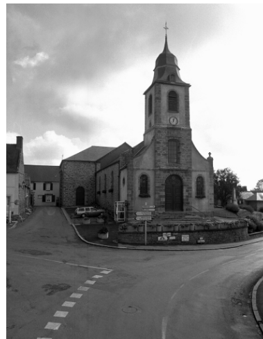
Vue générale ouest IVR53_19943501799X