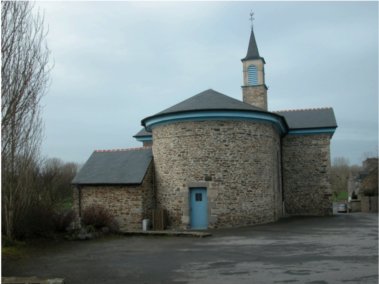
Elévation Ouest : vue générale