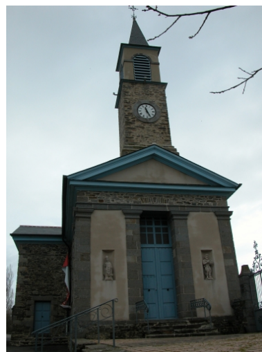
Elévation Ouest : vue générale