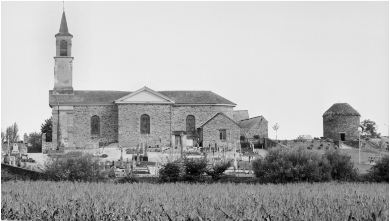
Elévation Sud : vue générale