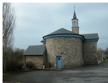
Elévation Ouest : vue générale IVR53_20073505112NUCA