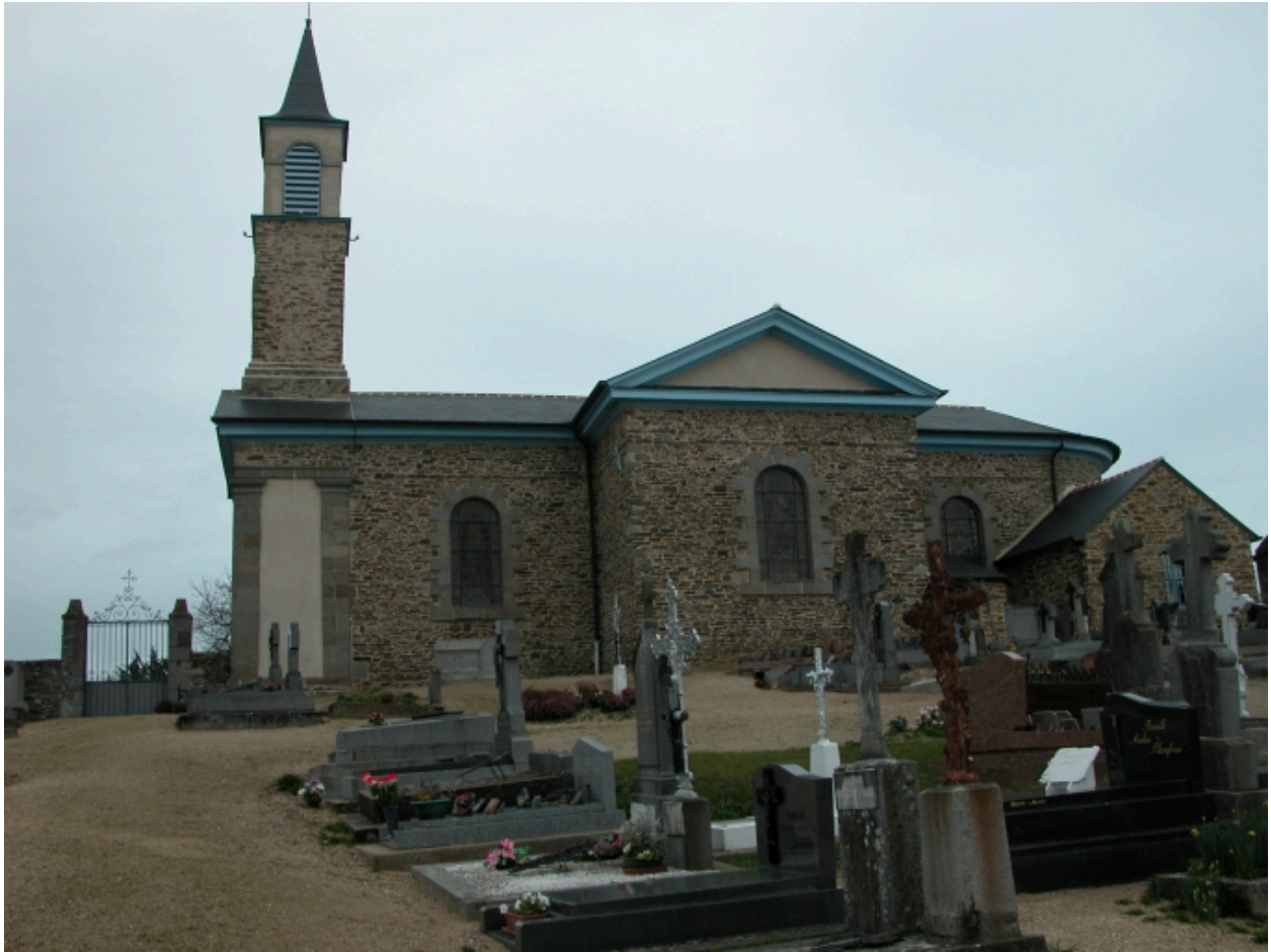
Elévation Sud : vue générale