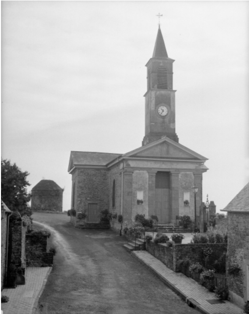
Elévation Ouest : vue générale