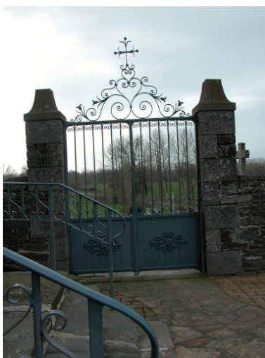
Entrée du cimetière IVR53_20073505118NUCA