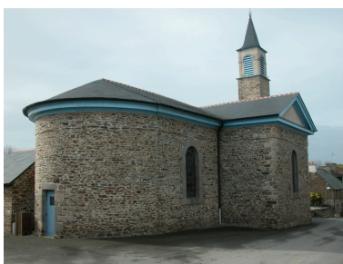
Elévation Nord-Est : vue générale IVR53_20073505113NUCA

IVR53_20073505114NUCA