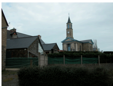
Vue générale IVR53_20073505115NUCA