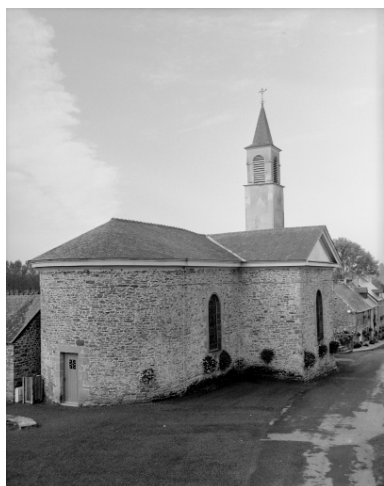
Elévation Nord-Est : vue générale