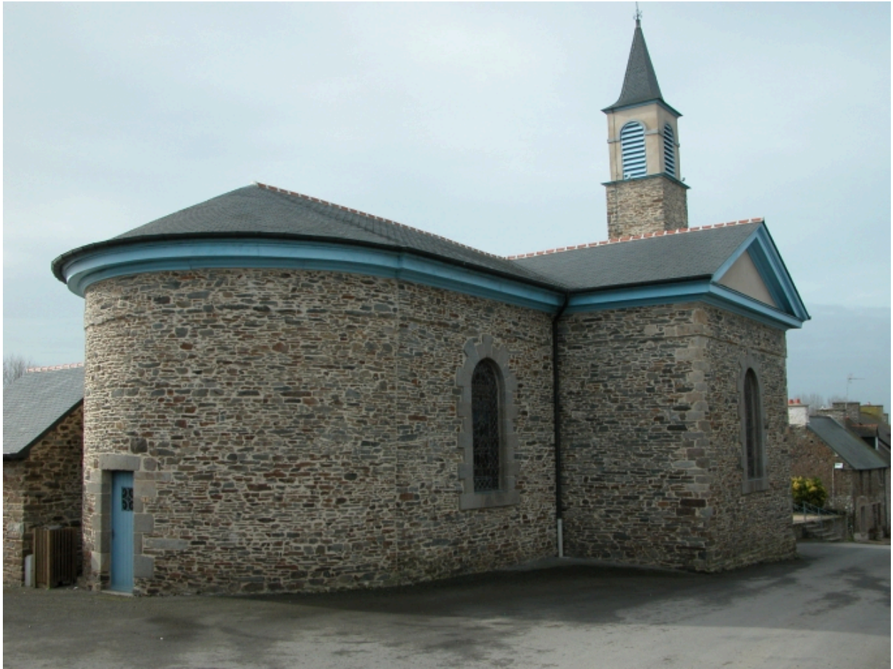
Elévation Nord-Est : vue générale