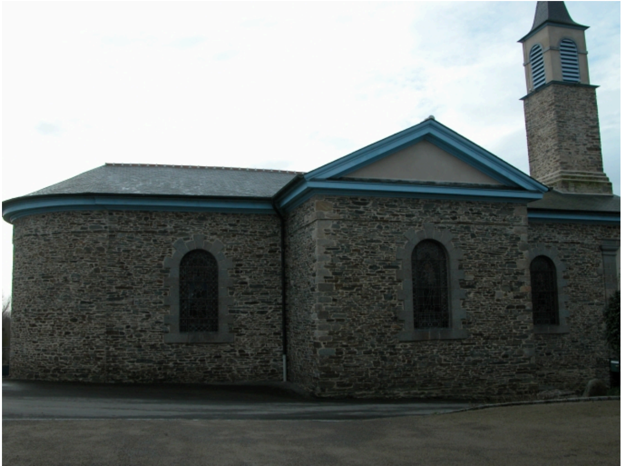
Eléation Nord : vue générale