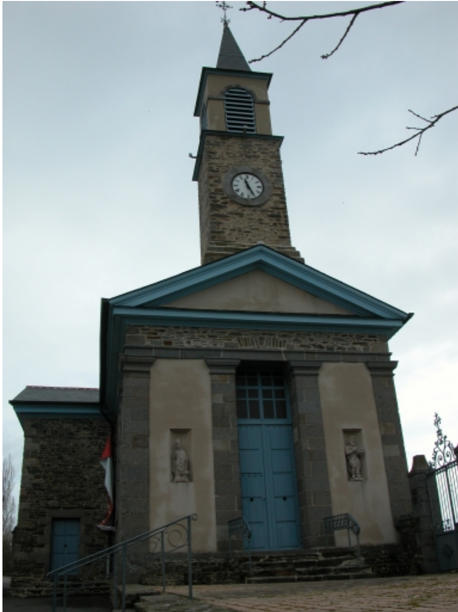
Elévation Ouest : vue générale