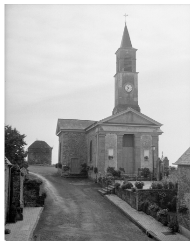
Elévation Ouest : vue générale IVR53_19943501788X