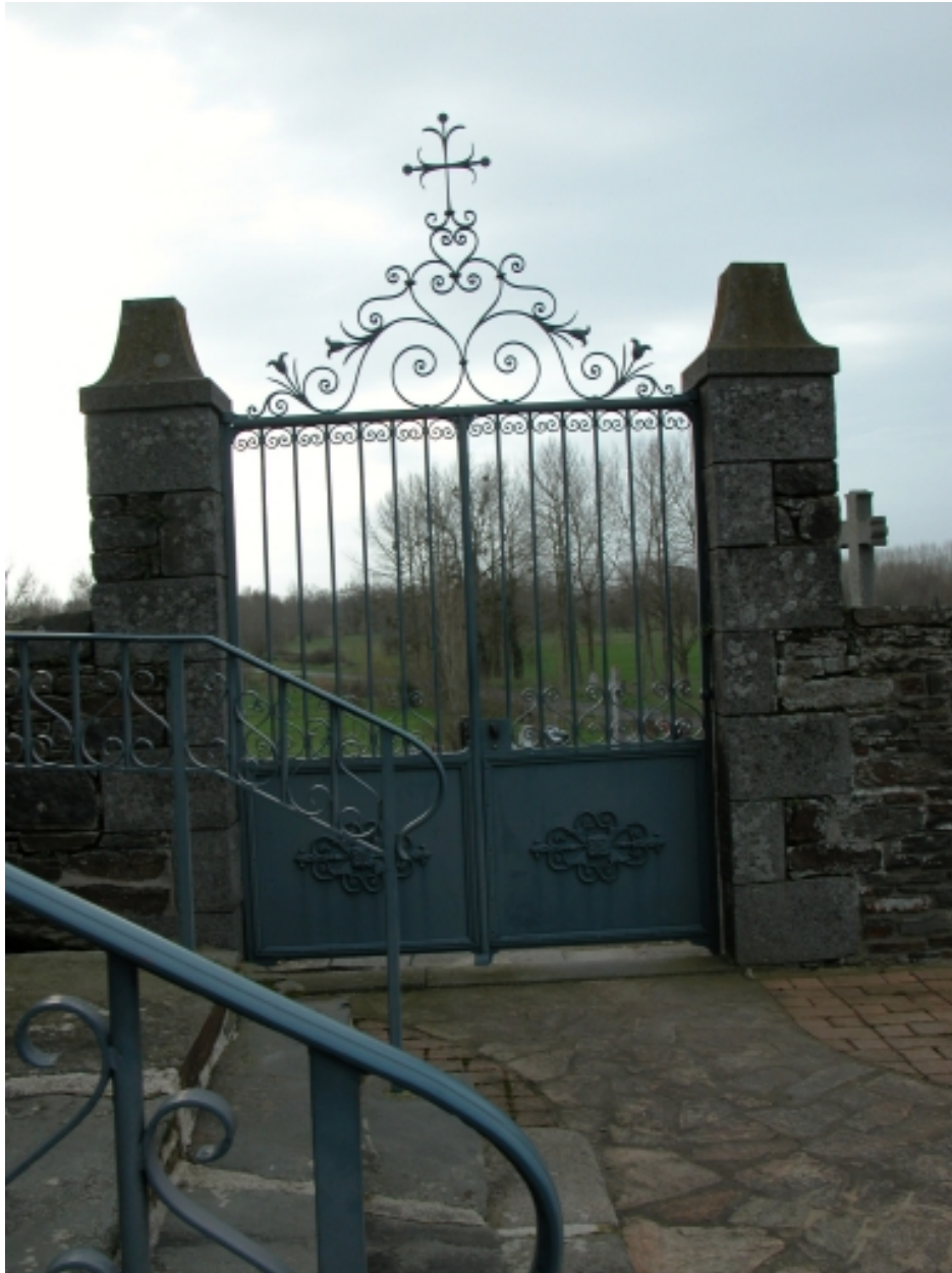
Entrée du cimetière