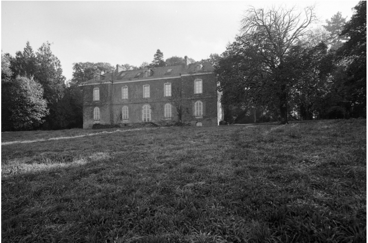
Vue générale de la façade nord