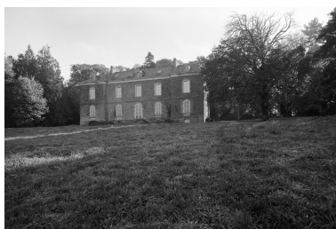
Vue générale de la façade nord