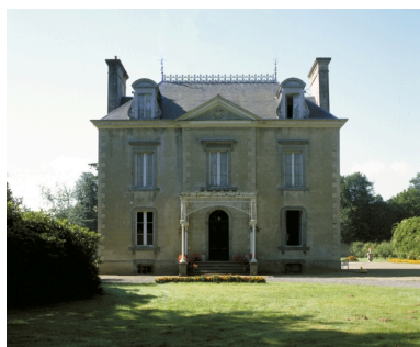
Vue nord du logis