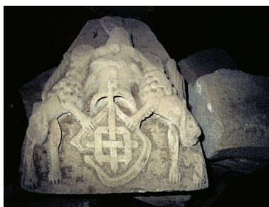
détail de l'écu du portail