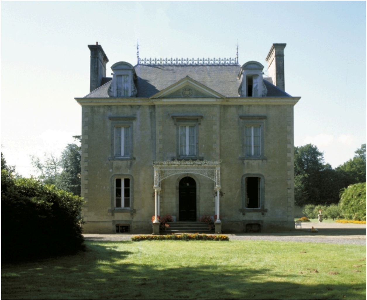
Vue nord du logis