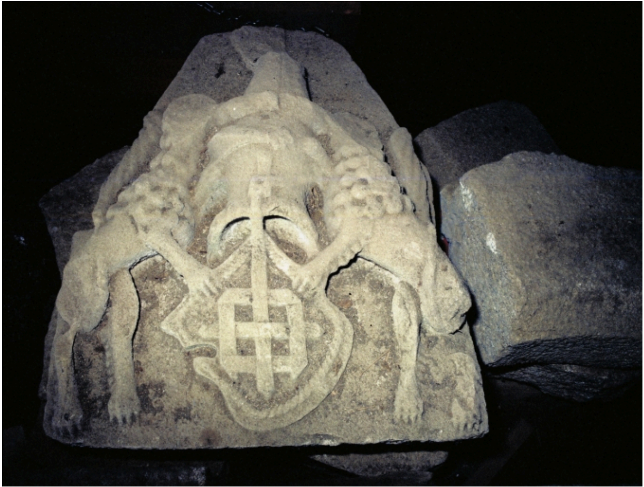
détail de l'écu du portail