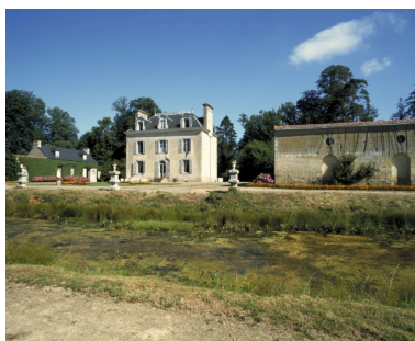
Vue générale sud, IVR53_19992200479XA