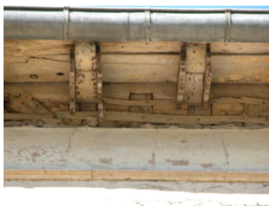
Détail de la corniche. IVR53_20043504391NUCA