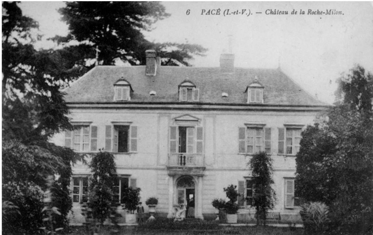
Le château. Carte postale vers 1900.