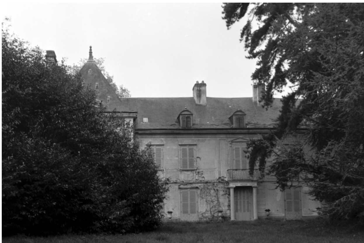
Vue générale rapprochée en 1973.