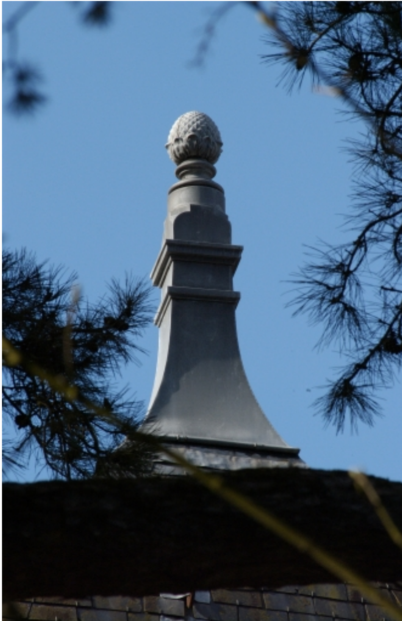
Epi de faitage