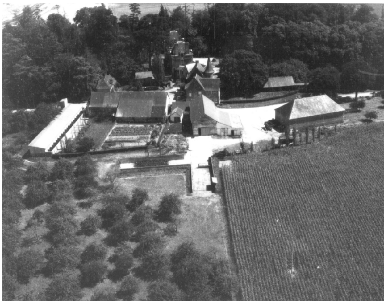
Vue aérienne vers l'est