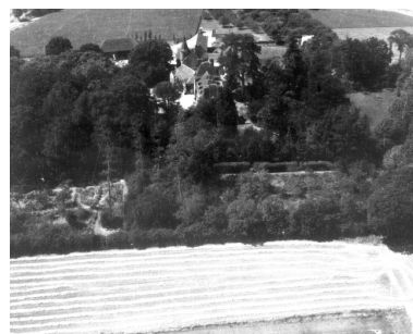
Vue aérienne vers l'ouest IVR53_19843500585V