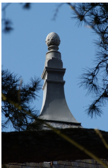
Epi de faîtage