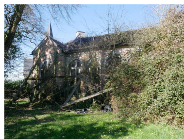
Orangerie IVR53_20193505441NUCA