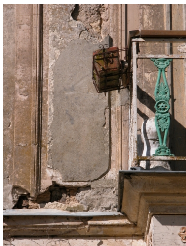
Détail sur l'enduit.