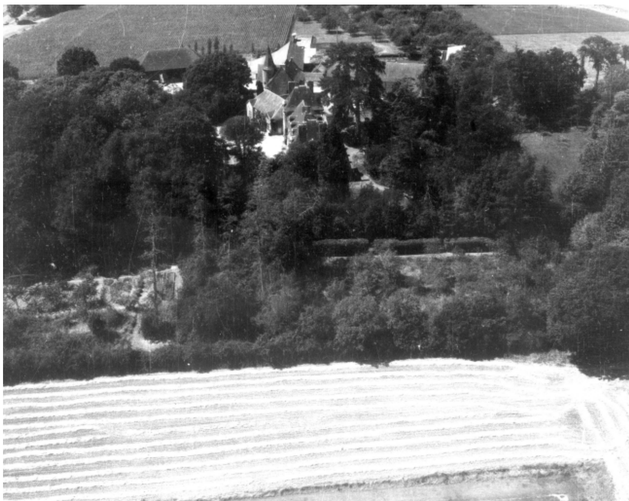
Vue aérienne vers l'ouest