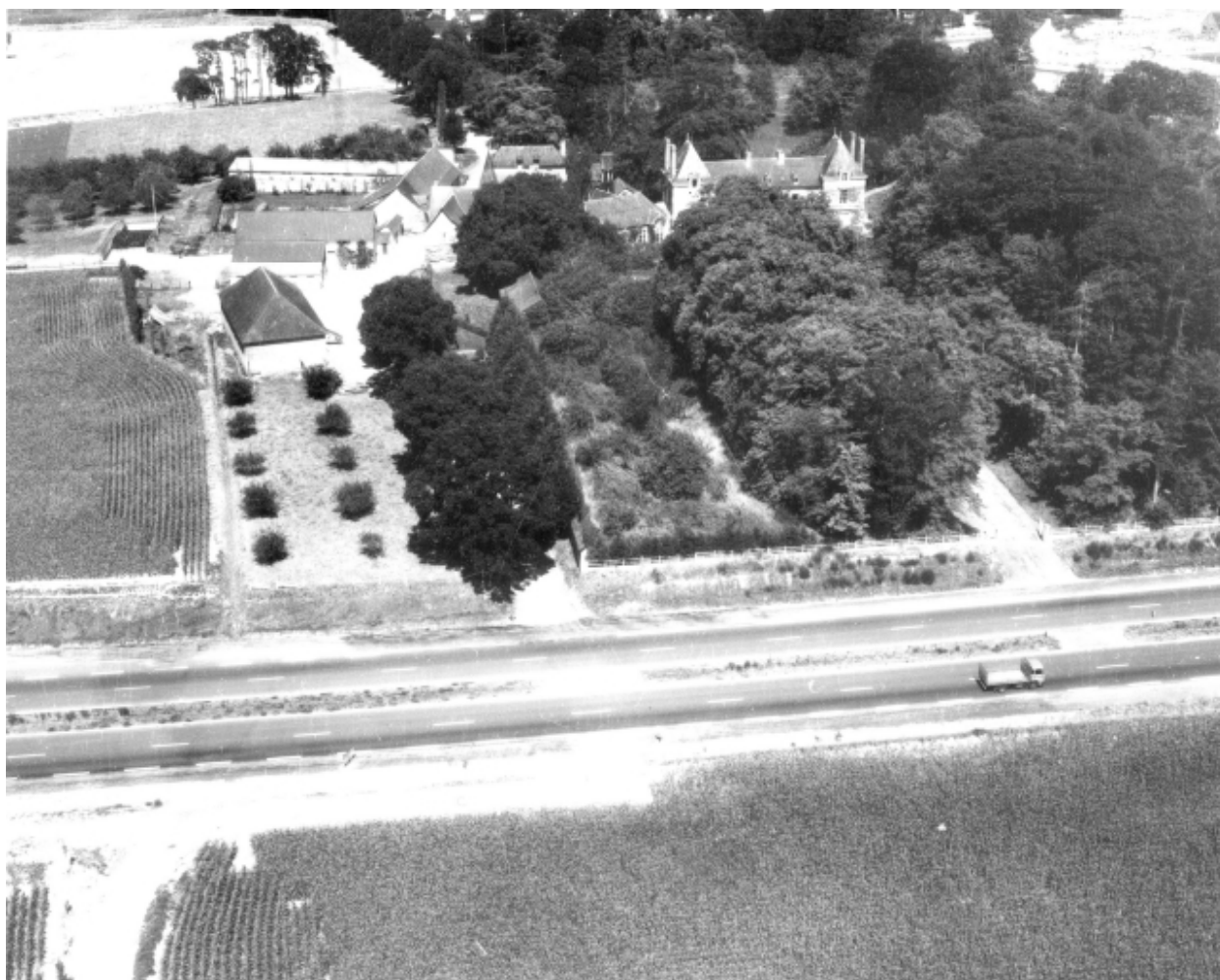
Vue aérienne vers le nord