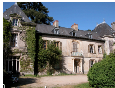
Vue générale sud