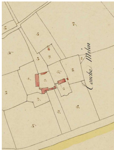
L'ancien manoir et le nouveau logis sur le cadastre de 1814.