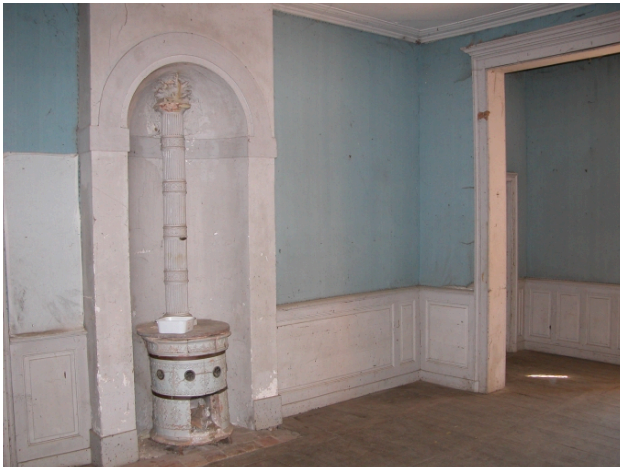
Vue intérieure avec poêle de faïence. Etat en 2004.