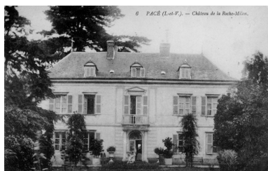
Le château. Carte postale vers 1900. IVR53_19883500440XB