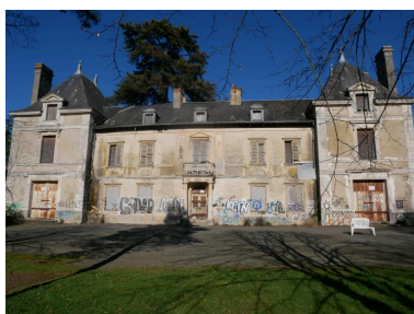
Façade arrière IVR53_20193505440NUCA