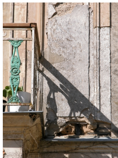
Détail sur l'enduit. IVR53_20043504389NUCA