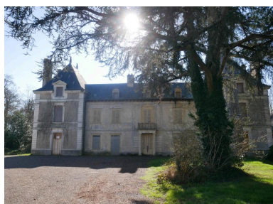
Façade principale IVR53_20193505439NUCA