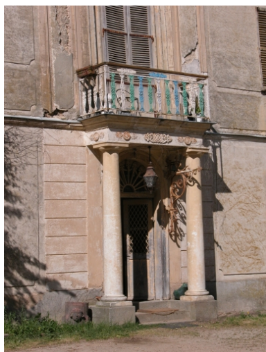
Porte sud IVR53_20043504388NUCA