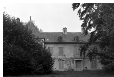
Vue générale rapprochée en 1973.