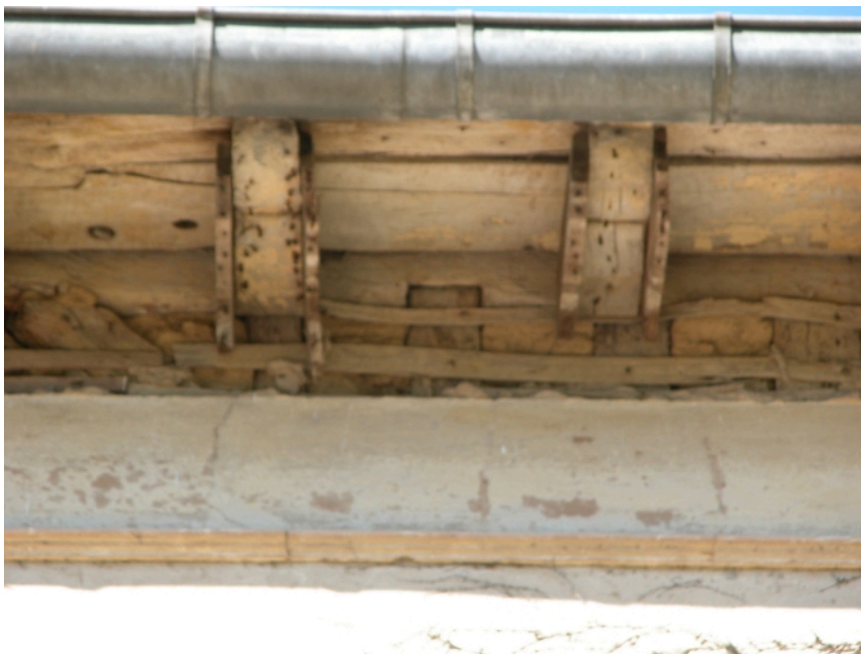
Détail de la corniche.