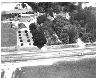
Vue aérienne vers le nord