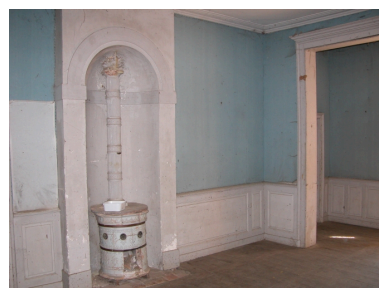
Vue intérieure avec poêle de faïence. Etat en 2004. IVR53_20043504387NUCA