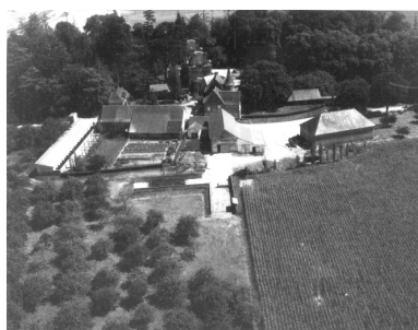
Vue aérienne vers l'est IVR53_19843500570V