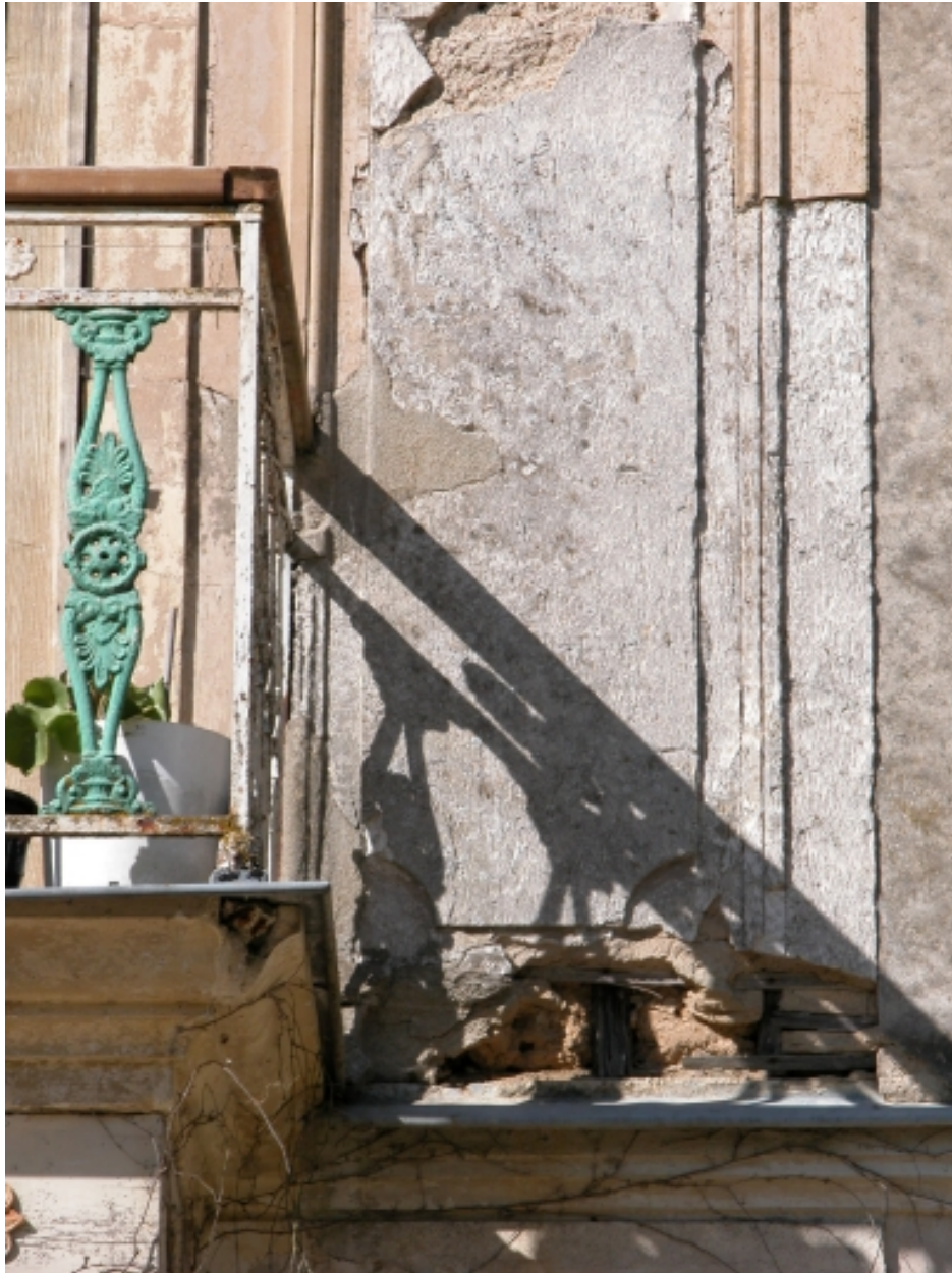
Détail sur l'enduit.