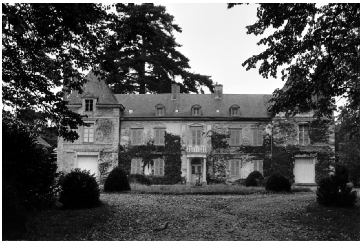
Vue générale en 1973