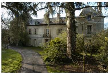
Vue générale nord IVR53_20043500395NUCA