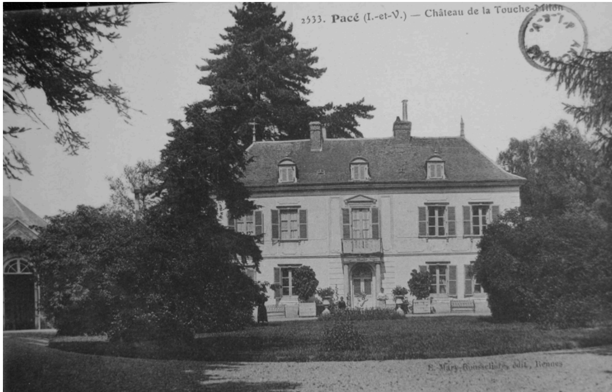
Le château de la Touche Milon. Carte postale vers 1900.