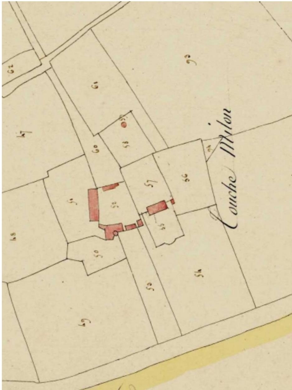
L'ancien manoir et le nouveau logis sur le cadastre de 1814.