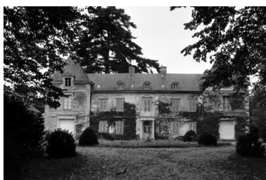
Vue générale en 1973 IVR53_19733500584Z