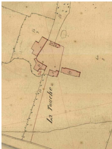
L'ancien manoir et le nouveau logis sur le cadastre de 1851. IVR53_20043503861NUC