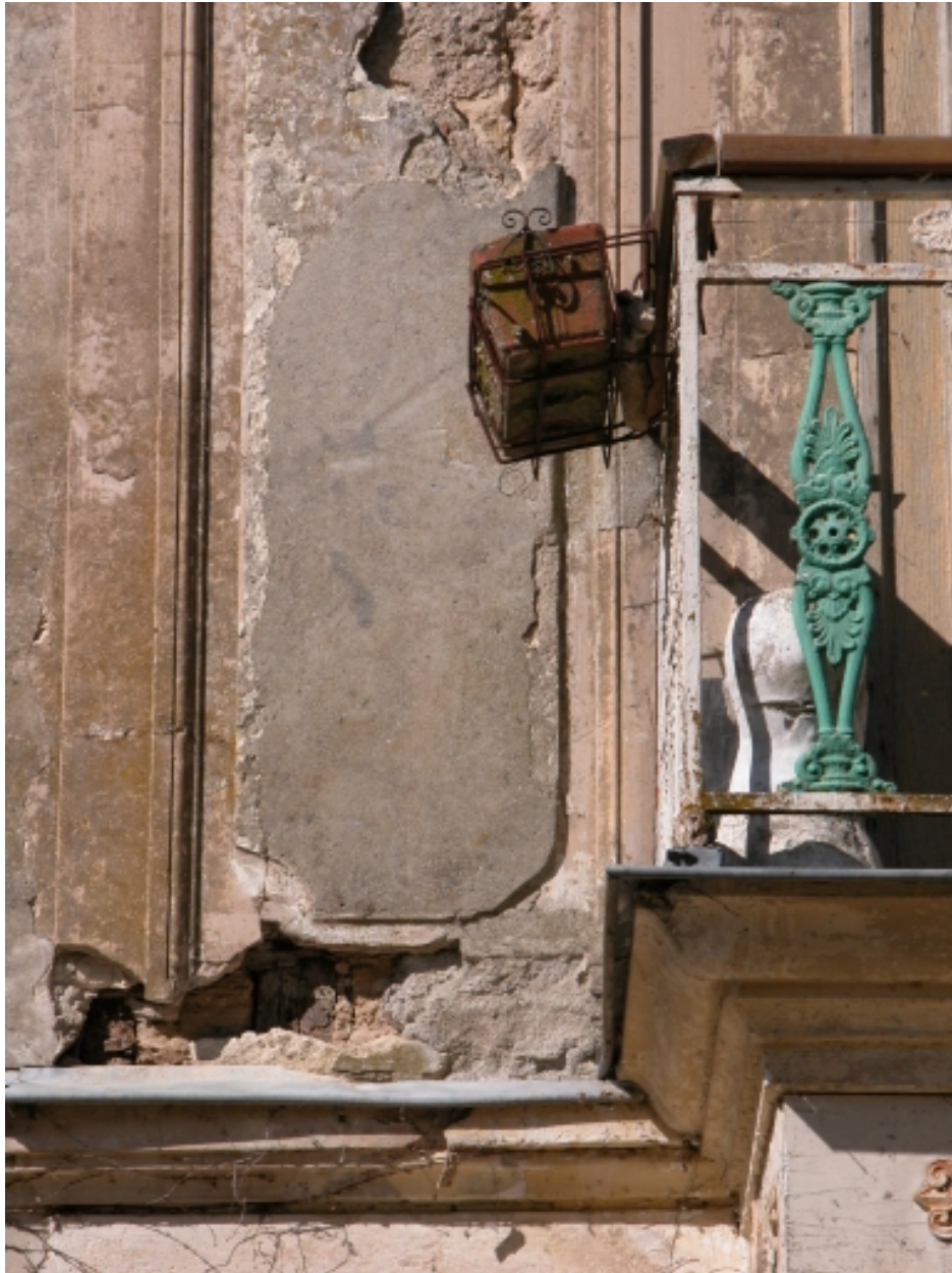
Détail sur l'enduit.