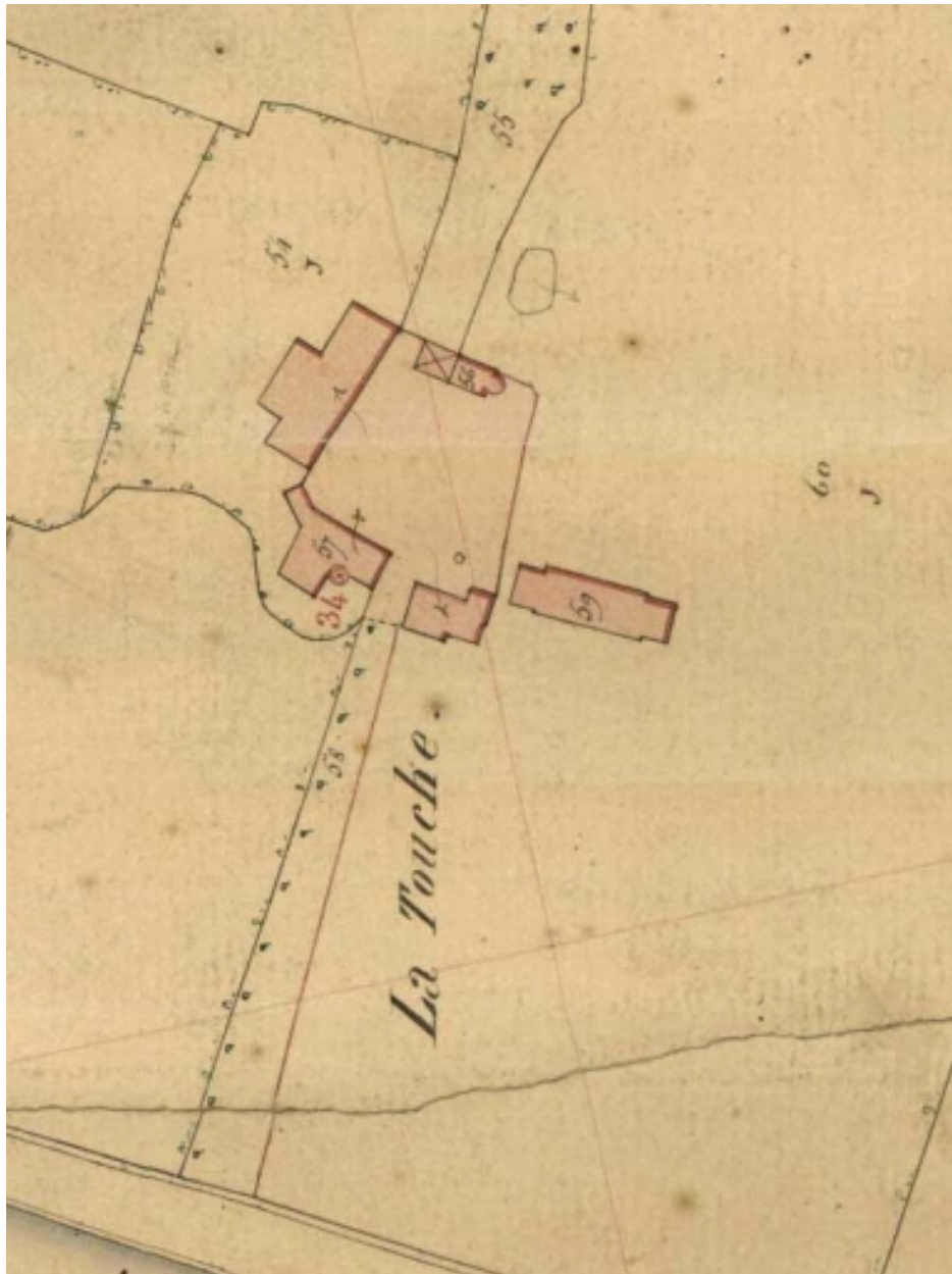
L'ancien manoir et le nouveau logis sur le cadastre de 1851.