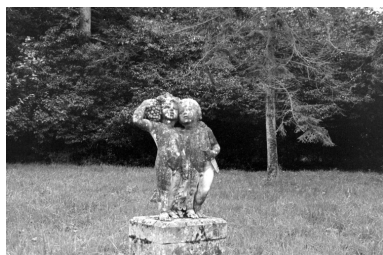
Parc, statue IVR53_19733500586Z