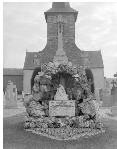
Monument aux morts, face ouest : vue générale IVR53_19873500521X