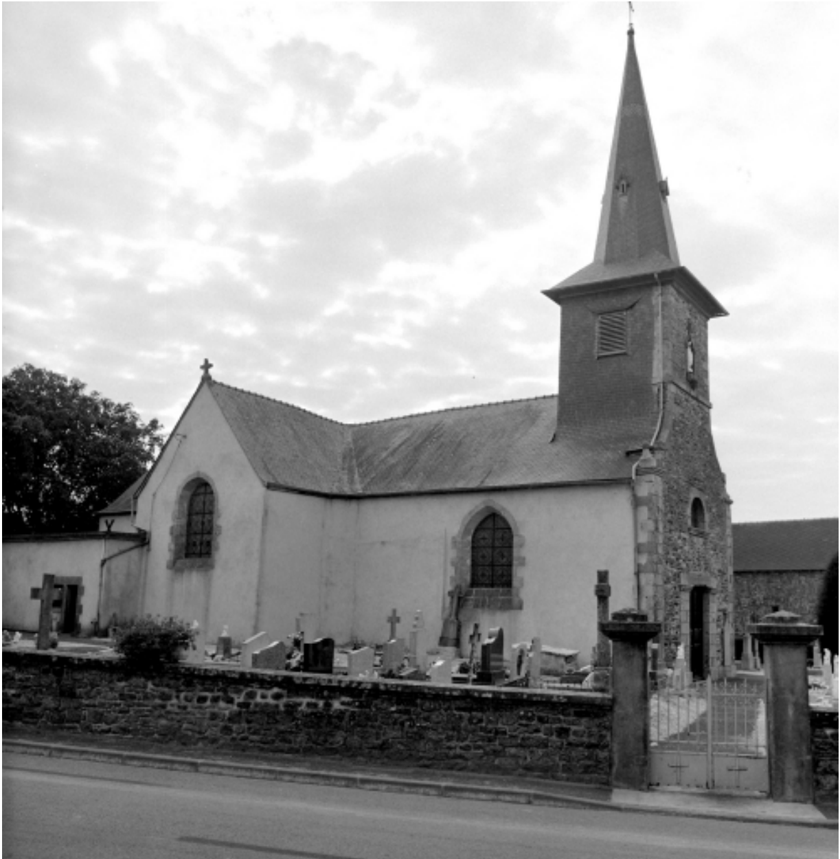
Vue générale nord.