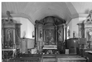
Intérieur : vue générale vers le choeur. IVR53_19873500139V