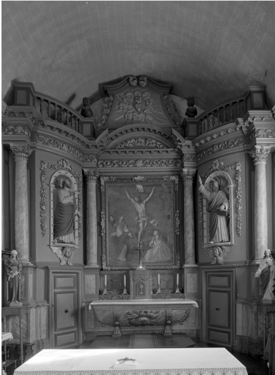
Intérieur, chœur, maître-autel : vue générale