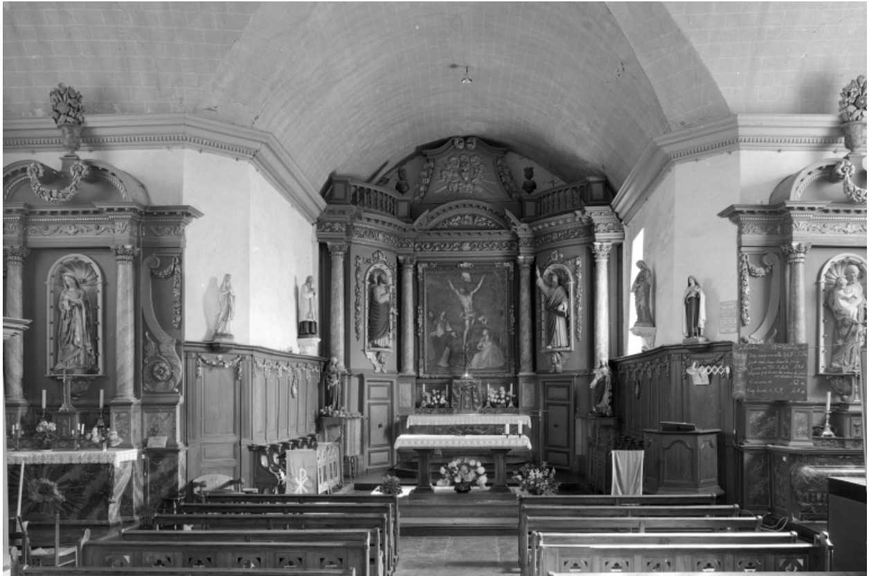
Intérieur : vue générale vers le chœur.