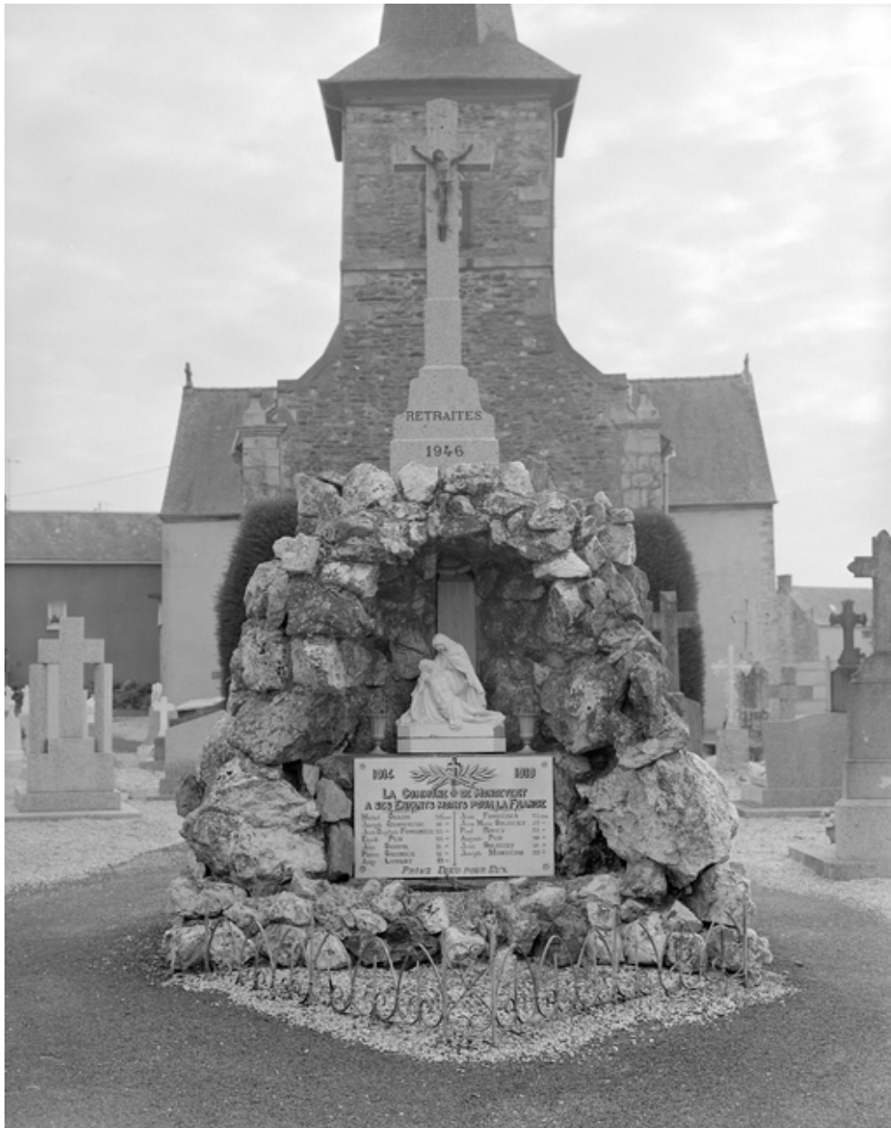
Monument aux morts, face ouest : vue générale