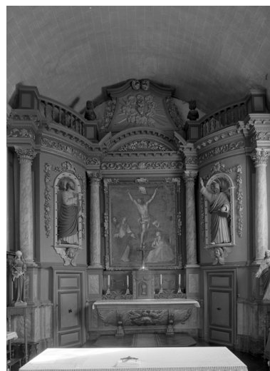
Intérieur, choeur, maître- autel : vue générale IVR53_19873500137V