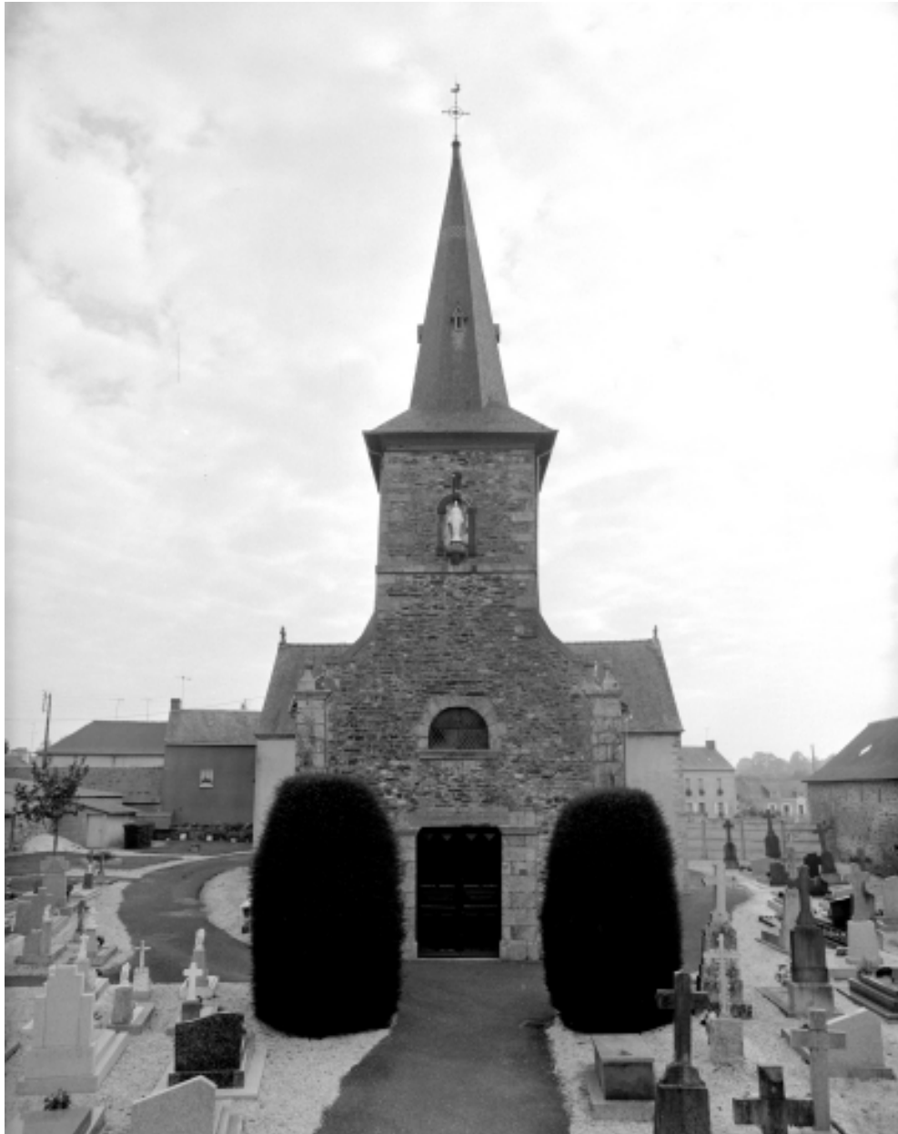
Vue générale ouest.