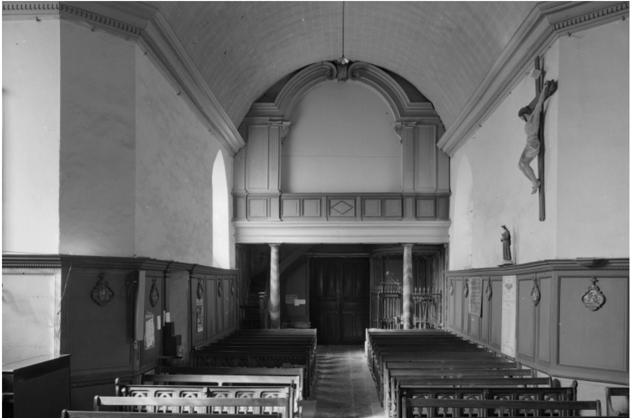
Nef vers la tribune ouest.