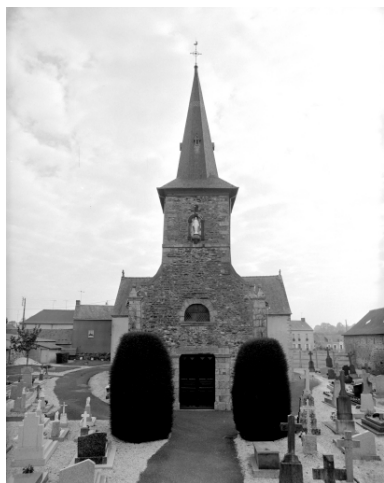
Vue générale ouest. IVR53_19873500522X