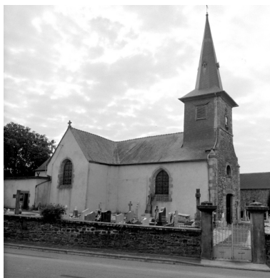
Vue générale nord. IVR53_19873500523X