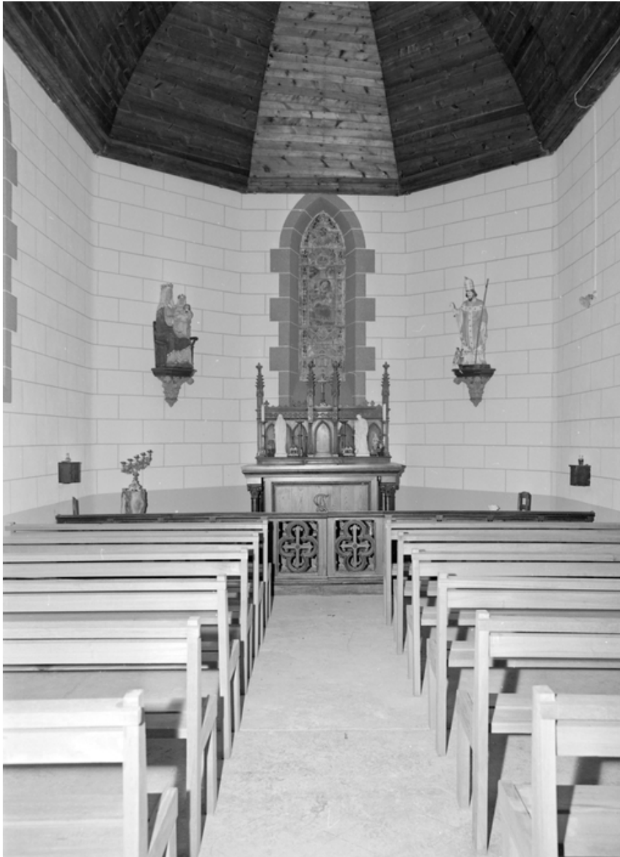
Vue intérieure vers le choeur.