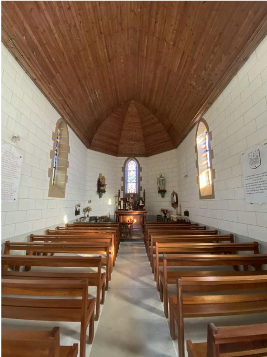
Vue générale de l'intérieur