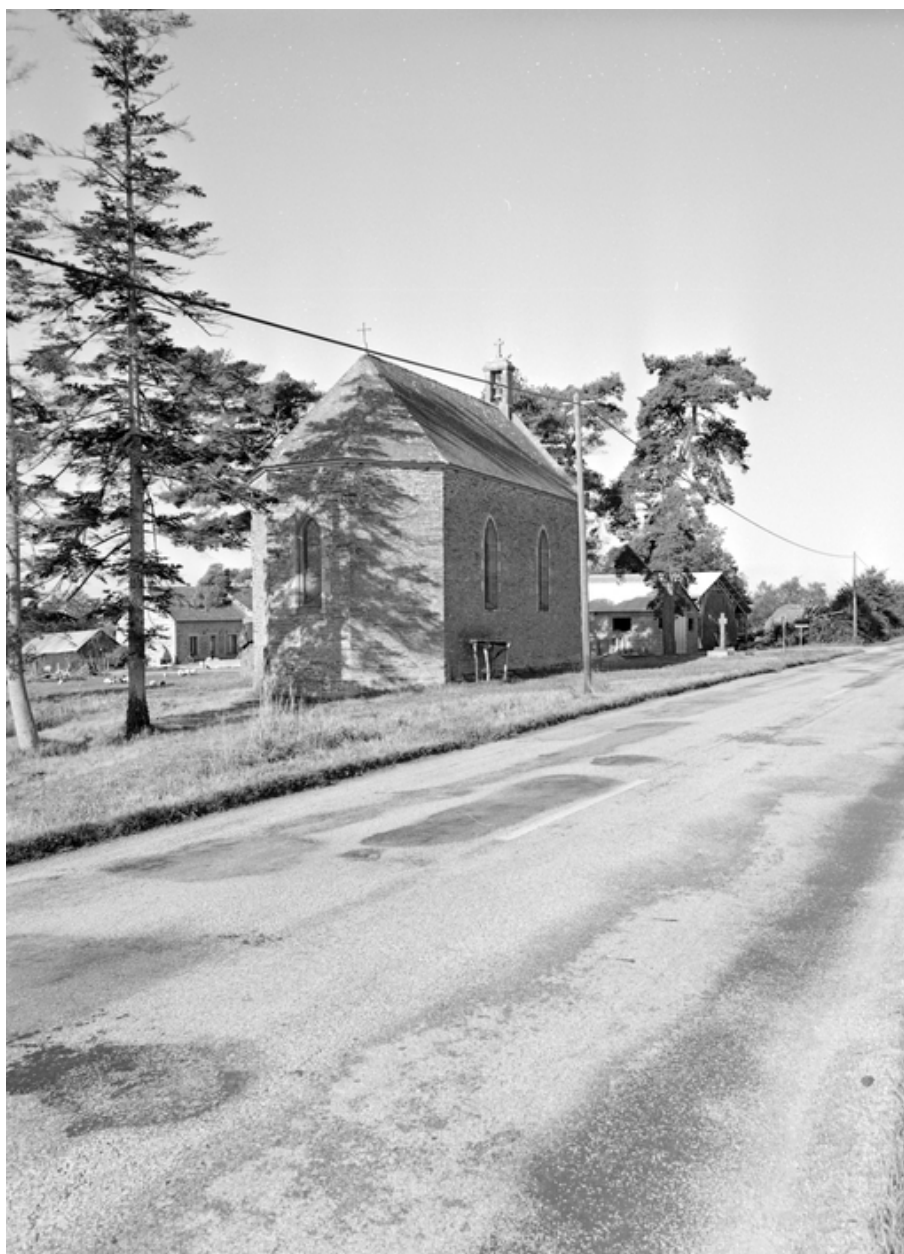
Vue générale nord-est.