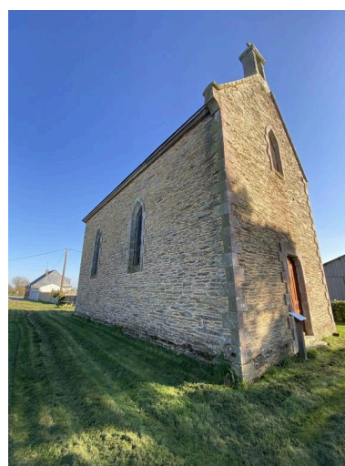
Vue nord-ouest