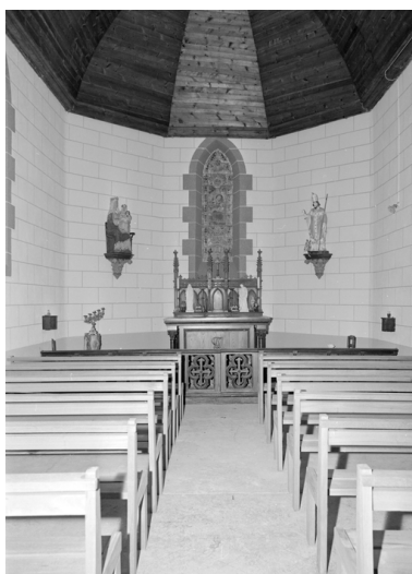
Vue intérieure vers le chœur. IVR53_19775600761X