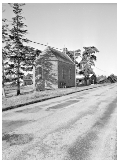
Vue générale nord-est. IVR53_19775600786X