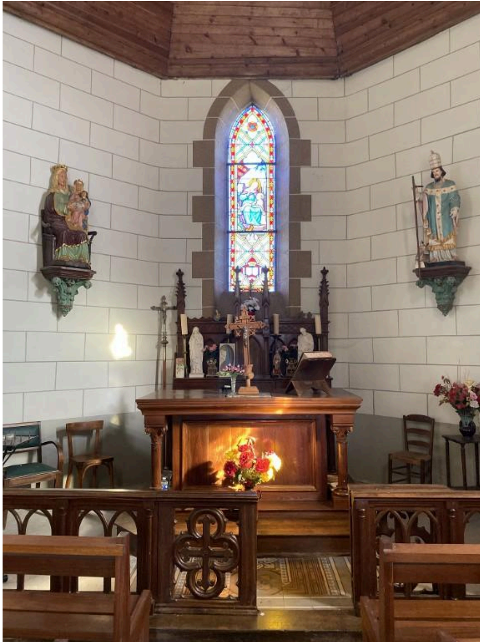
Vue de l'autel et du ch#ur