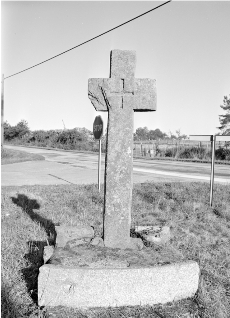
Croix monumentale, vue générale sud-est.