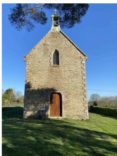
Vue ouest