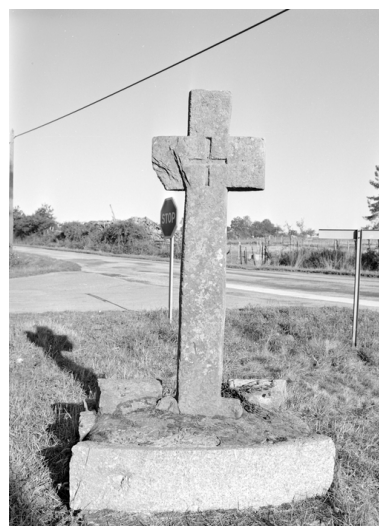
Croix monumentale, vue générale sud-est.