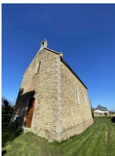
Vue sud-ouest