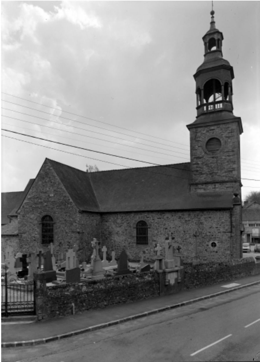
Vue générale prise du nord-ouest.