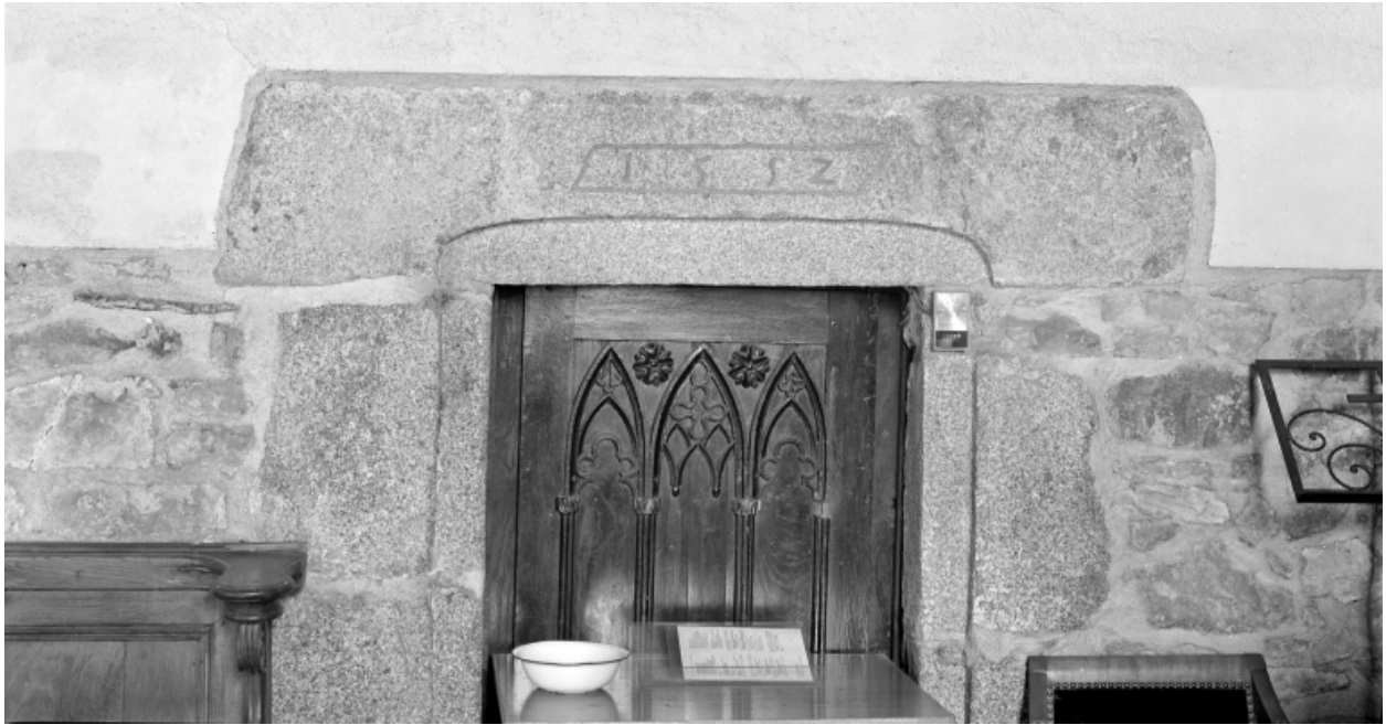
Choeur, détail de la porte datée 1552.