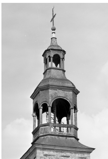
Vue générale du clocher. IVR53_19843500395X