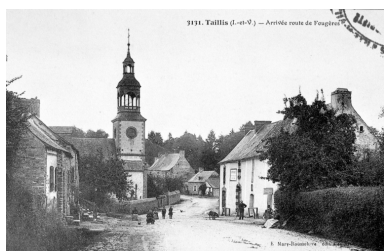
Carte postale ancienne - Elévation ouest : vue générale. IVR53_19933500931X