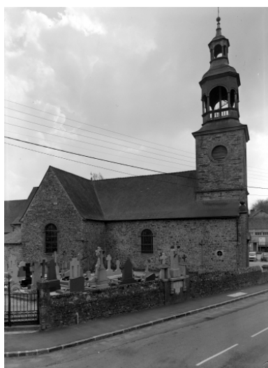
Vue générale prise du nord-ouest.