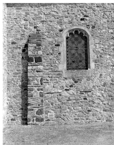
Extérieur, détail de la fenêtre et contrefort du mur sud du chœur.