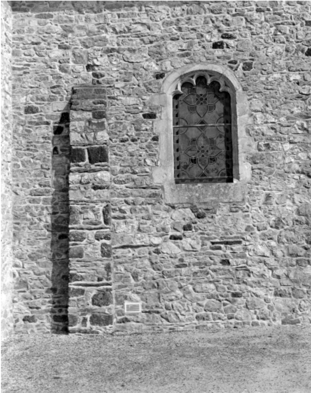
Extérieur, détail de la fenêtre et contrefort du mur sud du choeur.