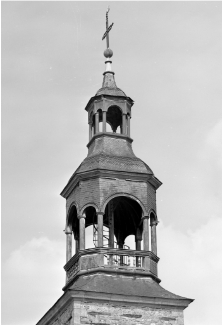
Vue générale du clocher.