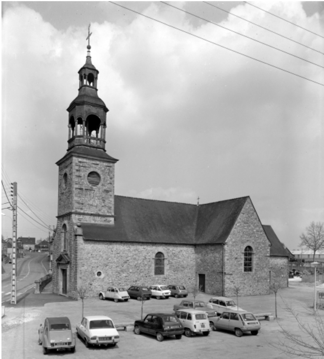
Vue générale prise du sud-ouest.