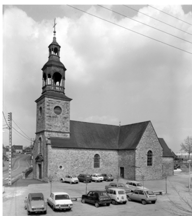
Vue générale prise du sud-ouest.