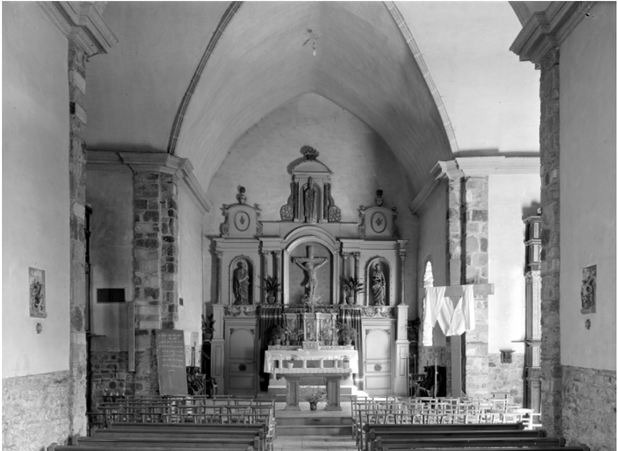
Choeur, vue générale prise de l'ouest.