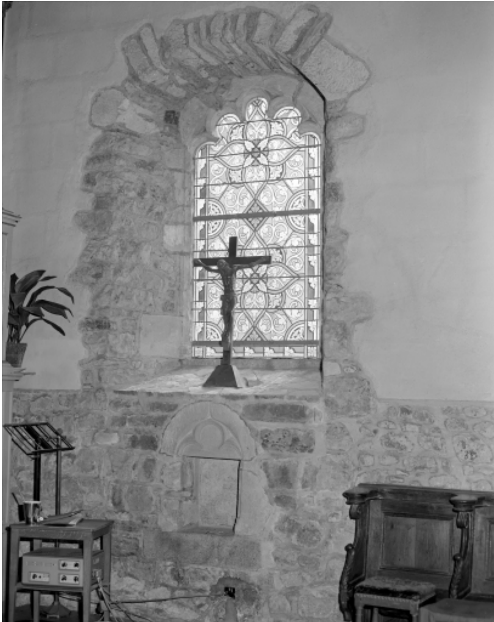
Choeur, vue de la fenêtre et de la niche crédence.