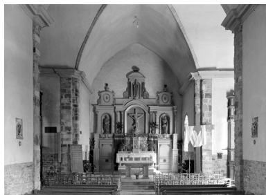
Choeur, vue générale prise de l'ouest. IVR53_19843500399V