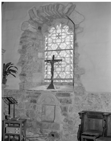
Choeur, vue de la fenêtre et de la niche crédence.