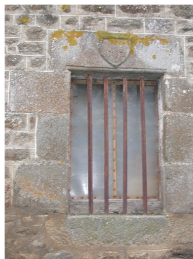
Détail de la fenêtre remployée sur l'étable IVR53_20053518886NUCA