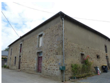
Vue générale sud ouest IVR53_20243531224NUCA