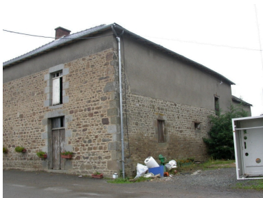
L'étable IVR53_20053518884NUCA