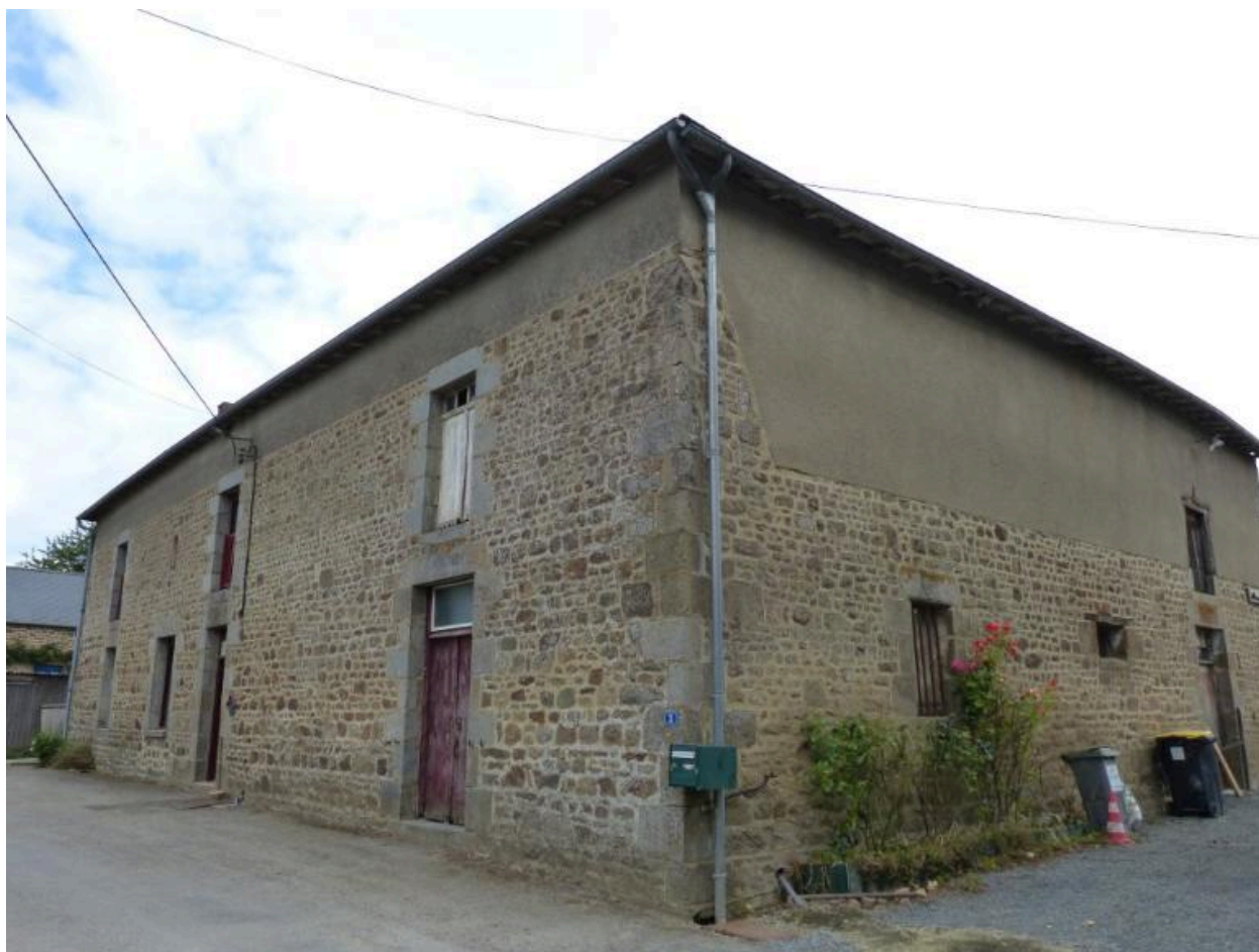
Vue générale sud ouest