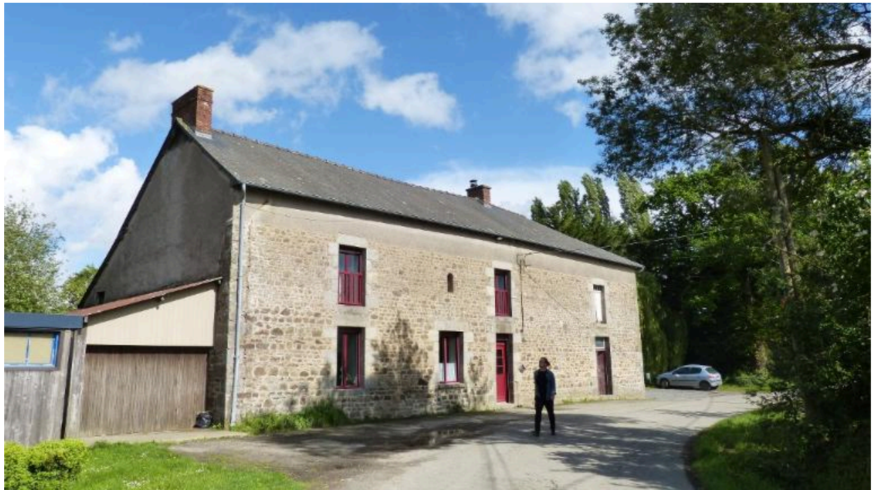
Vue générale nord ouest