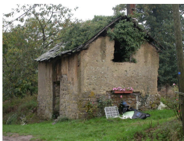
La porcherie