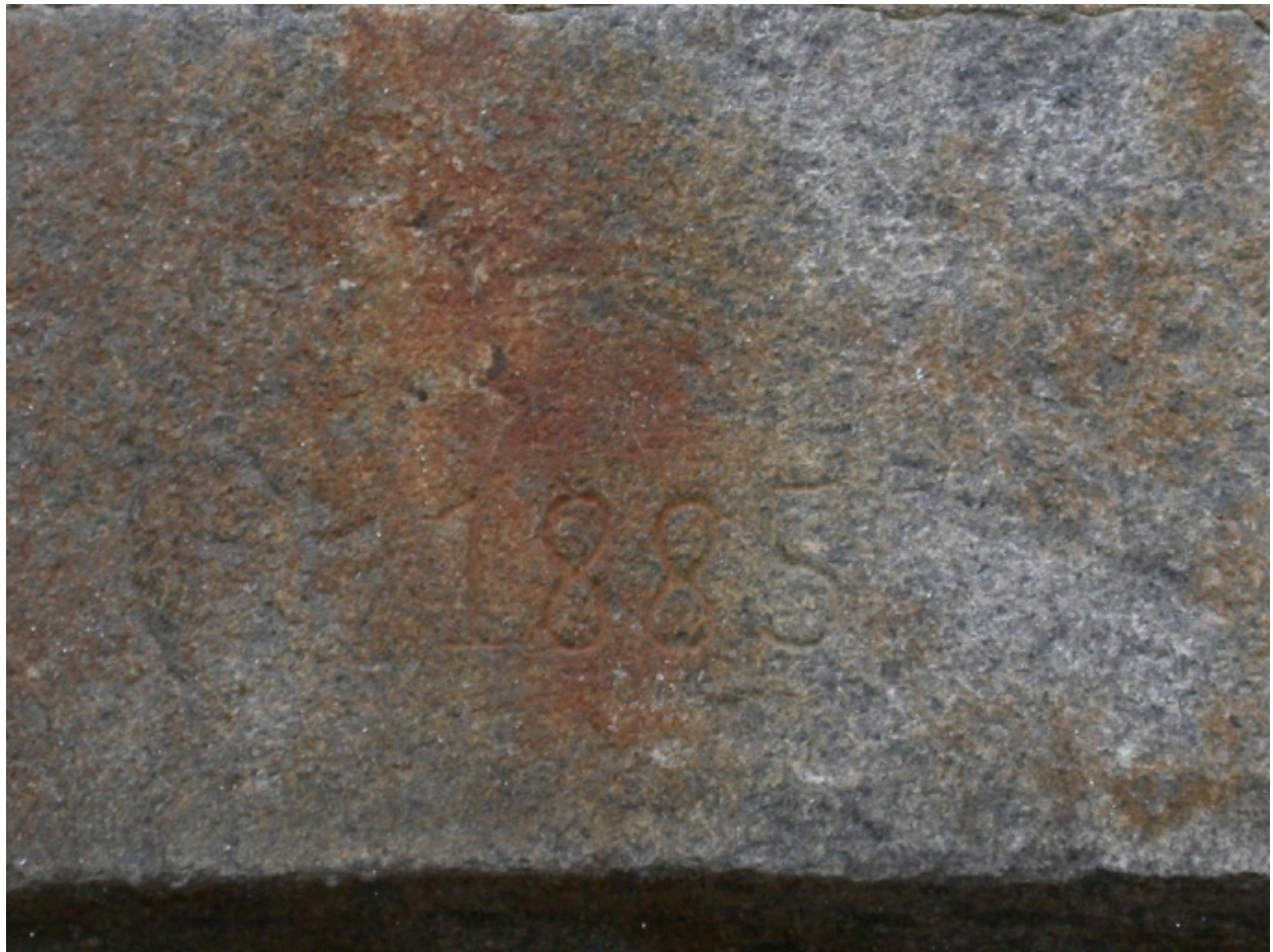
Détail de la date