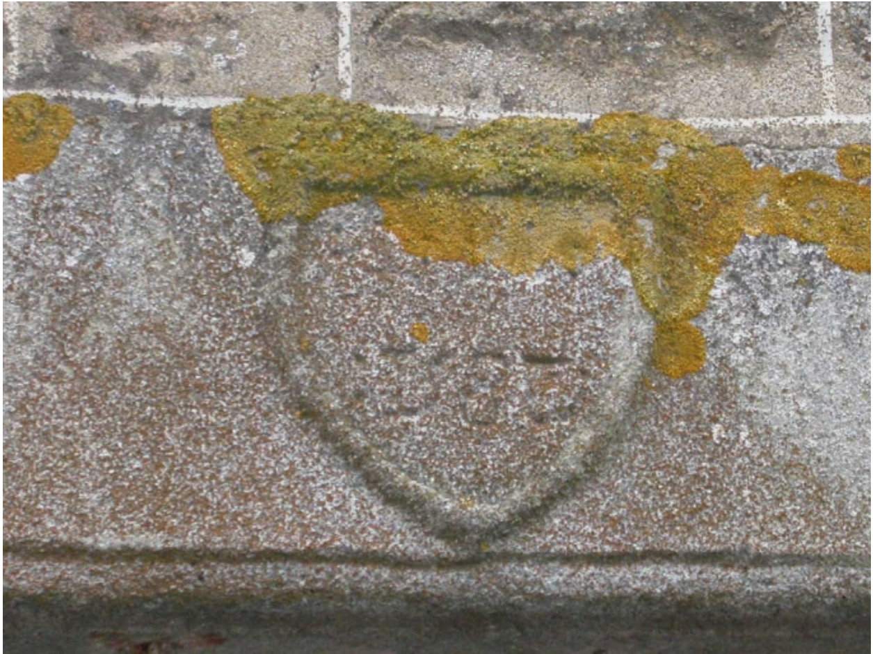
Détail de l'écu