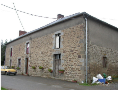
Vue générale sud-ouest IVR53_20053518883NUCA