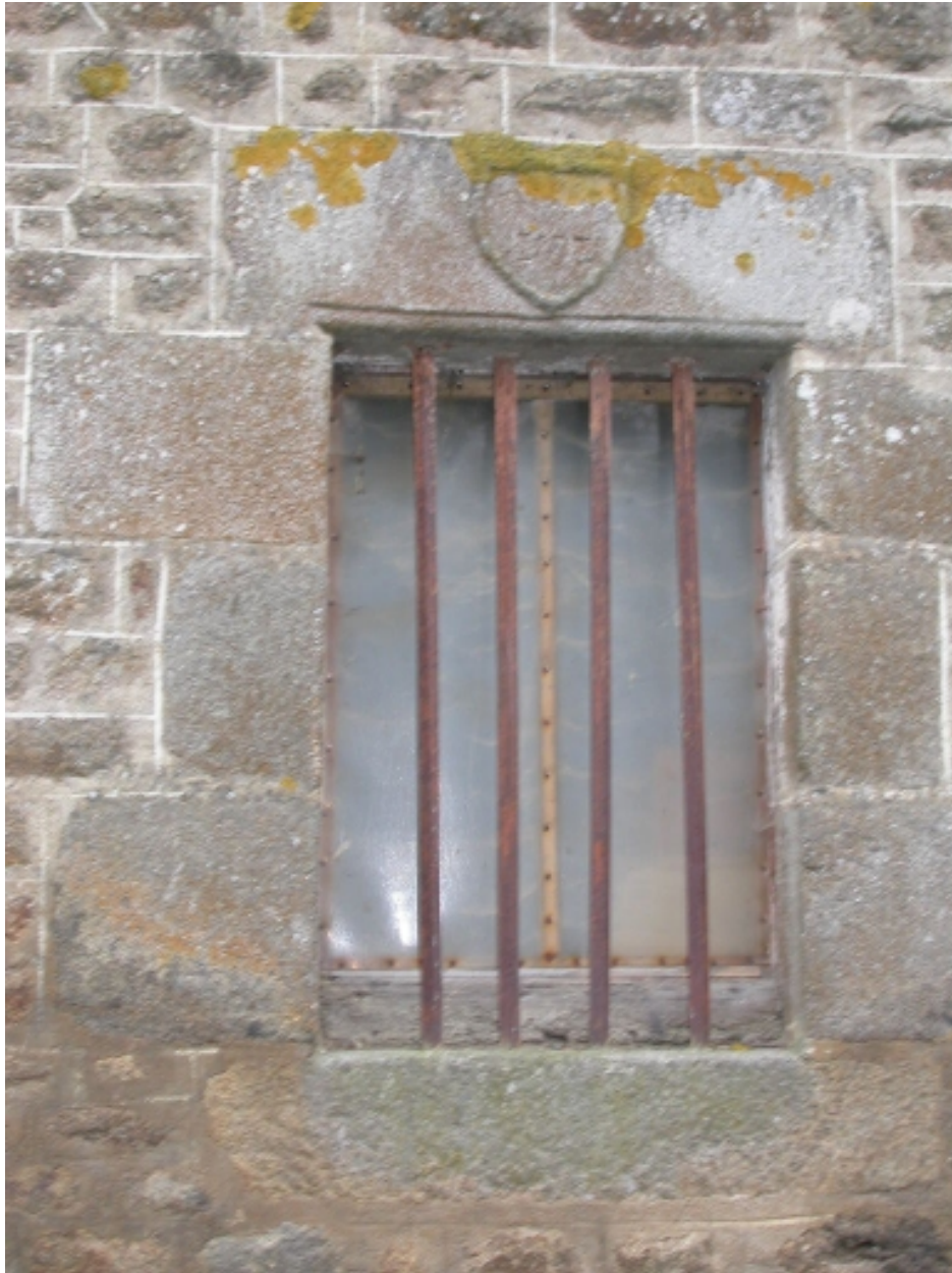
Détail de la fenêtre remployée sur l'étable