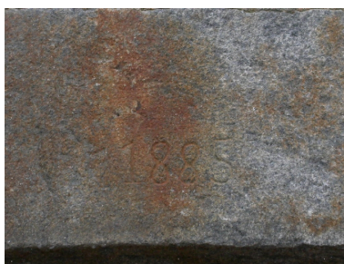
Détail de la date IVR53_20053518888NUCA