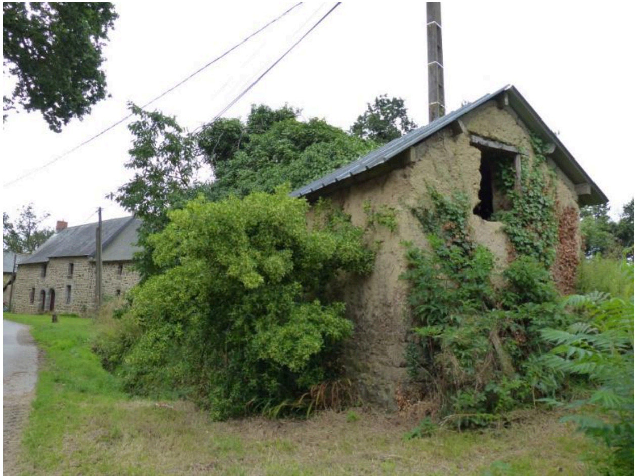
Vue générale nord est d'une porcherie