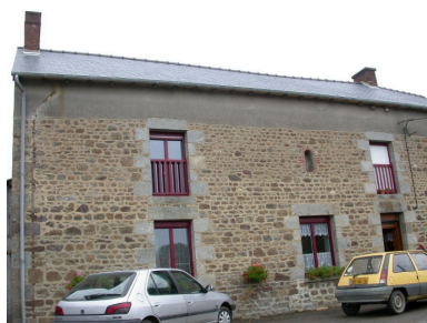
Le logis IVR53_20053518885NUCA