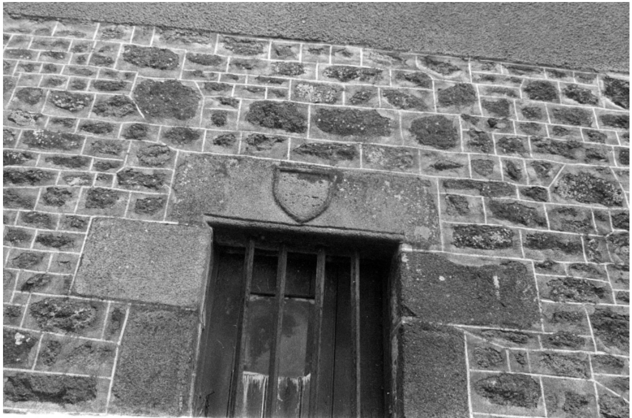
La fenêtre en 1975