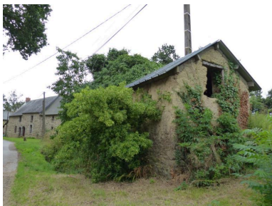
Vue générale nord est d'une porcherie IVR53_20243531226NUCA