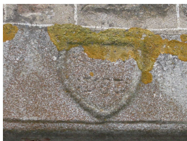
Détail de l'écu