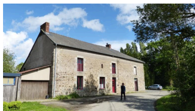
Vue générale nord ouest IVR53_20243531223NUCA