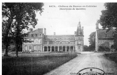
Vue générale IVR53_20042209044NUCB