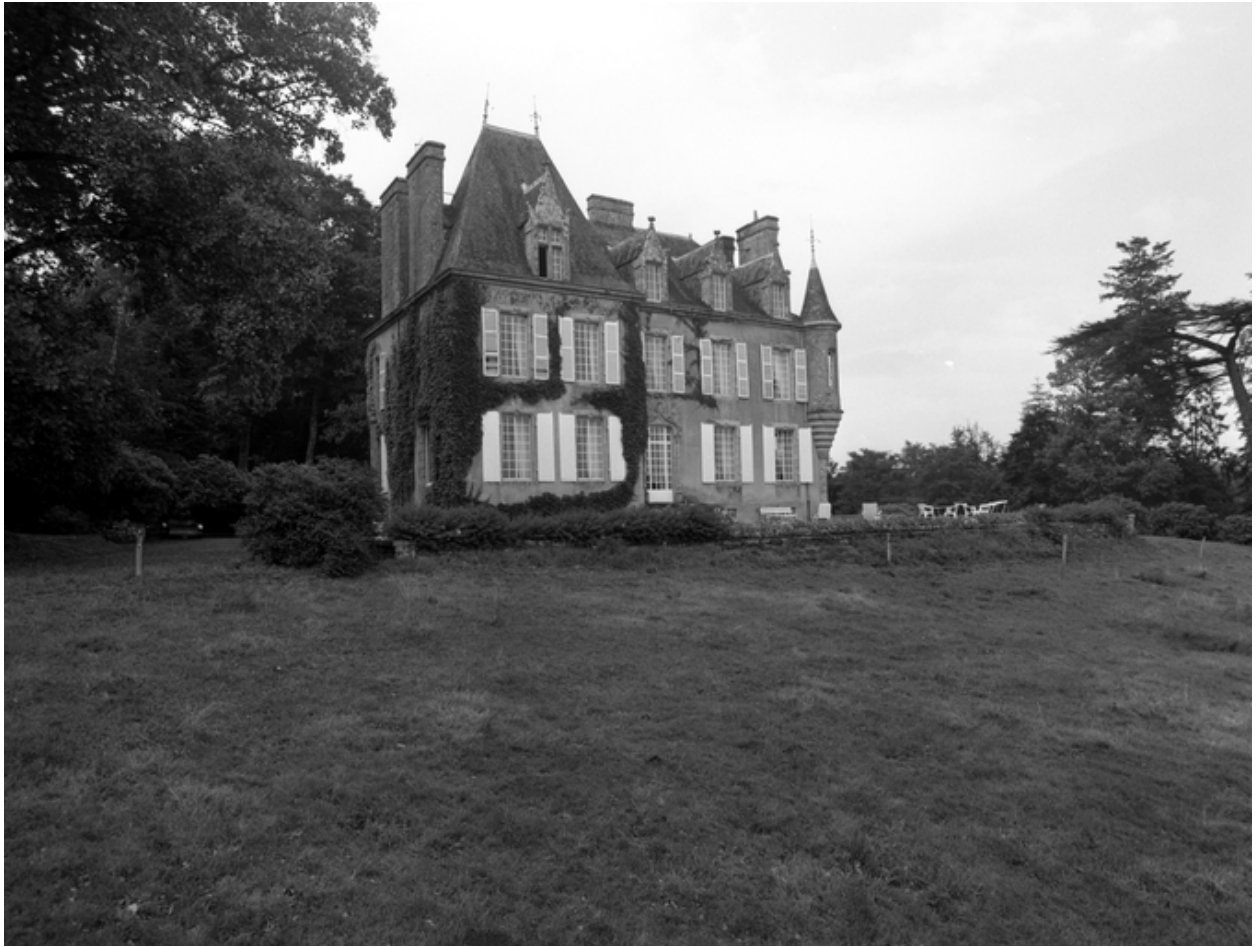
Logis, élévation sud à l'état de vestiges