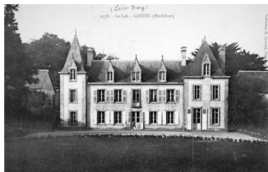
Vue générale (carte postale), IVR53_20045606231NUCB