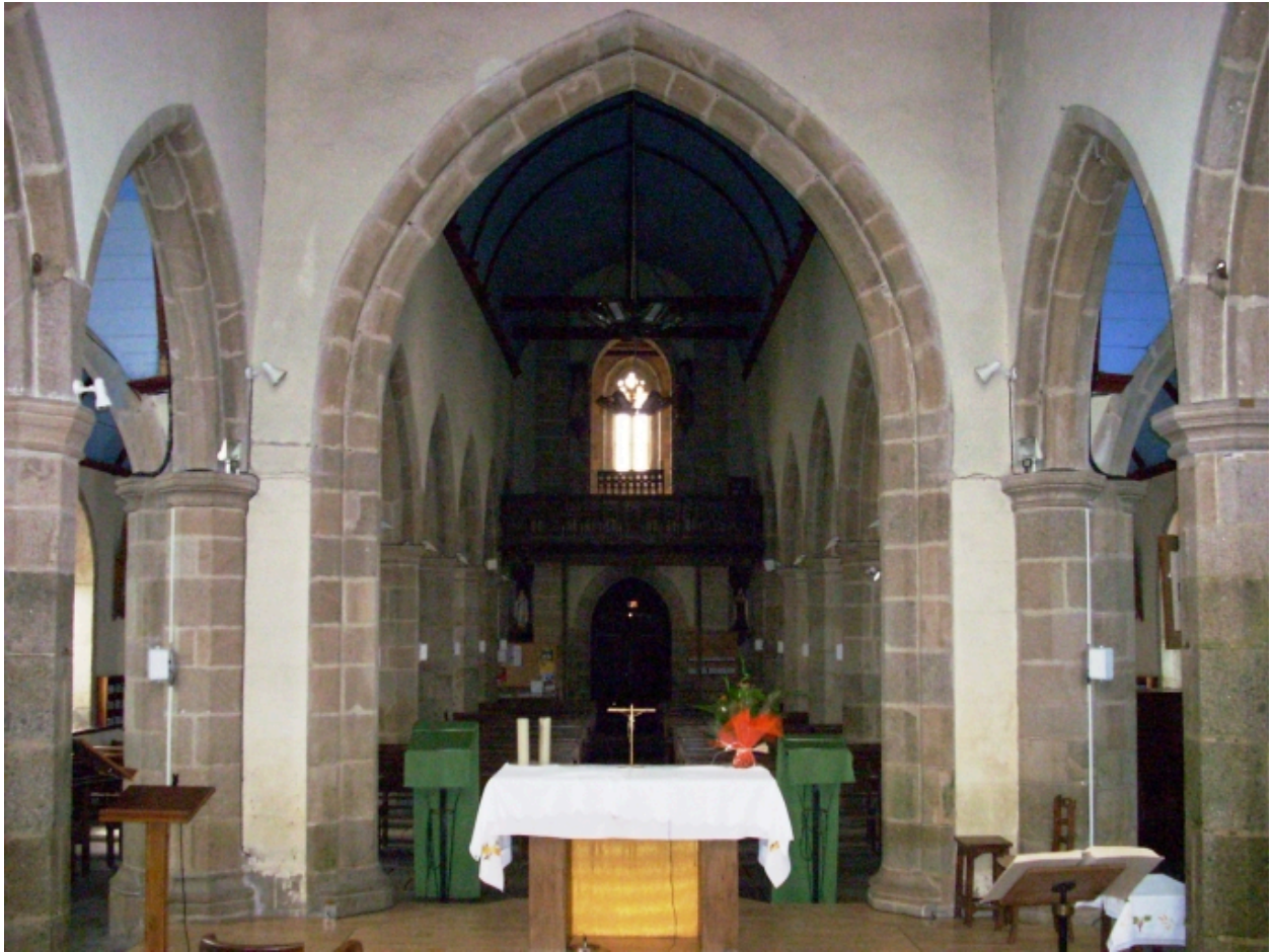
Santec, église paroissiale Saint-Adrien : vue axiale ouest depuis le chœur