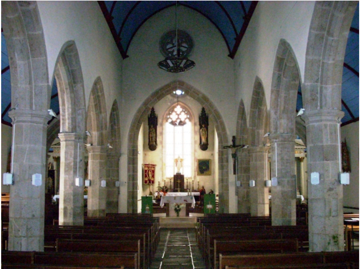
Santec, église paroissiale Saint-Adrien : vue axiale est