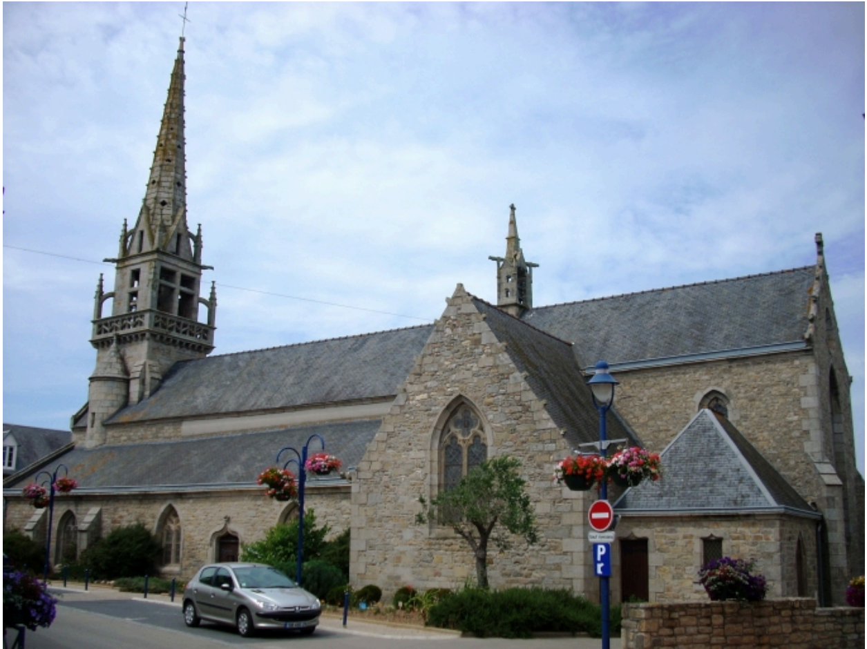
Santec, église paroissiale Saint-Adrien : vue générale sud-est