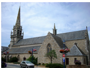
Santec, église paroissiale Saint-Adrien : vue générale sud-est IVR53_20082906549NUCA