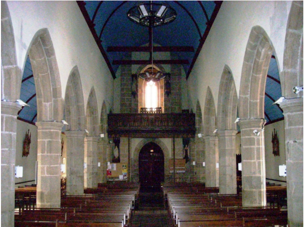
Santec, église paroissiale Saint-Adrien : vue axiale ouest