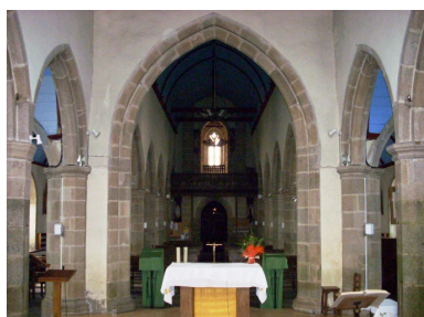
Santec, église paroissiale Saint-Adrien : vue axiale ouest depuis le choeur