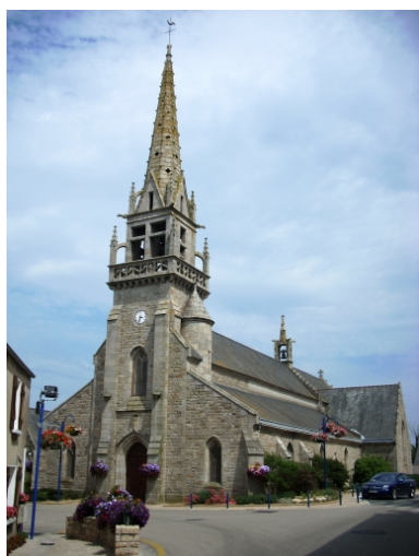
Santec, église paroissiale Saint-Adrien : vue générale sud-ouest IVR53_20082906548NUCA