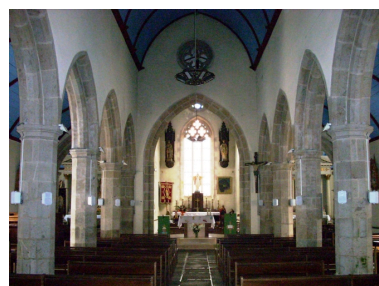
Santec, église paroissiale Saint-Adrien : vue axiale est IVR53_20082906550NUCA