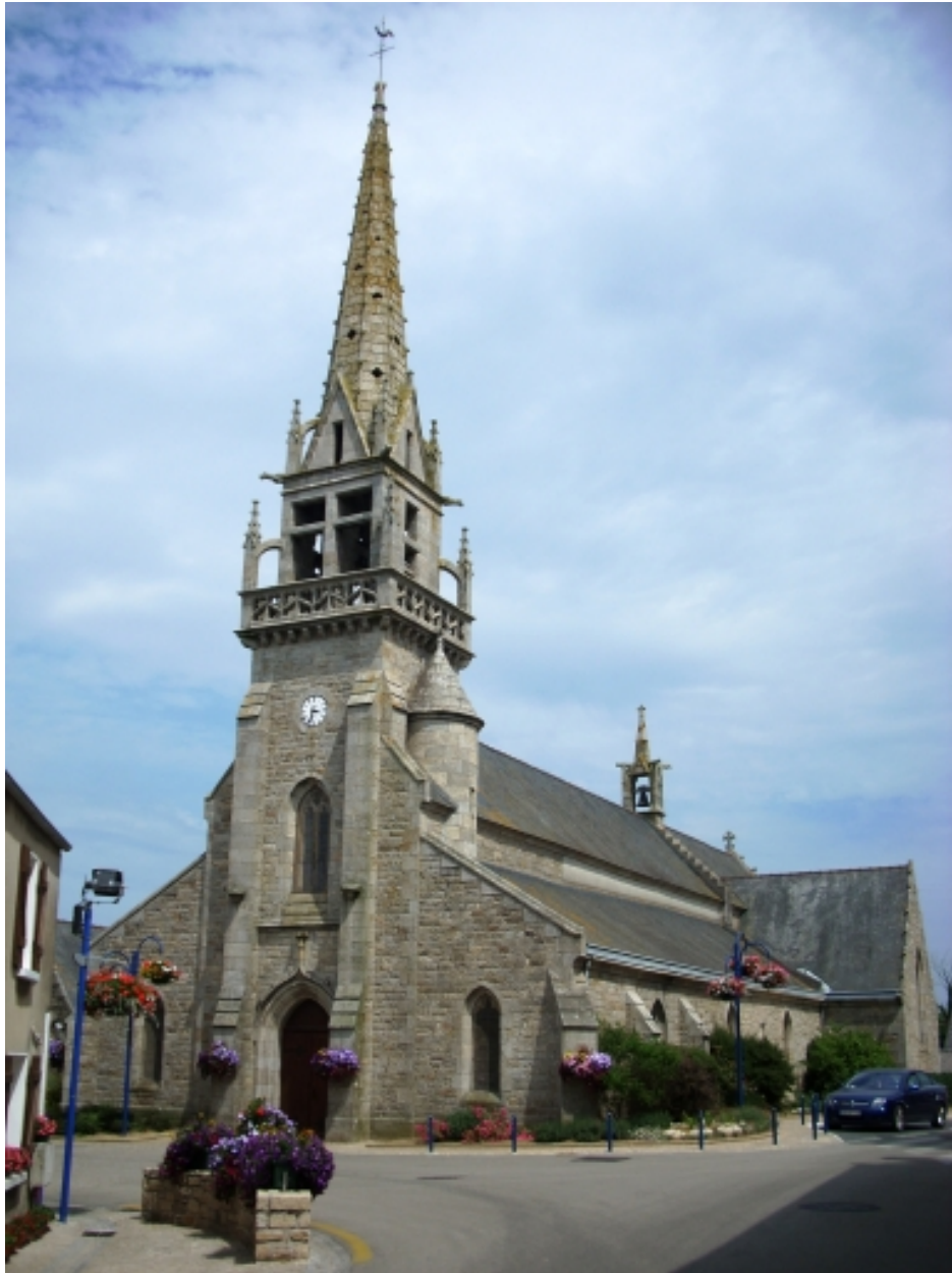
Santec, église paroissiale Saint-Adrien : vue générale sud-ouest