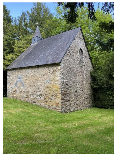
Vue sud-ouest IVR53_20255611135NUCA