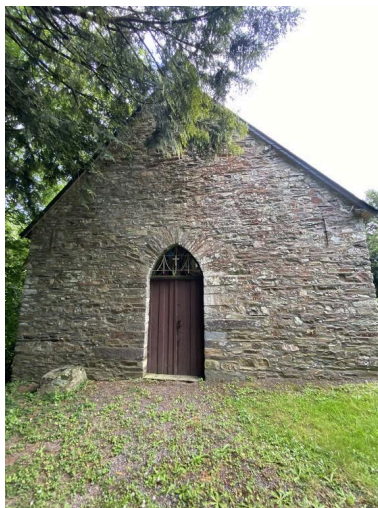
Vue nord