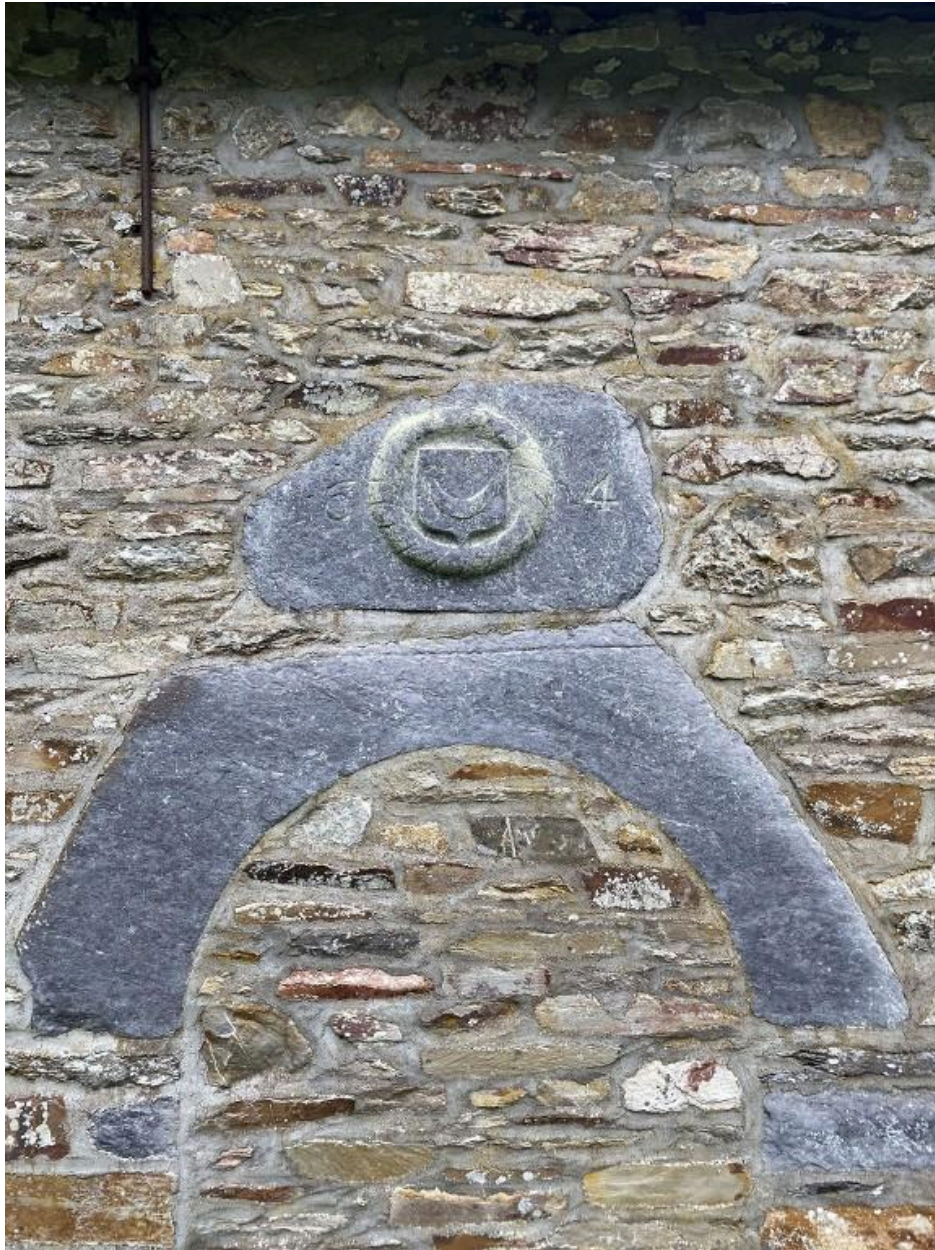
Porte murée, vue ouest