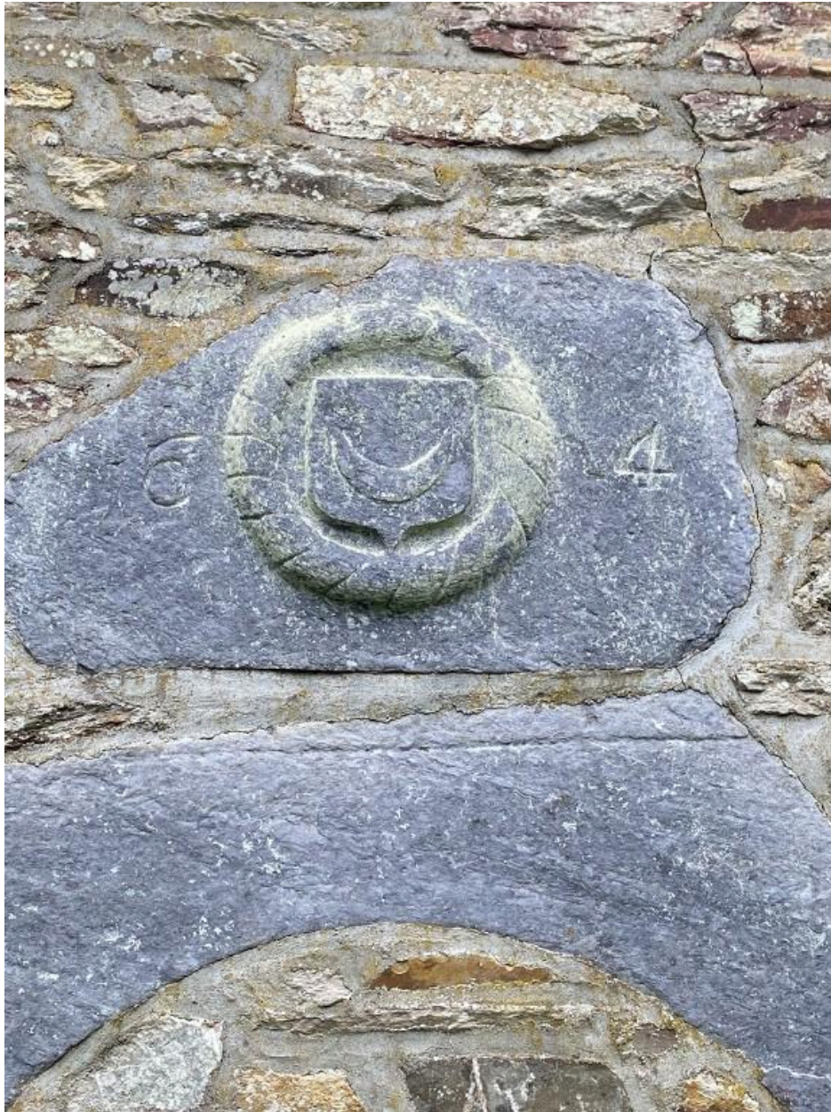
Linteau porte murée, vue ouest