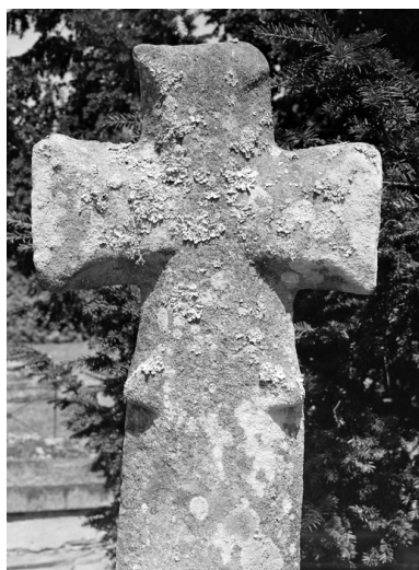
Chapelle, la croix 2 : élévation est (état en 1983) IVR53_19835600271X