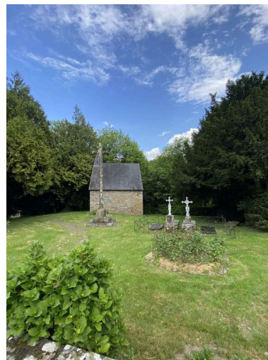
Vue générale ouest IVR53_20255611134NUCA