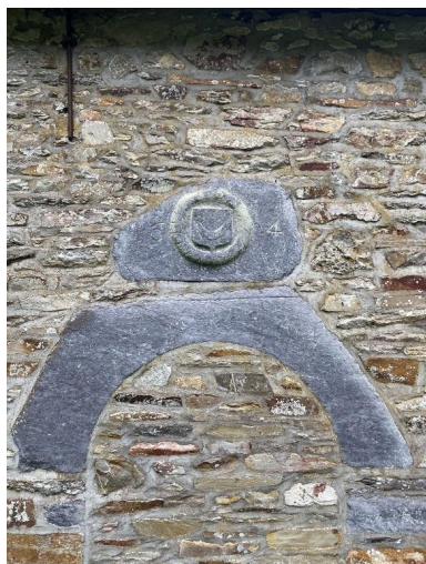
Porte murée, vue ouest