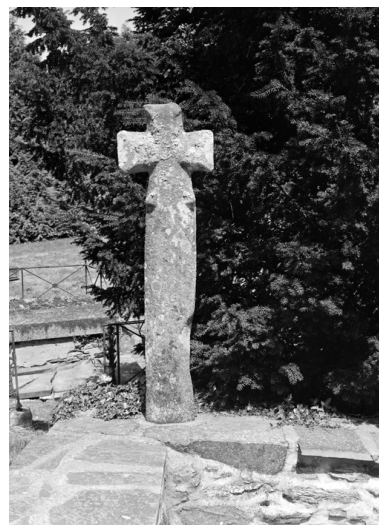
Chapelle, la croix 2 : élévation est (état en 1983)