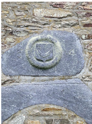
Linteau porte murée, vue ouest IVR53_20255611132NUCA