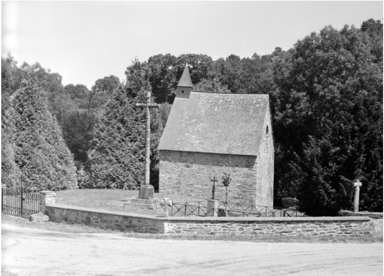
Chapelle : élévation sud (état en 1983)