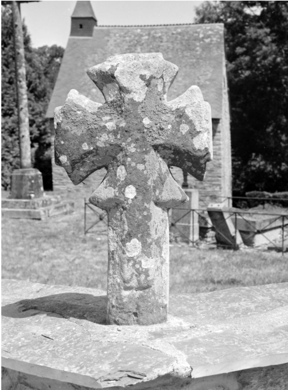
Chapelle, la croix 1 : élévation sud (état en 1983)