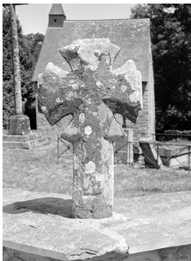
Chapelle, la croix 1 : élévation sud (état en 1983) IVR53_19835600269X