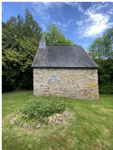
Vue ouest