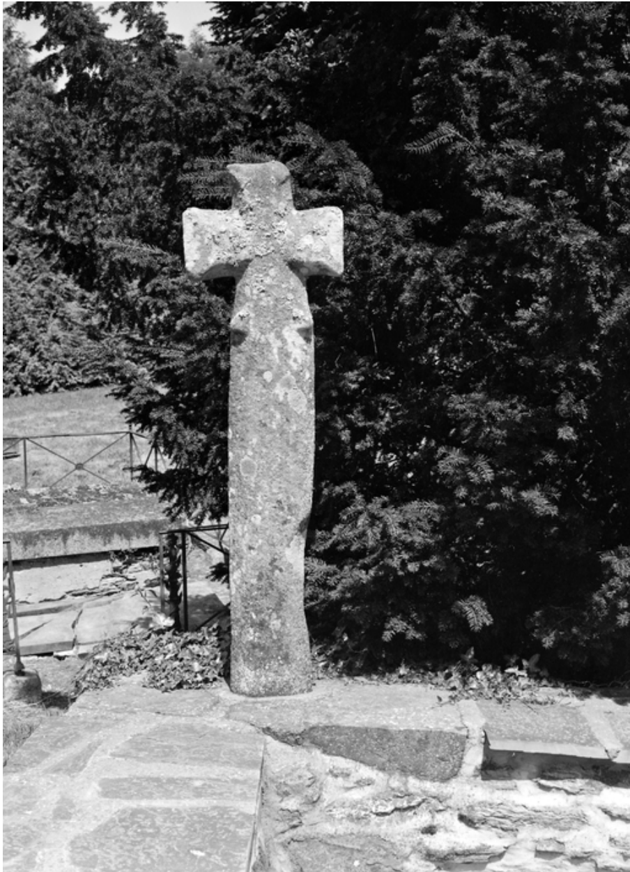
Chapelle, la croix 2 : élévation est (état en 1983)