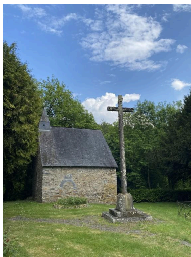
Vue nord-ouest IVR53_20255611129NUCA