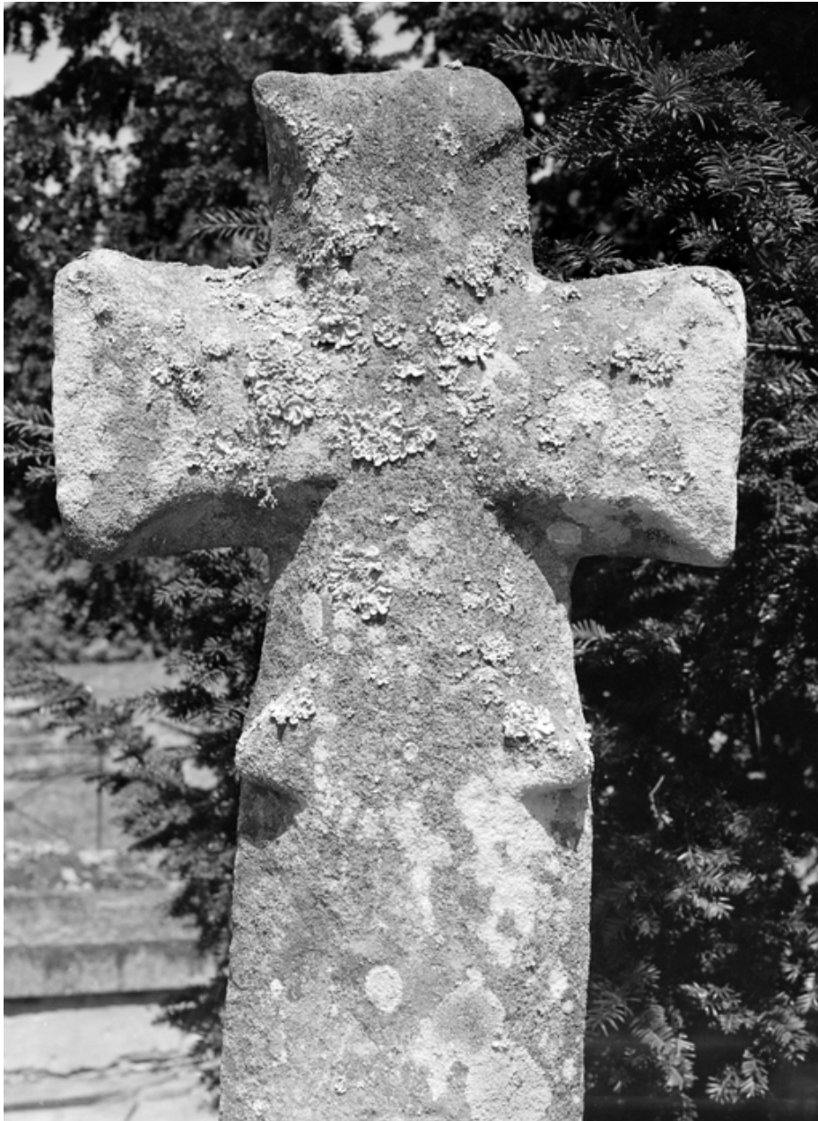
Chapelle, la croix 2 : élévation est (état en 1983)