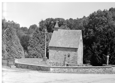
Chapelle : élévation sud (état en 1983) IVR53_19835600268X