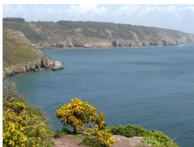
Partie septentrionale de l'anse Saint-Nicolas IVR53_20082908302NUCA