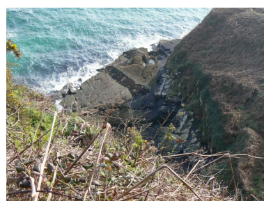
Cale Saint-Nicolas IVR53_20072908902NUCA