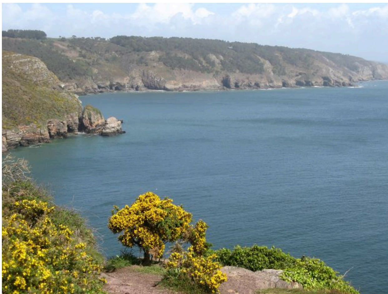
Partie septentrionale de l'anse Saint-Nicolas