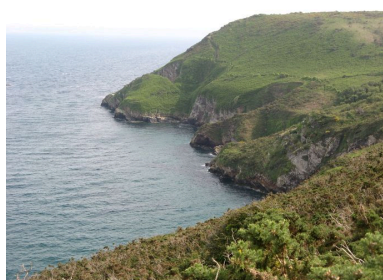
Partie méridionale de l'anse Saint-Nicolas avec la cale Saint-Nicolas IVR53_20082908342NUCA