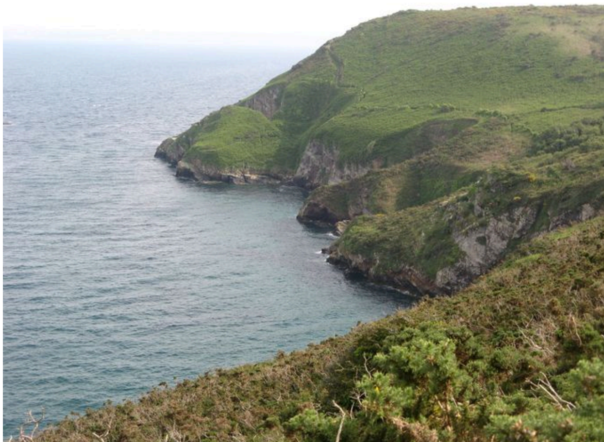
Partie méridionale de l'anse Saint-Nicolas avec la cale Saint-Nicolas