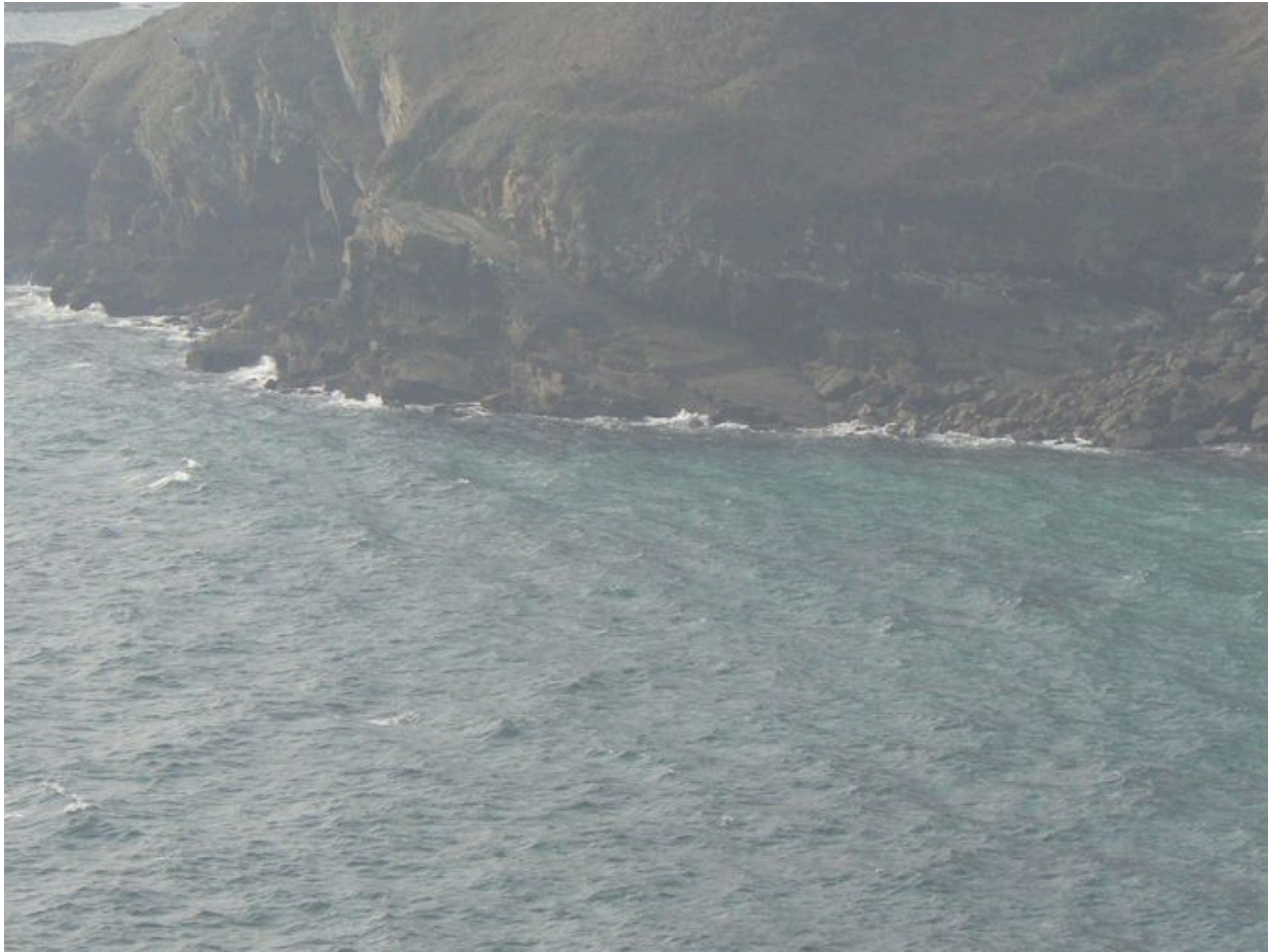
Cale Saint-Nicolas à marée basse