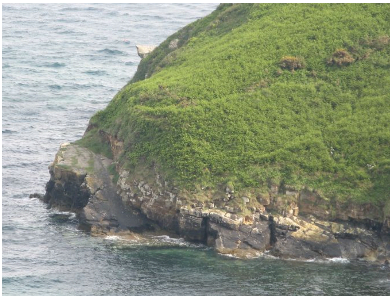
Vue générale de la cale Saint-Nicolas